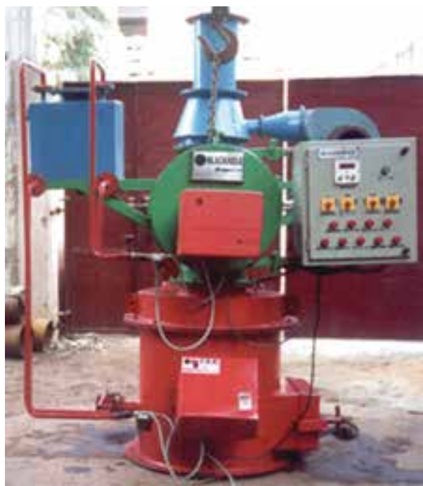
تصویر ۲۰-۸ انواع دستگاه لاشه‌سوز