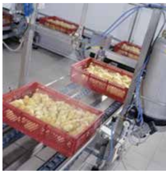
تصویر ۸-۶- اسپری در سالن