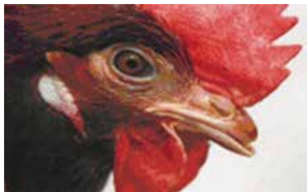
تصویر ۱۰-۸- مرغ نک چینی شده

۹- در سنین بالای ۱۰ هفتگی مطمئن شوید که نک چینی با برنامه های واکسیناسیون تداخل ننماید. ۱۰- در هوای گرم و در زمانی که خونریزی زیاد است مقدار ویتامین K جیره را افزایش دهید. ۱۱- توجه داشته باشید که داروهای سولفوردار سبب طولانی شدن زمان خونریزی بعد از نک چینی می شوند. ۱۲- در جوجه های گوشتی، چیدن نک به مقدار یک سوم کل نک کافی است. در مرغ تخم گذار مقدار بیش تری از نک برداشته می شود. از آنجایی که این پرندگان به مدت ۱/۵ سال نگهداری می شوند، کنترل طول نک آنها در اندازه ی مناسب کار مشکلی است.