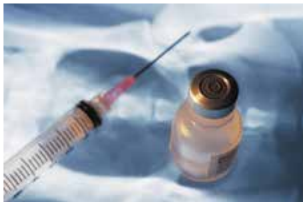
تصویر ۲-۸- تزریق واکسن با سرنگ معمولی

ب- قطره چکان: برای تلقیح واکسن به صورت قطره‌ای چشمی، از قطره چکان استفاده می‌شود. قطره چکان ساختمان ساده‌ای دارد و از مخزن شیشه‌ای یا فلزی و سوزن تشکیل شده است. در این روش پرنده دُز کامل واکسن را دریافت می‌کند ولی بسیار وقت گیر است. از این روش در جلوگیری از برخی بیماری‌ها نظیر نیوکاسل و گامبرو استفاده می‌شود.