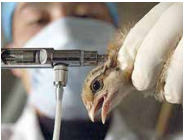
تصویر ۱-۸- سرنگ خودکار