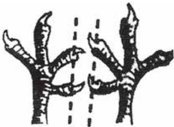
تصویر ۱۱-۸- قطع ناخن انگشت پای خروس گله ی مادر

برای قطع نک انگشت می توانید از دستگاه های نک چین استفاده کنید، ولی این عمل به وسیله ی قیچی سریع تر انجام می شود. در جوجه خروس های گله ی مادر دو انگشت داخلی و پستی را قطع کنید.