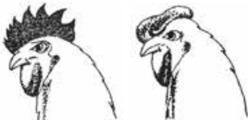
تاج قطع نشده

همراه با رشد پرنده، اندازه‌ی تاج قطع شده هم‌چنان کوچک باقی می‌ماند و سطح بالایی آن گرد می‌شود (تصویر ۸-۱۴).