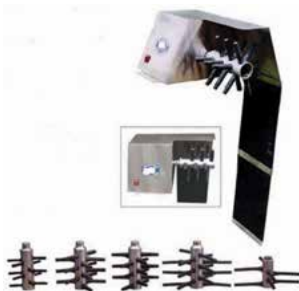
تصویر ۱۸-۸ - انگشتانه‌ی پلاستیکی و محور دَوَران‌کننده در دستگاه پَرکن

انگشتانه‌های دستگاه را دائماً باید بازدید و کنترل کنید و در صورت فرسودگی آن‌ها را تعویض نمایید.