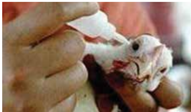
تصویر ۳-۸- واکسیناسیون به روش قطره چشمی

ب- قطره چکان: برای تلقیح واکسن به صورت قطره‌ای چشمی، از قطره چکان استفاده می‌شود. قطره چکان ساختمان ساده‌ای دارد و از مخزن شیشه‌ای یا فلزی و سوزن تشکیل شده است. در این روش پرنده دُز کامل واکسن را دریافت می‌کند ولی بسیار وقت گیر است. از این روش در جلوگیری از برخی بیماری‌ها نظیر نیوکاسل و گامبرو استفاده می‌شود.