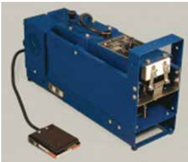
تصویر ۷-۸- انواع دستگاه نک چینی

ب - نک سوزی با تیغه‌ی داغ: در این روش به جای قطع نک، جلوی نک بالایی را می‌سوزانند. انتهای نک بالایی به تدریج می‌افتد ولی نک پایینی طبیعی خواهد بود. به این ترتیب جوجه می‌تواند بدون حساسیت نک بزند و دان مصرف نماید.