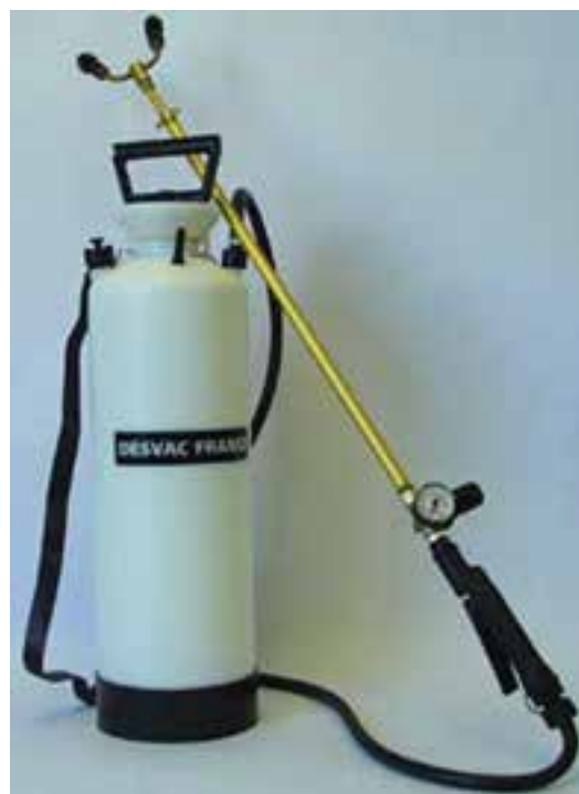
تصویر ۴-۸- انواع دستگاه اسپری

استفاده از این روش از بروز بعضی از بیماری‌ها نظیر برونشیت جلوگیری می‌کند.