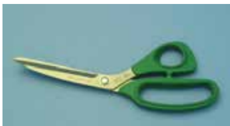
تصویر ۱۶-۸- انواع قیچی قطع تاج