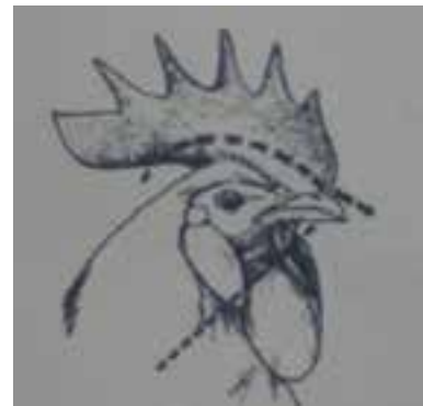
تصویر ۱۵-۸- قطع تاج و ریش

اما ریش در یک روزگی بسیار سخت و کوچک و قطع آن غیر ممکن است. این زوائد گوشتی را در برخی موارد در خروس‌های گله‌ی مادر می‌چینند ولی در مرغ‌ها قطع نمی‌شود. ریش جوجه خروس‌ها را در ۴ تا ۶ هفتگی، حتی‌الامکان نزدیک به گردن، ببرید.