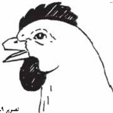
تصویر ۹-۸- نِک چینی مناسب

۱۵- در مرغ ۱۸ هفته‌ای از صفحه‌ی راهنما استفاده نمی‌شود. با یک دست پاهای مرغ را بگیرید و با دست دیگر سر مرغ را بین انگشت شست و نشانه‌ی خود قرار دهید. در این حالت پشت سر مرغ بین انگشتان شما باید شکل ۷ پیدا کند. با فشار دادن پدال پا، تیغه‌ی برنده را پایین بیاورید و نِک را قطع کنید.