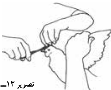
تصویر ۸-۱۳- قطع تاج

تاج جوجه‌ها را نباید در مناطق گرم بچینید زیرا تاج در دفع حرارت اضافی بدن مؤثر است.