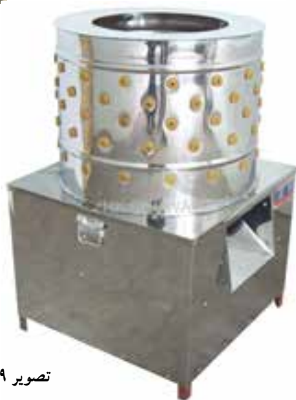
تصویر ۱۹-۸ انواع دستگاه های پرکن