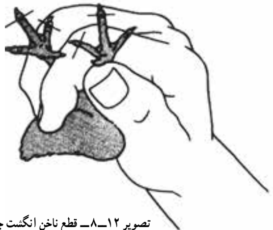
تصویر ۸-۱۲- قطع ناخن انگشت جوجه

هنگام جنگیدن خروس‌ها تاج آن‌ها زخمی نشود، بینایی بهتر باشد و صدمات ناشی از سرما کاهش یابد.