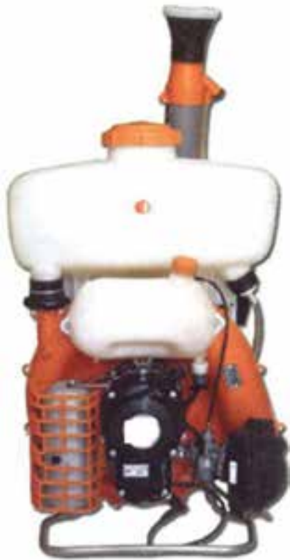
تصویر ۶-۶ - سم پاش پشتی موتوری

کیفیت سم پاشی در این سم پاش ها به دلیل بسیار ریز شدن قطرات بهتر است و از چکیدن مایع سم نیز جلوگیری می شود.