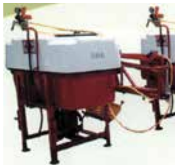
شکل ۱-۶- انواع دستگاه سم پاش