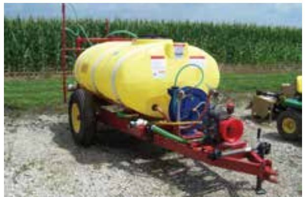
تصویر ۸-۶- سم پاش پشت تراکتوری

این سم پاش، بر روی شاسی سوارند و به تراکتور متصل می شوند. ظرفیت مخزن ۱۵۰ تا ۵۰۰ لیتر است (تصویر ۸-۶).