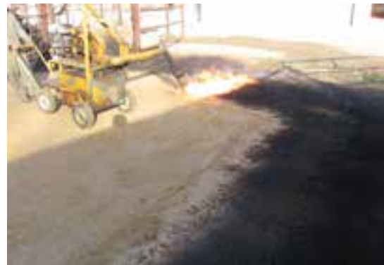
تصویر ۱۰-۶- شعله افکنی محوطه

۶- دقت کنید کارگری که با دستگاه کار می کند مسائل ایمنی را رعایت نماید (تصویر ۱۰-۶).