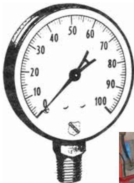
تصویر ۳-۶- فشارسنج

لوله های فلزی و لاستیکی انتقال: این لوله ها سم را در دستگاه سم پاش انتقال می دهند. در انتخاب لوله ها دقت کنید. زیرا فشار سم در قسمت های مختلف دستگاه متفاوت است و آن ها باید به اندازه ای قوی باشند که بتوانند در مقابل فشار زیاد مقاومت کنند.