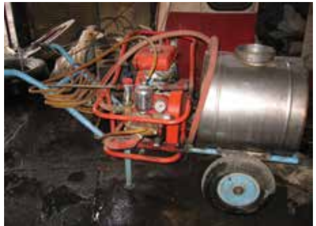
تصویر ۷-۶- سم پاش چرخ دار موتوری

۵- در صورتی که مدت زمان طولانی نیازی به استفاده از سم پاش ندارید، ۱ تا ۲ سانتی متر روغن موتور به درون سیلندر بریزید. لازم است قبل از گذاردن شمع، یک بار استارت را بکشید و رها کنید. به این ترتیب تمام سطح سیلندر روغن کاری می شود. هم چنین افشانک ها و فیلترها را باز کنید و در مکانی مطمئن قرار دهید.