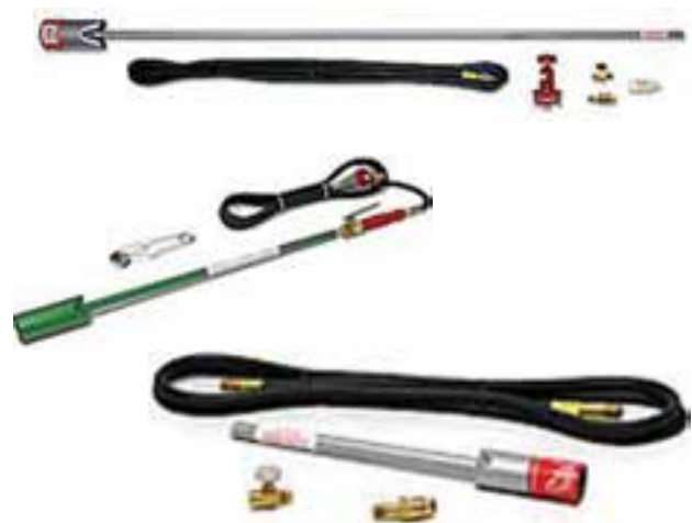
تصویر ۴-۶ - انواع لوله‌ی حامل افشانک و افشانک

افشانک: ریز و پخش کردن سم وظیفه‌ی اصلی افشانک است. افشانک قسمت مهم دستگاه‌های سم‌پاش محسوب می‌شود و از چهار قسمت اصلی بدنه، درپوش، نُک و صافی تشکیل می‌شود. نُک قابل تعویض است و سم را با ظرفیت‌های متفاوتی و با اشکال گوناگون پخش می‌کند. (تصاویر ۴-۶ و ۵-۶)