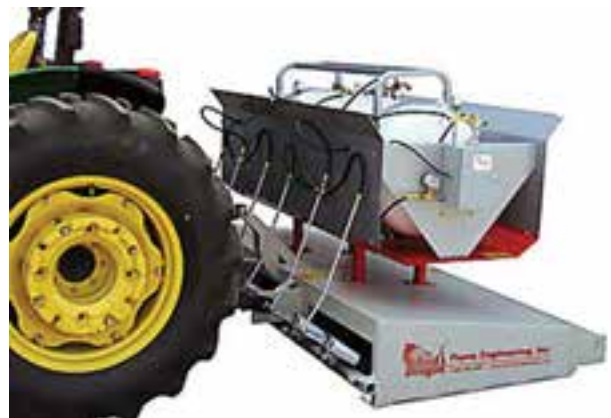
تصویر ۹-۶- انواع شعله افکن