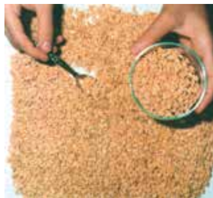
شکل ۲۰-۳- بذور عاری از علف هرز

الف) استفاده از بذور عاری از بذور علف هرز (شکل ۲۰-۳):