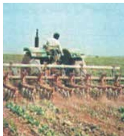
شکل ۲۲-۳- وجین علف‌های هرز با استفاده از ماشین مرکب سله‌شکنی و وجین‌کن

۳- تراکتور را طوری وارد مزرعه کنید که چرخ‌های آن در بین ردیف‌ها قرار گیرد و به گیاه اصلی صدمه وارد نسازد. تراکتور را به طور اصولی و صحیح و با سرعت مناسب، در مزرعه به حرکت درآورید تا عمل سله‌شکنی و وجین انجام شود (شکل ۲۲-۳). گزارش کار این فعالیت‌ها را به مربی خود تحویل دهید.