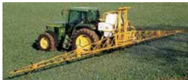
شکل ۳۱-۳- سم پاش پشت تراکتوری بوم دار

لازم است سالیانه حداقل یک بار سم پاش را، چنان که توضیح داده شد، برای تنظیم میزان خروجی، کالیبره نمایید. از این نوع سم پاش در ایران برای مبارزه با علف های هرز مزارع بزرگ استفاده می شود (شکل ۳۱-۳).