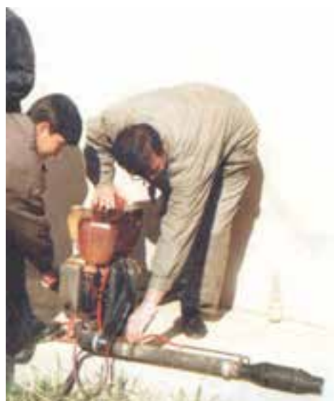
شکل ۲۵-۳- آماده سازی و روشن کردن شعله افکن