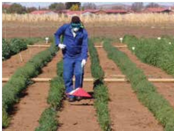
شکل ۲۳-۳- کنترل علف‌های هرز با استفاده از گرما

کنترل فیزیکی علف‌های هرز از گرما و آتش استفاده می‌شود. (شکل ۲۳-۳).