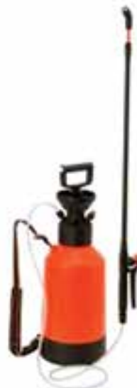
شکل ۲۶-۳- سم پاش استوانه ای پشتی ساده

کار، سم پاشی کنید. نکته مهم این است که در جریان سم پاشی با این سم پاش، باید تلمبه زنی را به صورت یک نواخت تکرار کنید تا فشار افت نکند (شکل ۲۷-۳).