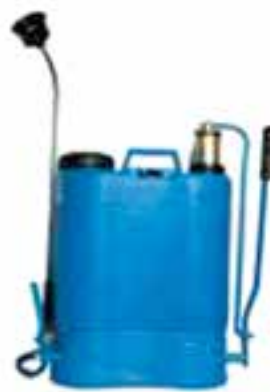
شکل ۲۷-۳- سم پاش کتابی پستی اهرمی