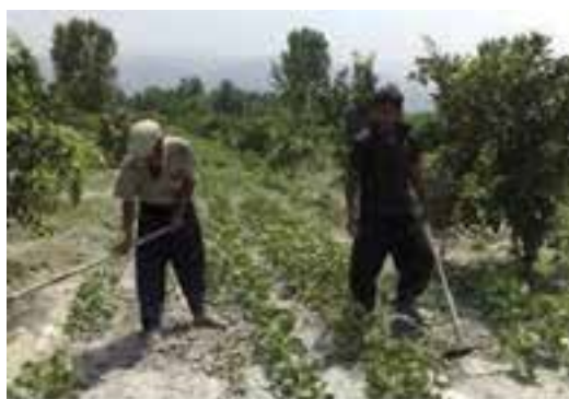
شکل ۲۱-۳ وجین علف های هرز با استفاده از وسایل دستی

۴- علف های هرز را از محصول اصلی تشخیص دهید و آنها را با استفاده از ابزار، از خاک خارج کنید (شکل ۲۱-۳).