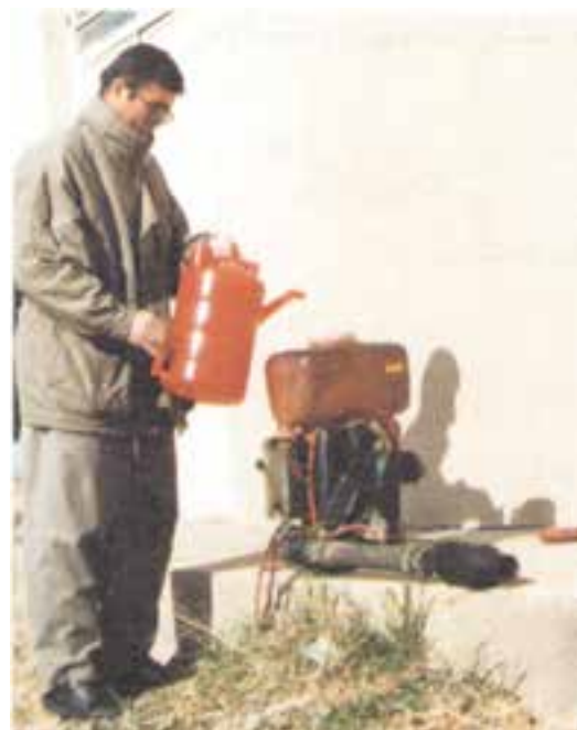
شکل ۲۴-۳- پر کردن مخزن شعله افکن