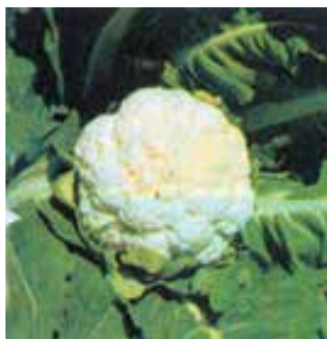
شکل ۸-۱- گل کلم

پاره‌ای از سبزیجات مانند کرفس، گل کلم، ریواس، مارچوبه و ... باید قبل از مصرف سفید گردند تا از نظر طعم و لطافت قابل استفاده شوند. برای این منظور باید به طرق مختلف از رسیدن نور خورشید به قسمت مورد نظر جلوگیری نمود که این عمل را «سفید کردن» می‌گویند (شکل‌های ۸-۱ و ۸-۲).