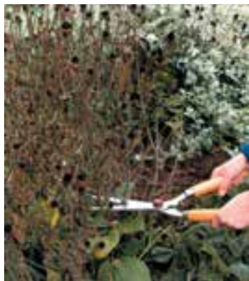
شکل ۵-۹- ج