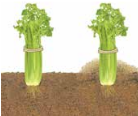
شکل ۳- ۸