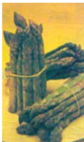
شکل ۸-۲- مارچوبه