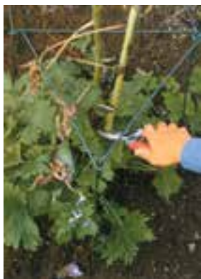
شکل ۵-۹- الف

– عمل سربرداری در بعضی از گل‌های زینتی و آپارتمانی نیز که در سال یک شاخه گل دهنده تولید می‌کنند مرسوم است. در این گیاهان به محض مشاهده ساقه گل دهنده جدید بلافاصله ساقه سال قبلی را قطع می‌کنند. مانند: الف) فلوکس