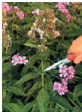
شکل ۵-۹- ب