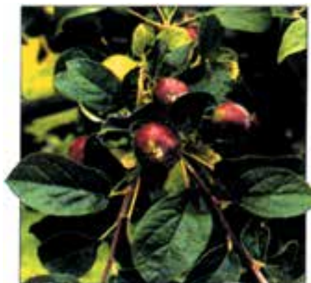
شکل ۳-۵۶ - ب