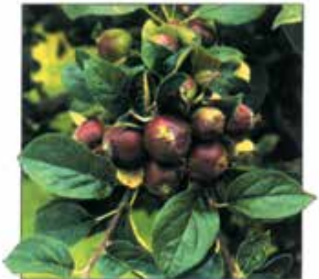
شکل ۳-۵۶ - الف

در شکل ۳-۵۵ تنک گل، در شکل‌های ۳-۵۶ الف و ب میوه‌های روی یک شاخه درخت سیب قبل و بعد از تنک و نیز در شکل‌های ۳-۵۷ الف و ب میوه‌های روی یک شاخه آلو قبل و بعد از تنک مشاهده می‌شوند.