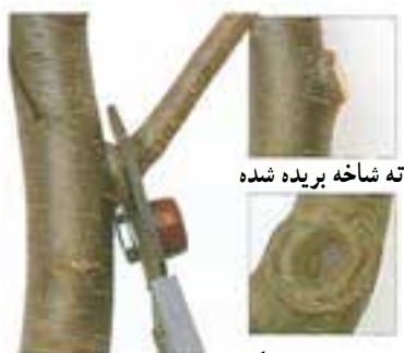
ترمیم محل بریدگی