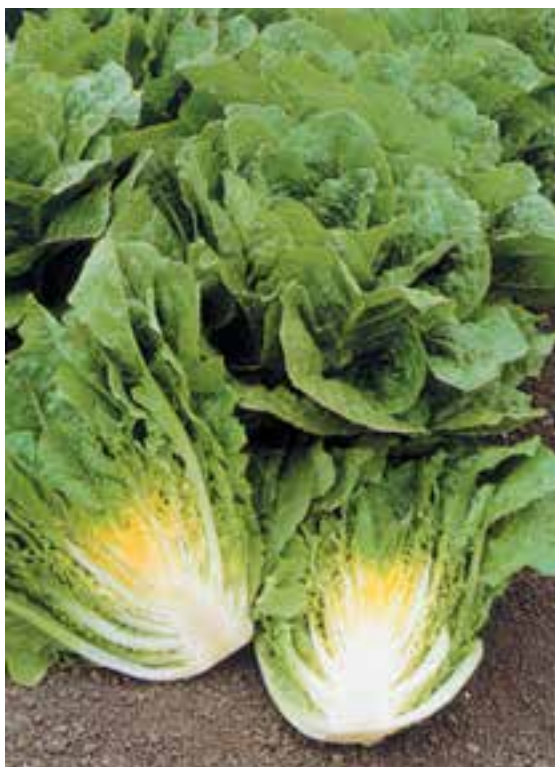
شکل ۶۵- ۱

– کاهوی رد سیلز ۱ : دارای سر بزرگ با برگهای خارجی بسیار جذاب زرشکی رنگ می باشد. این کاهو رنگ خود را در هوای گرم نیز بخوبی حفظ می کند و مناسب برای پرورش در باغچه خانه و مزرعه می باشد (شکل ۶۴- ۱).