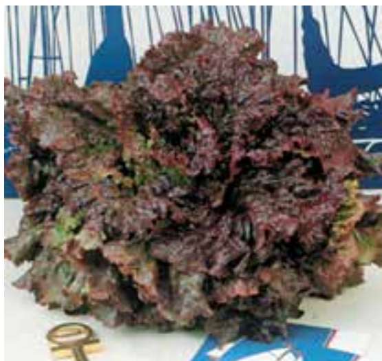
شکل ۶۴- ۱

– کاهوی رد سیلز ۱ : دارای سر بزرگ با برگهای خارجی بسیار جذاب زرشکی رنگ می باشد. این کاهو رنگ خود را در هوای گرم نیز بخوبی حفظ می کند و مناسب برای پرورش در باغچه خانه و مزرعه می باشد (شکل ۶۴- ۱).