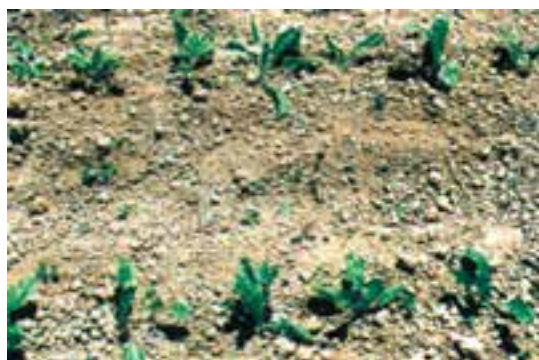
شکل ۱۷-۲ - مزرعه چغندر قند بعد از عملیات تنک اولیه

- در شکل (۱۸-۲) یک مزرعه چغندر قند را مشاهده