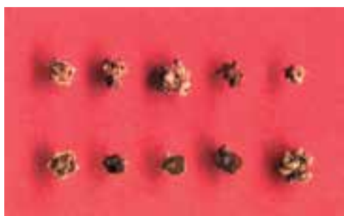
شکل ۲-۹ - بذور چند جوانه‌ای معمولی

ج - استفاده از بذور چند جوانه‌ای فعالیت عملی ۳: از یک قطعه زمین آماده شده برای کاشت، ۲۰ مترمربع جدا کنید. مقداری بذر چغندر قند معمولی به صورت ردیفی در این زمین بکارید. پس از سبز شدن مشاهده می‌کنید در محل کاشت از هر بذر به جای یک بوته چند بوته روییده است. چرا؟ (شکل ۲-۸)