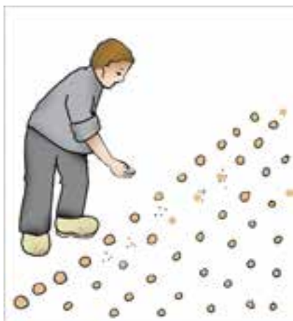
شکل ۱۰-۲- بذرکاری کپه‌ای