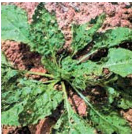
شکل ۱۲-۲- خسارت کک‌های نسل جدید