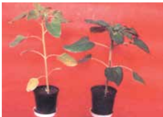
شکل ۱۶-۵- (چپ) ساقه نازک به دلیل کمبود ازت - (راست) ازت کافی