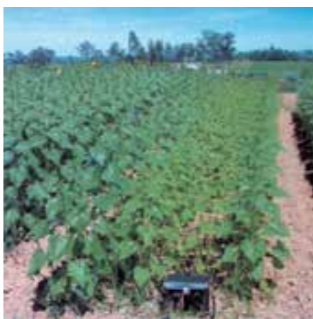
شکل ۱۲-۵- کمبود ازت در آفتابگردان