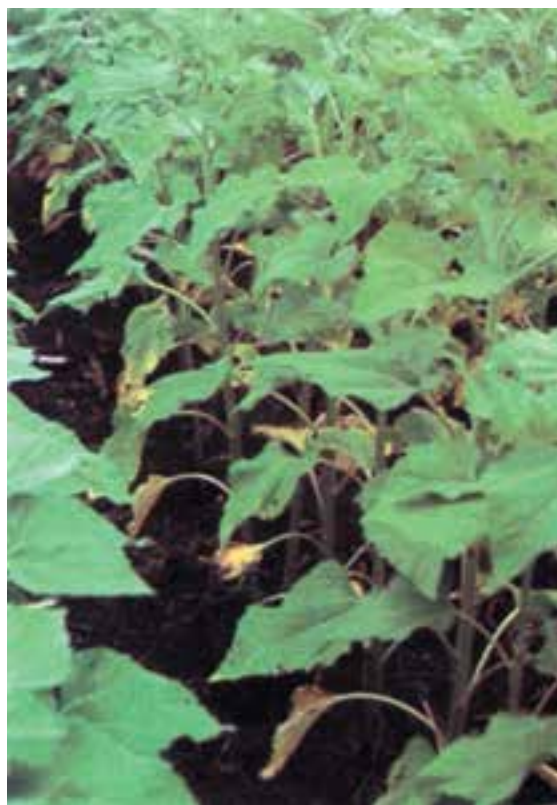
شکل ۱۴-۵- رنگ پریدگی برگهای پایین بر اثر کمبود ازت