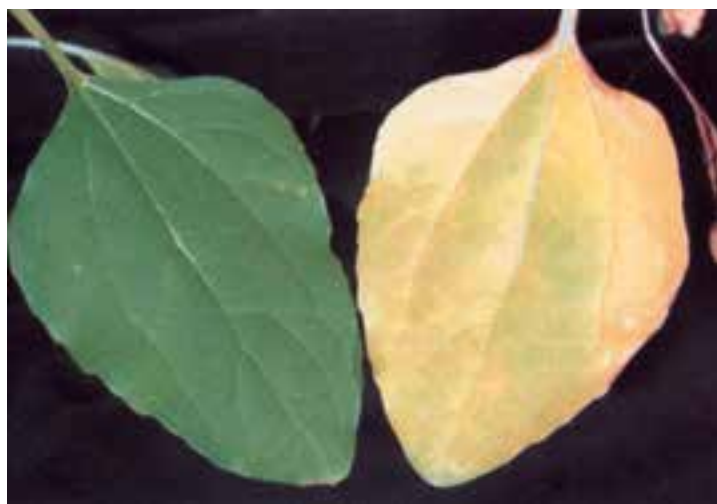
شکل ۱۵-۵- (راست) ازت غیرکافی - (چپ) ازت کافی در برگهای پایین آفتابگردان