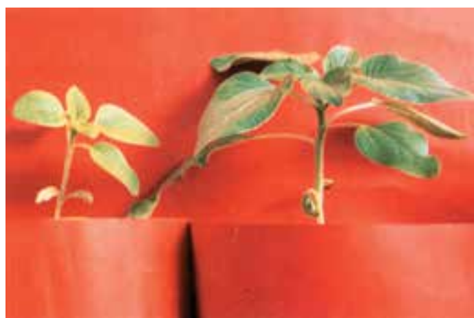
شکل ۱۱-۵- (راست) دارای ازت کافی در محلول غذایی (چپ) کمبود ازت در محلول غذایی