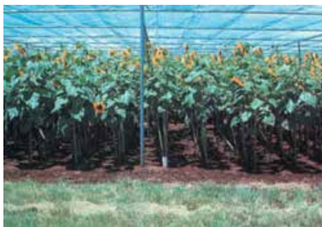
شکل ۱۳-۵- آفتابگردان در محیط بدون ازت - (چپ) مصرف ۱۸۰ کیلوگرم در هکتار ازت