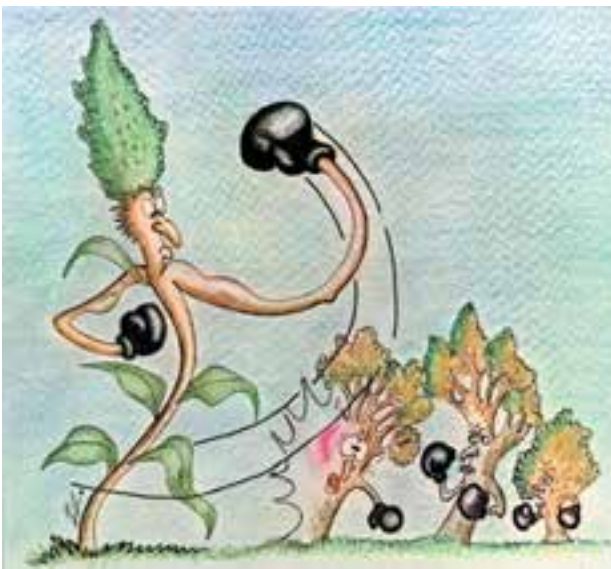
شکل ۴-۴- غلبه علف هرز بر بعضی از گیاهان

۴- افزایش علفهای هرز: در اثر کشت تک محصولی، علفهای هرز گیاهان میزبان به نحو مؤثری افزایش می یابد. در حالی که با تغییر گیاه میزبان شرایط مناسب رشد علفهای هرز نیز از بین خواهد رفت مثلاً رشد و توسعه یولاف در کشت ممتد گندم (مثال دیگری را شما ارائه نمایید) (شکل ۴-۴).