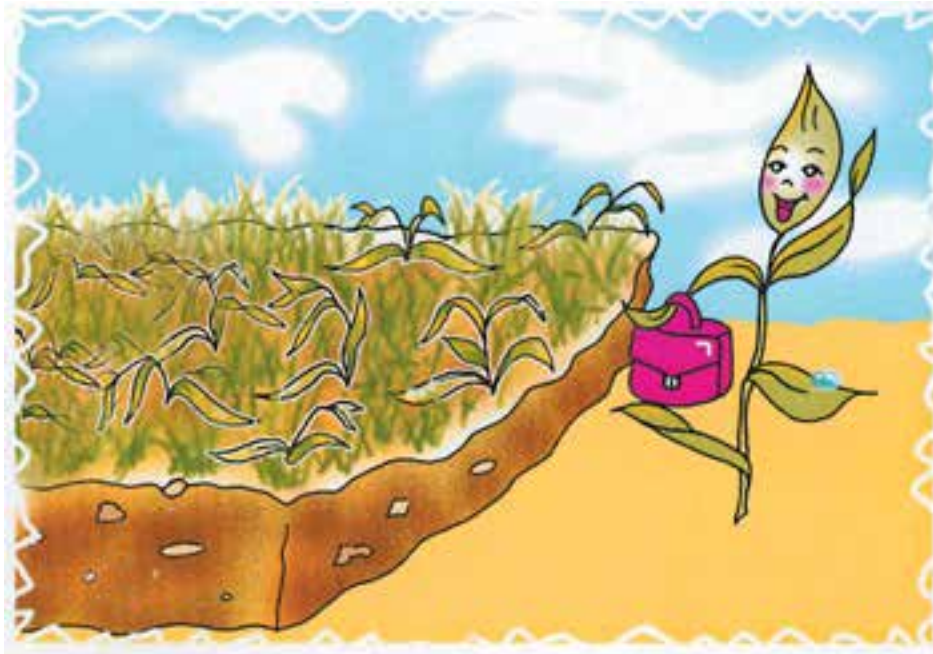
شکل ۲-۴- استقبال زمین از گیاه جدید

در گذشته و در زراعت سنتی، کشت گیاهان در یک زمین زراعی به صورت پیاپی و ممتد انجام می‌شد مثلاً اگر برای مدت طولانی فقط کشت گندم یا در بعضی مناطق فقط کشت برنج و ... بر روی یک زمین صورت گیرد. این استفاده از یک نوع محصول، «زراعت یکطرفه» یا «تک محصولی» و یا