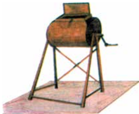
شکل ۴-۱۱ بشکه ضد عفونی بذور

زمان مناسب کاشت پنبه برحسب نوع خاک، شرایط اقلیمی، نوع رقم و نظام آیش بندی و تناوب زراعی متفاوت است. جوانه زنی و رویش سریع پنبه در زراعت آبی، موقعی است که دمای خاک در حالت گاورو در عمق ۲۰ سانتیمتری به مدت حداقل ۳-۵ روز متوالی ۱۸ C ثابت باشد. اما در زراعت دیم، رطوبت خاک و نظام بارندگی منطقه نیز عامل تعیین کننده ای است. به عبارت دیگر، با رعایت سایر شرایط کاشت، زمانی که معدل درجه حرارت روزانه منطقه به حداقل ۱۵-۱۴ درجه