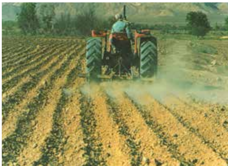
شکل ۱۷-۴- ایجاد شیار یکنواخت و دقیق، در توزیع مناسب آب بسیار مؤثر خواهد بود.

هر چند مطلوب آن است که عمل کاشت با ماشینهای ردیف‌کار دقیق صورت گیرد، اما در برخی مناطق و شرایط، از جمله کمبود