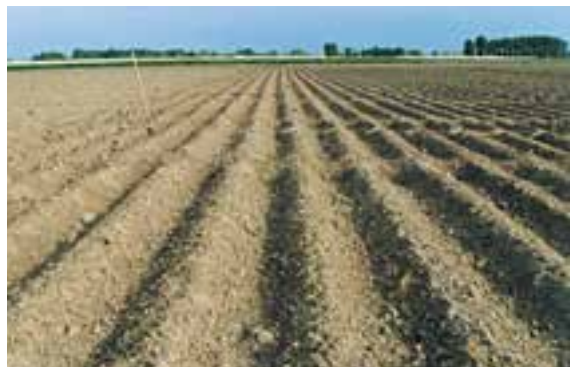
شکل ۱۲-۴ - پس از بذریابی و زیرخاک کردن آنها اقدام به ایجاد شیارهای آبیاری مزرعه می‌نمایند.

که سطح پشته‌ها از هر طرف حداقل تا فاصله ۲۰ سانتیمتری از لبه جوی به خوبی نم بکشد. پس از گاورو شدن زمین، بذور را که معمولاً خیس‌انده شده‌اند، به تعداد ۵-۳ عدد در گوده‌ای به عمق مناسب در سطح پشته به فاصله ۱۰-۷ سانتیمتر از لبه جوی و ۳۰-۲۰ سانتیمتر از گوده قبلی با دست می‌کارند.