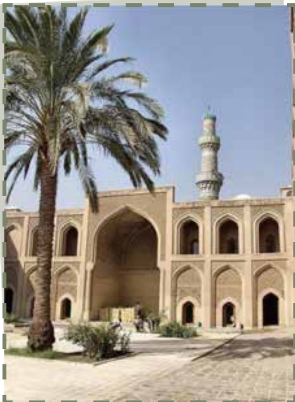
مدرسه مستنصریه بغداد

مدارس : هر چند، مساجد همواره نقش مهم خود به عنوان یک مرکز آموزشی را حفظ کرده‌اند، اما در سده‌های اولیه پیدایش تمدن اسلامی، رفته رفته، مدارس نیز شکل گرفتند. در این مدارس، علوم به صورت تخصصی آموزش داده می‌شد و فراگیران علوم، از امکاناتی همچون کمک هزینه تحصیلی و خوابگاه و غذا و دیگر امکانات رفاهی برخوردار بودند. این مدارس، غالباً از معماری‌های زیبا و تزیینات و اثاثیه مرغوب برخوردار بودند. از مهم‌ترین مدارس جهان اسلام می‌توان به مدارس موجود در بغداد، ایران، شام، مصر، مغرب و اندلس اشاره کرد. مدرسه‌های مهم بغداد یکی نظامیه و دیگری مستنصریه بود که اولی را وزیر دانشمند سلجوقیان، خواجه نظام‌الملک و دومی را خلیفه عباسی تأسیس کرد. نظام‌الملک نظیر این مدرسه را در شهرهای مختلف همچون نیشابور، اصفهان و بلخ که افراد دانشمند در آنها حضور داشتند نیز بنا کرد.