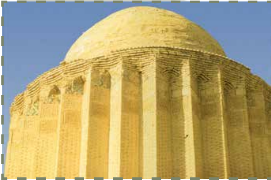
برج رصدخانه بسطام