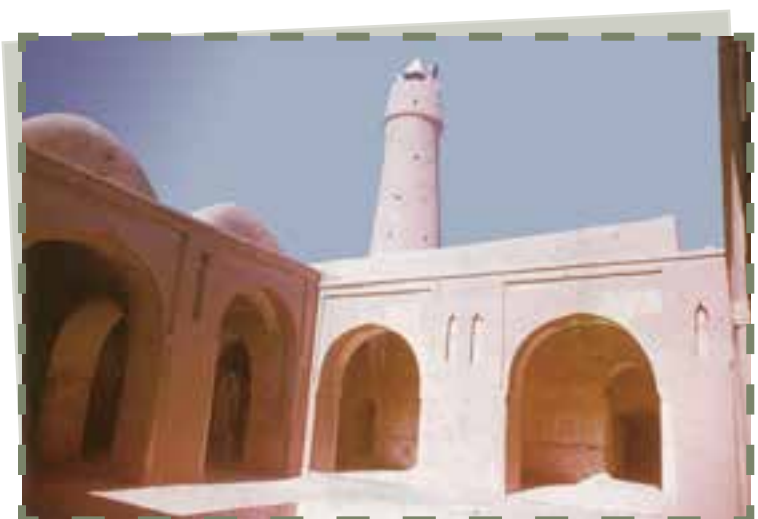
مسجد فهرج یزد