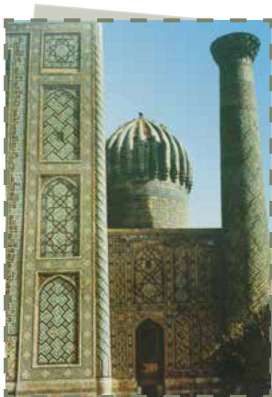
مدرسه شيرزاد سمرقند

مدارس : هر چند، مساجد همواره نقش مهم خود به عنوان یک مرکز آموزشی را حفظ کرده‌اند، اما در سده‌های اولیه پیدایش تمدن اسلامی، رفته رفته، مدارس نیز شکل گرفتند. در این مدارس، علوم به صورت تخصصی آموزش داده می‌شد و فراگیران علوم، از امکاناتی همچون کمک هزینه تحصیلی و خوابگاه و غذا و دیگر امکانات رفاهی برخوردار بودند. این مدارس، غالباً از معماری‌های زیبا و تزیینات و اثاثیه مرغوب برخوردار بودند. از مهم‌ترین مدارس جهان اسلام می‌توان به مدارس موجود در بغداد، ایران، شام، مصر، مغرب و اندلس اشاره کرد. مدرسه‌های مهم بغداد یکی نظامیه و دیگری مستنصریه بود که اولی را وزیر دانشمند سلجوقیان، خواجه نظام‌الملک و دومی را خلیفه عباسی تأسیس کرد. نظام‌الملک نظیر این مدرسه را در شهرهای مختلف همچون نیشابور، اصفهان و بلخ که افراد دانشمند در آنها حضور داشتند نیز بنا کرد.