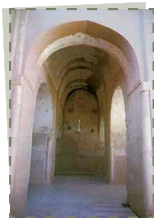
محراب مسجد فهرج