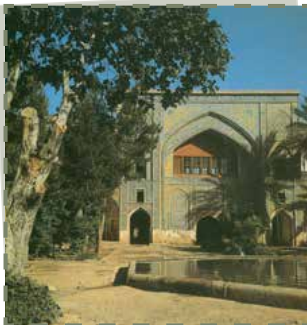
مدرسه ملاصدرا شیراز