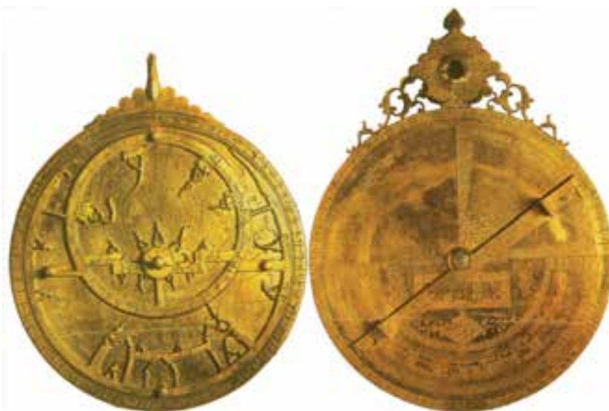
اسطرلاب (وسیله نجومی) که توسط دانشمندان مسلمان اختراع شده

بیمارستان‌ها: بیمارستان‌های جهان اسلام - که «مارستان» نامیده می‌شدند - ضمن درمان بیماران، مراکز