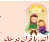
آنس با قرآن در خانه

درباره‌ی این که چگونه می‌توان با مشورت در کارها موفق و پیروز شد با اعضای خانواده‌ات گفت‌وگو کن.