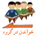
خواندن در گروه

وَمِنْ رَحْمَتِهِ جَعَلَ لَكُمُ اللَّيْلَ وَالنَّهَارَ لِتَسْكُنُوا فِيهِ وَلِتَبْتَغُوا مِنْ فَضْلِهِ وَلِعَلَّكُمْ تَشْكُرُونَ ﴿٧٣﴾ وَ يَوْمَ يُنَادِيهِمْ فَيَقُولُ أَيْنَ شُرَكَائِيَ الَّذِينَ كُنْتُمْ تَزْعُمُونَ ﴿٧٤﴾ وَ نَزَعْنَا مِنْ كُلِّ أُمَّةٍ شَهِيدًا فَقُلْنَا هَاتُوا بُرْهَانَكُمْ فَعَلِمُوا أَنَّ الْحَقَّ لِلَّهِ وَ ضَلَّ عَنْهُمْ مَا كَانُوا يَفْتَرُونَ ﴿٧٥﴾ إِنَّ قَارُونَ كَانَ مِنْ قَوْمِ مُوسَى فَبَغَى عَلَيْهِمْ وَ آتَيْنَاهُ مِنَ الْكُنُوزِ مَا إِنَّ مَفَاتِحَهُ لَتَنُوءَ بِالْعُصْبَةِ أُولَى الْقُوَّةِ إِذْ قَالَ لَهُ قَوْمُهُ لَا تَفْرَحْ إِنَّ اللَّهَ لَا يُحِبُّ الْفَرِحِينَ ﴿٧٦﴾ وَ ابْتَغِ فِي مَا آتَاكَ اللَّهُ الدَّارَ الْآخِرَةَ وَ لَا تَنْسَ نَصِيبَكَ مِنَ الدُّنْيَا وَ أَحْسِنْ كَمَا أَحْسَنَ اللَّهُ إِلَيْكَ وَ لَا تَبْغِ الْفُسَادَ فِي الْأَرْضِ إِنَّ اللَّهَ لَا يُحِبُّ الْمُفْسِدِينَ ﴿٧٧﴾