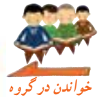
خواندن در گروه

بِسْمِ اللَّهِ الرَّحْمَنِ الرَّحِيمِ وَ الْعَادِيَاتِ ضَبْحًا ۱ فَاَلْمُورِيَّاتِ قَدْحًا ۲ فَاَلْمُغِيرَاتِ صُبْحًا ۳ فَاتَرْنَ بِهِي نَقْعًا ۴ فَوَسَطْنَ بِهِي جَمْعًا ۵ اِنَّ الْاِنْسَانَ لِرَبِّهِ لَكَنُودٌ ۶ وَ اِنَّهُ عَلٰى ذٰلِكَ لَشَهِيدٌ ۷ وَ اِنَّهُ لِحُبِّ الْخَيْرِ لَشَدِيدٌ ۸ اَفَلَا يَعْلَمُ اِذَا بُعْثِرَ مَا فِى الْقُبُورِ ۹ وَ حُصِّلَ مَا فِى الصُّدُورِ ۱۰ اِنَّ رَبَّهُمْ بِهِمْ يَوْمَئِذٍ لَّخَبِيرٌ ۱۱