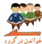
خواندن در گروه

فَوَيْلٌ لِلَّذِينَ يَكْتُوبُونَ الْكِتَابَ بِأَيْدِيهِمْ ثُمَّ يَقُولُونَ هَذَا مِنْ عِنْدِ اللَّهِ لِيَشْتَرُوا بِهِ ثَمَنًا قَلِيلًا فَوَيْلٌ لَهُمْ مِمَّا كَتَبَتْ أَيْدِيهِمْ وَوَيْلٌ لَهُمْ مِمَّا يَكْسِبُونَ ﴿٧٩﴾ وَقَالُوا لَنْ تَمَسَّنَا النَّارُ إِلَّا أَيَّامًا مَعْدُودَةً قُلْ اتَّخَذْتُمْ عِنْدَ اللَّهِ عَهْدًا فَلَنْ يُخْلِفَ اللَّهُ عَهْدَهُ أَمْ تَقُولُونَ عَلَى اللَّهِ مَا لَا تَعْلَمُونَ ﴿٨٠﴾ بَلَى مَنْ كَسَبَ سَيِّئَةً وَأَحَاطَتْ بِهِ خَطِيئَتُهُ فَأُولَٰئِكَ أَصْحَابُ النَّارِ هُمْ فِيهَا خَالِدُونَ ﴿٨١﴾ وَالَّذِينَ آمَنُوا وَعَمِلُوا الصَّالِحَاتِ أُولَٰئِكَ أَصْحَابُ الْجَنَّةِ هُمْ فِيهَا خَالِدُونَ ﴿٨٢﴾ وَإِذْ أَخَذْنَا مِيثَاقَ بَنِي إِسْرَٰئِيلَ لَا تَعْبُدُونَ إِلَّا اللَّهَ وَبِالْوَالِدَيْنِ إِحْسَانًا وَذِي الْقُرْبَىٰ وَالْيَتَامَىٰ وَالْمَسَاكِينِ وَقُولُوا لِلنَّاسِ حُسْنًا وَأَقِيمُوا الصَّلَاةَ وَآتُوا الزَّكَاةَ ثُمَّ تَوَلَّيْتُمْ إِلَّا قَلِيلًا مِّنْكُمْ وَأَنْتُمْ مُّعْرِضُونَ ﴿٨٣﴾