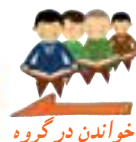
خواندن در گروه

فَمَا أُوتِيتُمْ مِنْ شَيْءٍ فَمَتَاعُ الْحَيَاةِ الدُّنْيَا وَمَا عِنْدَ اللَّهِ خَيْرٌ وَأَبْقَى لِلَّذِينَ ءَامَنُوا وَعَلَىٰ رَبِّهِمْ يَتَوَكَّلُونَ ﴿٣٦﴾ وَالَّذِينَ يَجْتَنِبُونَ كَبَائِرَ الْإِثْمِ وَالْفَوَاحِشَ وَإِذَا مَا غَضِبُوا هُمْ يَغْفِرُونَ ﴿٣٧﴾ وَالَّذِينَ اسْتَجَابُوا لِرَبِّهِمْ وَأَقَامُوا الصَّلَاةَ وَأَمْرُهُمْ شُورَىٰ بَيْنَهُمْ وَمِمَّا رَزَقْنَاهُمْ يُنفِقُونَ ﴿٣٨﴾ وَالَّذِينَ إِذَا أَصَابَهُمُ الْبَغْيُ هُمْ يَنْتَصِرُونَ ﴿٣٩﴾ وَجَزَاءُ سَيِّئَةٍ سَيِّئَةٌ مِّثْلُهَا فَمَنْ عَفَا وَأَصْلَحَ فَأَجْرُهُ عَلَى اللَّهِ إِنَّهُ لَا يُحِبُّ الظَّالِمِينَ ﴿٤٠﴾ وَلَمَنْ أَنْتَصَرَ بَعْدَ ظُلْمِهِ فَأُولَٰئِكَ مَا عَلَيْهِمْ مِنْ سَبِيلٍ ﴿٤١﴾ إِنَّمَا السَّبِيلُ عَلَى الَّذِينَ يَظْلِمُونَ النَّاسَ وَيَبْغُونَ فِي الْأَرْضِ بِغَيْرِ الْحَقِّ أُولَٰئِكَ لَهُمْ عَذَابٌ أَلِيمٌ ﴿٤٢﴾ وَلَمَنْ صَبَرَ وَغَفَرَ إِنَّ ذَلِكَ لَمِنْ عَزْمِ الْأُمُورِ ﴿٤٣﴾ وَمَنْ يُضْلِلِ اللَّهُ فَمَا لَهُ مِنْ وَلِيٍّ مِنْ بَعْدِهِ وَتَرَى الظَّالِمِينَ لَمَّا رَأَوْا الْعَذَابَ يَقُولُونَ هَلْ إِلَىٰ مَرَدٍّ مِنْ سَبِيلٍ ﴿٤٤﴾