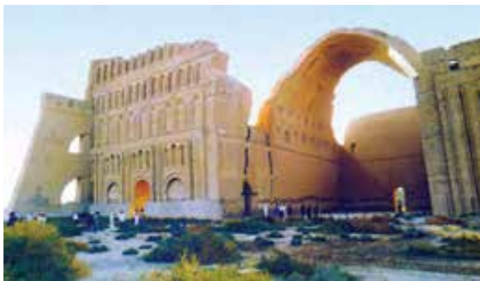
طاق کسرا یا ایوان مداین از بناهای باشکوه دوره‌ی ساسانی است. در این دوره، ساختن ایوان در بناها رواج یافت.

ساسانیان، یکی از باشکوه‌ترین شهرهای آن زمان بود. خسرو انوشیروان هم چنین کاخ‌های باشکوهی برای خود ساخت که خرابه‌های یکی از آن‌ها به نام «طاق کسرا» هنوز پابرجاست. به دستور او دانشگاه بزرگی هم در جندی شاپور ساخته شد. در این شهر، دانش پزشکی رونق داشت و پزشکانی از ایران و دیگر کشورهای جهان در آن‌جا گرد آمده بودند.