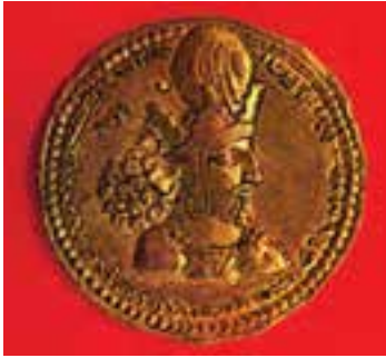
سکه‌ی زرین شاپور اول ساسانی

در زمان ساسانیان، معماری و سنگ تراشی پیشرفت بسیار کرد. در این دوره نیز چون گذشته، هنرمندان، کارهای مهم مانند پیروزی‌ها را به یادگار بر روی سنگ‌های بزرگ کوه‌ها نقش می‌کردند.