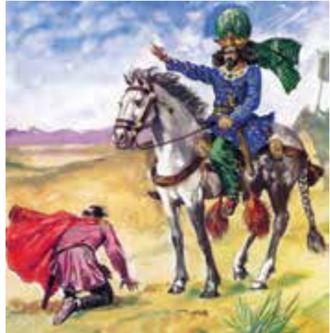
امپراتور روم در مقابل شاپور اول زانو زده و تسلیم شده است.

در زمان ساسانیان، معماری و سنگ تراشی پیشرفت بسیار کرد. در این دوره نیز چون گذشته، هنرمندان، کارهای مهم مانند پیروزی‌ها را به یادگار بر روی سنگ‌های بزرگ کوه‌ها نقش می‌کردند.