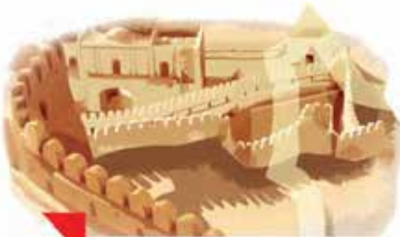
اینجا، آرگِ بَمِ کرمان است.