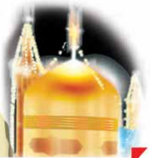
اینجا، حرم امام هشتم، حضرت رضا (ع) در شهر مشهد است.