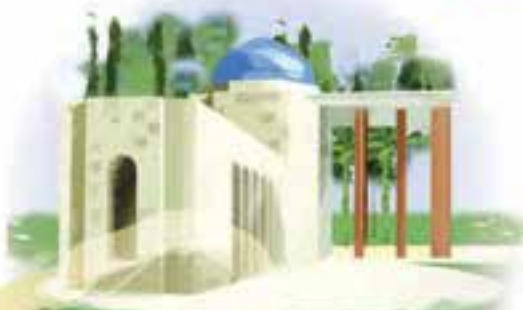
اینجا آرامگاه فردوسی، شاعر بزرگ ایران، در توس مشهد است.