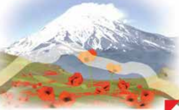
این، قلدی زیبای دماوند است.