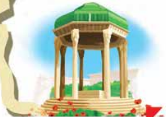
اینجا آرامگاه حافظ شیرازی است.