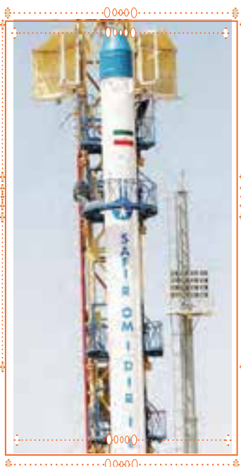
سوره‌ی الرَّحْمَن آیه‌ی ۳۳