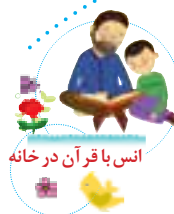
انس با قرآن در خانه

با اعضای خانواده‌ات مشورت کن و بگو این تصویر با کدام یک از پیام‌های قرآنی این درس ارتباط دارد.