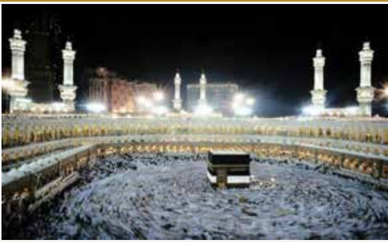
حج، نماد برادری و وحدت مسلمانان جهان