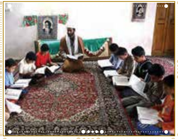
انس با قرآن کریم در استان فارس، شهرستان داراب

با راهنمایی آموزگار خود پس از آوردن قرآن کریم از دفتر مدرسه، آن را به صورت تصادفی باز کنید و از روی آن بخوانید.