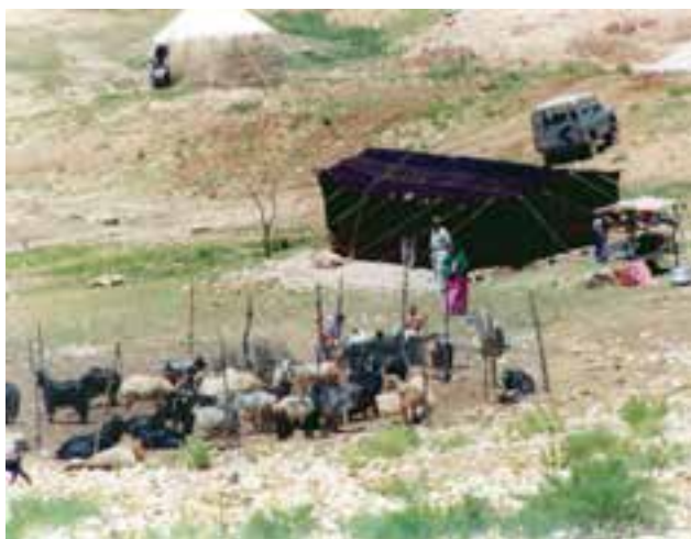
دامپروری کار اصلی عشایر است.