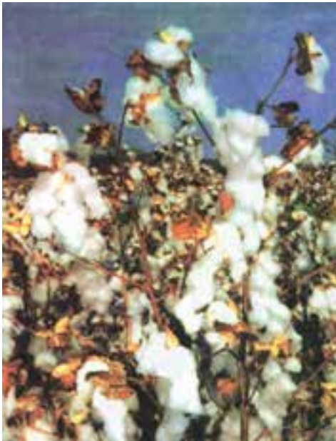
گل پنبه — استان گلستان

اکنون با توجه به نقشه‌ی صفحه‌ی ۱۱، بگویید خرما بیش‌تر در کدام نواحی ایران به‌دست می‌آید. چرا؟ بیش‌تر محصول پسته‌ی ایران در کدام استان تولید می‌شود؟ پسته و خرما از محصولاتی‌اند که از ایران به کشورهای دیگر جهان صادر می‌شوند.