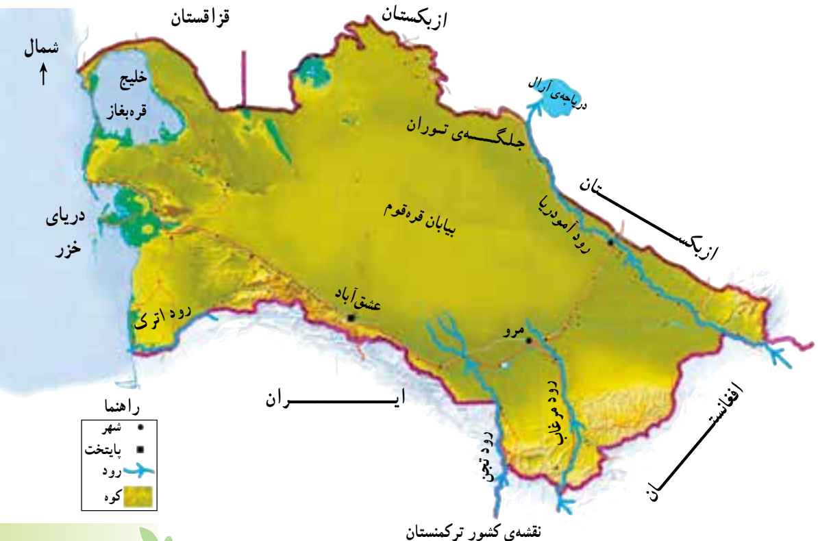
نقشه‌ی کشور ترکمنستان