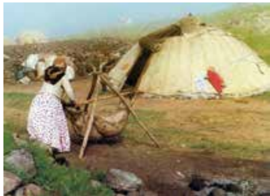
تهیه‌ی کره به روش دستی