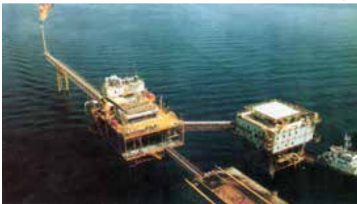
سکوی نفتی ایران در آب‌های خلیج فارس

* این منابع در نزدیکی بندر عسلویه در آب‌های خلیج فارس واقع است.