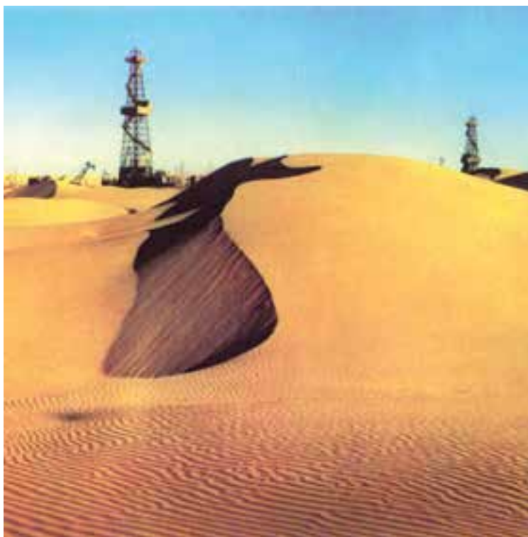
بیابان قره‌قوم و استخراج نفت

● رودهای مهم ترکمنستان از کشورهای همسایه — یعنی ایران و افغانستان — سرچشمه می‌گیرند. مهم‌ترین رود این کشور آمودریا (جیحون) است. این رود از کدام کشور سرچشمه می‌گیرد و به کدام دریاچه می‌ریزد؟ رودهای مرزی ایران و ترکمنستان چه نام دارند؟ رودهای ترکمنستان در کشاورزی و زندگی مردم این کشور نقش مهمی دارند. از این رودها برای آبیاری زمین‌های کشاورزی استفاده می‌شود.