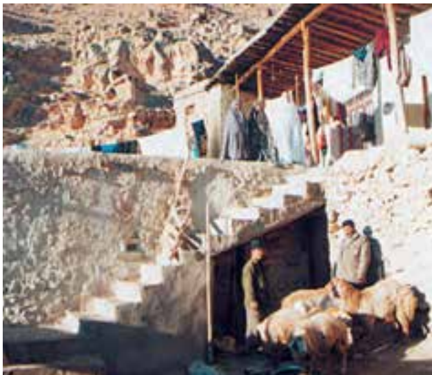
دامپروری در روستا

* دامپروری، کار اصلی ایلات و عشایر است. عشایر برای یافتن چراگاه مناسب، در فصل تابستان به ییلاق (سردسیر) و در فصل زمستان به قشلاق (گرمسیر) کوچ می‌کنند.