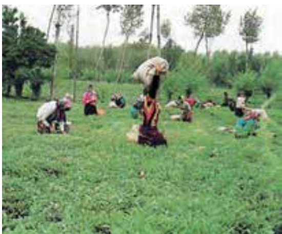
کشت چای — استان گیلان

به نظر شما، کدام نواحی ایران برای کشت دیم مناسب نیستند؟ چرا؟