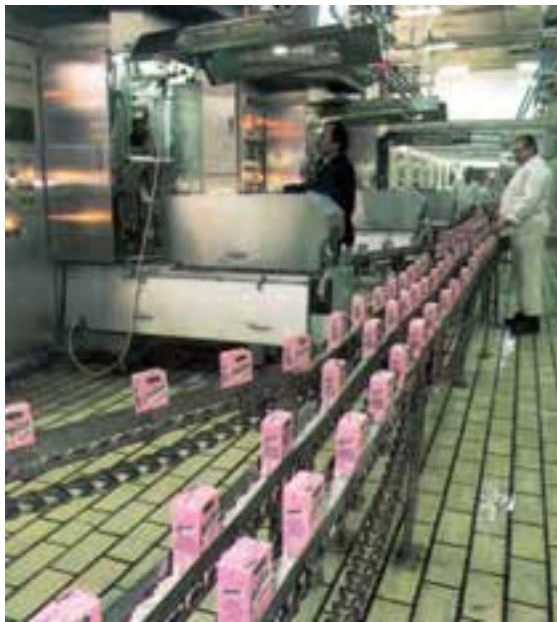
کارخانه‌ی تولید خامه‌ی پاستوریزه