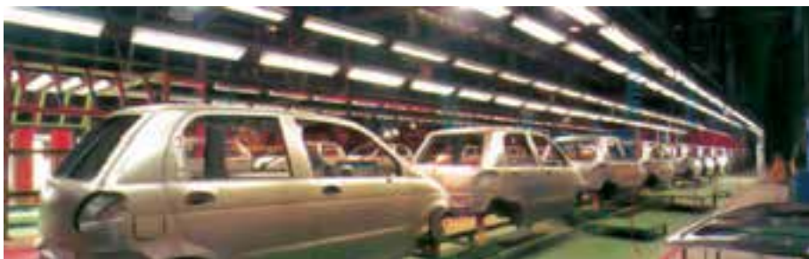
صنعت اتومبیل‌سازی، یک صنعت مصرفی است.

کارخانه‌های تولید پارچه، کفش و کیف، اتومبیل‌سازی، یخچال‌سازی، تولید کمپوت، آردسازی، کاغذسازی و بلورسازی صنایع مصرفی به حساب می‌آیند.