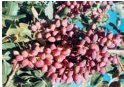
پسته — استان کرمان