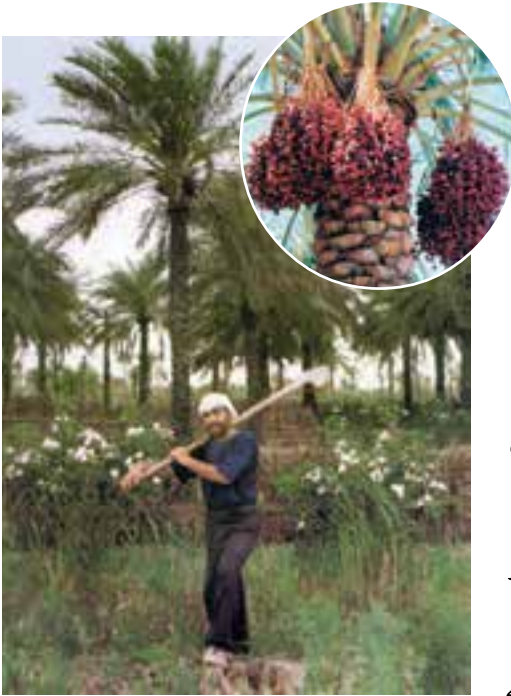
نخلستان — استان خوزستان

اکنون با توجه به نقشه‌ی صفحه‌ی ۱۱، بگویید خرما بیش‌تر در کدام نواحی ایران به‌دست می‌آید. چرا؟ بیش‌تر محصول پسته‌ی ایران در کدام استان تولید می‌شود؟ پسته و خرما از محصولاتی‌اند که از ایران به کشورهای دیگر جهان صادر می‌شوند.