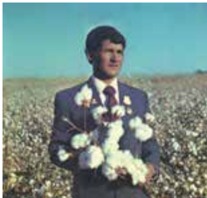
یک کشاورز نمونه‌ی پنبه‌کار در ترکمنستان

پنبه در جهان معروف است. قالی‌بافی از صنایع دستی مهم ترکمنستان است.