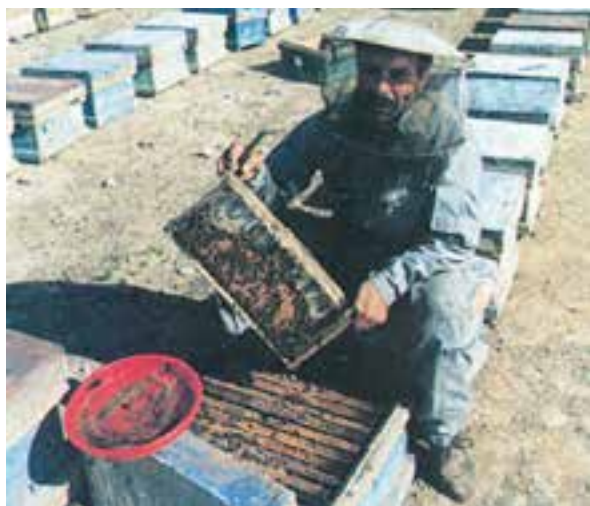
پرورش زنبور عسل

در دامپروری و مرغداری‌های صنعتی، تولید محصول با استفاده از ماشین‌ها و ابزار پیشرفته صورت می‌گیرد.