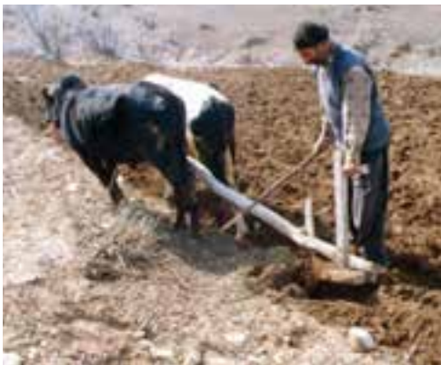
شخم‌زدن با گاو آهن

● در گذشته، انسان برای کشاورزی، بیش‌تر از نیروی کار خود یا حیوانات استفاده می‌کرد. در آن زمان، وسایل کشاورزی بسیار ساده بودند اما امروزه بیش‌تر از ماشین‌ها و ابزار پیشرفته برای انجام دادن کارهای کشاورزی استفاده می‌شود. این ماشین‌ها در همه‌ی کارهای کشاورزی مثل کاشتن بذر، سم‌پاشی، آبیاری و برداشت محصول به انسان کمک می‌کنند.