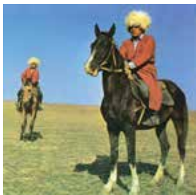
اسب‌های ترکمنی بسیار معروف‌اند.