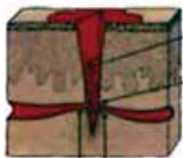
انقباض رگ خونی

این که بدن شما می‌تواند به‌طور خودکار باعث کنترل خونریزی شود یا نه بستگی به مکان و شدت جراحات دارد. به‌طور کلی بدن از دو طریق سعی در کنترل خونریزی دارد.