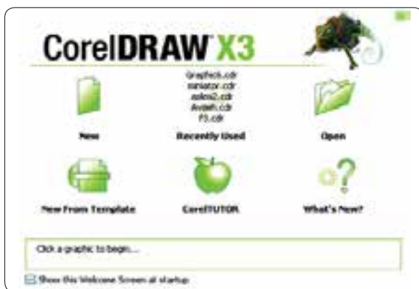
شکل ۴-۱ کادر محاوره خوشامدگویی

از مسیر Start/All Programs/Corel Graphics Suite X3 روی آیکن Corel DRAWX3 کلیک کنید تا نرم‌افزار اجرا شود. با اجرای نرم‌افزار، در ابتدای ورود به برنامه کادر محاوره خوشامدگویی (Welcome screen at startup) ظاهر می‌شود (شکل ۴-۱).