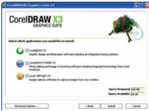
شکل ۱-۳ پنجره راهنمای نصب