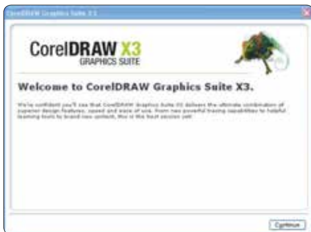
شکل ۱-۱ کادرمحاوره راهنمای نصب

در کادرمحاوره بعدی، شماره سریال (Serial Number) را در بخش? Already have a Trial serial number از محتوای CD پیدا کرده و در کادر متنی مربوطه وارد کنید. سپس روی دکمه Continue کلیک کرده و وارد کادرمحاوره بعدی شوید (شکل ۱-۲).