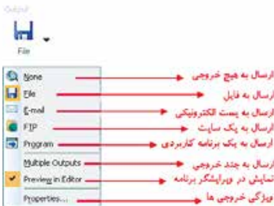
شکل ۴-۴ لیست بازشوی Output

در این قسمت خروجی حاصل از عملیات Capture می‌تواند در قالب یک فایل ویدیویی، ارسال به یک پست الکترونیکی یا یک سایت مشخص و حتی به یک برنامه‌ی خاص صورت گیرد.