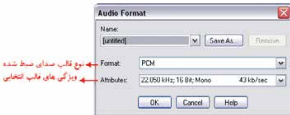
شکل ۴-۷ کادر محاوره Audio Format

در پنجره ی Output Properties می توان سخت افزار ورودی صدا را نیز تعیین کرد؛ برای این منظور، روی دکمه ی Audio Setup کلیک کرده تا کادر محاوره ای Audio Format باز شود. (شکل ۴-۷)