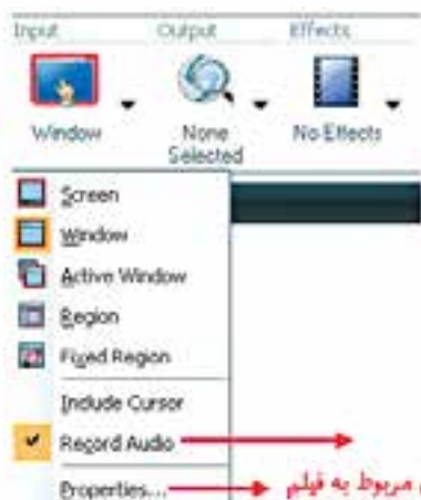
شکل ۴-۲ لیست بازشوی Input

در این بخش می‌توانید تنظیمات مربوط به منطقه‌ی ورودی Capture که شامل گزینه‌های Screen, Window, Active, Region, Fixed Region و Include Cursor است و در قسمت‌های قبل به‌طور کامل در مورد آنها صحبت کردیم را انجام دهید. (شکل ۴-۲)