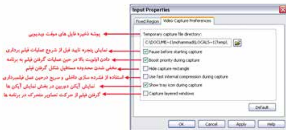
شکل ۴-۳ زبانه Video Capture Preferences از کادر محاوره Input Properties

در این زبانه شما می‌توانید تنظیمات مربوط به Capture در حالت Video از قبیل محل ذخیره‌سازی فایل‌های موقت ویدیویی، نمایش پنجره‌ی تأیید قبل از شروع عملیات فیلم برداری، دادن اولویت بالا در حین عملیات گرفتن فیلم به برنامه، مخفی شدن محدوده‌ی مستطیل شکل گرفتن فیلم، استفاده از فشرده‌سازی فکالی و سریع در حین عمل فیلم‌برداری، نمایش آیکن دوربین در بخش نمایش آیکن‌ها، گرفتن فیلم از حرکت تصاویر متحرک در برنامه‌ها.