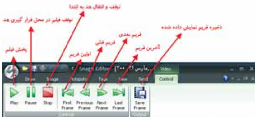
شکل ۴-۸ کادر محاوره SnagIt Editor در حالت Video