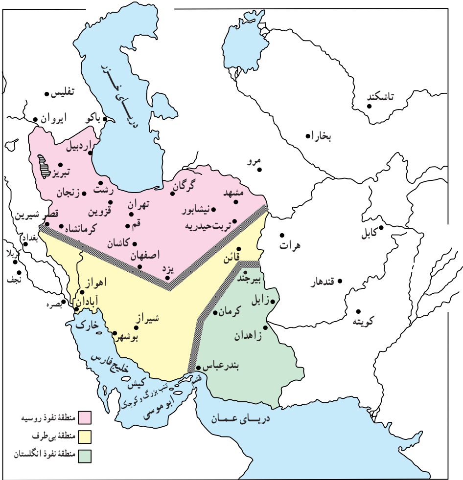
نقشه تقسیم ایران به سه منطقه براساس قرارداد ۱۹۰۷

جنگ جهانی اول: از آنجا که قدرت‌های استعمارگر قدیمی اروپا حاضر نبودند بخشی از مستعمرات خود را به قدرت‌های نوظهور اروپا واگذار کنند، دو طرف در مقابل یکدیگر صف‌آرایی کردند. در یک طرف آلمان، ایتالیا و اتریش – مجارستان قرار داشتند که به اتحاد مثلث یا متحدین معروف شدند و در سوی دیگر انگلستان، روسیه و فرانسه قرار گرفته بودند که به اتفاق مثلث یا متفقین مشهور شدند.