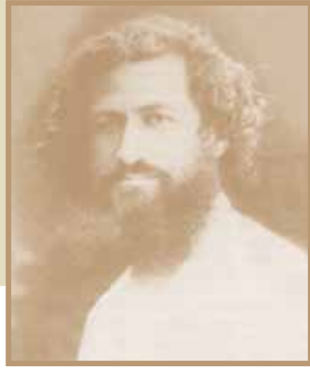
* میرزا کوچک خان جنگلی

در این میان، گروه‌هایی از مردم که خواهان استقلال کشور و اصلاح امور بودند، به مبارزه علیه بیگانگان و وابستگان آنها برخاستند. شیخ محمد خیابانی، محمد تقی خان پسیان و میرزا کوچک جنگلی از جمله رهبران این گروه‌ها بودند.