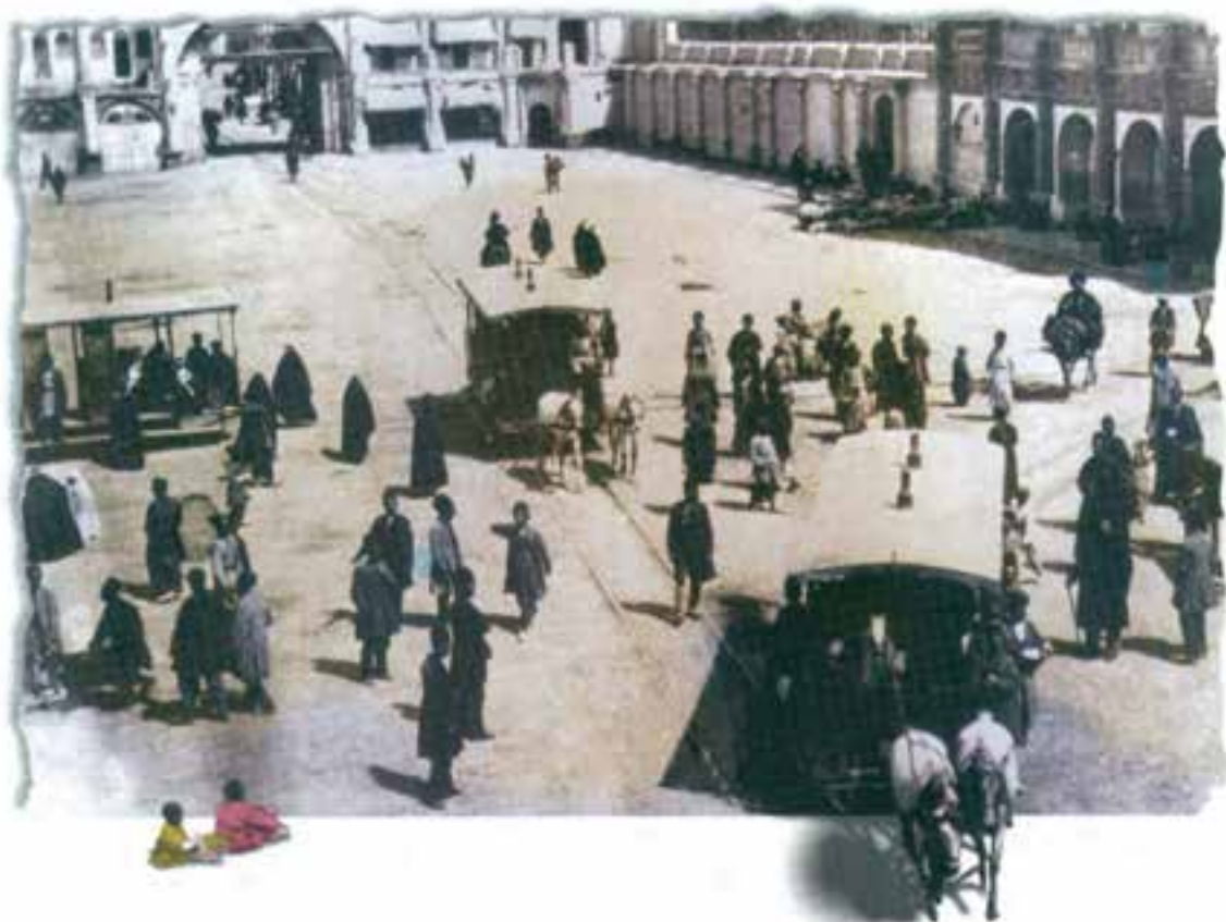
تهران - میدان تویخانه، ابتدای لاله‌زار (سال ۱۲۹۰ ش.)