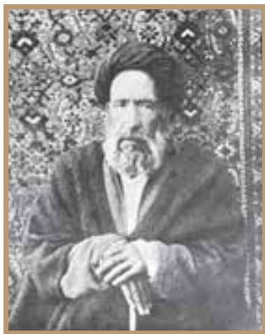
شهید آیت‌الله سیدحسن مدرّس

آیت‌الله سیدحسن مدرّس از جمله علمای بزرگی بود که در طول حیات خویش دست به مبارزه‌ای بی‌گیر با استبداد و استعمار زد. پس از فتح تهران و گشایش دوباره مجلس شورای ملی، مراجع نجف که مدرّس را شخصیتی صاحب صلاحیت در امور مذهبی و سیاسی می‌دانستند، به او و چندتن دیگر مأموریت دادند تا طبق متمم قانون اساسی به عنوان مجتهد طراز اول در جلسات مجلس شرکت کنند و بر مصوّبات آن نظارت داشته باشند. با آشکار شدن شخصیت مردمی مدرّس، مردم