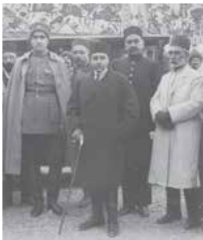
* احمدشاه، رضاخان و تعدادی از کارگزاران حکومتی

رئیس دیویزیون (لشکر) قزاق اعلیحضرت اقدس شهریاری و فرماندهٔ کل قزاق - رضا