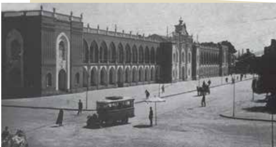
میدان توپخانه (امام خمینی کنونی) شهر تهران در دوران رضاشاه