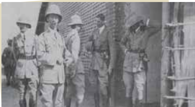
افسران انگلیسی مستقر در ایران در دوران جنگ جهانی اول

گرچه حکومت قاجار اراده و توان ایستادگی در برابر اشغالگران را نداشت، اما گروه‌هایی از مردم در نواحی جنوبی ایران مانند تنگستانی‌ها و دشتستانی‌ها به رهبری رئیس‌علی دلواری در برابر متجاوزان ایستادند و با ایثار و از خود گذشتگی ضربه‌های سختی به نیروهای انگلیسی وارد کردند. بر اثر این جنگ، بسیاری از مردم ایران به خاطر سیاست انتقال آذوقه، توسط نیروهای روسی و انگلیسی گرفتار قحطی شدند و جان سپردند.