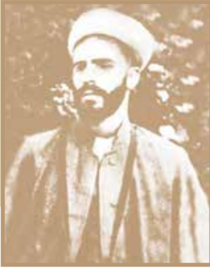
شیخ محمد خیابانی