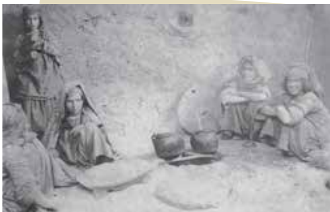
مردم قحطی‌زده ایران در دوران جنگ جهانی اول