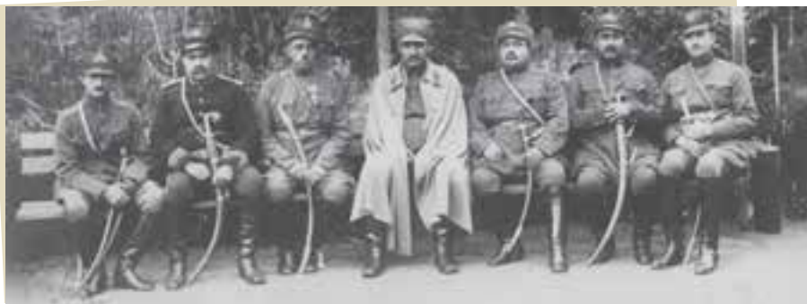
* رضاخان در میان جمعی از فرماندهان نظامی

سیاست مذهبی رضاخان قبل از سلطنت و در دوران سلطنت: رضاخان قبل از رسیدن به