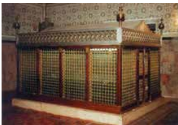
مرقد شریف سلمان فارسی

سرانجام سلمان فارسی در سال ۳۵ هجری، پس از سالها همراهی با پیامبر و امام علی (ع) و ۲۰ سال استانداری حکومت مدائن دنیای خاکی را وداع گفت. بسیاری از مردم مدائن جسم شریف او را تشییع کردند امام علی (ع) بر بیکر پاک این یار همیشه همراه پیامبر نماز خواند، سپس او را به خاک سپردند. مرقد شریف سلمان در مدائن واقع در ۲۰ کیلومتری بغداد و در نزدیک طاق کسری قرار دارد.