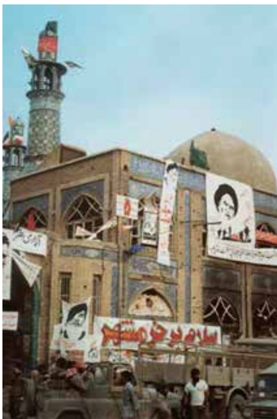
مسجد جامع خرمشهر پس از آزادسازی

پس از آزاد شدن مناطقی از خوزستان در چند عملیات پی‌درپی توسط رزمندگان ارتش، سپاه و نیروهای بسیجی که با هدایت و رهبری امام خمینی و ایمان و ایثار رزمندگان به‌دست آمد، زمان آن فرارسید تا فرزندان مقاوم ملت ایران با توکل بر خداوند و جهاد و ایثار در راه خدا، خرمشهر را از متجاوزان پس بگیرند.