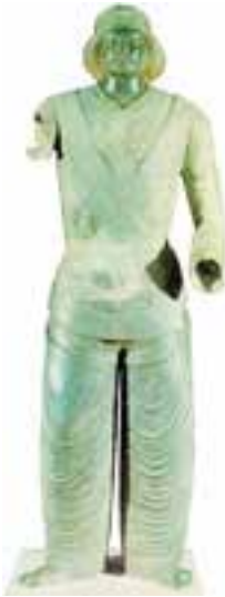
مجسمه‌ی یک شاهزاده‌ی پارسی که در ایزده واقع در خوزستان یافت شده است.

مجسمه‌سازی نیز در آغاز راه همانند نقاشی از اعتقاد انسان‌ها به نیروهای جادویی نشأت گرفته است. مجسمه‌سازان نخستین، همچون اولین نقاشان، می‌پنداشتند که با شکار پیکره‌ی سنگی حیوانات شکاری در عالم خیال، موفقیت خود را در صحنه‌های واقعی شکار تضمین خواهند نمود.