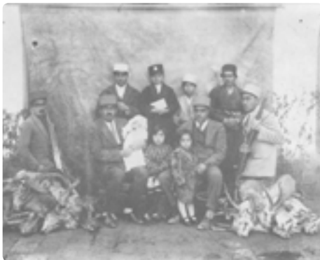
تصویری از یک خانوادهٔ ارمنی در دورهٔ رضا شاه

با انتخاب عکس‌های مناسب می‌توان از این منبع در جهت تفسیر حوادث و رویدادها نیز استفاده کرد. به تعبیری عکس‌ها خود در واقع نوعی تفسیر از وقایع تاریخی هستند.