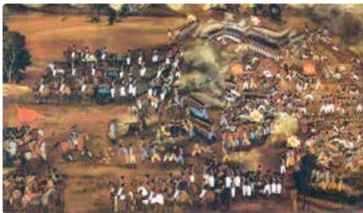
نقاشی صحنه‌ای از جنگ‌های ایران و روسیه