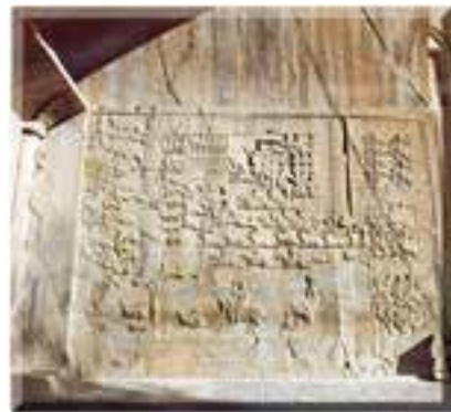
بخشی از حجاری‌های طاق بستان

این آثار با کار تکمیلی هنرمندان غارنشین بر روی اشکال طبیعی سنگ‌های دیواره‌ی غارها و یا دیگر سنگ‌ها و مواد موجود در محیط اطراف پدید آمده‌اند.