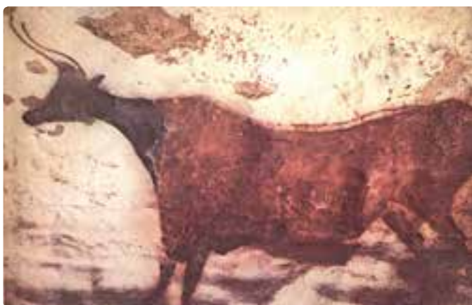
نقاشی روی دیوار غار لاسکو در فرانسه

می‌دانیم که رویدادهای تاریخی تنها یک بار اتفاق می‌افتند و پس از آن دیگر وجود خارجی ندارند تا انسان بتواند دوباره آنها را مشاهده کند. اما یک اثر هنری پدیده‌ای زنده و موجود در برابر بینایی و شنوایی انسان‌هاست که گوشه‌هایی از اوضاع و احوال زمان آفرینش خود را منعکس می‌کند. به تعبیر دیگر هر اثر هنری را می‌توان گونه‌ای رخداد تاریخی دانست که تا زمان حال باقی مانده است و به محقق این امکان را می‌دهد