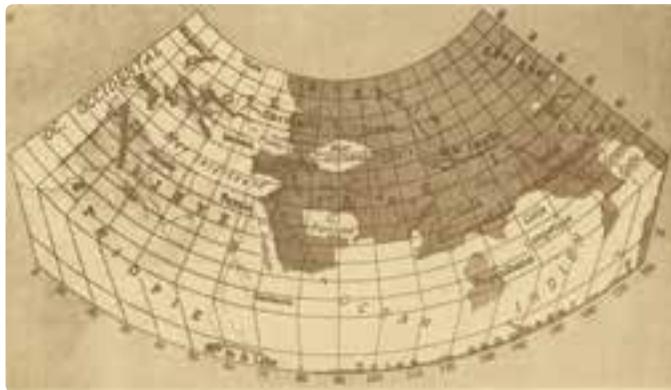
نام خلیج فارس در نقشه جهان بطلمیوس

۳- از طریق نقشه‌های تاریخی، محل یکی از راه‌های درک بصری رویدادهای تاریخی استفاده از نقشه‌های تاریخی است. نقشه‌های تاریخی ابزاری سودمند در آموزش تاریخ محسوب می‌شوند، زیرا استفاده از آنها در آموزش سلسله‌ها و دوره‌های حکومتی، دانش‌آموزان و دانشجویان را آماده می‌کند تا مفاهیم و موضوعات تاریخی را در فضای جغرافیایی و در بستر مکان بهتر درک کنند.