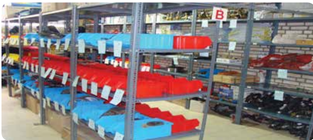
انبار ابزار و لوازم یدکی