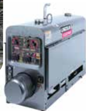
ج) دستگاه‌های جوشکاری نظیر: رکتیفایر، ترانس، دینام و موتور جوش ادامه- برخی از دستگاه‌های موجود در کارگاه‌های جوشکاری