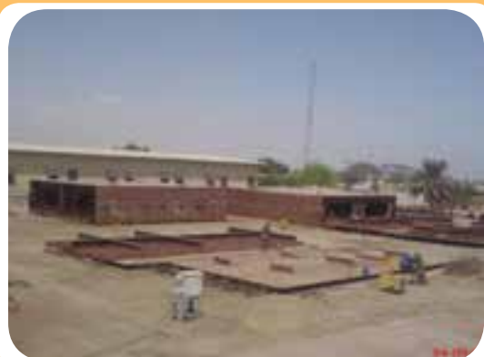
د) کارگاه ساخت اسکلت فلزی ساختمان