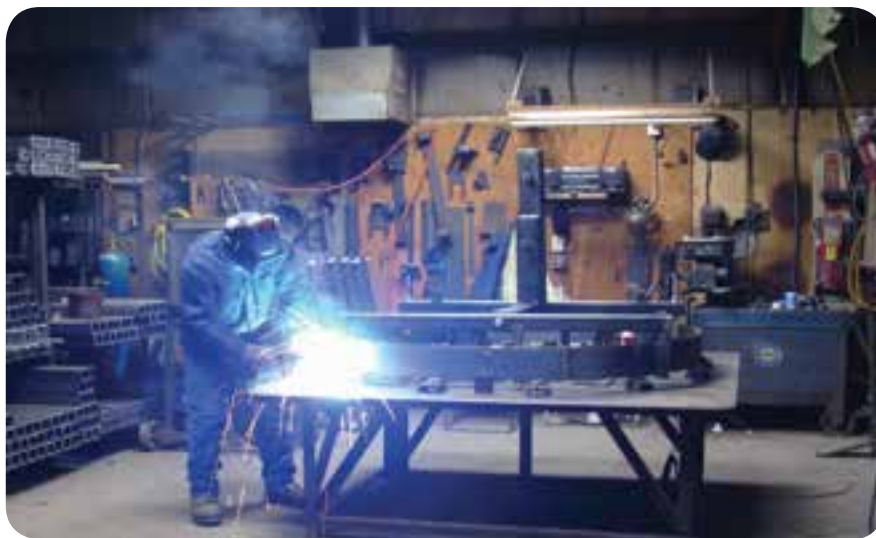
بخشی از فضای داخل کارگاه جوشکاری ساخت

فضای کارگاه جوشکاری به طور معمول سرپوشیده است ولی گاهی به دلیل شرایط اجرایی مثل: مشکل حمل و نقل سازه‌های بزرگ صنعتی بخشی از فعالیت‌های جوشکاری و یا تمام آن در محل نصب سازه‌ها (سایت) صورت می‌پذیرد.