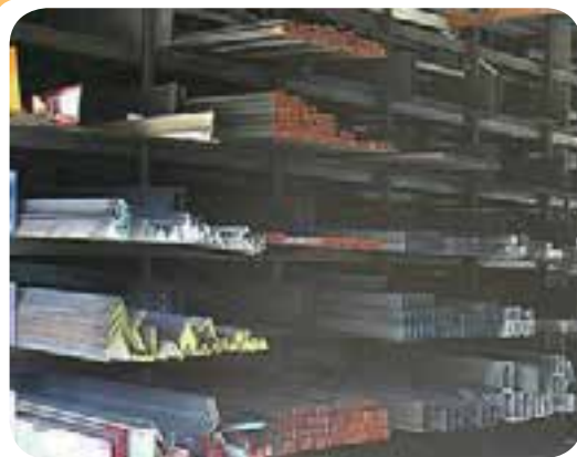
ب) انبار ذخیره انواع پروفیل فولادی