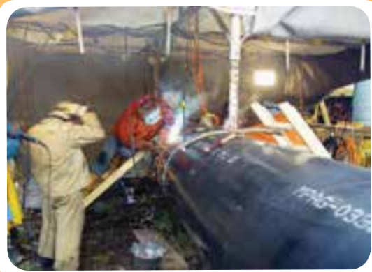
ن) کارگاه ساخت خط لوله