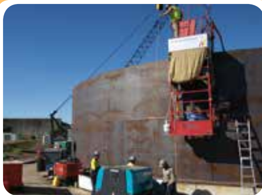
م) کارگاه ساخت مخازن ذخیره

نمونه ای از کارگاه‌های جوشکاری تجهیز شده برای ساخت سازه‌های صنعتی