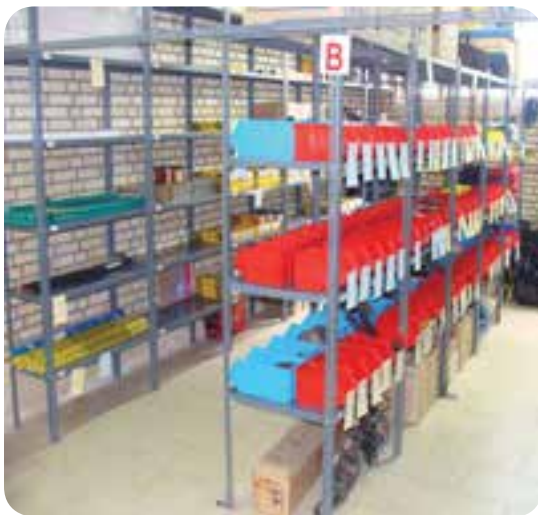
انبار مواد مصرفی جوشکاری