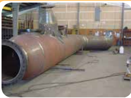
ج) کارگاه ساخت تجهیزات صنعتی