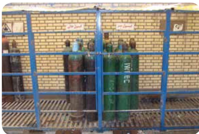
محل نگهداری کپسول‌های گاز محافظ