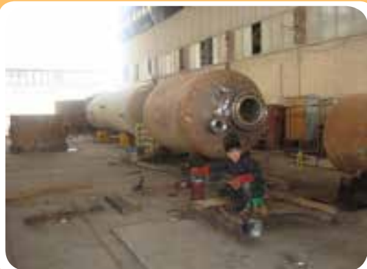
ب) کارگاه ساخت مخازن تحت فشار