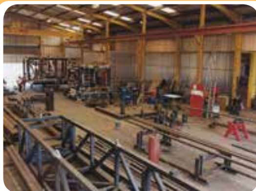
الف) کارگاه ساخت سازه‌های ساختمانی