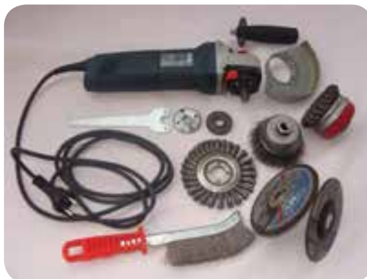
ب) دستگاه‌های آماده سازی و ماشین‌کاری نظیر: تراش، فرز، دریل، سنگ‌زنی، پرس کاری و پخ کاری