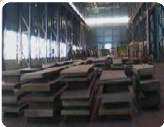
ج) انبار نگه‌داری انواع ورق فولادی