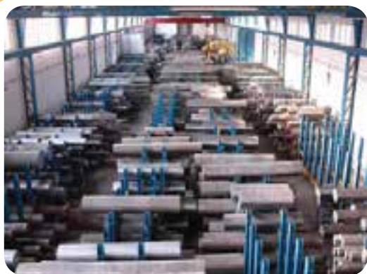
الف) انبار ذخیره لوله و پروفیل های گرد فولادی