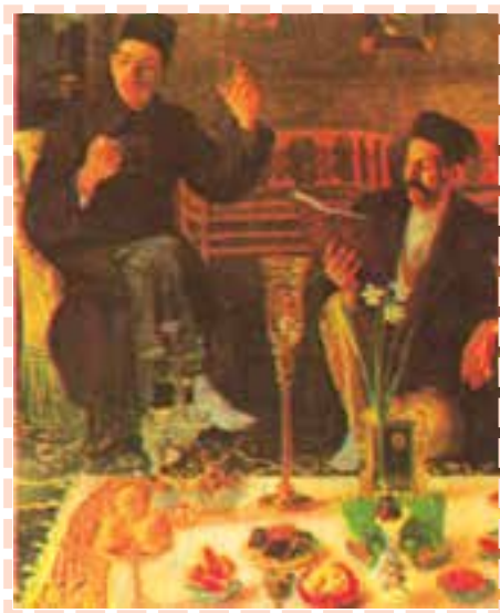
1 - Cette gravure nous rappelle .....