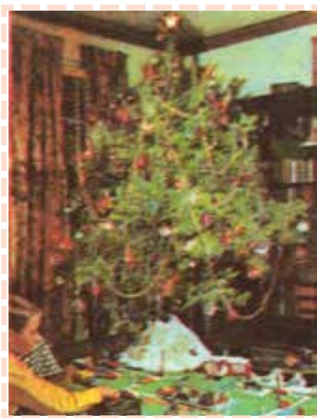
2 - Cette gravure nous rappelle .....