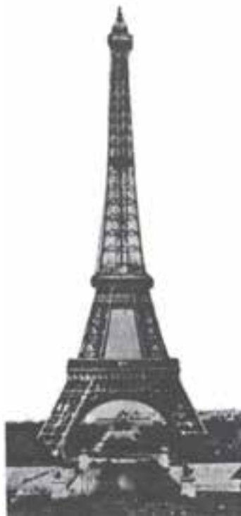
3 - Cette gravure nous rappelle .....