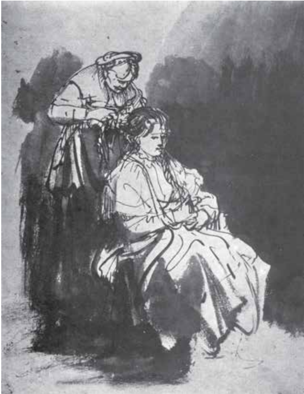
تصویر ۱۰- طراحی با آب مرکب و قلم‌مو به شیوه خیس در خیس بر روی کاغذ خشک، اثر رامبراند

توصیه می‌شود برای کسب مهارت کافی ابتدا تمرین‌هایی را با استفاده از آب مرکب و قلم‌مو و یا تک‌رنگ با آبرنگ انجام دهید و پس از کسب مهارت با ترکیبات رنگی مختلف کار خود را آغاز کنید. هنرمندانی چون رامبراند از این شیوه، با استفاده از آب مرکب، آثار ارزشمندی از خود به یادگار گذاشته‌اند و بسیاری از پیش‌طرح‌ها و طرح‌های سریع برای تابلوهای نقاشی خود را به این روش طراحی کرده‌اند (البته هنرجویان عزیز با این روش در کلاس طراحی آشنا گردیده‌اند و تمرین‌های کافی انجام داده‌اند) (تصاویر ۱۰ تا ۱۲).