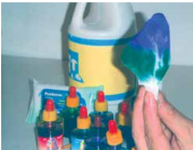
تصویر ۳- مرحله دوم رنگ آمیزی با آبرنگ مایع (جوهرهای رنگی) و پاک‌کننده را نشان می‌دهد.