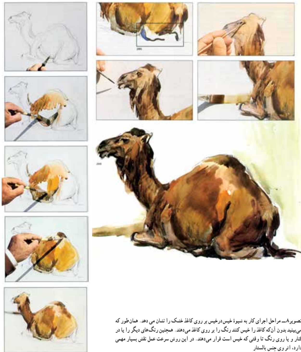
تصویر ۸- مراحل اجرای کار به شیوه خیس در خیس بر روی کاغذ خشک را نشان می‌دهد. همان طور که می‌بینید بدون آن که کاغذ را خیس کنند رنگ را بر روی کاغذ می‌دهند. همچنین رنگ‌های دیگر را یا در کنار و یا روی رنگ تا وقتی که خیس است قرار می‌دهند. در این روش سرعت عمل نقش بسیار مهمی دارد، اثر وی چنس بالستار

شیوه آبرنگ به صورت خیس در خیس بر روی کاغذ خشک : یکی دیگر از شیوه‌های آبرنگ به صورت خیس در خیس، شیوه خیس در خیس بر روی کاغذ خشک است و بیشتر نقاشان با این شیوه کار می‌کنند. تفاوت این شیوه با شیوه قبلی، همان گونه که از نامش پیداست، در آن است که برای رنگ آمیزی سطح کاغذ را خیس نمی‌کنیم. برای شروع، ابتدا کاغذ را شاسی کشی می‌کنیم و بعد از انتقال طرح بر سطح، با استفاده از قلم‌مو و آبرنگ (قرصی، لوله‌ای، مایع)، رنگ‌ها را سریع در کنار هم و گاه بر روی هم می‌گذاریم (تصویر ۸).