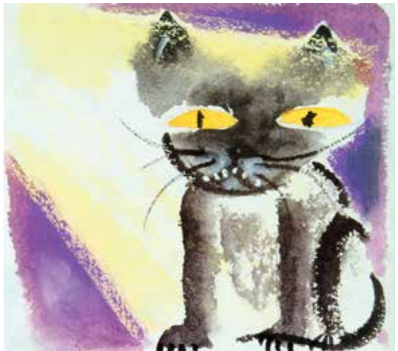
تصویر ۱۲- تصویرسازی به شیوه خیس درخیس بر روی کاغذ خشک، در تاریکی، اثر شون ویساسا