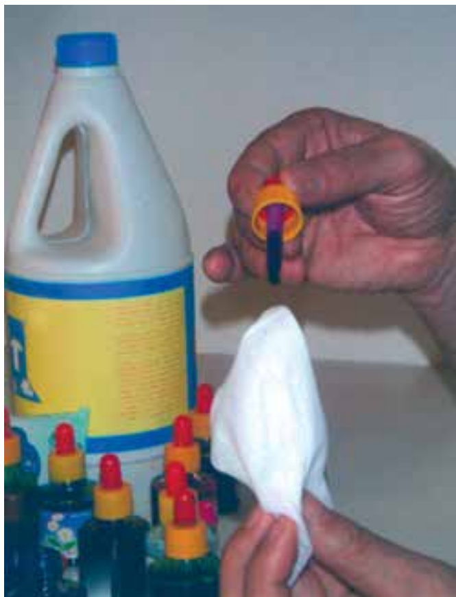
تصویر ۲- مرحله اول شیوه آبرنگ مایع (جوهرهای رنگی) و پاک‌کننده را، که با قطره‌چکان بر دستمال کاغذی مرطوب رنگ می‌چکانیم، نشان می‌دهد.

روش کار : در این شیوه، ابتدا دستمال کاغذی را با آب مرطوب می‌کنیم. سپس با استفاده از قطره چکان آبرنگ مایع، چند قطره از رنگ دلخواه و هماهنگ را، همان‌گونه که در تصویر مشاهده می‌کنید، بر روی دستمال کاغذی مرطوب که چند تا خورده است می‌چکانیم. با توجه به خیس بودن سطح دستمال، رنگ به راحتی و به صورت اتفاقی بر سطح دستمال پخش می‌شود. با همین شیوه رنگ‌های دیگر را به آن اضافه می‌کنیم. نتیجه حاصله رنگ‌هایی با شکل‌های غیرمنتظره و زیباست (تصاویر ۲ و ۳).