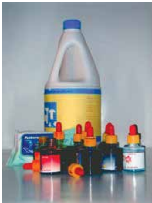
تصویر ۱- وسایل مورد نیاز شیوه آبرنگ مایع (جوهرهای رنگی) و پاک‌کننده (سفیدکننده) از قبیل مایع پاک‌کننده، دستمال کاغذی و آبرنگ مایع را نشان می‌دهد.