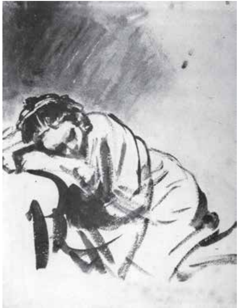
تصویر ۱۱- طراحی با آب‌مِ مرکب و قلم‌مو به شیوه خیس درخیس بر روی کاغذ خشک، دختر خفته، اثر رامبراند