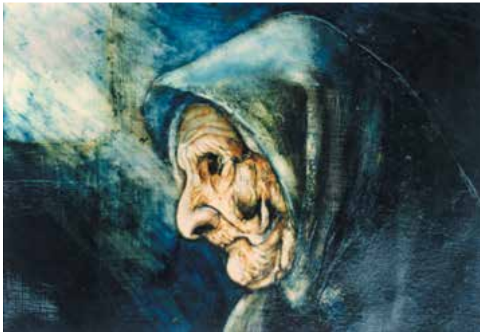
تصویر ۱- تصویرسازی با استفاده از شیوه چسب چوب، اثر دانشجوی گرافیک، ابوالمعمومی، همانگونه که در تصویر مشاهده می کنید شیوه تصویرسازی با استفاده از چسب چوب به شما امکانات بصری و بافت های متفاوت تری نسبت به آنچه تاکنون فراگرفته اید ارائه خواهد کرد.

روش کار: در صورتی که از مقوای سفید و یا کاغذ ضخیم برای کار با چسب چوب استفاده می کنید ابتدا طرح خود را به وسیله مداد بر صفحه طراحی کنید. ولی اگر از فیبر استفاده می کنید بهتر است ابتدا با قلم مو و گواش سفید تمام سطح فیبر را رنگ کنید. سپس طرح را با مداد بر سطح فیبر رنگ آمیزی شده طراحی کنید. بعد از این مرحله، تمام سطح کار را با قلم موی نسبتاً درشت رنگ روغن و یا کاردک نرم به چسب چوب آغشته نمایید، تا سطح کار به صورت یکدست درآید. در این مرحله سعی نمایید تا هیچگونه بافت یا منفذی (روزنه ای) برای عبور رنگ بر سطح کاغذ (یا فیبر) باقی نماند. سپس برای سرعت عمل با استفاده از سشوار و از فاصله ۲۰ سانتی متری سطحی را که چسب زده اید خشک کنید.