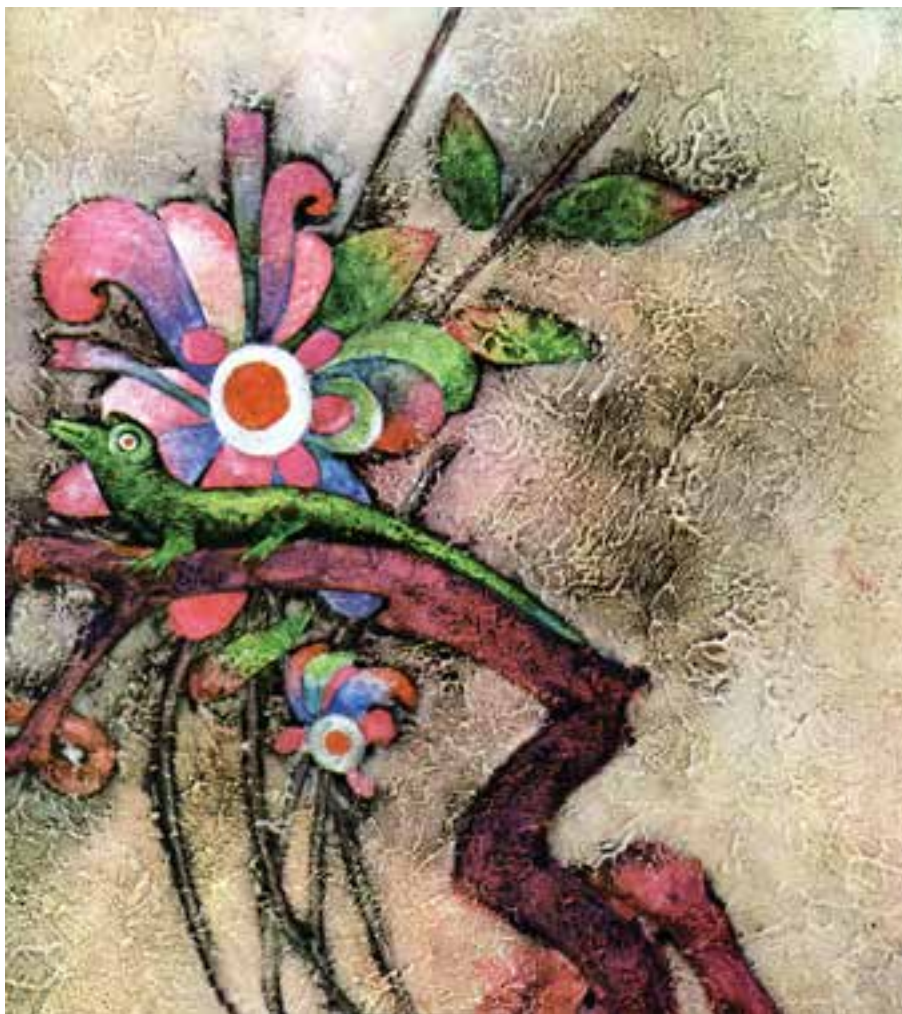
تصویر ۴- تصویرسازی با استفاده از شیوه چسب‌چوب، توکایی در قفس، اثر بهمن دادخواه

در خاتمه بحث برای شناخت بیشتر، نمونه‌های تصویری که با استفاده از چسب‌چوب توسط هنرمندان مختلف تصویرسازی شده‌اند برای درک و شناخت بیشتر هنرجویان آمده است (تصویر ۴).