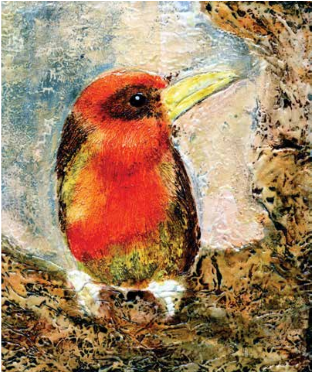
تصویر ۲- تصویرسازی با استفاده از شیوه چسب چوب، اثر شهرزاد شوشتریان. بافت ایجاد شده توسط قلم مو، شانه پلاستیکی و سوزن به وجود آمده و جهت حفظ بافت با سشوار سطح چسب چوب خشک شده است. سپس رنگ آمیزی با استفاده از آبرنگ مایع انجام شده است.