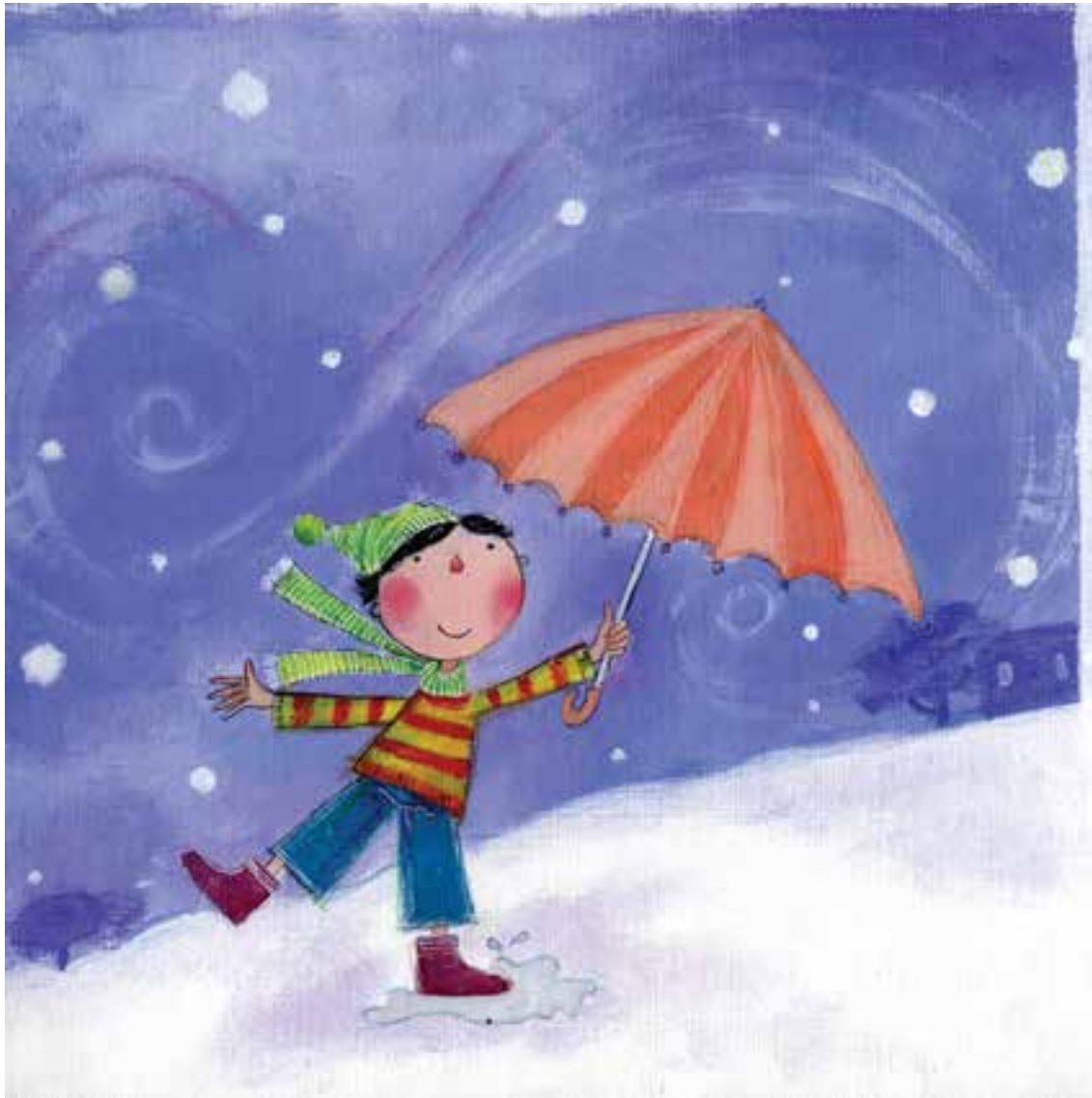
گلناز ثروتیان - تصویرسازی