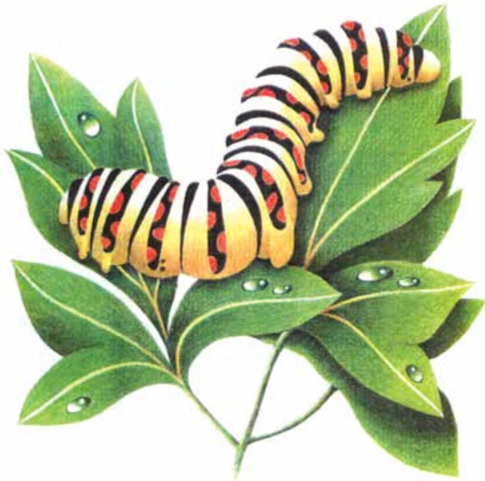
تصویر ۲- الف) تصویرسازی با استفاده از مدادرنگی شیوه سایشی یا محو کردن رنگ‌ها