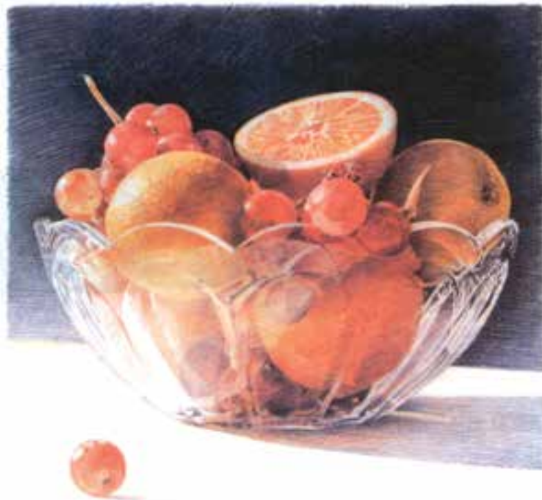
تصویر ۲- ج) تصویرسازی با استفاده از مدادرنگی به شیوهٔ هاشور، اثر لیندا فنیچور