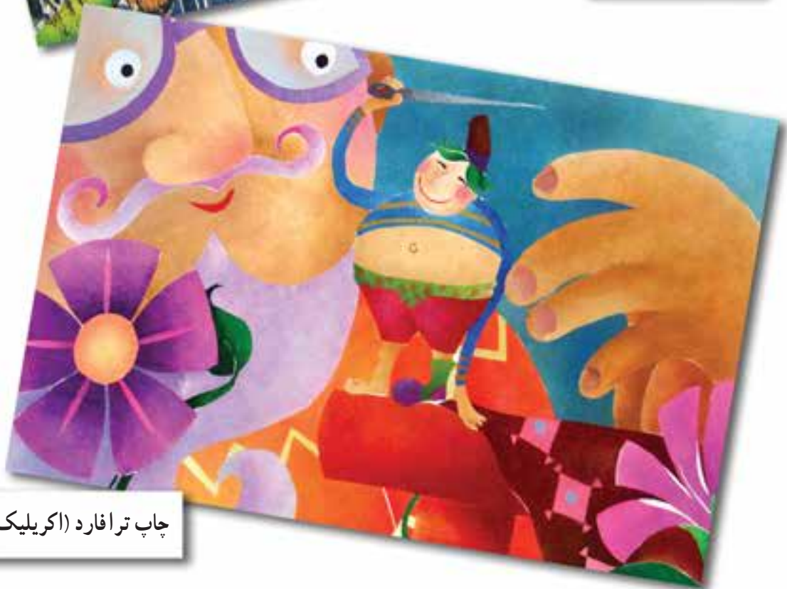
چاپ ترافارد (اکریلیک)