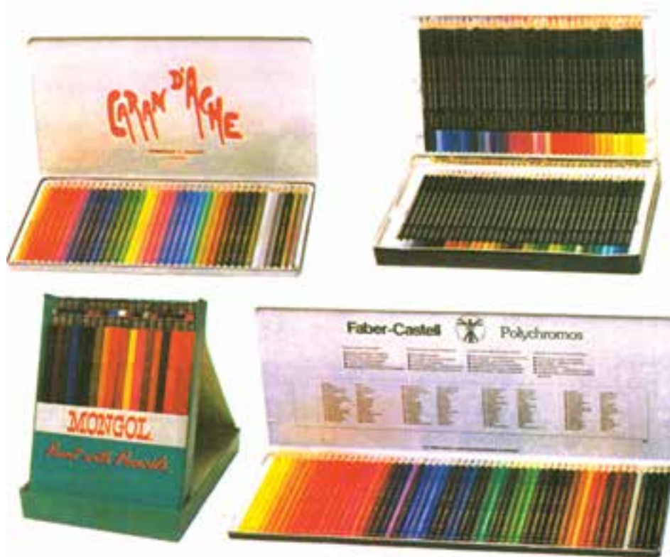
تصویر ۱- انواع مدادرنگی با علائم تجاری مختلف

مدادرنگی از گروه رنگ‌های نیمه شفاف است که به راحتی با یکدیگر مخلوط می‌شوند و می‌توان رنگ‌ها را به صورتی با یکدیگر مخلوط کرد که در عین آنکه هر دو رنگ خاصیت رنگی خود را حفظ می‌نمایند، موجب پیدایش رنگ تازه‌ای نیز بشوند. مغزی مدادرنگی، بخش استوانه‌ای شکل و باریک آن است که از رنگدانه (ماده رنگی) فشرده، نوعی موم و کائولین (یک نوع خاک رس) ترکیب شده است و در بازار با انواع علائم تجاری یافت می‌شود (تصویر ۱). مدادهای طراحی به لحاظ نرمی و سختی دسته‌بندی می‌شوند. مدادهای سخت در سری H، F و HB، مدادهای متوسط در سری HB و مدادهایی با مغز نرم در سری B قرار دارند.