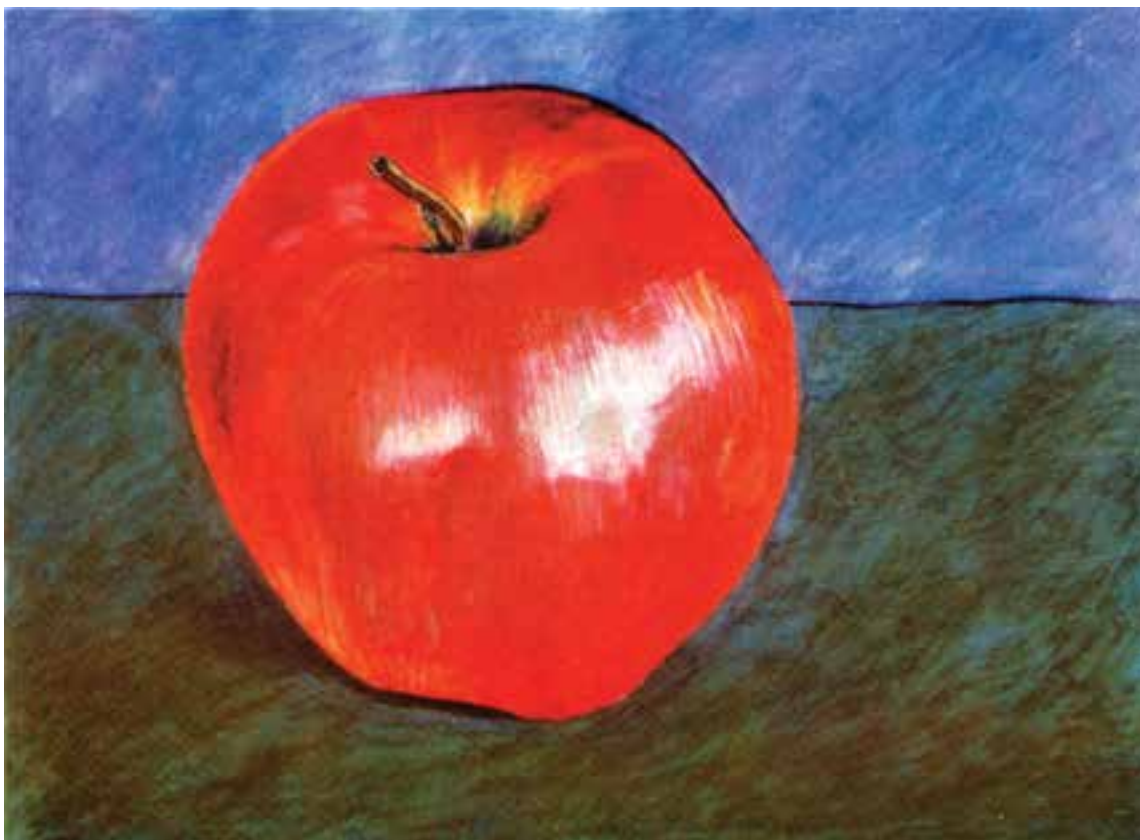
تصویر ۲-ه) تصویرسازی با استفاده از مداد رنگی به شیوه صیقل دادن