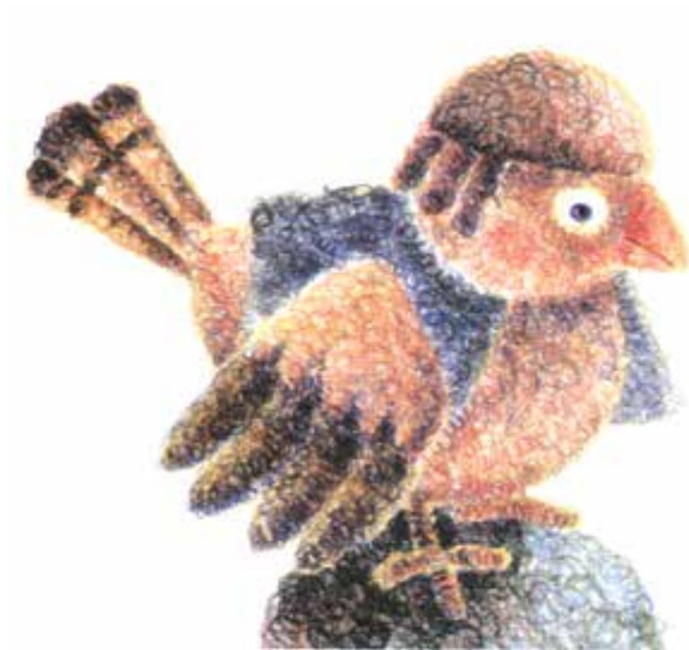
تصویر ۲-د) تصویرسازی با استفاده از مداد رنگی به شیوه تلفیقی و ایجاد بافت جدید، اثر محسن حسن پور