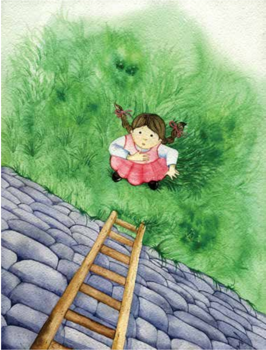
گلناز نرو تیان — تصویر سازی