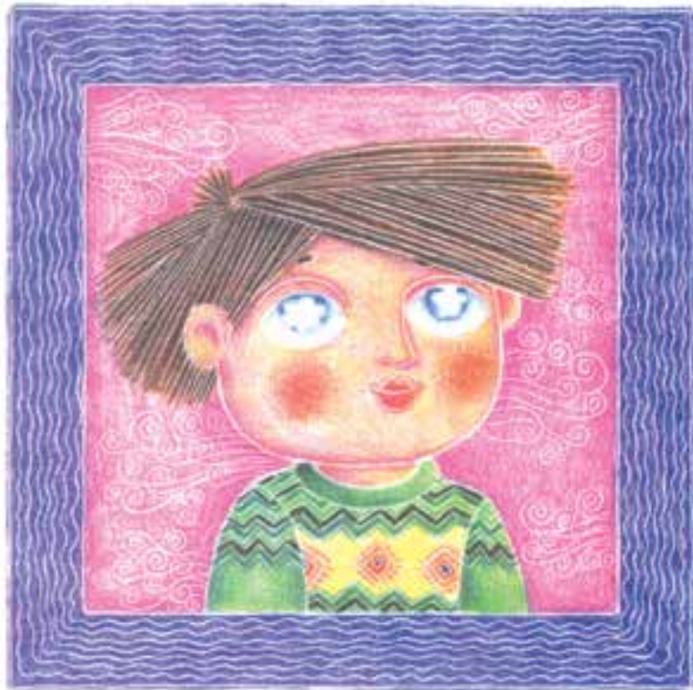
تصویر ۲- ب) تصویرسازی با استفاده از مدادرنگی به شیوهٔ شیپاراندازی، چه کسی خدا را دیده است، اثر شهزاد شوشتریان