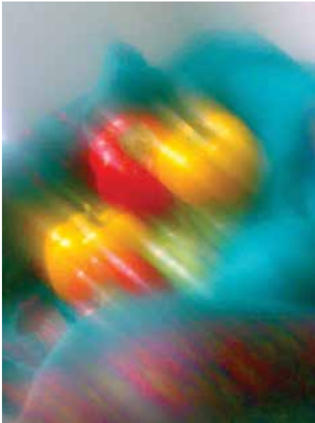
شکل ۵-۶- با کمی چرب کردن فیلتر محافظ لنز و جهت دادن به حالت خطوط، این تصویر پدید آمده است.

اگرچه برای ایجاد این حالت در عکس‌ها، فیلترهایی ساخته شده است اما با به‌کارگیری روش زیر می‌توان تنوع گسترده‌ای از حالت‌های گوناگون را در تصاویر هنگام عکس‌برداری تجربه و سپس ثبت کرد (شکل ۵-۶).