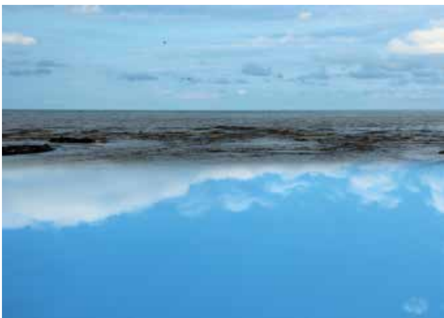
شکل ۵-۵- با به‌کارگیری یک آینه در زیر لنز و عکس برداری از موضوع، این عکس‌ها پدید آمده است.