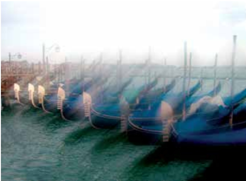
شکل ۵-۸- این تصویر با چرب کردن فیلتر محافظ لنز به دست آمده است.

به کارگیری این تکنیک در عکس برداری از چهره، طبیعت بیجان و مناظر، نتایج جالبی را به همراه خواهد داشت (شکل های ۵-۸، ۵-۹، و ۵-۱۰).