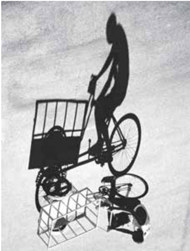
شکل ۳۱-۵ عکسی از یک سه چرخه‌سوار و سایه بلند آن که به صورت وارونه چاپ شده است.