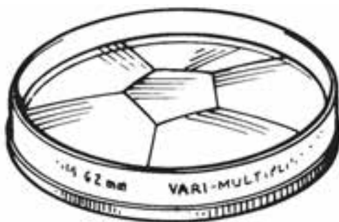
شکل ۲-۵- تصویر یک فیلتر منشوری

هنگام به‌کارگیری فیلترهای منشوری بهتر است ابتدا عمل واضح‌سازی انجام شده سپس فیلتر بر روی دوربین نصب شود. همچنین برای عکس‌برداری با فیلترهای منشوری بهتر است موضوع‌هایی انتخاب شوند که دارای پس‌زمینه‌ای ساده باشند (شکل ۳-۵).