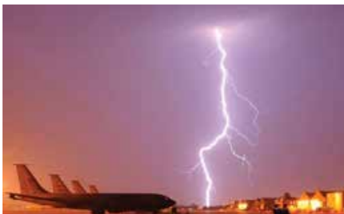
شکل ۵-۲۵- عکس برداری از آذرخش و انتخاب یک محل مناسب برای عکس برداری

زمان دقیق نوردهی یا باز بودن پرده شاتر به تعداد، قدرت و شدت آذرخش بستگی دارد. یک آذرخش قوی برای یک عکس برداری موفقیت‌آمیز کافی است. هنگامی که نور آذرخش ضعیف است، کمی صبر کنید تا آذرخش دیگری روی دهد. انتخاب محل عکس برداری و منظره‌ای که از آن عکس برداری می‌کنید، نقش مهمی در به‌دست آوردن یک عکس خوب و گیرا دارد (شکل ۵-۲۵).