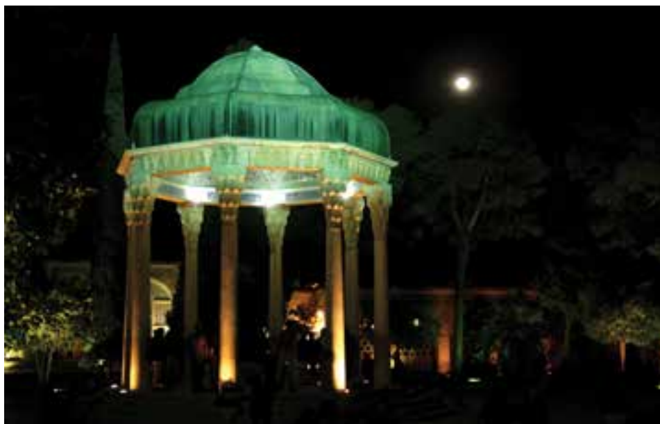
شکل ۱۱-۵- عکس برداری در شب و با نور موجود در محیط