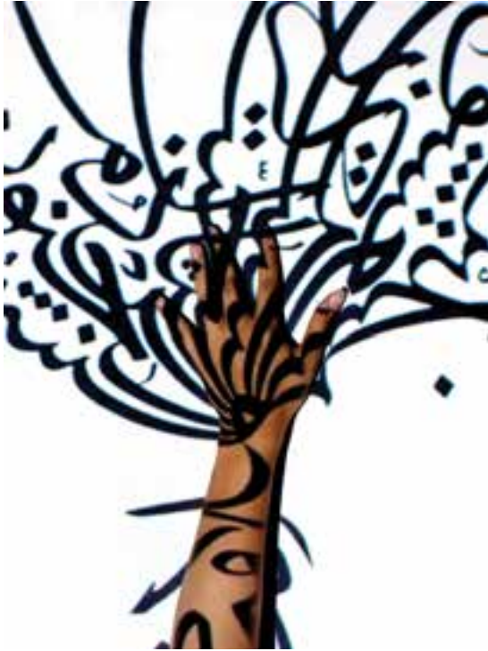
شکل ۲۷-۵- نمایش قطعه‌ای خوشنویسی بر روی یک دست