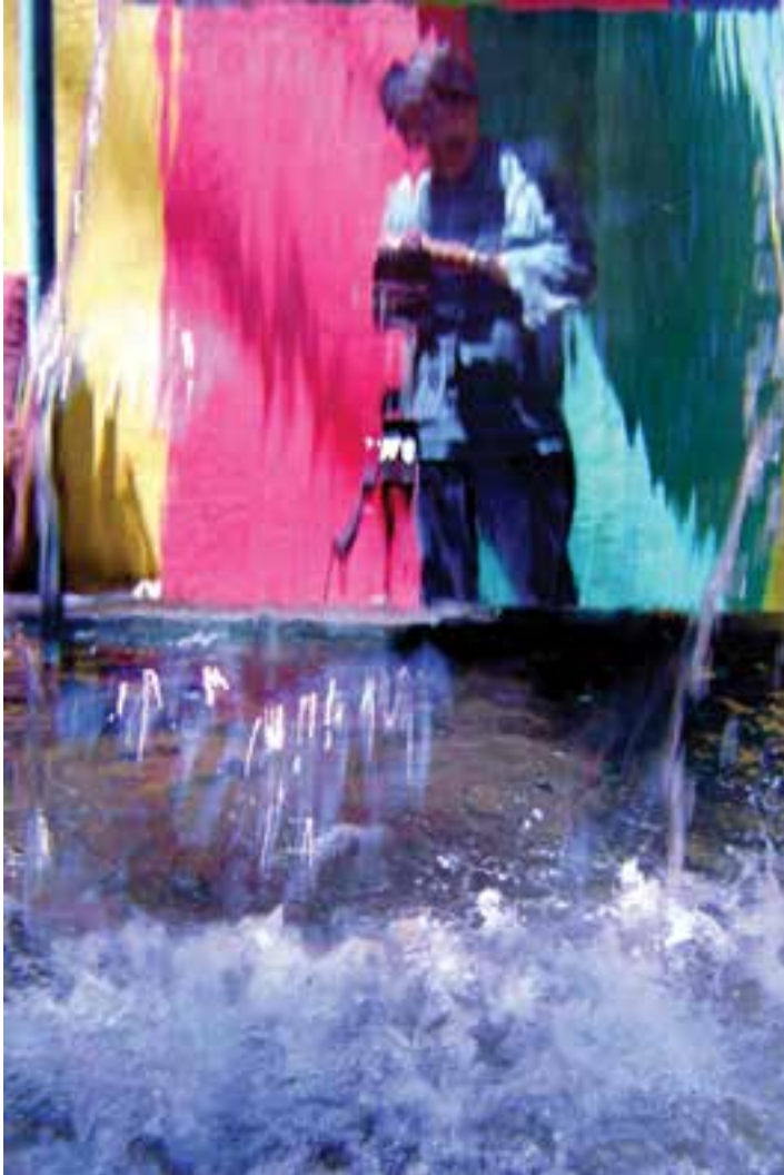
شکل ۳۲-۵- با قرارگیری عکاس در پشت یک آبشار و عکس برداری از منظرهٔ روبرو، این عکس پدید آمده است.

نگریستن برای رفع نیازهای روزمره از قبیل نگاه کردن به اجسام، پرهیز از خطر احتمالی که در مسیر حرکت وجود دارد، خواندن، نوشتن و غیره انجام می‌گیرد. اما وقتی نگریستن با فکر و تأملی عمیق‌تر درآمیزد و نگاه ساده با درک و احساس به هم آمیزد، حاصل کار؛ نگرش اندیشمندانه، بیشش یا نوعی دیدگاه است (شکل ۳۳-۵).