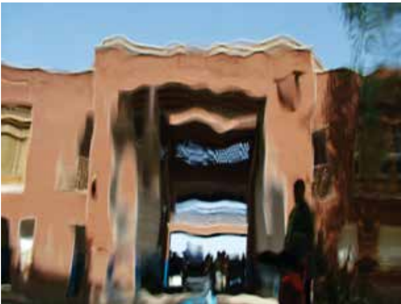
شکل ۳۴-۵. قرارگیری عکاس در پشت یک آبشار و عکس‌برداری از منظرهٔ ساختمان، این تصویر را به وجود آورده است.

یک اثر تصویری و به ویژه یک عکس خوب، زائیدهٔ اتفاق نیست، بلکه براساس کشف ارتباط بین عناصر موضوع، تفکر، تأمل و نوع نگرش عکاس دربارهٔ آنهاست که در قالب تصویر به نمایش درمی‌آید (شکل‌های ۳۴-۵ تا ۳۶-۵).