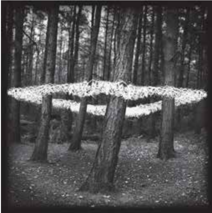
شکل ۵-۱۳- این عکس به‌روش نقاشی با نور و با چرخاندن نور در اطراف درختان در تاریکی ایجاد شده است.

در این روش، نور به مانند قلم و رنگ سطح حساس، هم‌چون کاغذ، به کار گرفته می‌شود. با به‌کارگیری یک چراغ قوه ۲ دستی کوچک، می‌توان طرحی از انسان یا اشیای دیگر بر روی سطح حساس ثبت کرد. این روش، در عکس‌برداری تبلیغاتی و ایجاد تصاویر خلاق کاربرد زیادی دارد و نقاشی یا طراحی با نور نامیده می‌شود (شکل ۵-۱۳).