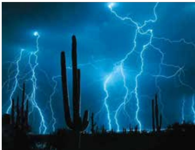
شکل ۵-۲۴- عکس برداری از آذرخش با به‌کارگیری سرعت «B»

می‌کنید بیش‌ترین آذرخش روی دهد قرار دهید و حلقه فاصله را روی بینهایت ( \infty ) تنظیم کنید. سپس دیافراگم متوسطی (f:8) را انتخاب کرده و به وسیله سیم دکلاشر، دکمه شاتر را فشار دهید. پس از مدتی که چند آذرخش زده شد، دکمه شاتر را رها کنید (شکل ۵-۲۴).