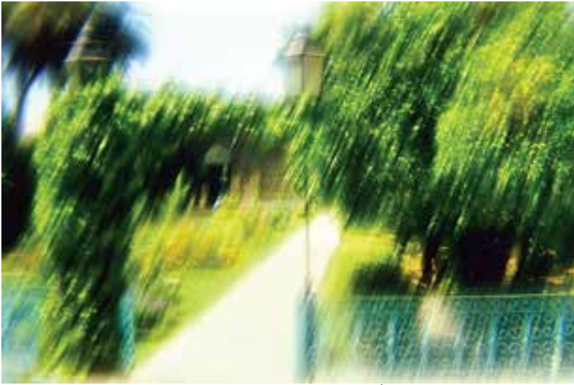
شکل ۵-۷- ایجاد حالتی خیال انگیز با به کارگیری فیلتر ایجاد جلوهٔ محو

به کارگیری این تکنیک در عکس برداری از چهره، طبیعت بیجان و مناظر، نتایج جالبی را به همراه خواهد داشت (شکل های ۵-۸، ۵-۹، و ۵-۱۰).