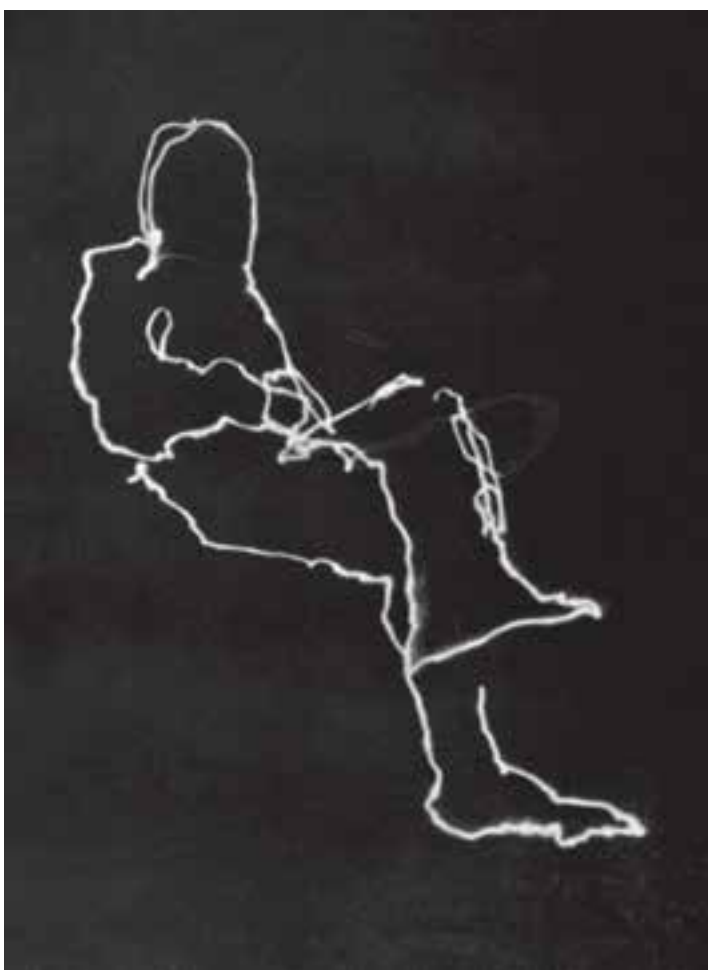
شکل ۱۴-۵- طراحی با نور از شخصی که بر روی صندلی و در تاریکی نشسته است.

برای طراحی با نور از اندام انسان، لازم است تا شخصی در فاصله ۳ یا ۴ متری در برابر دوربین قرار گیرد. برای شروع طراحی با نور لازم است که تمامی چراغ‌ها خاموش و اتاق کاملاً تاریک شود. سپس ضامن دکلاشر سیمی را فشرده و پیچ قفل آن را ببندید. در این حالت، دریچه شاتر باز شده و دوربین آماده عکس برداری است. برای ثبت خطوط محیطی بدن شخص بر روی سطح حساس، باید چراغ قوه را روبه لنز دوربین گرفته و پس از روشن کردن آن، درست در اطراف بدن شخص، حرکت دهید. برای ثبت یکنواخت ضخامت نوری که بر سطح حساس عکس برداری می‌شود، لازم است تا حرکت چراغ قوه به صورت یکنواخت و بدون درنگ باشد (شکل‌های ۱۴-۵ تا ۱۶-۵).