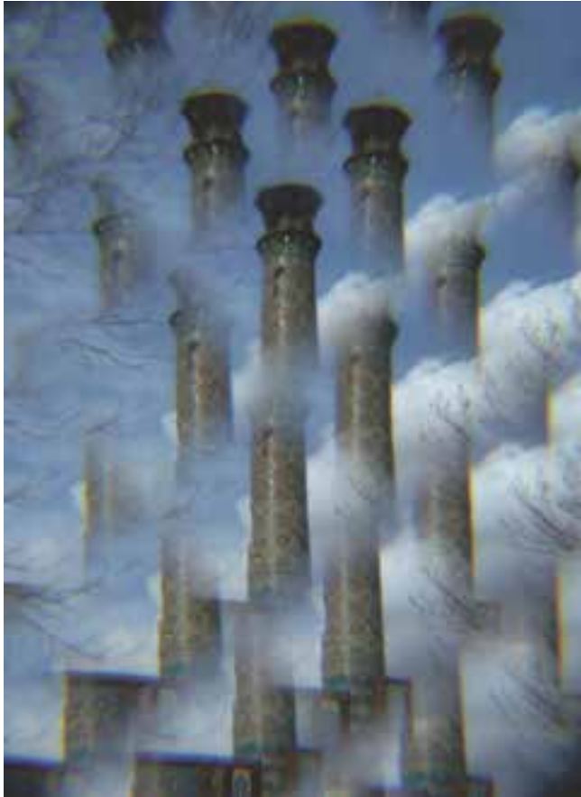
شکل ۵-۱- با به کارگیری فیلتر منشوری در جلوی لنز دوربین عکاسی ایجاد شده است.

با به کارگیری فیلترهای منشوری و فیلترهایی که اثر آینه را به وجود می آورند می توان تصویر یک موضوع را تکرار کرد (شکل ۵-۱).