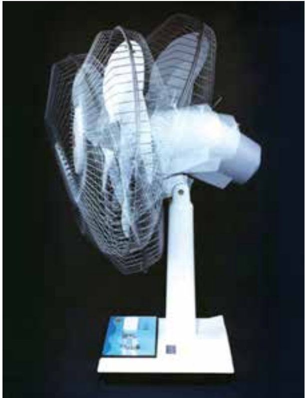
شکل ۲۰-۵- عکس برداری تبلیغاتی با تکنیک اوپن فلاش، برای تبلیغ ویژگی های کالا