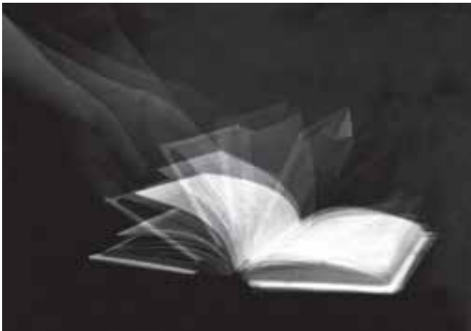
شکل ۲۳-۵- با استفاده از سرعت B، فضایی کاملاً تاریک و زدن فلاش‌های پی‌درپی به هنگام حرکت موضوع، می‌توان چنین تصویری را خلق کرد.

با پایان گرفتن حرکت موضوع، قفل سیم و دکلاشور را باز کنید تا درجه شاتر بسته شود. بدین ترتیب، بر روی صفحه حساس، حرکت حالت‌های گوناگونی از موضوع متحرک ثبت می‌شود (شکل ۲۳-۵). اگر به جای نور مقطعی فلاش، نور پیوسته‌ای مانند نورافکن را به موضوع بتابانید، تمامی حرکات، محو و کشیده ثبت می‌شوند.