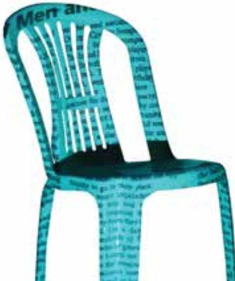
شکل ۲۸-۵- نمایش تصویر یک روزنامه بر روی صندلی

باید توجه داشت که خلاقیت، نقش بسیار تعیین‌کننده‌ای در اجرا و به‌کارگیری تکنیک‌های عکاسی دارد. جوهره و ارزش چنین تصاویری در ایده و فکر عکاس رقم می‌خورد، زیرا بسیاری از تکنیک‌ها از بیخ و خم خاصی برخوردار نبوده و با تمرین و مطالعه می‌توان آنها را فراگرفت. اجرای تکنیک‌ها بدون توجه به محتوایی هدفدار، نمی‌تواند ارزش چندانی داشته باشد. در این میان، با خلاقیت و ذهنیت پرورش یافته خود، می‌توانید دامنه‌ی این روش‌ها را گسترش دهید و تصاویر جالبی بیافرینید. در این روش به‌جای تاباندن تصویر بر روی حجم‌ها، می‌توان تصاویر را بر روی چهره‌ی افراد نیز نمایش داد. (شکل ۲۸-۵). در صورت نبودن دیتا پروژکتور، می‌توان با قرار دادن تطلق‌های انیمیشن نقاشی شده روی یک چراغ مطالعه نیز تصاویر زیبایی به‌دست آورد.