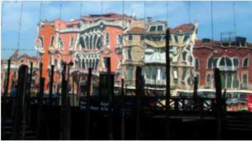
شکل ۳۳-۵. بازتاب ساختمان‌های روبرو در سطوح فلزی یک ساختمان سبب پدید آمدن این تصویر شده است.

یک اثر تصویری و به ویژه یک عکس خوب، زائیدهٔ اتفاق نیست، بلکه براساس کشف ارتباط بین عناصر موضوع، تفکر، تأمل و نوع نگرش عکاس دربارهٔ آنهاست که در قالب تصویر به نمایش درمی‌آید (شکل‌های ۳۴-۵ تا ۳۶-۵).