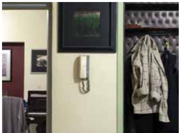
تصویر ۷-۴- یک پله بیش نوردهی