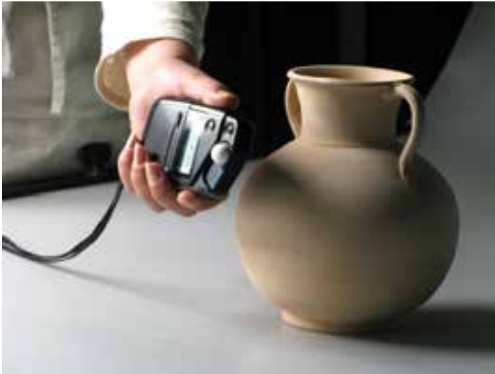
تصویر ۱۰-۷- نورسنجی مستقیم

معمولاً کمترین خطا را دارد و تیرگی و روشنی موضوع و بازتاب‌های آن تأثیری در نورسنجی نخواهد داشت. (تصویر ۱۰-۷) گاه برای به دست آوردن نتیجه بهتر لازم است از هر دو روش به صورت ترکیبی استفاده کنیم.