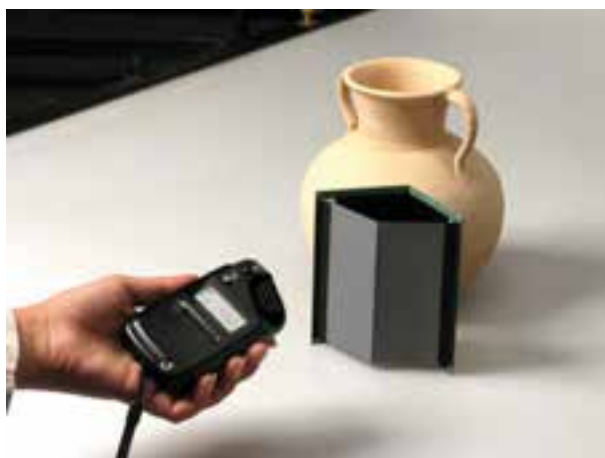
تصویر ۹-۷- نورسنجی بازتابی از کارت خاکستری

نورسنجی بازتابی استفاده از کارت خاکستری یا بازتاب دهنده ۱۸٪ است. علت این نام گذاری آن است که اگر ۱۰۰ واحد نور به این کارت بتابد تنها ۱۸٪ آن را بازتاب می‌دهد. فاصله این کارت درست در میانه سفید و سیاه قرار گرفته است. برای نورسنجی دقیق به روش بازتابی، کارت را در محل موضوع قرار داده و از آن نورسنجی می‌کنیم. (تصویر ۹-۷)