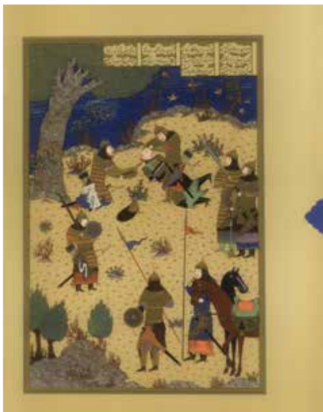
تصویر ۶-۹- نمونه ای از تصویر کپی برداری شده

اغلب به منظور چاپ یک تابلوی نقاشی یا یک عکس در کتاب باید از آن یک کپی خوب و دقیق تهیه کنیم. اگر چه با تحولی که فن آوری دیجیتال ایجاد کرده است این کار تا حدودی توسط اسکنرها انجام می شود. امروزه اسکنرها قادرند حتی تابلوهای نقاشی در ابعاد بزرگ را اسکن کرده و تصاویری بسیار دقیق از آن ها به دست دهند. (تصویر ۶-۹)