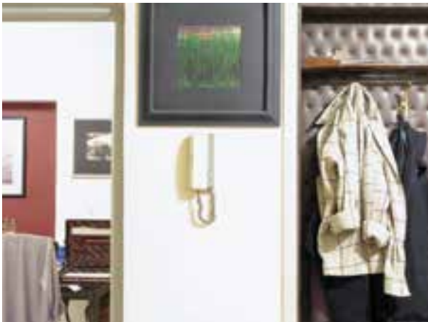
تصویر ۷-۳- دوبله پیش نوردهی

گاهی استفاده از این روش باعث ایجاد تأثیرات مطلوب زیبایی شناسانه می گردد. میزان نور محیط هر چقدر که باشد، می توانیم با کم نوردهی و بیش نوردهی آنجا را روشن تر یا تیره تر نشان دهیم. (تصاویر ۷-۳ تا ۷-۷) دو روش اصلی برای نورسنجی وجود دارد که موضوع بحث ماست. هر یک از شیوه ها نکات بسیار ظریف و دقیقی دارد که نیازمند تجربه و تمرین است.