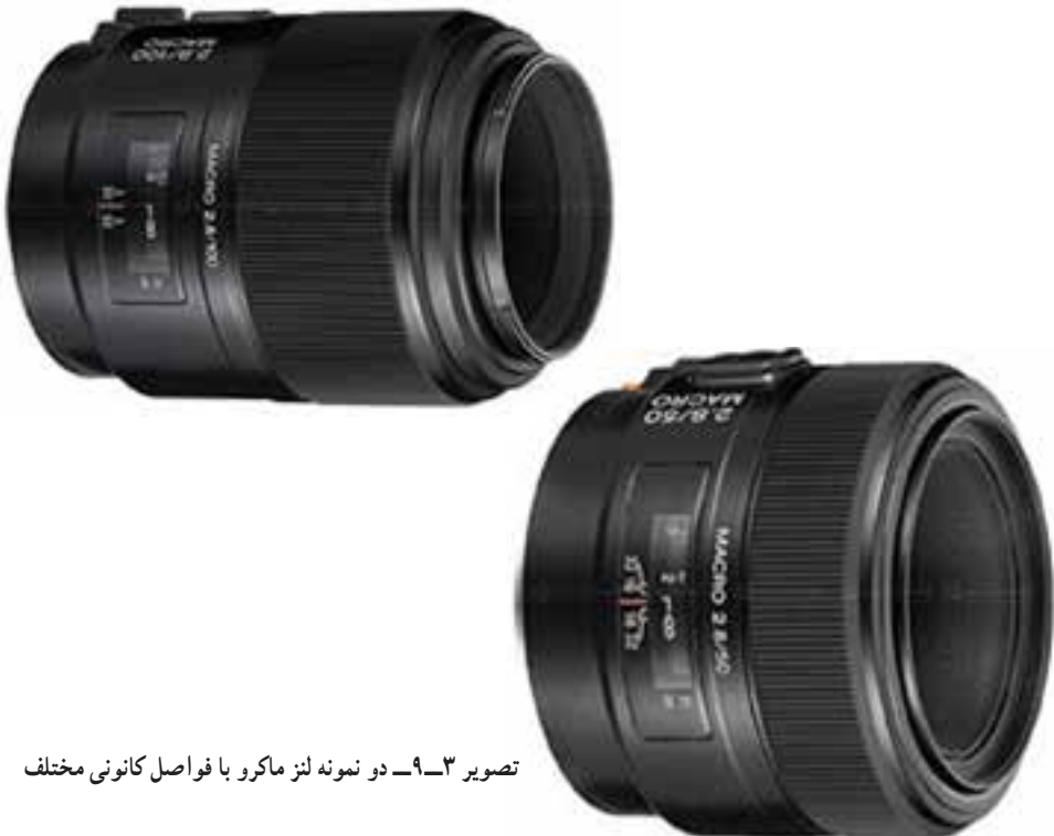
تصویر ۳-۹ دو نمونه لنز ماکرو با فواصل کانونی مختلف

۲- استفاده از لنزهای نمای نزدیک: ارزان‌ترین روش تهیه عکس‌های ماکرو استفاده از لنزهای نمای نزدیک است، این لنزها که گاهی به غلط به آن فیلتر کلوز آپ هم می‌گویند، در واقع عدسی‌های همگرایی هستند که با قدرت‌های متفاوتی ساخته می‌شوند. با بستن آن‌ها روی لنزهای