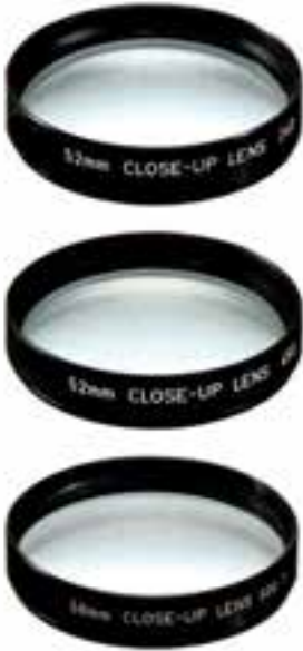
تصویر ۹-۴- لنزهای کلوزآپ

معمولی می‌توانیم تصاویر درشتی از اشیای کوچک تهیه کنیم. عکس‌های تهیه شده با عدسی کلوزآپ دارای کیفیت چندان بالایی نیستند. (تصویر ۹-۴) توجه داشته باشید که هنگام استفاده از این عدسی‌ها از دیافراگم‌های بسته مثل f.11 یا f.16 استفاده کنید، این کار علاوه بر افزایش وضوح تصویر در گوشه‌ها، روی کنتراست و رنگ عکس نیز تأثیرات مثبتی خواهد گذاشت.