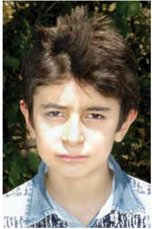
عکاسی با فلاش در نور روز