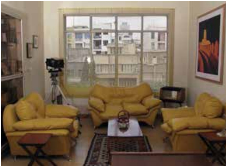
تصویر ۴-۸ - عکاسی با فلاش