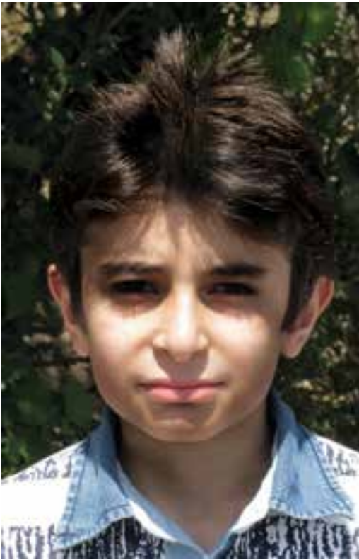
عکاسی بدون فلاش در نور روز

استفاده از فلاش منحصر به شب و فضاهای تاریک نیست گاهی اوقات در روز هم از فلاش استفاده می‌کنیم مثلاً هنگامی که از چهره کسی زیر نور آفتاب عکس می‌گیریم برای از بین بردن سایه‌های تند صورت می‌توانیم از فلاش استفاده کنیم. (تصویر ۲-۸) هم چنین برای ایجاد تعادل بین نور بیرون پنجره و داخل اتاق استفاده از فلاش راه حل ساده و مناسبی است. (تصاویر ۳-۸ و ۴-۸)