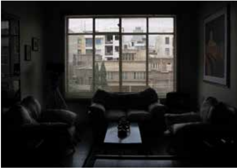
تصویر ۳-۸ - عکاسی بدون فلاش