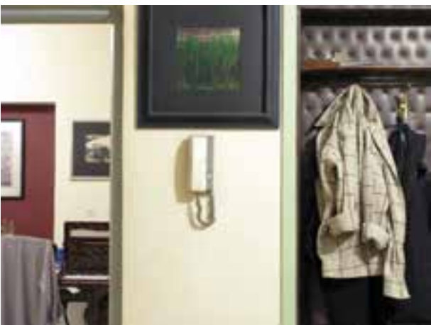
تصویر ۷-۵- نوردهی نرمال