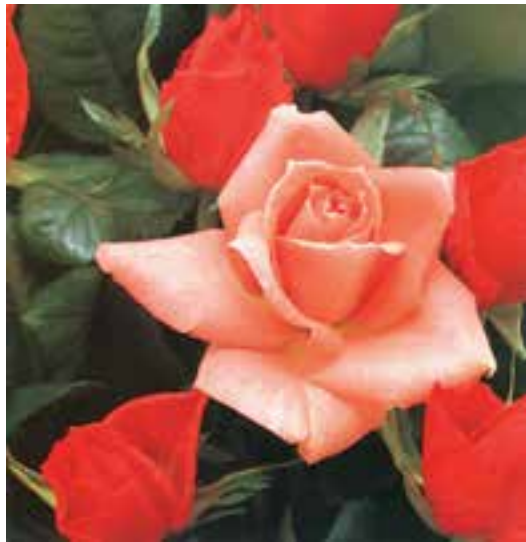
تصویر ۹-۲ - نمونه عکسی که با لنز ماکرو تهیه شده است.