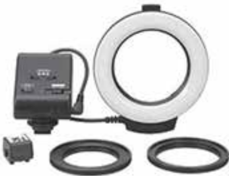
تصویر ۹-۵- فلاش حلقوی