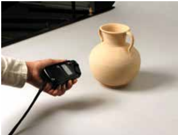
تصویر ۸-۷- نورسنجی بازتابی از موضوع

علت این نام گذاری آن است که نورسنج، نورهای بازتابیده از موضوعات را محاسبه می کند. این روش به دلیل وابستگی به بازتاب های موضوع در پاره ای از موارد ممکن است خطا داشته باشد. (تصویر ۸-۷).