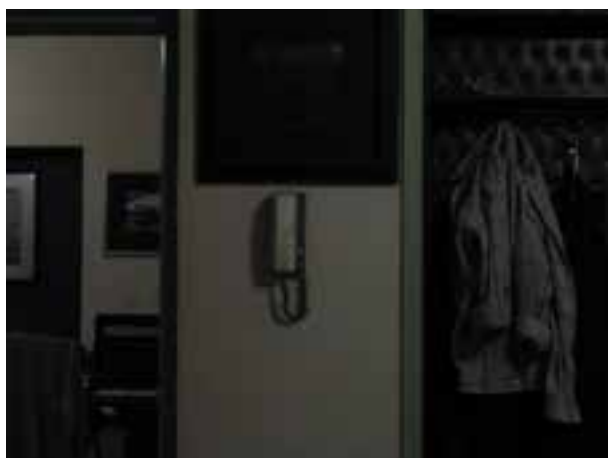
تصویر ۷-۶- یک پله کم نوردهی