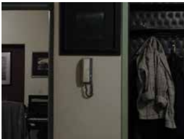
تصویر ۷-۷- دو پله کم نوردهی