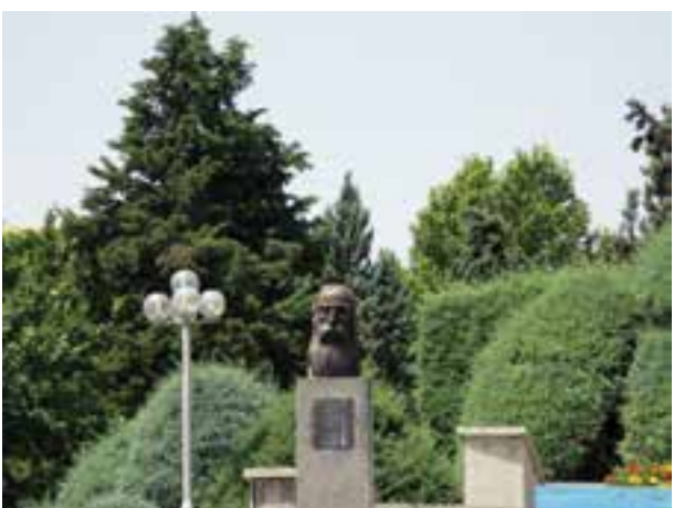
تصویر ۵-۶- لنز تله