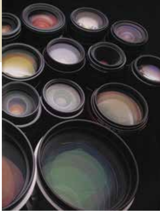
تصویر ۲-۶- پوشش های روی لنز رنگی دیده می شوند.