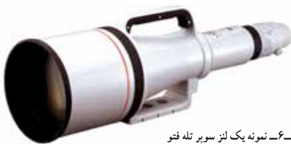
تصویر ۶-۶- نمونه یک لنز سوپر تله فتو