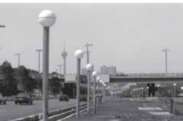
تصویر ۶-۲۲_ لنز نرمال

تصاویر ۶-۲۱، ۶-۲۲ و ۶-۲۳ تنها لنزهای نرمال هستند که تصویری بسیار شبیه به آنچه که با چشم می‌بینیم در اختیار ما می‌گذارند و لنزهای واید تصویری خلق می‌کنند که به دلیل پرسپکتیو ویژه آن‌ها پیرانرژی‌تر به نظر می‌رسند. و بر عکس لنزهای تله به دلیل زاویه بسته شان معمولاً عناصر کمتری را در عکس جای داده و تصاویرشان به نوعی آرام‌تر به نظر می‌رسد. تصاویر صفحه بعد این ویژگی را نشان می‌دهند (تصاویر ۶-۲۴ تا ۶-۲۶).