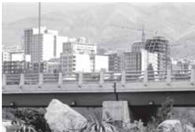
تصویر ۱۷-۶- لنز نرمال