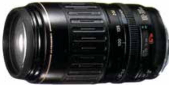
تصویر ۱۲-۶- لنز زوم با مشخصات ۱۰۰-۳۰۰ f.4.5 5.6