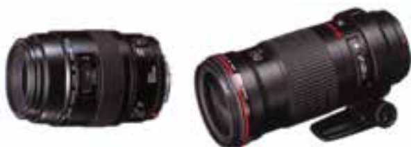
تصویر ۱۳-۶- دو نمونه لنز ماکرو با فواصل کانونی متفاوت

به جز لنزهای ذکر شده لنزهای دیگری هم در عکاسی به کار می رود که بسیار تخصصی است و استفاده همگانی ندارد.