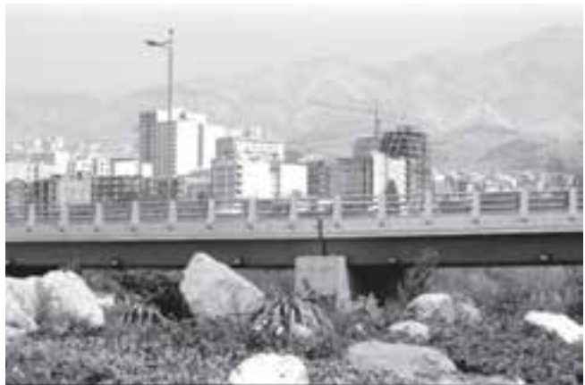
تصویر ۱۶-۶ - لنز واید