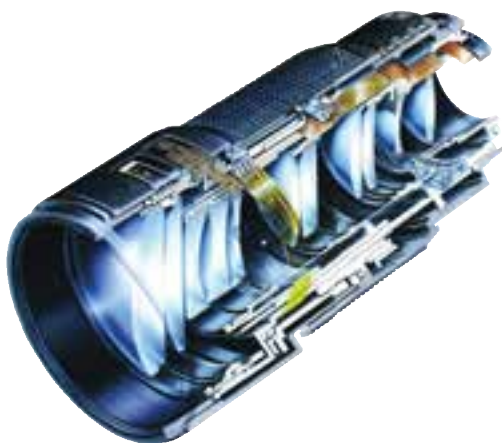
تصویر ۱-۶- تصویری از داخل یک لنز

تصویر تشکیل شده توسط یک عدسی ساده دارای معایب فراوانی است که برای از بین بردن این معایب چند عدسی همگرا و واگرا را با محاسبات دقیق و در فواصل معین از هم قرار می‌دهند، به این گونه عدسی‌ها عدسی مرکب می‌گویند. هر جا که کلمه لنز را به کار می‌بریم منظور مجموعه‌ای از عدسی‌هاست. (تصویر ۱-۶) برای بالا رفتن کیفیت تصویر و جلوگیری از اتلاف نور، روی عدسی‌های لنز را از مواد خاصی و به صورت لایه‌های بسیار نازکی می‌پوشانند علت این که وقتی به لنزها نگاه می‌کنیم سطح آنها را رنگی می‌بینیم همین است. (تصویر ۲-۶) حفاظت از این لایه‌ها بسیار مهم است تا آنجا که ممکن است، باید از کثیف شدن و در نتیجه پاک کردن لنزها خودداری نمود زیرا با از بین رفتن این پوشش‌های رنگی کیفیت لنزها افت خواهد کرد.