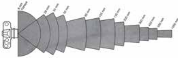
تصویر ۸-۶- دیاگرام زاویه دید لنزهای مختلف