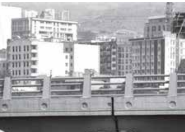
تصویر ۱۸-۶- لنز تله