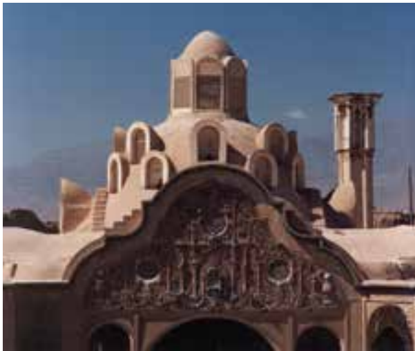
تصویر ۱۱-۶- لنز تله، خانه بروجردیها، کاشان