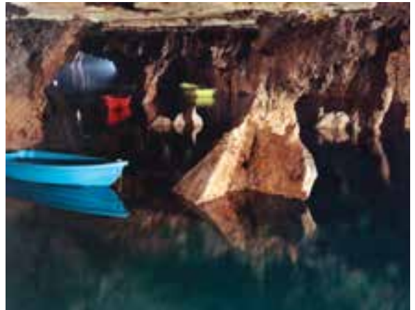
تصویر ۹-۶- لنز واید، غار علی صدر، همدان