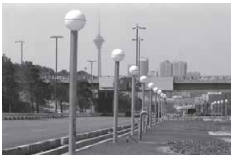
تصویر ۶-۲۳_ لنز تله