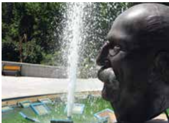
تصویر ۲۵-۶- لنز نرمال