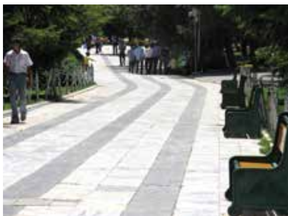
تصویر ۲۰-۶- پرسپکتیو لنز تله