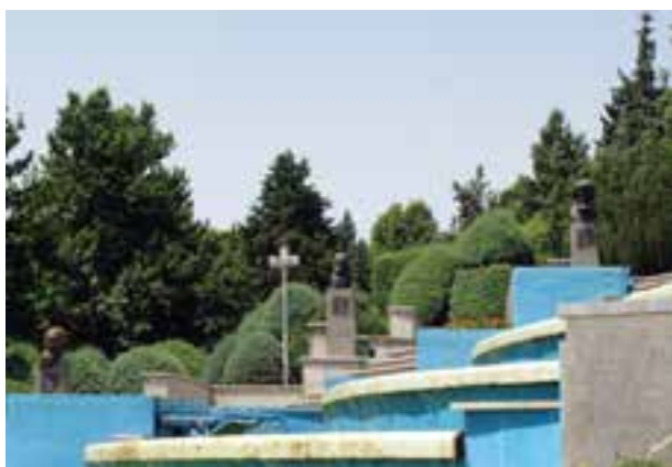
تصویر ۳-۶- لنز واید