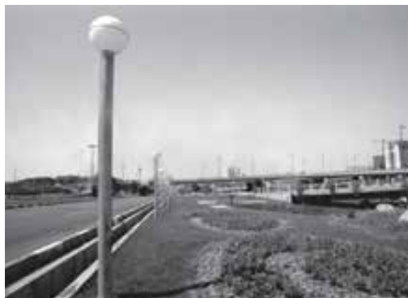
تصویر ۶-۲۱_ لنز واید