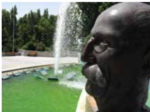
تصویر ۲۴-۶- لنز واید