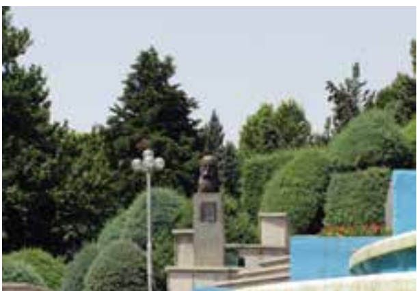
تصویر ۴-۶- لنز نرمال