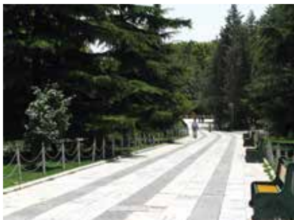
تصویر ۱۹-۶- پرسپکتیو لنز واید