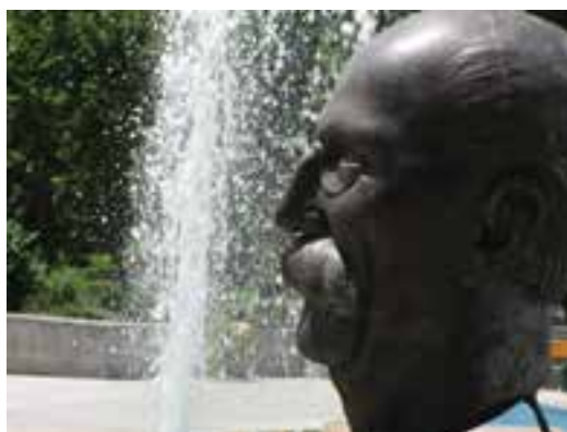
تصویر ۲۶-۶- لنز تله