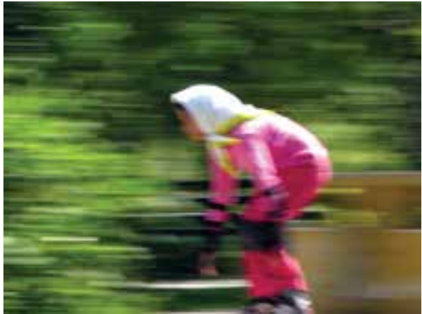
تصویر ۱۸-۵- اغراق در سرعت موضوع با انتخاب سرعت‌های پایین‌تر دوربین