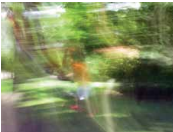
تصویر ۵-۱۶- استفاده نابه‌جا از کشیدگی تصویر