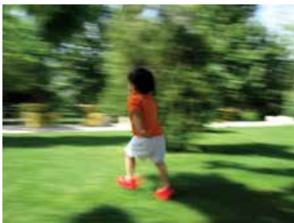
تصویر ۵-۱۵- استفاده از کشیدگی باید کنترل شده باشد

مثلاً در عکاسی از مسابقات ورزشی گاهی اوقات اندکی کشیدگی هیجان محیط را بهتر منتقل می‌کند. مشروط بر آنکه حد درستی انتخاب شده باشد. کشیدگی بیش از حد تصویر نه تنها زیبا نیست بلکه باعث عدم شناسایی مکان و موضوع خواهد شد. (تصویر ۵-۱۶)