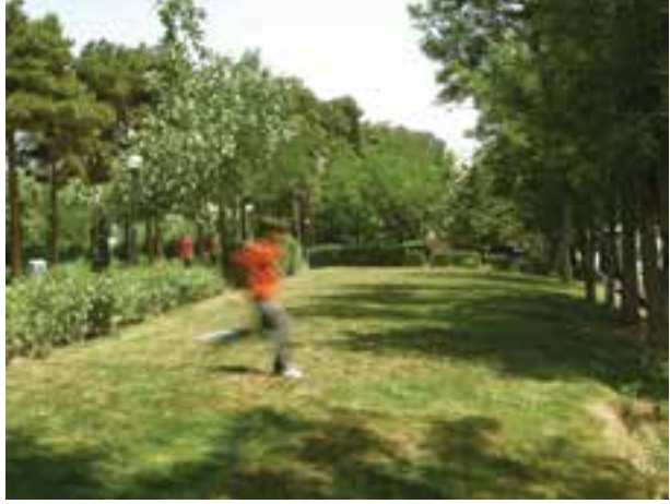
تصویر ۱۱-۵- حرکت موازی با دوربین