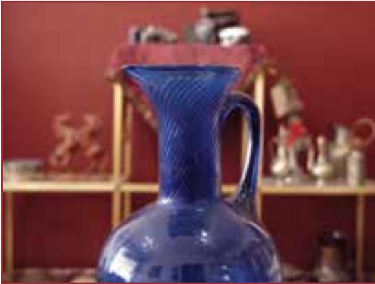
تصویر ۲-۵- عکسی که با f.16 گرفته شده است.