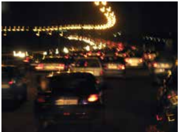
تصویر ۱۹-۵- تأثیر لرزش دست بر تصویر