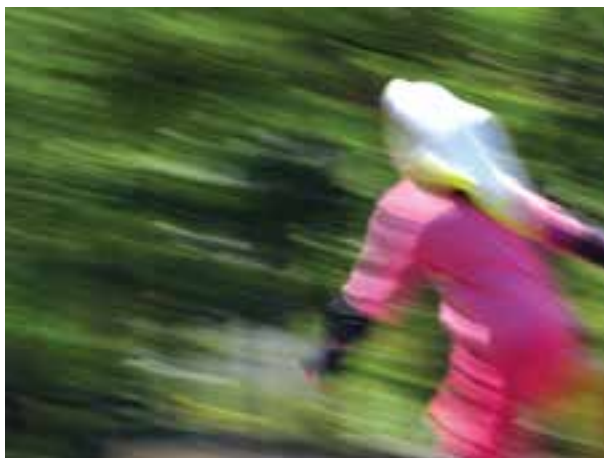
تصویر ۱۰-۵- کشیدگی تصویر

وقتی از اشیاء و اجسام متحرک که سرعت زیادی دارند عکس می‌گیریم باید متناسب با سرعت آنها، سرعت مسدودکننده را نیز بالا ببریم. مثلاً اگر قرار است از یک مسابقه اسب دوانی عکس بگیریم باید بدانیم که سرعت دوربین ما باید بالا و در حدود \frac{1}{1000} ثانیه باشد تا بتوانیم آنها را ثابت و دقیق نشان دهیم، به این کار منجمد کردن تصویر می‌گویند.