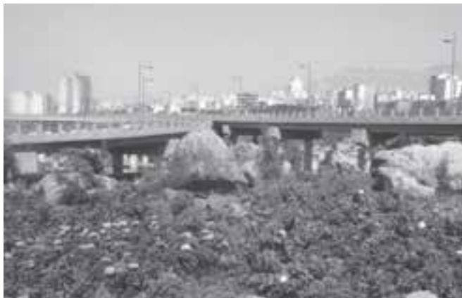
تصویر ۵-۵- لنز واید

سومین عاملی که در افزایش یا کاهش عمق میدان مؤثر است، فاصله کانونی لنزها است به این معنی که هر چه فاصله کانونی لنز کمتر باشد، عمق میدان وضوح بیشتر و هر چه فاصله کانونی بیشتر باشد عمق میدان وضوح کمتر خواهد شد، به عبارت ساده‌تر لنزهای واید دارای عمق میدان بیشتری نسبت به لنزهای تله هستند. (تصاویر ۵-۵ تا ۵-۷)