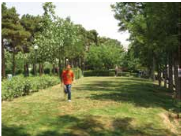
تصویر ۱۳-۵- حرکت عمود بر دوربین