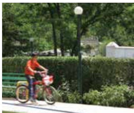
سرعت \frac{1}{15} ثانیه