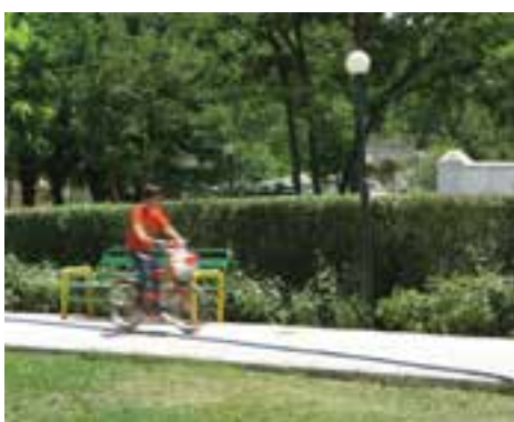
سرعت \frac{1}{8} ثانیه