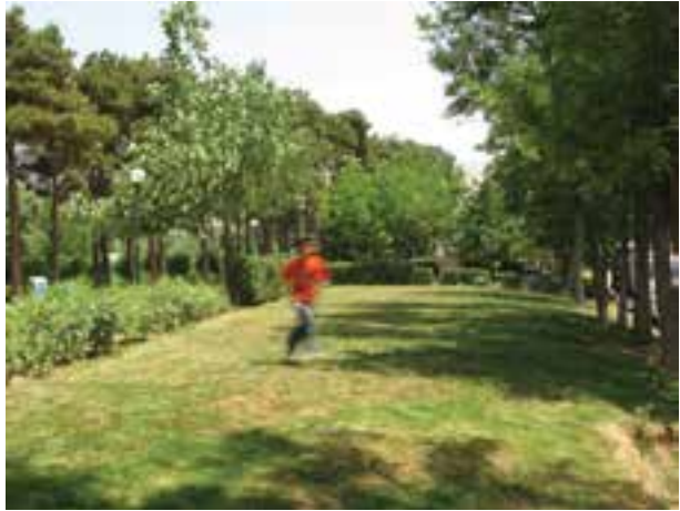
تصویر ۱۲-۵- حرکت مایل نسبت به دوربین