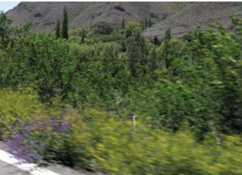
تصویر ۱۴-۵- موضوعات نزدیک کشیده شده‌اند اما موضوعات دور دست کاملاً واضح هستند.

گاهی اوقات ممکن است دوربین در حال حرکت و موضوع ساکن باشد. مثلاً تصور کنید که درون یک اتومبیل نشسته اید و از پنجره اتومبیل در حال عکسبرداری هستید، در این حالت هم کلیه قوانین ذکر شده در حالت اول صادق هستند و چه بسا شدیدتر. سعی کنید در چنین مواردی تا آن‌جا که ممکن است از لنزهای واید استفاده کنید و موضوعاتی را انتخاب کنید که فاصله بیشتری با شما دارند. (تصویر ۱۴-۵)