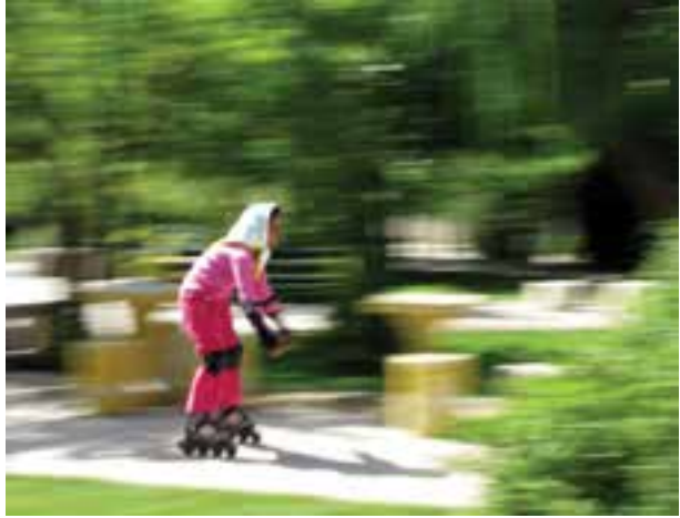
تصویر ۱۷-۵- روش پانینگ