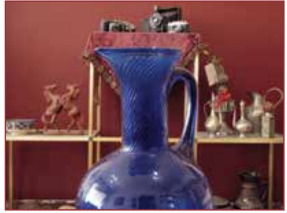
تصویر ۱-۵- عکسی که با f.2.8 گرفته شده است.

مثلاً اگر با یک دیافراگم ثابت مثل f.8 یک بار روی موضوعی در 5^\circ سانتی متری دوربین واضح سازی کنیم و بار دیگر روی فاصله 15^\circ سانتی متری، خواهیم دید که عمق میدان وضوح در عکس دوم بسیار بیشتر از عکس اول است با این که دیافراگم در هر دو عکس یکی بوده است (تصاویر ۳-۵ و ۴-۵).