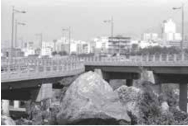
تصویر ۶-۵- لنز نرمال