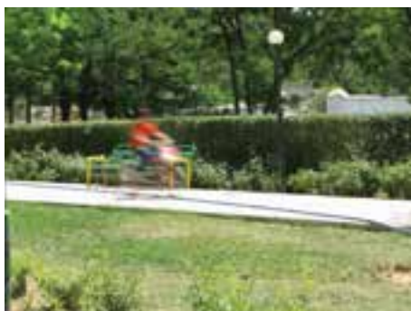
سرعت \frac{1}{4} ثانیه