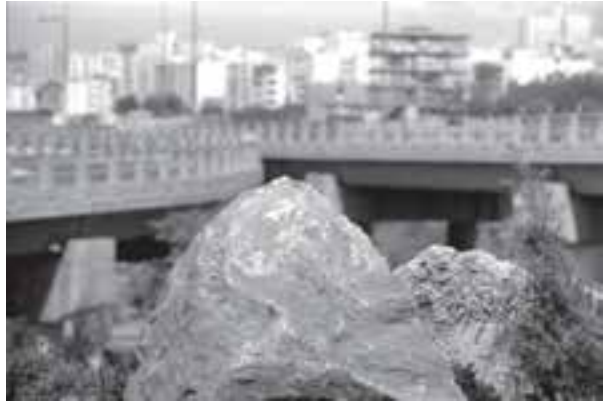
تصویر ۷-۵- لنز تله