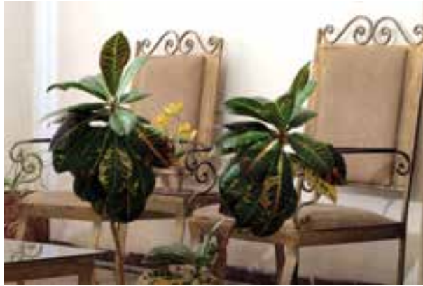
تصویر ۴-۵- فاصله از اولین موضوع 15^\circ سانتی متر