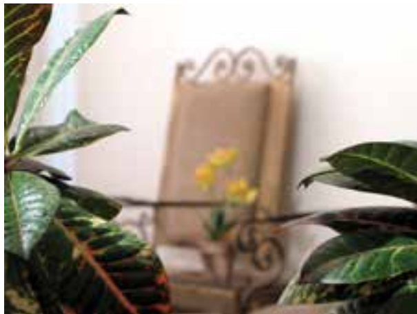
تصویر ۳-۵- فاصله از اولین موضوع 5^\circ سانتی متر

برای استفاده از این خاصیت بعضی از اوقات به جای اینکه تنظیم فاصله را روی نقطه دورتری انجام بدهیم، فاصله خودمان را تا موضوع بیشتر می کنیم.