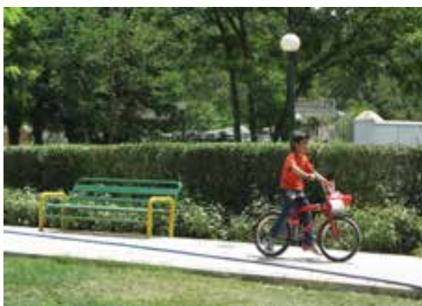
سرعت \frac{1}{125} ثانیه

تصویر ۹-۵- تأثیر سرعت‌های مختلف بر موضوعات متحرک