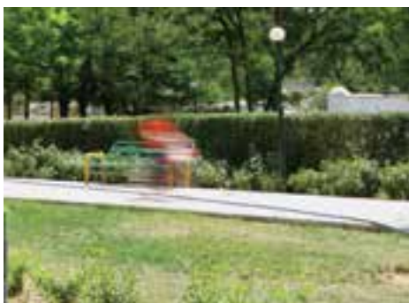
سرعت \frac{1}{3} ثانیه