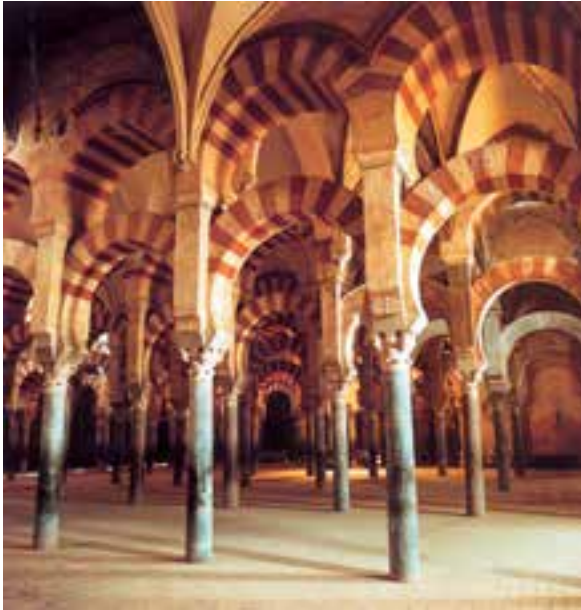
معماری مسجد مسلمانان — اسپانیا

سرگذشت مردی اشرافی و در عین حال سفیهی به نام دن کیشوت را که مجذوب داستان‌های قهرمانان گذشته شده، با زبان مضحک و در عین حال غم‌انگیز، بیان می‌کند. دن کیشوت، به امید انجام کارهای خیر (همچون شوالیه‌ها) به سیر و سفر می‌پردازد. او سراسر، نجابت و شرافت است، لیکن در قالبی احمقانه. سروانتس در این داستان، نه فقط اشراف روبه زوال اسپانیا، بلکه خود اسپانیا را به نقد می‌کشد.