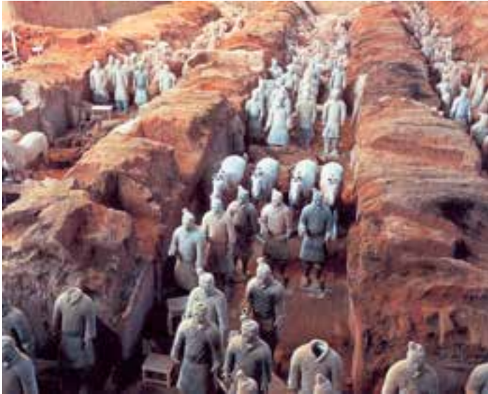
مقبره‌ی امپراتور شی‌هان‌دی - منطقه‌ی زیان‌شان‌زی - چین

نظر به این‌که تقسیم دوران‌های تاریخی به سه بخش قرون قدیم، قرون میانه و قرون جدید، ابتدا از سوی مورخان اروپایی به میان آمده، طبیعی است که در مورد سرزمین‌ها و ملت‌های اروپایی به کار رفته باشد.