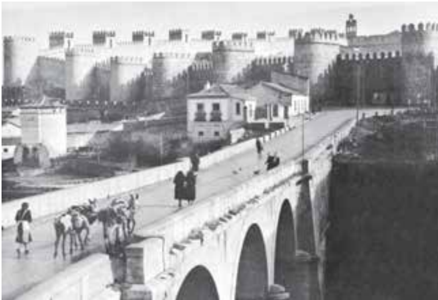
دیواره‌های شهر باستانی آویلا - مرکز اسپانیا - ساخت مسلمانان شمال آفریقا

در قرون وسطی تنها یک کشور بود که کاملاً از دایره‌ی درگیری زبان لاتین و زبان‌های عامیانه بیرون می‌زیست و آن اسپانیای مسلمان بود که ادبیات و به طور کلی تمدن اسلامی آن تأثیر عظیمی در دنیای غرب داشت. شعر عربی آندلس در قرون دهم و یازدهم، شاید به استثنای شعر سلتی، یگانه شعر غیر لاتینی بود که در دنیای غرب حایز اهمیت بود. این شعر مستقیماً از شرق و به خصوص از بغداد می‌آمد که در آن زمان مرکز علمی و ادبی جهان اسلام بود. در اسپانیا نیز «قرطبه» چنین مقامی داشت. از این رو می‌توان شعر و تاریخ‌نگاری مسلمانان اسپانیا را در ردیف زبان‌های ملی نوزاد قرار داد؛ زیرا شاخه‌ای از شعر و تاریخ‌نگاری شرق مسلمان بود و چه شاخه‌ی سترگی! شعری که با همه‌ی ظرافت‌های آثار شاعران دربار خلفای بغداد برابری می‌کرد و ادبیات و فلسفه‌ای چنان غنی از اندیشه‌ی فلاسفه‌ی باستانی و مسایل انسانی، که می‌توان با استناد به آن، از نوعی انسان‌گرایی اسلامی اسپانیا سخن گفت. چنان که گفتیم غرب بیگانه با ادبیات و فلسفه‌ی یونان قدیم، از طریق اسپانیای مسلمان بود که دوباره با آثار بزرگان باستان آشنا شد.