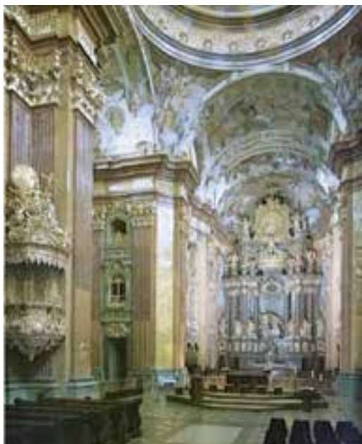
کلیسا - معماری دوران مسیحیت

ادبیات اروپا معمولاً با مکتب کلاسیک آغاز می‌شود. اساسی‌ترین تعریفی که از این مکتب ارایه می‌شود «بازگشت به هنر قدیم یونان و روم به تبع نهضت رنسانس و اومانیزم» است. امپراتوری روم غربی (در قرن پنجم میلادی) حتی پیش از سقوط، ارتباط خود را با فرهنگ و ادب یونان بریده بود و وارث فرهنگ یونانی، و حتی مرکز قدرت امپراتوری روم شرقی بود. در غرب به علت رسمیت یافتن زبان لاتین به جای یونانی، حتی در قرون چهارم و پنجم، بی‌توجهی به زبان و فرهنگ یونانی نیز تشدید شده بود.