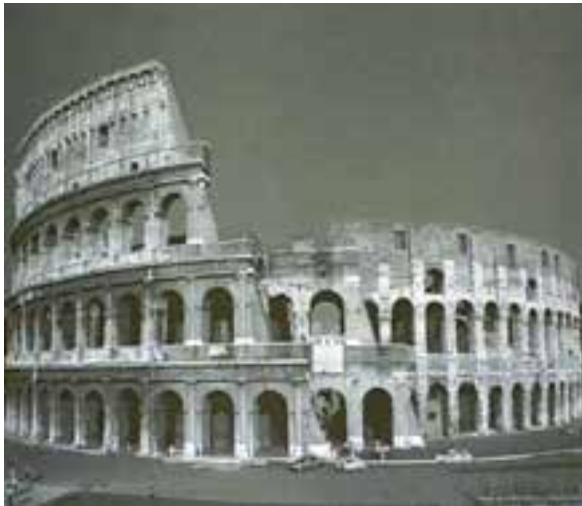
کلوزیوم - رُم ایتالیا

قرن پنجم قبل از میلاد، روم شاهد برتری نظامیان در امور مملکتی بود که قدرت مطلقه‌ی فرمانروایان را به هم ریخت و شالوده‌ی نظام جدیدی به نام جمهوری را به کار بست. آن‌چه که در ادبیات روم قابل تأمل است این است که ادبیات یونانی چنان بر زندگی مردم روم نفوذ کرده بود که نویسندگان رومی آثار خود را به تقلید از نویسندگان یونانی می‌نوشتند. «آندروونیکوس» که خود یونانی‌الاصل بود پدر ادبیات روم شناخته می‌شود. او اودیسه‌ی هومر را به زبان لاتین ترجمه کرد (حدود ۳۴۰ ق.م).