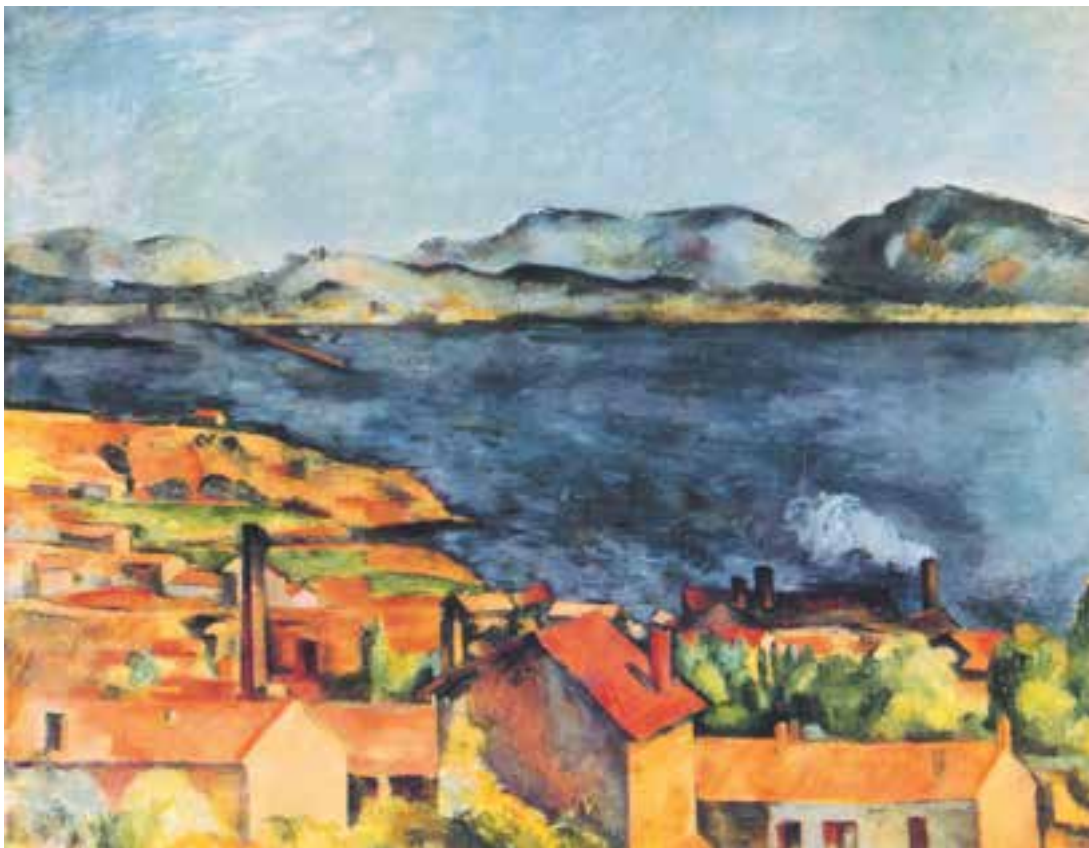
تصویر ۲-۳۲- اثر یل سزان، رنگ روغن روی بوم، (۸۰×۹۷/۷ سانتی‌متر)