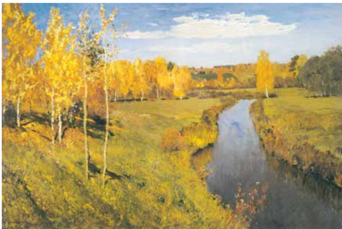
تصویر ۲-۲۶- اثر ایزاک لویتان، رنگ روغن روی بوم، (۸۲×۱۲۶ سانتی‌متر)

در تصویر (۲-۲۶) پاییز طلایی اثر ایزاک لویتان ۱ ، با وجود رنگهای آبی، حاکمیت بارنگهای گرم و به خصوص زرد است. تصویر (۲-۲۷) نیز حاکمیت رنگ گرم را نشان می‌دهد.