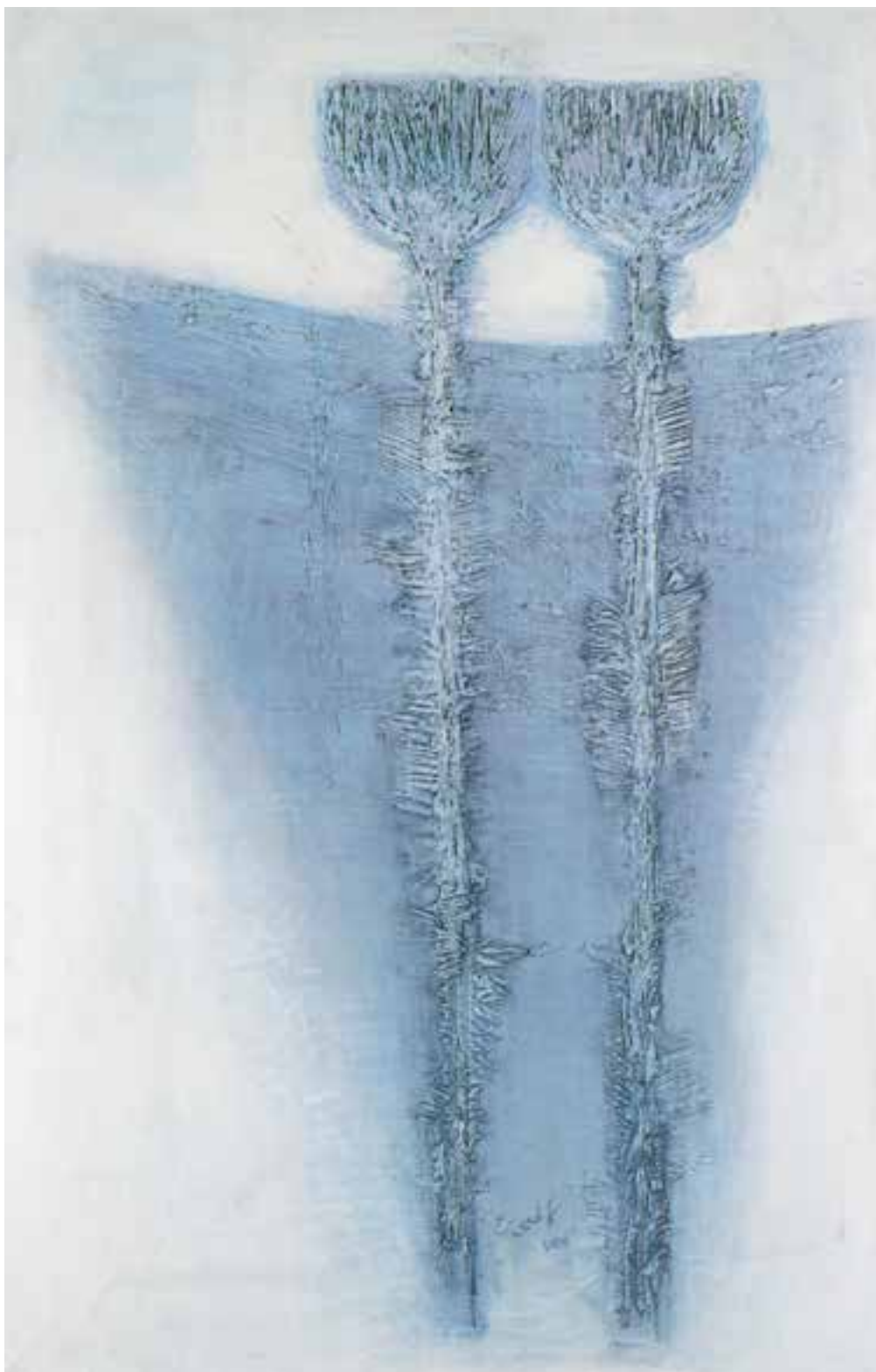
تصویر ۴۲-۲- اثر حسین کاظمی، رنگ روغن روی بوم، (۹۰×۱۴۰ سانتی متر)