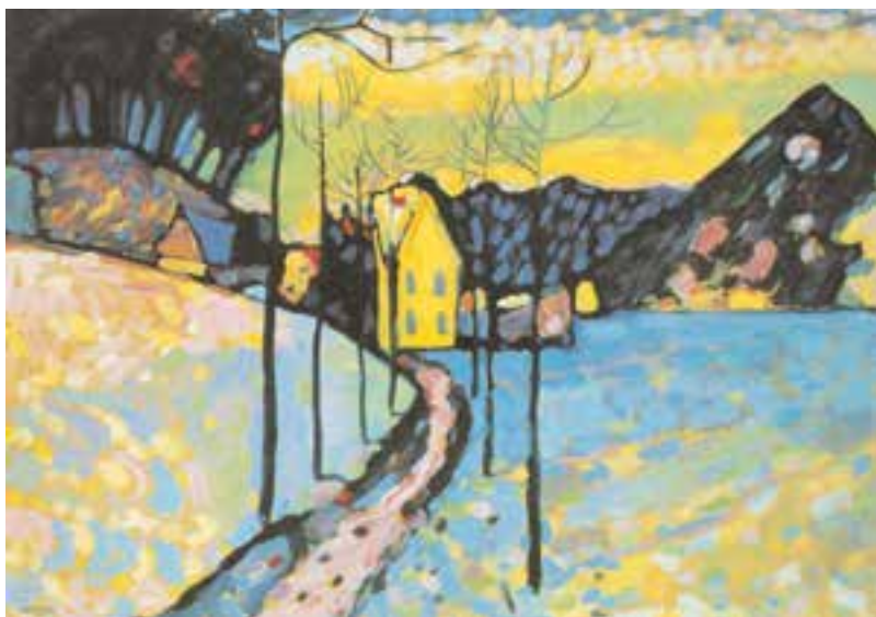
تصویر ۱۷-۲- اثر واسیلی کاندینسکی ۱ ، رنگ روغن روی چوب، (۹۷/۵×۷۱/۵ سانتی‌متر)