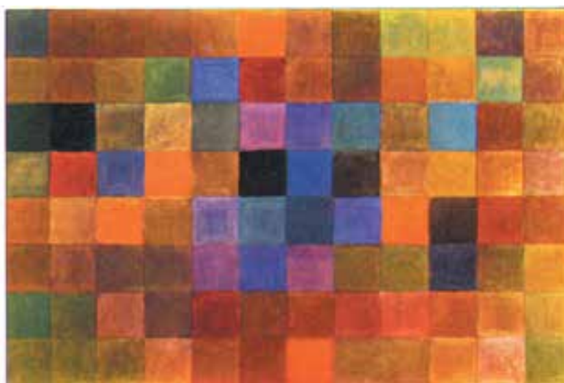
تصویر ۲۰-۲- پاییز