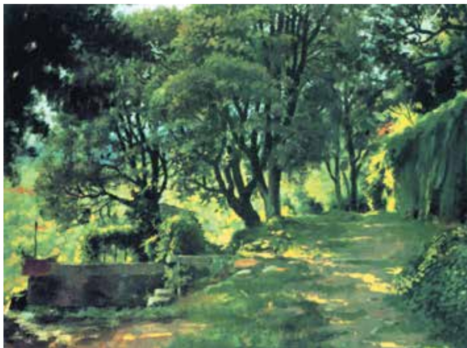
تصویر ۲۸-۲- اثر خوزه پارامون، رنگ روغن روی بوم، حاکمیت رنگ سرد

شما می توانید همانند تمرین قبل عمل کنید. منتهی این بار از مجموعه رنگهای خالص سرد در کنار رنگهای ترکیبی سرد بهره بگیرید. حتی مناطق گرم شما در نقاشی نیز با اندکی رنگ سرد ترکیب می شود (تصاویر ۲۸-۲ و ۲۹-۲).