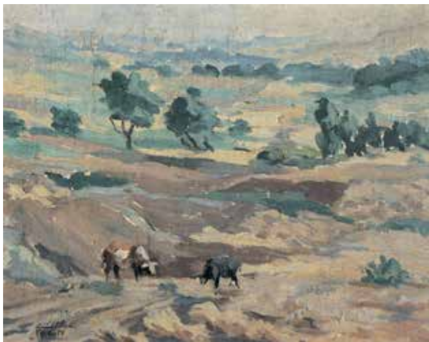
تصویر ۴۱-۲ اثر محمود جوادی پور ۲ ، رنگ روغن روی بوم، (۴۷×۶۰ سانتی متر)