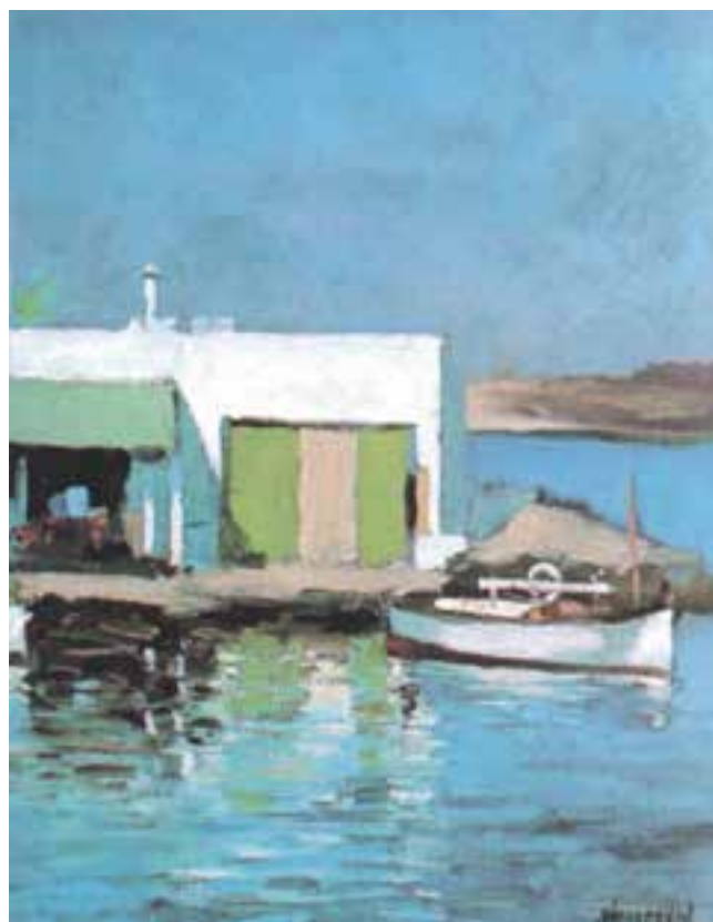
تصویر ۳۴-۲- اثر خوزه پارامون، رنگ روغن روی بوم