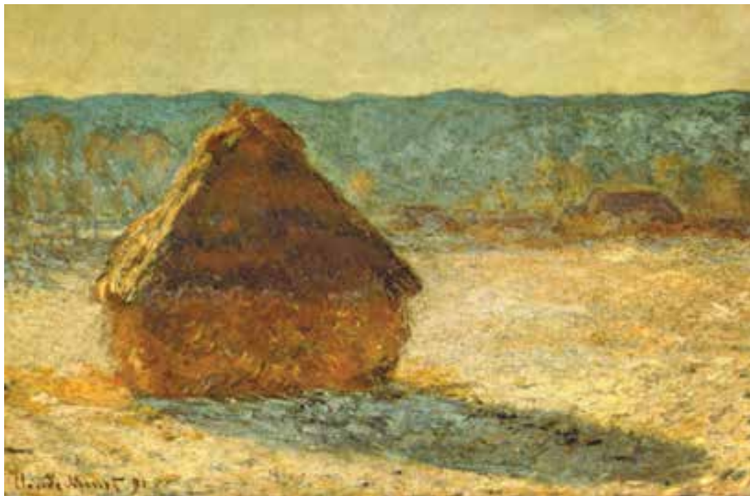
تصویر ۲-۲۲- اثر کلود مُنه، رنگ روغن روی بوم، (۸۹×۶۵ سانتی‌متر)

البته، همان‌طور که اشاره شد در بعضی از ساعات روز نیز رنگهای سرد و یا گرم غلبه می‌یابند. مُنه نقاش امپرسیونیست، در برخی از آثار خود از یک موضوع با زاویهٔ واحد در ساعات مختلف روز نقاشی کشیده و با دقت خاصی، رنگهای هر ساعت را مورد توجه قرار داده است. او سایه‌ها را نه با خاکستری و سیاه بلکه با کمک مکملهای رنگی نشان داده است (تصاویر ۲-۲۲ و ۲-۲۳).