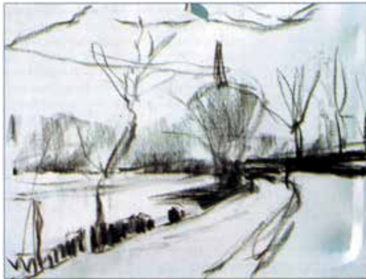
تصویر ۲-۳۵- اثر خوزه پارامون

از موضوع خود، یک پیش طرح ساده با رعایت اصول ترکیب بندی، تهیه کنید. تا حد امکان از توجه به جزئیات در طرح اولیهٔ خود بپرهیزید. تصویر (۲-۳۵) مثال بسیار خوبی برای یک طرح اولیه از طبیعت است.