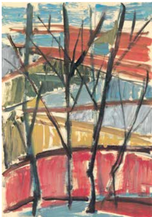
تصویر ۴۰-۲ اثر شکوه ریاضی ۱ ، رنگ روغن روی کاغذ، (۵۰×۳۵ سانتی متر)