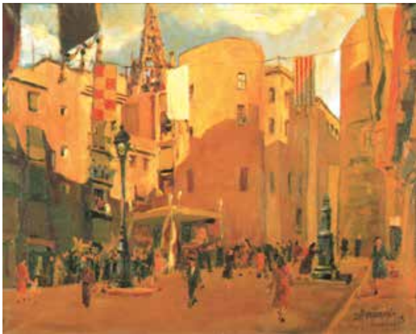
تصویر ۲۴-۲- اثر خوزه پارامون، رنگ روغن روی بوم، حاکمیت رنگ گرم

به تصویر (۲۴-۲) نگاه کنید. نقاش در قسمت پایین سمت چپ، مجموعه‌ای از رنگها را برای نمایش تیرگی و سایه به کار برده که از ترکیبهای سبز و بنفش و قرمز به دست آمده است ولی غالب رنگهای نقاشی، تمایل به گرمی دارند. تصویر (۲۵-۲) مجموعه رنگهای گرم به کار رفته در نقاشی را نشان می‌دهد.