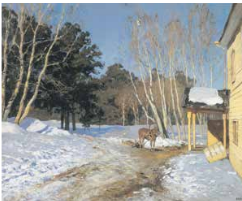
تصویر ۲-۳۹- اثر ایزاک لویتان، رنگ روغن روی بوم، (۶۰×۷۵ سانتی متر)

در مرحله بعد با به کارگیری قوانین حاکم بر رنگهای مکمل و خاکستریهای رنگی حاصل از ترکیب آنها، ترکیبی متعادل و هماهنگ به وجود آورید (تصاویر ۲-۳۹، ۲-۴۰، ۲-۴۱ و ۲-۴۲).