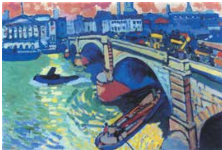
تصویر ۱۶-۲- اثر آندره دُرن، رنگ روغن روی بوم، (۶۶×۹۹ سانتی‌متر)

در تصویر (۱۶-۲) پل لندن اثر دُرن ۱ را با به‌کارگیری رنگهای اصلی و ثانویه به وضوح می‌بینید. نقاش به زیبایی، سطح تابلو را از عقب به جلو، به سطوح اصلی تقسیم‌بندی نموده و به کمک خط افق در نیمه بالایی تابلو، آسمان را از سطوح خانه‌ها جدا کرده است. او سپس، عناصر ساختمان را قرار داده و بعد از آن، رودخانه و پل و در نهایت، قایقها را طراحی کرده است. نقاش، از رنگهای آبی و سبز و بنفش در عناصر ساختمانی استفاده کرده و گاه، رنگهای سفید را به کمک روشن نموده است. رنگ آب در نگاه اول سبز به نظر می‌رسد، اما نقاش، انعکاس نورهای خورشید را که در آسمان دور دست با نارنجی و زرد همراه است در پیش‌زمینه کار با ضربه قلمهای کوچک به روی رنگ سبز رودخانه، به زیبایی به کار برده است. او در سایه‌ها غالباً از آبی و بنفش استفاده کرده و بدین ترتیب، هماهنگی لازم را میان رنگهای سراسری تابلو برقرار نموده است. تصویر (۱۷-۲) نیز نمونه مفید دیگری برای این تمرین است.