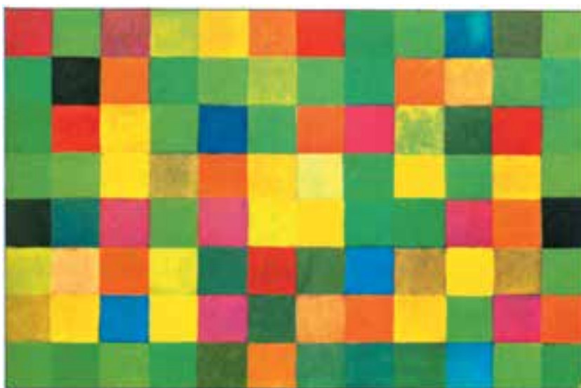
تصویر ۱۹-۲- تابستان