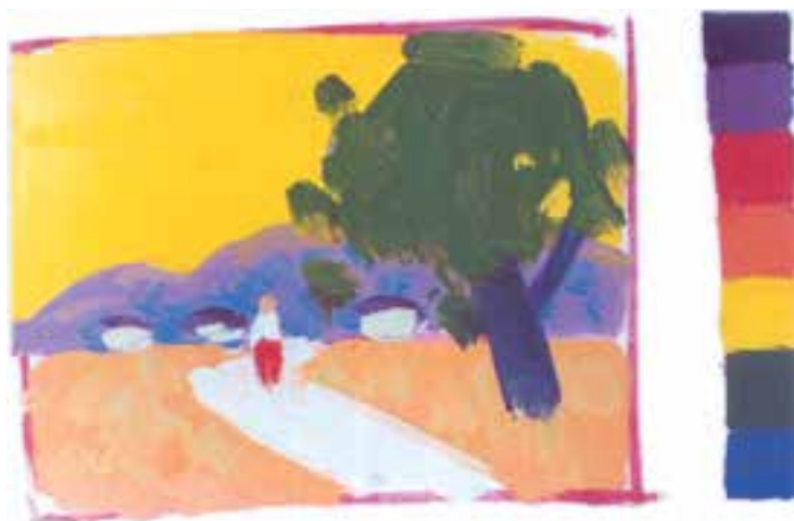
تصویر ۱۴-۲- رنگهای اصلی و ثانویه - گرم

پیش طرح رنگی زیر، می تواند نمونه بسیار ساده ای برای شروع کار شما باشد. بسیاری از نقاشان، کار رنگ را با یک پیش طرح رنگی کلی آغاز می کنند. گاه، این گونه پیش طرحها به تعداد زیادی تهیه می شوند. این اتوهای سریع از منظره، شما را برای انجام مراحل پیچیده تر آماده می سازد. تصویر (۱۴-۲) نقاش، با استفاده از طیف رنگهای گرم به فضا سازی کلی کار پرداخته است. او، آسمان را که غالباً آبی ست در هنگام ظهر با رنگ زرد و در نهایت درخشش نشان داده است. کوهها در دوردست با رنگ بنفش و در سایه ها، آبی به کار گرفته شده است. رنگ زمین که غالباً رنگ گرم است با نارنجی پوشانیده شده است و درخت، در بخش جلوی کار، با رنگ سبز خودنمایی می کند. در تصویر (۱۵-۲) نقاش، همان موضوع را با دسته رنگهای اصلی و ثانویه در ساعت دیگری از روز کار کرده است. آسمان در اینجا با آبی پوشانیده شده است و وسعت سطوح به کار گرفته شده و حاکمیت رنگهای سرد را