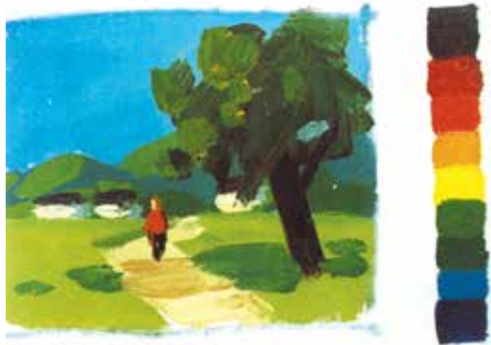
تصویر ۱۵-۲- رنگهای اصلی و ثانویه - سرد

در کار ملاحظه می‌کنید. نقاش، به سادگی به کمک درجات تیرگی و روشنی رنگ، سطوح عناصر تصویر نقاشی خود را از یکدیگر مجزا کرده است. شما درخت و کوهها و حتی پیکر انسان را در کار، با تفکیک ساده سطوح تیره روشن برای ایجاد حجم و نور و سایه می‌بینید.