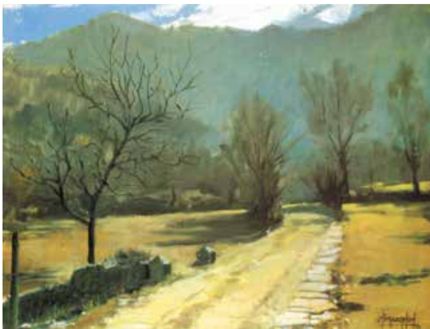
تصویر ۲-۳۸- اثر خوزه پارامون، رنگ روغن روی بوم