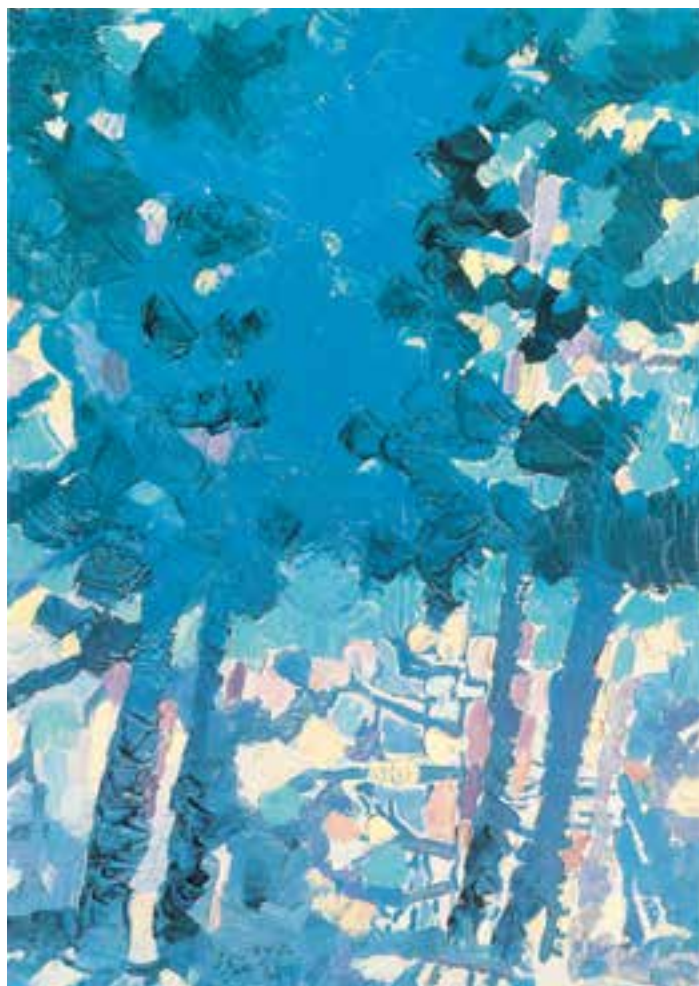
تصویر ۳۱-۲- اثر احمد اسفندیاری، 'رنگ روغن روی بوم'، (۷۰×۵۰ سانتی متر)