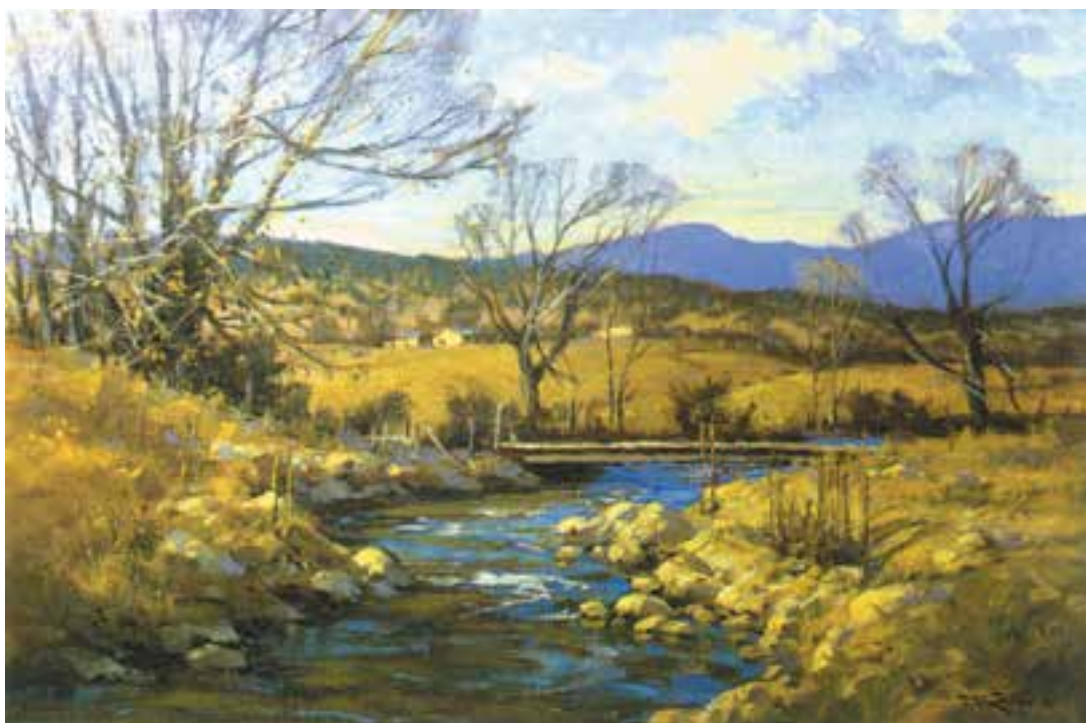
تصویر ۳۳-۲- اثر استریسیک ۱ ، رنگ روغن روی بوم، (۳۰×۴۱ سانتی‌متر)