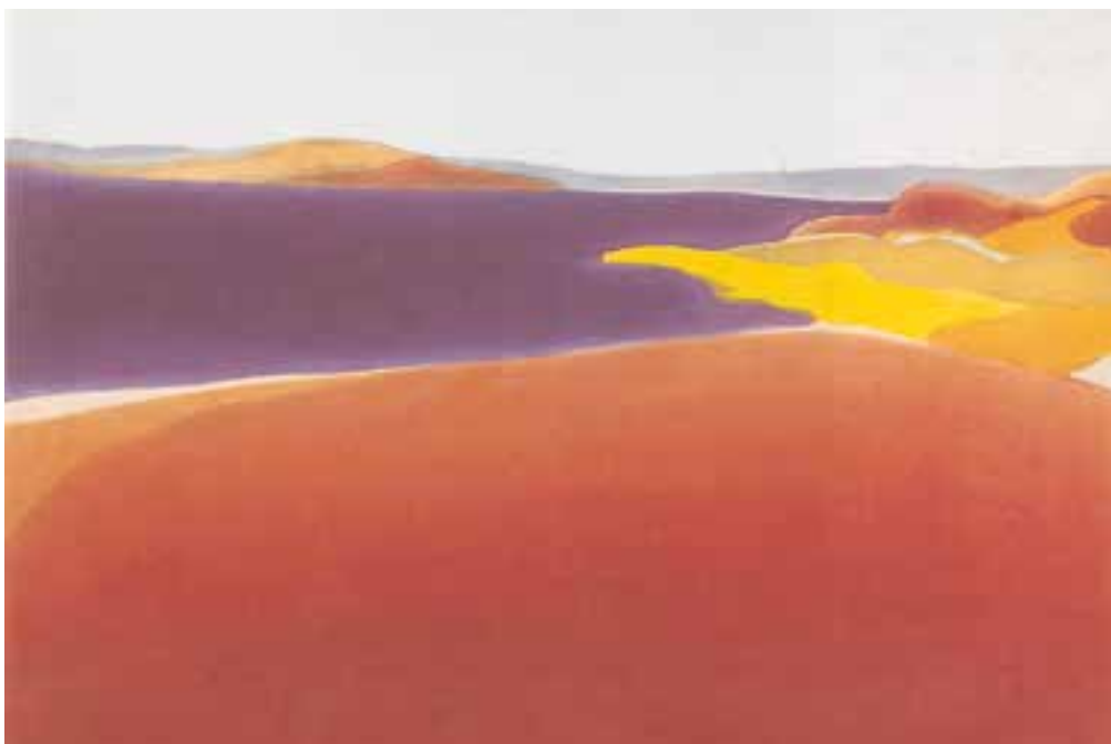
تصویر ۲۷-۲- اثر الیزابت آزرن ۱ ، اکریلیک روی بوم، (۱۰۲/۶×۱۰۱/۶ سانتی متر)