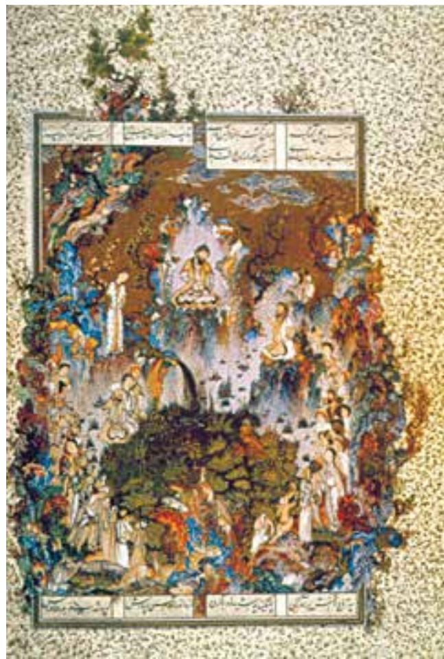
تصویر ۳۴-۲- برگی از شاهنامه‌ی تهماسبی، در بارگاه کیومرث، اثر سلطان محمد، ۹۳۱ ه.ق. تبریز

برای درک بهتر این آثار و ظرافت‌های فوق‌العاده‌ی به‌کار رفته در آن‌ها، لازم است بدانیم که اندازه‌ی اصلی‌شان از حدود ۲۵-۱۵ سانتی‌متر بیش‌تر نیست.