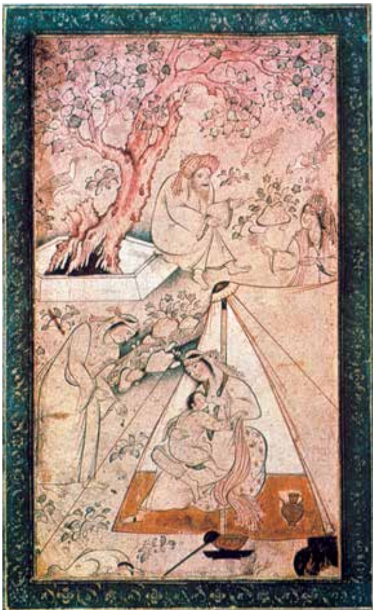
تصویر ۴۷-۲- رقعدهی مصور، زندگی روستایی، اثر محمد قاسم، اواسط سده ۱۱ هـ.ق. اصفهان