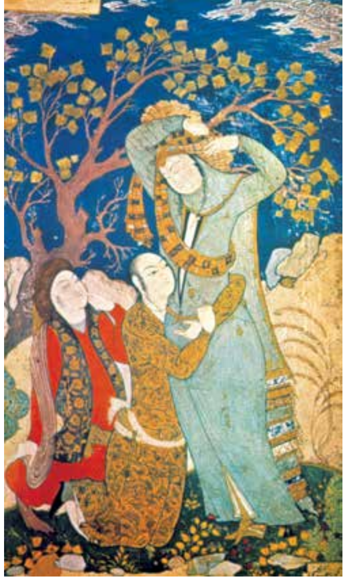
تصویر ۲-۴۴- رقعہ‌ی مصور، عشاق، اثر محمدیوسف‌الحسینی، ۱۰۰۹ ه.ق. اصفهان

محمدمعین مصور از موفق‌ترین شاگردان و پیروان رضا عباسی است. در آثار وی هم‌چون دیگر رقعہ‌نگاران مکتب اصفهان، ساختار اثر ایرانی و سنتی باقی می‌ماند ولی در برخی عناصر از فرهنگ و اندیشه‌ی غربی تأثیر می‌پذیرد. مانند پوشاک جوان و سگ دست‌آموز همراهش در این تصویر.