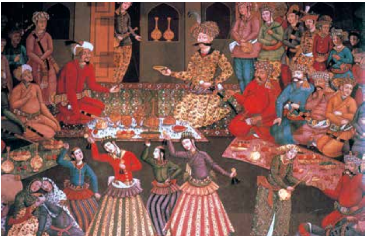
تصویر ۲-۵۱- نقاشی دیواری، مجلس پذیرایی شاه عباس، حدود ۱۰۷۰ ه.ق. کاخ چهلستون، اصفهان