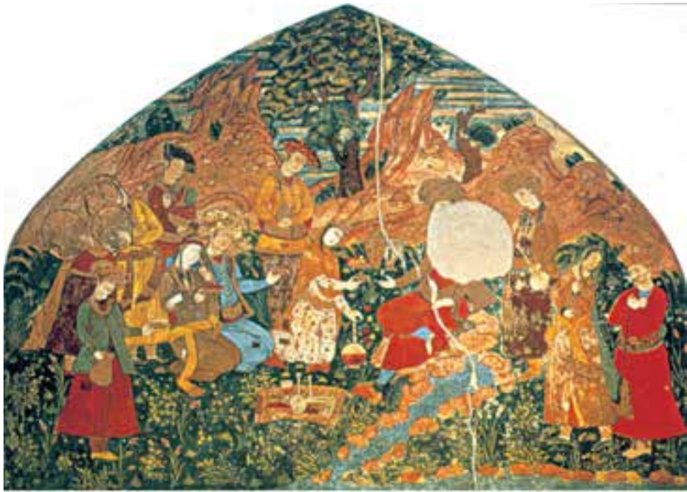
تصویر ۲-۵۰- نقاشی دیواری، بزم در دامان طبیعت، حدود ۱۰۳۰ ه.ق. کاخ عالی قاپو، اصفهان