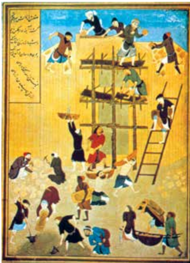
تصویر ۲-۳۲- برگی از خمسه‌ی نظامی، ساختن کاخ خورنق، اثر کمال‌الدین بهزاد، ۸۹۸ ه.ق. هرات

ویژگی‌های آثار بهزاد، به‌عنوان شاخصه‌های کلی مکتب هرات، در نیمه‌ی دوم سده‌ی نهم هجری تجلی یافته است.