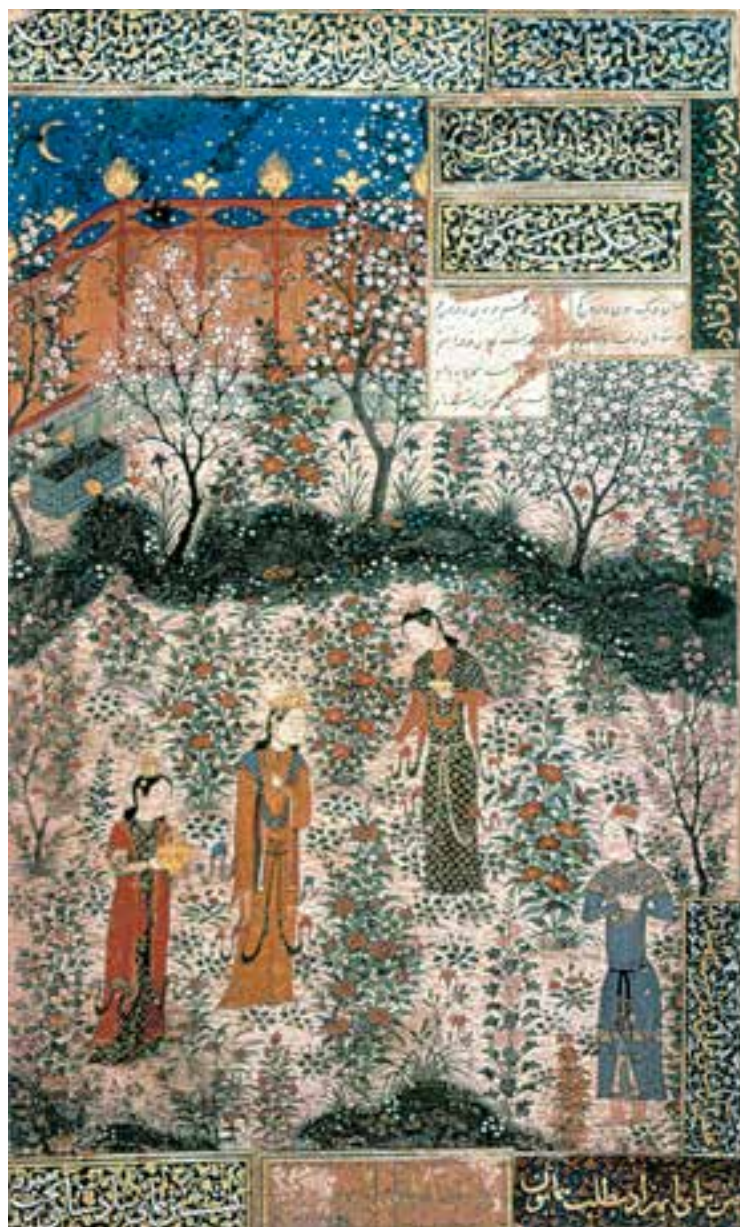
تصویر ۲۳-۲- برگی از نسخه‌ی همای و همایون، دیدار همای و همایون در باغ، ۸۳۴ ه.ق. هرات

مطالعه‌ی آثار هرات از تداوم سنت‌های هنر باختر ایران، به‌ویژه آثار جنید و معاصرانش، خبر می‌دهد. ضمن آن‌که این آثار از دستاوردهای مکتب شیرازی بهره‌نبرده است. نقاشان این عهد از تأثیرات هنر چینی به‌تدریج‌رهایی یافتند و آثاری با ویژگی‌های کاملاً ایرانی پدید آوردند (تصویر ۲۳-۲).