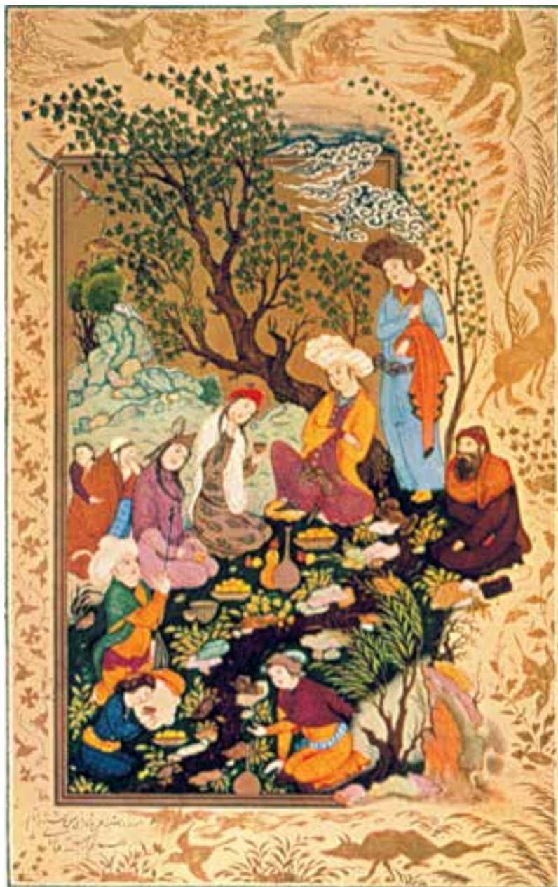
تصویر ۲-۴۱- رُقعه‌ی مصور، گلگشت، اثر رضا عباسی، ۱۰۲۰ ه.ق. اصفهان

این رُقعه‌ها تک‌نگاره‌هایی هستند که اگرچه به پیروی از ساختارهای سنتی نگارگری اجرا شده‌اند ولی استقلال موضوعی دارند. و با آن که ممکن است اشعاری با خط خوش در اطراف آن‌ها نوشته شود ولی ارتباطی موضوعی با کتاب‌ها و داستان‌ها ندارند. تولید این نوع جدید از نقاشی، نشانگر تغییر نظام عرضه و تقاضا در نقاشی این دوره است. باید گفت از دوره‌ی مغول‌ها (مکتب تبریز ایلخانی) فعالیت کارگاه‌های هنری درباری که با حمایت حکام فرهنگ‌پرور تداوم داشت عامل مهمی در تولید کُتب نفیس و نقاشی‌های داخل آن بود، اما با قطع این حمایت در اواسط سده‌ی دهم ه.ق. هنرمندان مسیرهای تازه و حامیان جدیدی را جست‌وجو و تجربه کردند که رونق رُقعه‌های مصور از نتایج این جست‌وجوها بود. رُقعه‌ها اصلی‌ترین نوع تولید تصویری طی سده‌ی یازدهم ه.ق در اصفهان است که توسط استاد بزرگ این دوره رضا عباسی و شاگردان و پیروان بسیارش بی‌گیری می‌شد (تصاویر ۲-۴۱، ۲-۴۲ و ۲-۴۳).