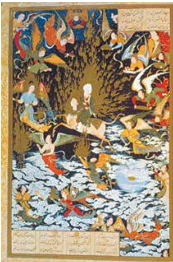
تصویر ۲-۳۸- برگی از خمسه‌ی تهماسبی، معراج پیامبر، اثر سلطان محمد، ۹۵۰ هـ.ق. تبریز