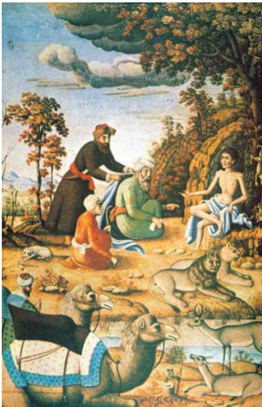
تصویر ۲-۴۸- فرنگی‌سازی، دیدار خویشاوندان از مجنون در بیابان، اثر محمد زمان، ۱۰۸۶ ه.ق. اصفهان در این تصویر اگرچه موضوع کاملاً ایرانی است ولی برخلاف رقع‌های پیشین، ساختار اثر دگرگون شده و به شدت متأثر از هنر واقع‌گرای غربی است.

نفوذ نقاشی اروپایی را در این دوره با عواملی چون طبیعت‌گرایی، تلاش برای ژرف‌نمایی (پرسپکتیو)، سایه‌پردازی، پلان‌بندی و شباهت‌سازی می‌توان دید. محمدزمان و علی‌قلی جبّه‌دار از شاخص‌ترین هنرمندانی هستند که این تلفیق در آثارشان دیده می‌شود (تصاویر ۲-۴۸ و ۲-۴۹).