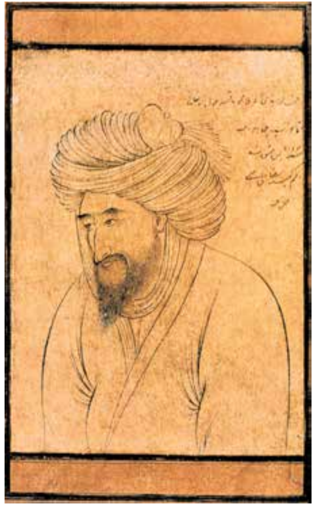
تصویر ۴۲-۲- طرحی از چهره‌ی پیرمرد، اثر رضا عباسی، ۱۰۲۳ هـ.ق. اصفهان

اگرچه در رقعہ‌های مکتب اصفهان از ظرافت‌های دوره‌ی پیشین خبری نیست ولی مهارت در قلم‌گیری بسیار چشم‌گیر است. در این‌گونه طراحی امکان تغییر و بازسازی تقریباً منتفی است و نقاش می‌بایست دست و قلمی خطاناپذیر داشته باشد.