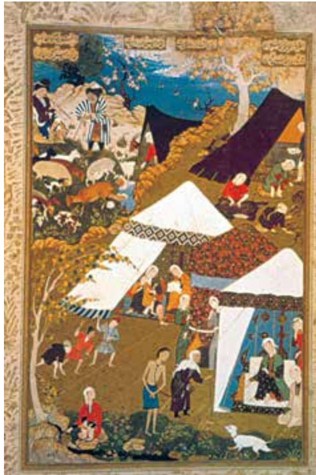
تصویر ۴۰-۲- برگی از خمسه‌ی تهماسبی، آوردن مجنون در زنجیر به خیمه‌گاه لیلی، اثر میرسیدعلی، ۹۵۰ ه.ق. تبریز