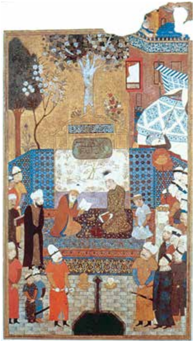
تصویر ۲۸-۲- تاج‌گذاری سلطان حسین بایقرا، اثر منصور، ۸۷۶ ه.ق. هرات

ب) نیمه‌ی دوم سده‌ی نهم ه.ق: عصر بهزاد: فعالیت کارگاه‌های هنری هرات پس از مرگ شاهرخ و بایسنقر میرزا، اگرچه موقتاً دچار رکود شد اما با به قدرت رسیدن سلطان حسین بایقرا (حکومت ۹۱۲-۸۷۳ ه.ق)، آخرین شاه تیموری، بار دیگر فعالیت‌های هنری مورد حمایت قرار گرفت. کارگاه‌ها فعال شد و عصری شکوهمند در تاریخ نقاشی ایران پدیدار گشت. حمایت سلطان حسین بایقرا و وزیر دانشمندش میرعلیشیر نوایی از دانشمندان و هنرمندان و هم‌چنین آرامش سیاسی عصر سلطنت او موجب شکوفایی علوم، ادبیات و نقاشی و کتاب‌آرایی گردید.