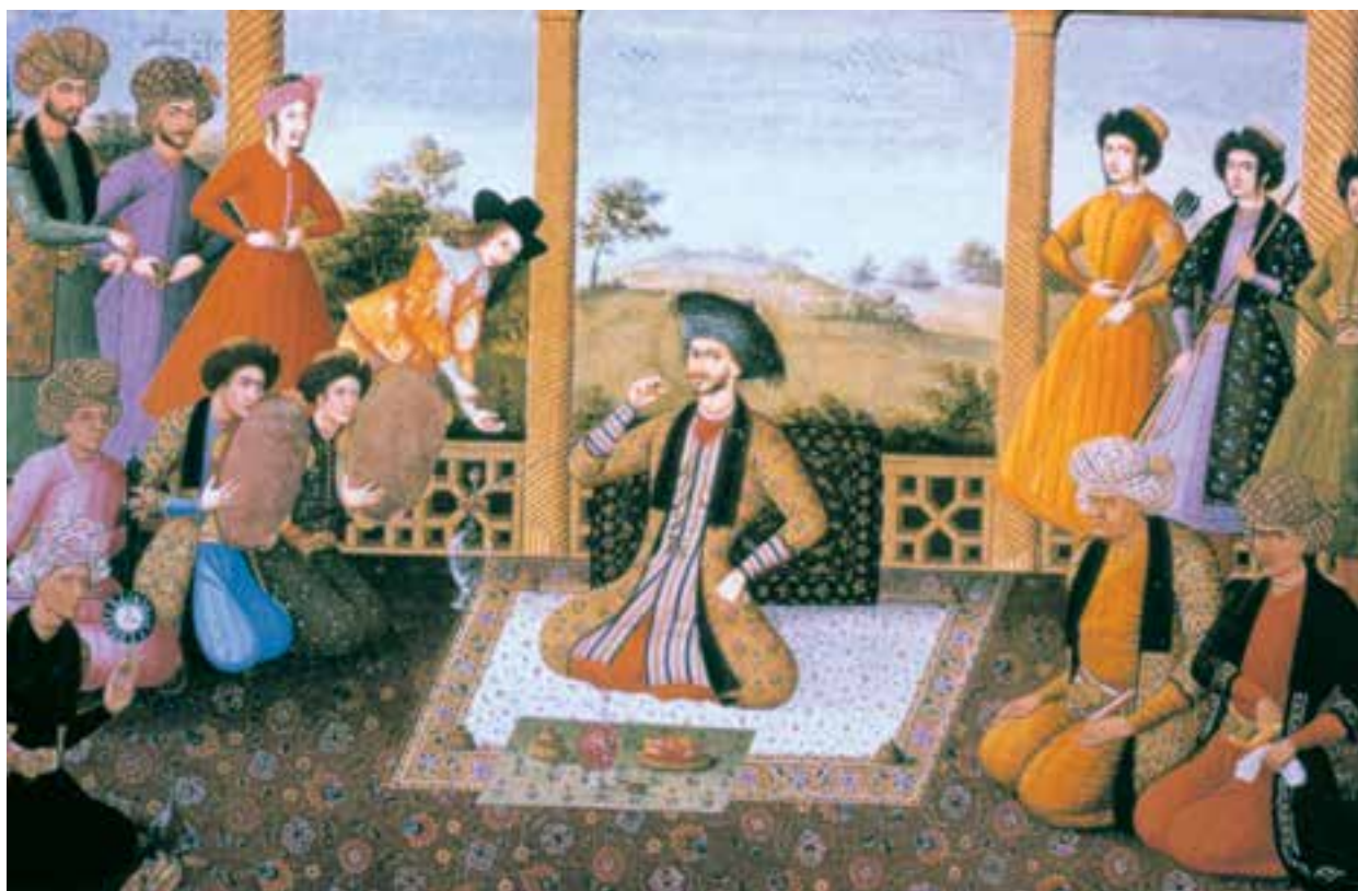
تصویر ۴۹-۲- فرنگی‌سازی، مجلس بزم شاه سلیمان صفوی، اثر علی‌قلی جبه‌دار، اواخر سده ۱۱ ه.ق. اصفهان به نظر شما در چنین آثاری، هنرمند تا چه حد بر اصول پرسپکتیو و نورپردازی واقف بوده است؟

ج) نقاشی دیواری: رونق عمومی نقاشی در سده ۱۰ هجری قمری موجب گردید که نقاشان عرصه‌های جدیدی را در دنیای هنر بگشایند. از جمله‌ی این عرصه‌ها تجدید حیات نقاشی دیواری پس از صدها سال بود. در مباحث گذشته خواندیم که پس از گسترش دین اسلام، کم‌کم نقاشی دیواری اهمیت و کاربرد خود را از دست می‌دهد و دیوار بناها، به جای نقاشی، با گچ‌بری و کتیبه‌های خوش‌نویسی و نقوش تجریدی آراسته می‌شوند. در عصر صفوی تعداد کاخ‌ها و بناهای اشرافی و تمایل به اتمام هرچه زودتر آن‌ها، موجب می‌شود در مکتب اصفهان نقاشی دیواری مجدداً رواج یابد.