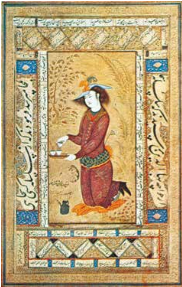
تصویر ۴۳-۲- رقعہی مصور، ساقی، اثر رضا عباسی، ۱۰۳۹ هـ.ق. اصفهان