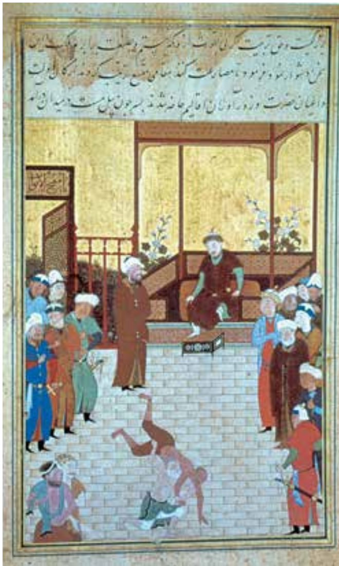
تصویر ۲۹-۲- برگگی از گلستان سعدی، دو کشتی‌گیر، اثر شاه مظفر، ۸۸۱ ه.ق. هرات