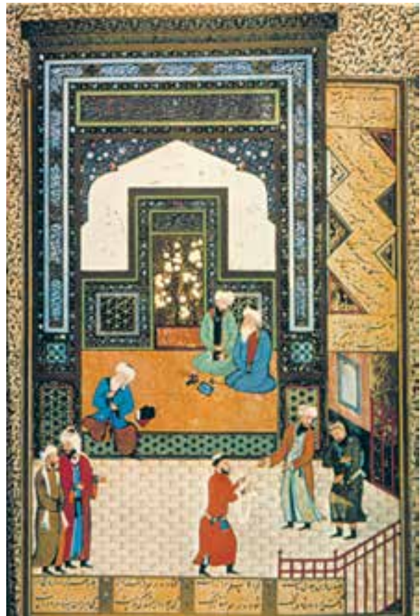
تصویر ۲-۳۱- برگی از بوستان سعدی، مجلس بحث طلاب در مسجد، اثر کمال‌الدین بهزاد، ۸۹۴ ه.ق. هرات

بهزاد برای خلق هر اثر، اندیشه‌ی هنرمندانه‌ی ویژه‌ای به کار می‌بندد. مثلاً در این نگاره با قرار دادن پیکرهای تیره‌رنگ کارگران ساختمانی و بنایان بر زمینه‌ای به رنگ کرم روشن بر تحرک و پویایی صحنه افزوده است.