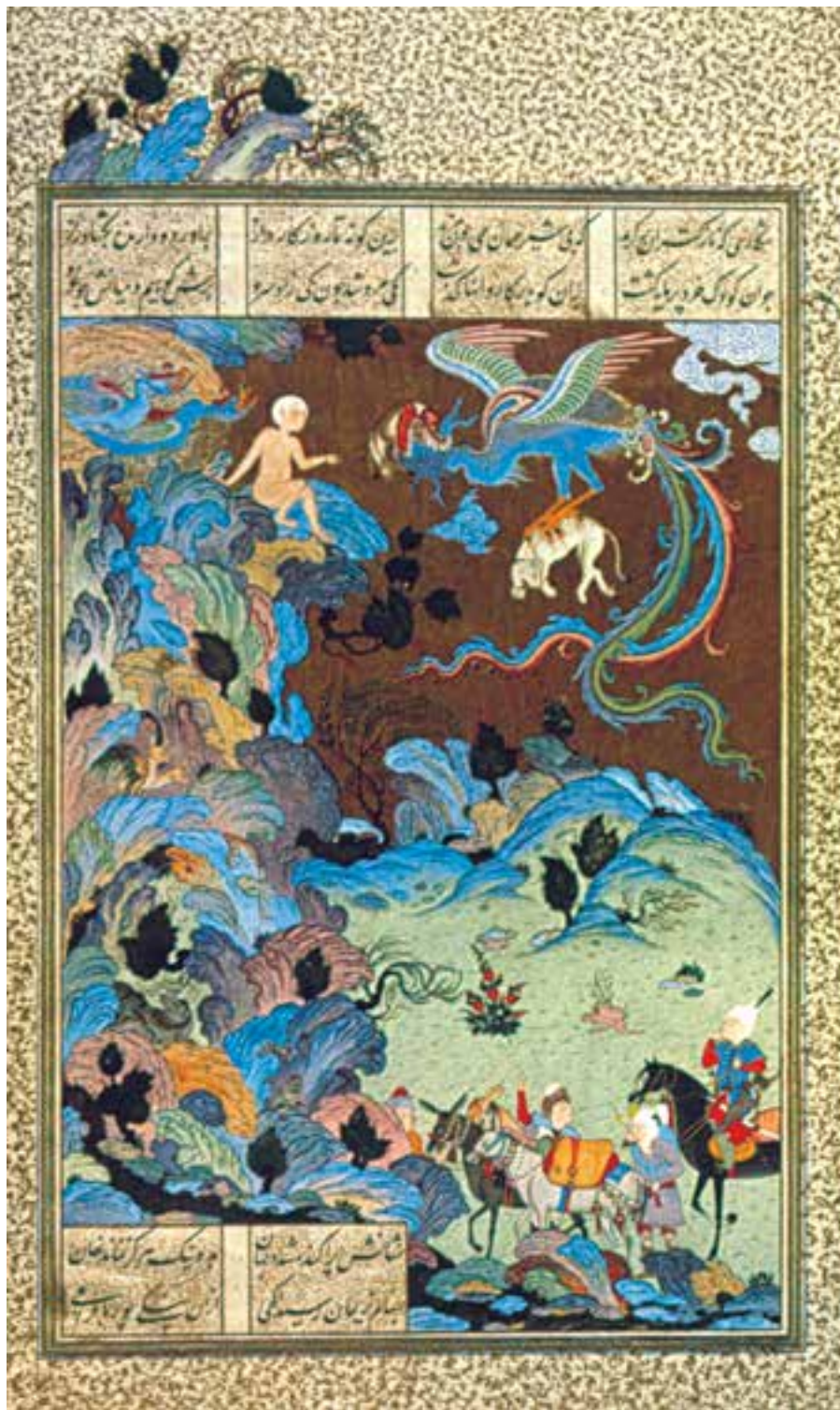
تصویر ۲-۳۶- برگی از شاهنامه‌ی تهماسبی، دیده شدن زال توسط کاروانیان، اثر عبدالعزیز، ۹۳۱ ه.ق. تبریز

از نسخه‌های مهم مصور شده در این دوره می‌توان: شاهنامه‌ی تهماسبی (۹۳۱ ه.ق) دیوان حافظ (۹۳۹ ه.ق) و خمسه‌ی تهماسبی (۹۵۰ ه.ق) را نام برد (تصاویر ۲-۳۷، ۲-۳۸، ۲-۳۹ و ۲-۴۰).