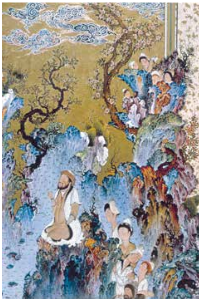
تصویر ۳۵-۲ جزئیات تصویر در بارگاه کیومرث