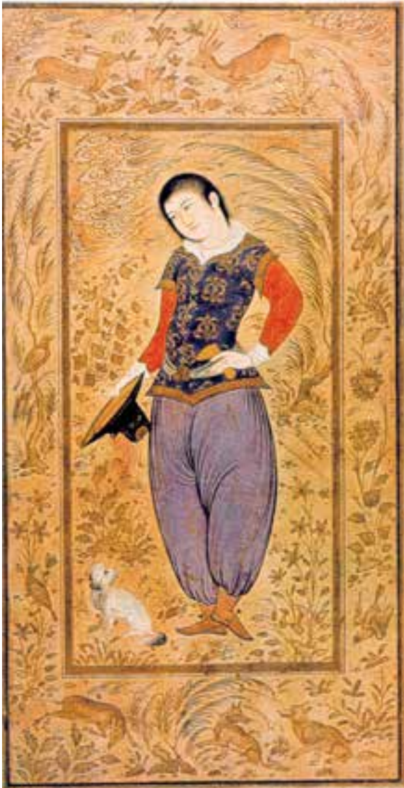
تصویر ۲-۴۵- رقعہ‌ی مصور، جوانی در لباس فرنگی، اثر محمدمعین مصور، ۱۰۵۸ ه.ق. اصفهان