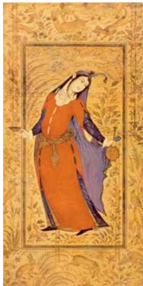
تصویر ۴۶-۲- رقعدهی مصور، ساقی، اثر محمد معین مصور، اواسط سده ۱۱ هـ.ق. اصفهان

ب) فرنگی سازی: در مکتب اصفهان، و به موازات روابط تجاری با غرب، ارتباط فرهنگی و هنری نیز میان برخی کشورهای اروپایی با ایران برقرار می شود و در کنار انتقال آثار بعضی از هنرمندان به اروپا، تابلوهایی از کشورهای غربی به ایران وارد می شود. به همراه این آثار، برخی نقاشان و هنرمندان غربی، هم چنین ابزارهای جدیدی مانند رنگ روغنی ۱ و بوم های پارچه ای به بازارهای هنر ایران راه پیدا می کند. هنرمندان اروپایی، اغلب توسط ارامنه ی جلفای اصفهان، برای تزیین کلیساهای آنان و یا اجرای برخی