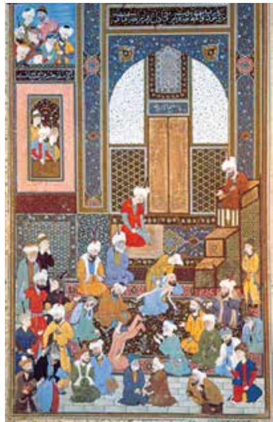
تصویر ۲-۳۷- برگی از دیوان حافظ، رسوایی در مسجد، اثر شیخزاده، ۹۳۹ هـ.ق. تبریز