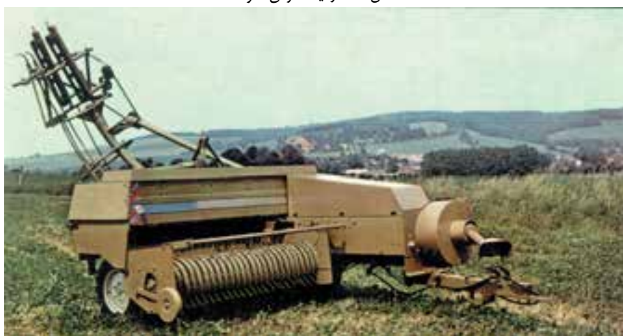
شکل ۵-۷ بسته بند