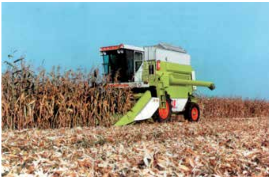
شکل ۶-۷ کمباین برداشت ذرت دانه‌ای

در صورتی که ذرت برای تولید دانه کشت شده باشد پس از خاتمه دوره رشد و نمو و زمانی که دانه‌ها سفت و رنگ برگ‌ها زرد شدند، میوه یا بلال ذرت را با ماشین بلال‌کن برداشت سپس با ماشین پوست‌گیر پوشش آن را جدا کرده آنگاه با ماشین دانه‌کن دانه‌ها را از چوب بلال جدا می‌کنند. در کمباین ذرت همه این اعمال یکجا صورت می‌گیرد. سپس دانه‌ها جهت رسیدن به رطوبت مطلوب در دستگاه‌های خشک‌کن قرار می‌گیرند.