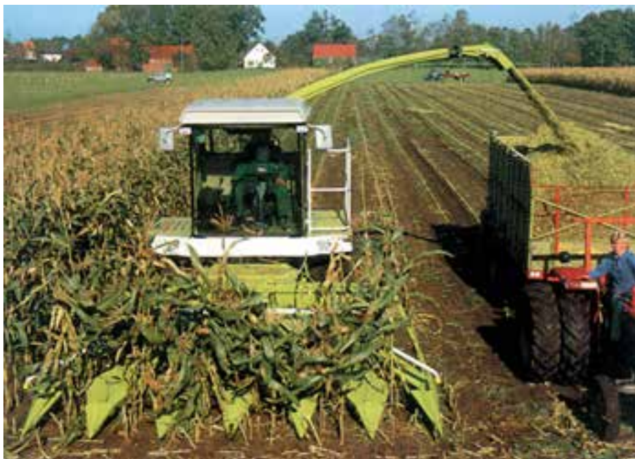
شکل ۷-۷ چارپا ذرت علوفه‌ای