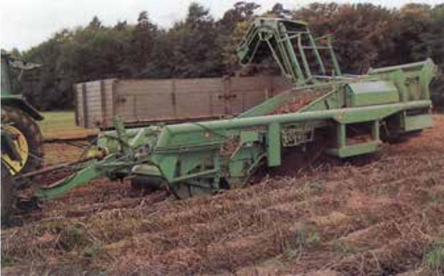
شکل ۷-۸ دستگاه برداشت سیب زمینی

کمباین سیب زمینی، دارای واحدهای عامل است که سیب زمینی‌ها را از خاک بالا آورده و آن‌ها بر روی نقاله غربالی لرزان منتقل می‌نماید تا خاکشان زدوده شود. سپس سیب زمینی‌ها درون تریلی یا مخزن کمباین ریخته می‌شود در روش نیمه مکانیزه سیب زمینی‌کنده شده توسط سیب زمینی‌کن به ردیف روی سطح زمین در مسیر حرکت تراکتور ریخته می‌شود تا با دست جمع‌آوری شوند (شکل ۷-۸).