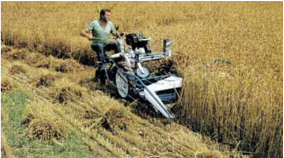
شکل ۷-۲ - دروگر دسته بند ۱