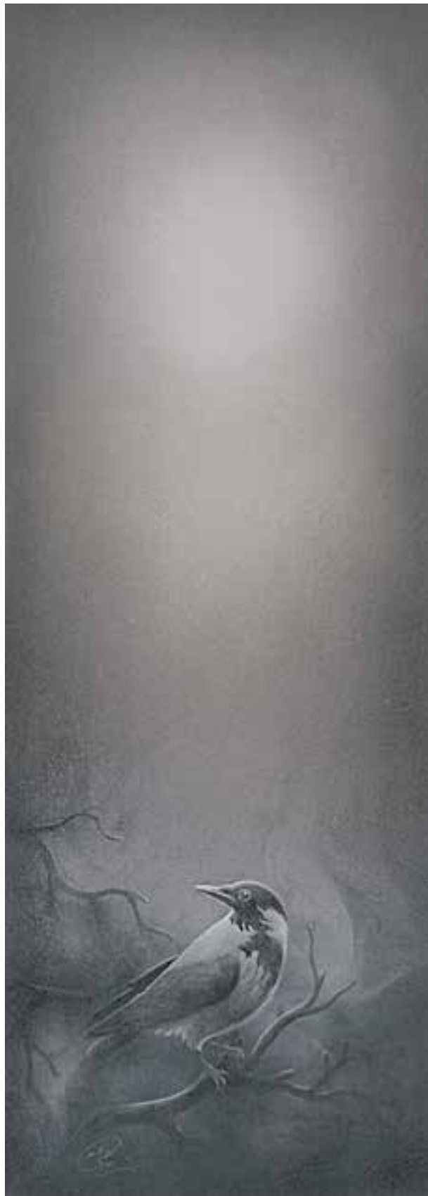
اثر : عبدا... حاجیوند (نقاشی برای همین کتاب)

کادر عمودی برای مرگ در آسمان و افقی برای مرگ در دریا انتخاب شده اند.