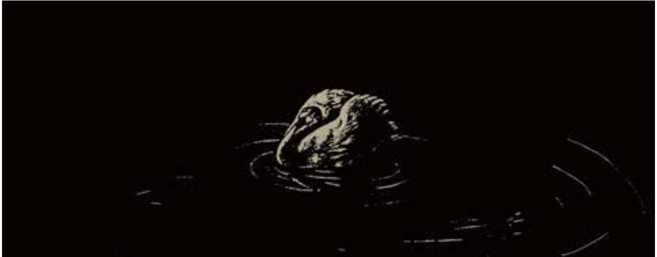
اثر : عبدا... حاجیوند (نقاشی برای همین کتاب)