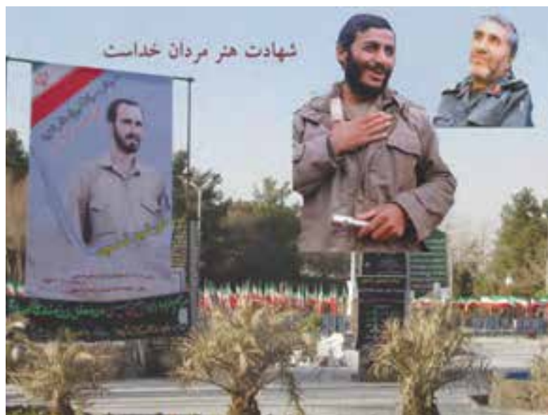
شکل ۱۶-۶- تصویر برخی از سرداران شهید استان اصفهان

مردم استان در سال‌های دفاع مقدس ضمن حضور فعال و مؤثر در بسیاری از عملیات‌ها (فرماندهی لشکر امام حسین، تیپ نجف اشرف، تیپ کربلا) در پشتیبانی از جبهه‌ها و رزمندگان اسلام (در قالب کاروان‌های وحدت و شهید بهشتی) نقش تعیین‌کننده داشته‌اند. امام درباره مردم این استان می‌فرماید: در کجای دنیا می‌توانید جایی را مانند اصفهان پیدا کنید. تقدیم ۲۳ هزار شهید و ۴۱ هزار جانباز و ۳۴۶۰ آزاده سرافراز بخشی از ایثارگری‌ها و افتخارات مردم این استان محسوب می‌شود. وجود سرداران افتخارآفرین و حماسه‌ساز همانند شهید حاج حسین خرازی (فرمانده لشکر امام حسین «ع»)، شهید ابراهیم همت (فرمانده لشکر محمد رسول‌الله تهران)، شهید مصطفی ردانی‌پور، شهید عبدالله میثمی، شهید آقابابایی، شهید احمد کاظمی و بزرگان دیگری در عرصه دفاع مقدس همگی نشان از حضور افتخارآمیز مردم استان در میدان‌های تعیین سرنوشت ملت ایران دارد.