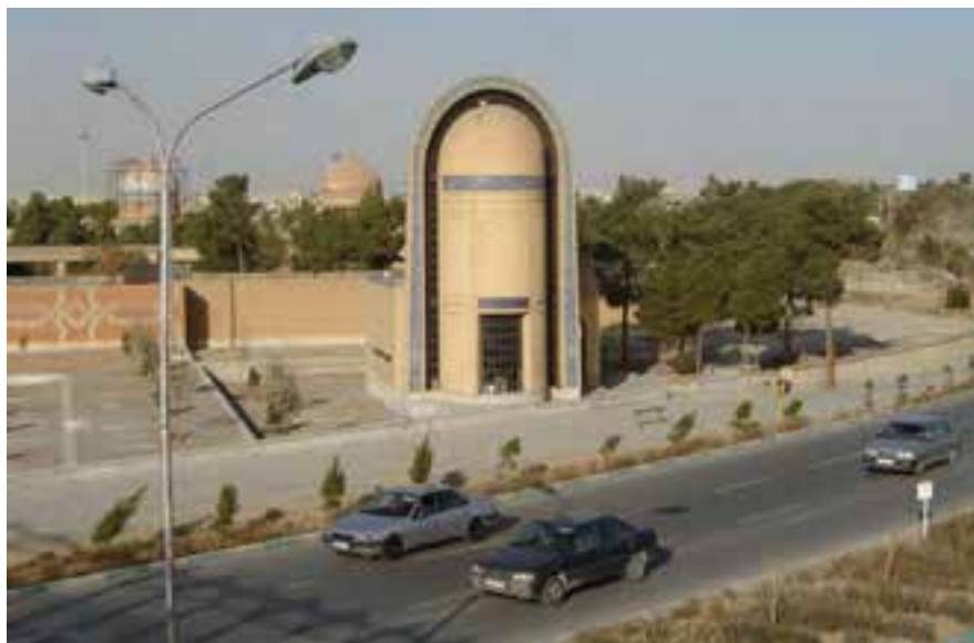
شکل ۱۴-۶- مقبره دانشمند بزرگ بانو مجتهده امین - تخت فولاد اصفهان