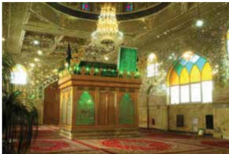
شکل ۶-۶- امامزاده اسحاق - خوراسگان

اسلام از سال ۲۳ هجری قمری وارد استان اصفهان شد. مردم این استان همانند دیگر ایرانیان از دین اسلام استقبال کردند. وجود بقاع سادات و امامزادگان در جای جای این استان، نشان از عشق و ارادت دیرینه این مردم نسبت به پیامبر بزرگوار اسلام و خانواده گران قدر آن حضرت دارد.