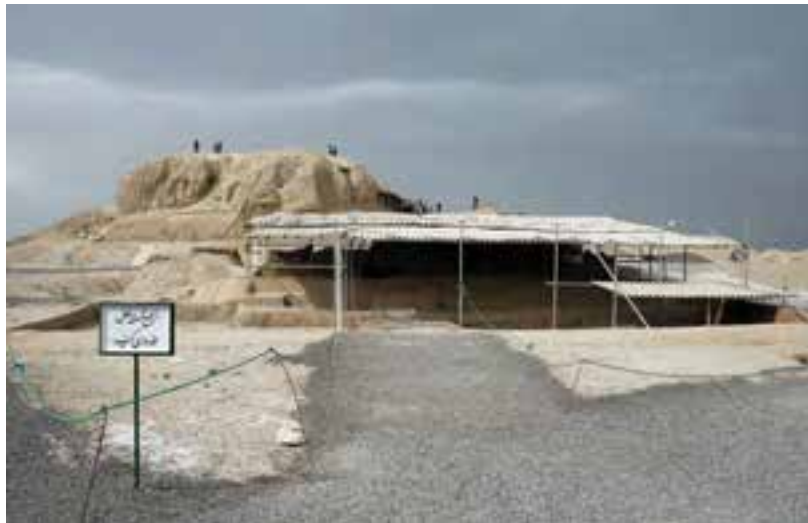
شکل ۲-۶- تپه‌های باستانی سیلک - کاشان

بیشتر این مکان‌ها مربوط به هزاره چهارم تا هزاره ششم قبل از میلاد است. برخی از مکان‌های باستانی استان عبارت‌اند از: تپه سیلک کاشان، محوطه باستانی اریسمان در شهرستان نطنز (هزاره چهارم ق. م)، تپه آشنا در چادگان (هزاره ششم ق. م)، تپه چغا حسن در گلپایگان (هزاره پنجم ق. م)، گورتان اصفهان (هزاره چهارم ق. م)، سبا در ورزنه (هزاره سوم ق. م)، تپه جوزک تیران و کرون (هزاره چهارم ق. م)، تل شاهی سمیرم (هزاره چهارم ق. م) و تپه‌های ننادگان فریدن (هزاره چهارم ق. م).