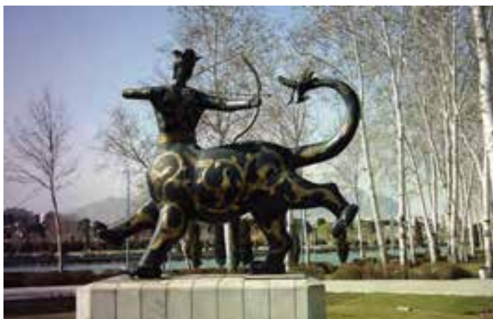
شکل ۳-۶- نماد شهر اصفهان. این تندیس نشانه چیست؟

از اصفهان پیش از اسلام؛ یعنی زمان هخامنشیان، اشکانیان و ساسانیان اطلاعات زیادی در دست نیست و آثار چندانی برجای نمانده است ولی آنچه مسلم است، از آنجا که استان اصفهان از لحاظ جغرافیایی در مرکز ایران واقع شده است، وجود دشت‌های وسیع و حاصل خیز و در برخی از مناطق، منابع آب فراوان - مانند زاینده رود - جاذبه‌هایی در آن ایجاد کرده است؛ از این رو، تمامی حاکمان در طول تاریخ نسبت به آن توجه ویژه داشته‌اند و تلاش همه‌جانبه آنها این بوده است که تسلط خود را بر این منطقه حفظ کنند. در دوران اساطیری، وجود داستان‌هایی مانند ماجرای کاوه آهنگر همان چهره آزاده که علیه ستم ضحاک قیام کرد و به کمک فریدون ملت ایران را از بند اسارت آزاد کرد و هم اکنون نیز در منطقه فریدن در روستایی به نام مشهد کاوه، آرامگاهی منسوب به این قهرمان ملی دیده می‌شود، نشان از مرکزیت قدرت سیاسی در این قسمت کشور دارد. وجود دژی بسیار بزرگ همانند اهرام مصر به نام کهندژ سارویه در حاشیه اصفهان امروزی که آثار آن تا هزار سال قبل هنوز برجای بوده و امروزه بخشی از آن در کنار پل شهرستان به نام تپه اشرف باقی مانده است و نیز بقایای آتشکده منسوب به عصر ساسانیان در ماریین اصفهان (کوه آتشگاه)، نمونه‌ای از آثار برجای مانده از پیش از اسلام است.