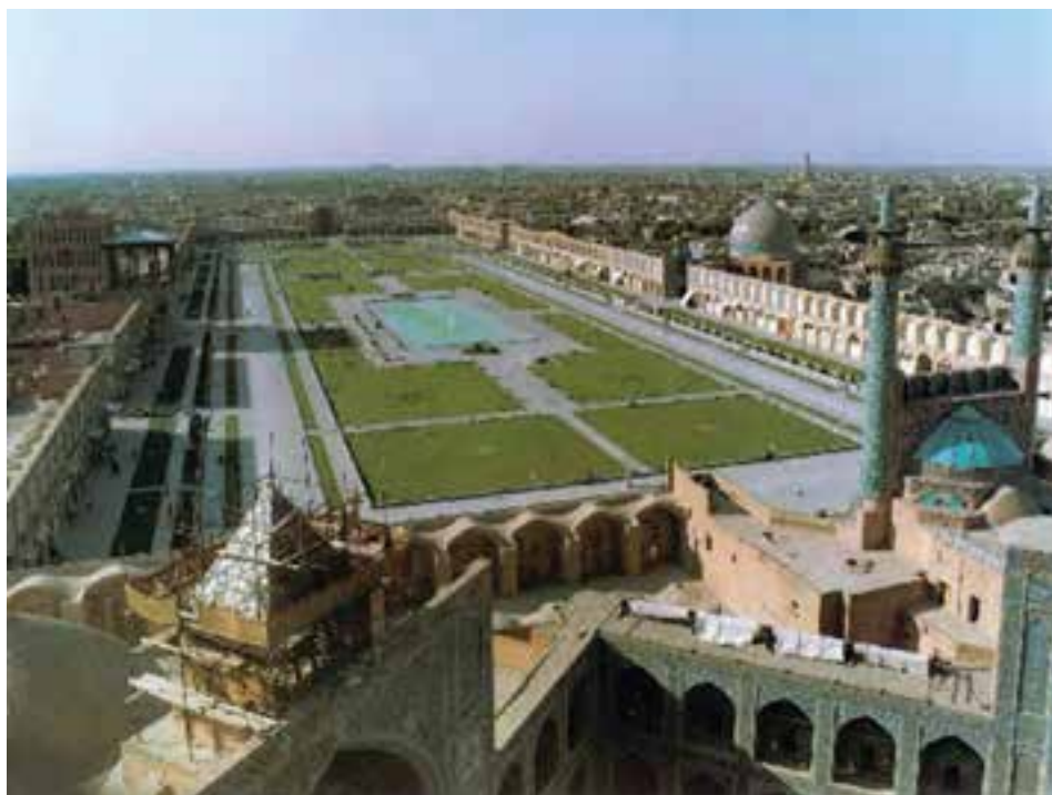
شکل ۹-۶- میدان امام (نقش جهان)

با مطالعه تاریخ صفویه درمی‌یابیم که شهر اصفهان پس از تأسیس این سلسله تا انتخاب آن به عنوان پایتخت، شهری آباد و پرجمعیت بوده است. شاه عباس اول صفوی در این اندیشه بود که پایتخت را از شمال غرب به مرکز ایران منتقل سازد تا از دشمن صفویان یعنی دولت عثمانی فاصله داشته باشد؛ از این رو، در سال ۱۰۰۰ هجری قمری، پایتخت را از قزوین به اصفهان منتقل کردند. تا سال ۱۱۳۵ هجری قمری، یعنی سال سقوط صفویه، اصفهان نه تنها در مرکز ایران بود بلکه تمام شرایط مورد نیاز برای یک پایتخت بزرگ را در خود داشت. به نظر شما، کدام شرایط برای پایتخت شدن اصفهان وجود داشت؟