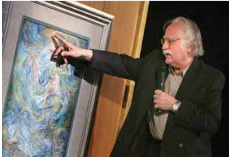
شکل ۱۵-۶- استاد محمود فرشچیان نقاش و طراح معروف معاصر