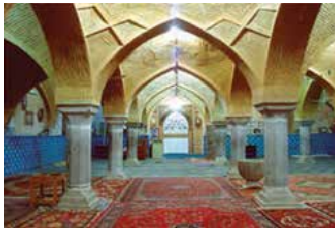
شکل ۷-۶- مسجد جامع شهرضا باقی مانده از زمان سلجوقیان

کوشش کردند. بناهای بسیاری ساخته شد که هنوز بسیاری از آنها پابرجاست. همچنین احداث چهارباغ ملکشاهی، آثار بسیار ارزشمند معماری و هنر اسلامی به ویژه در مسجد جامع اصفهان مانند گنبد نظام الملک و گنبد تاج الملک که به نظر باستان شناسان جهانی از آثار اعجاب انگیز محسوب می شوند، مسجد جامع اردستان، مسجد جامع زواره، مسجد جامع شهرضا، مسجد جامع گلپایگان نیز از جمله آثار ارزشمند معماری این دوره است.