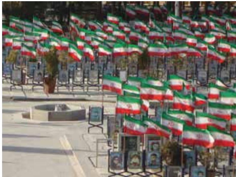
شکل ۱۷-۶- نمایش از گلستان شهدای اصفهان

مجموعهٔ چنین ارزش‌های کم‌نظیر تاریخی، فرهنگی و اجتماعی اصفهان باعث شد تا این شهر در سال ۱۳۸۵ از سوی سازمان کنفرانس اسلامی، به عنوان پایتخت فرهنگی جهان اسلام انتخاب شود. هم‌چنین در حال حاضر به عنوان پایتخت فرهنگ و تمدن ایران اسلامی نامگذاری شده است. جهت حفظ و گسترش این میراث ارزشمند چه باید کرد؟