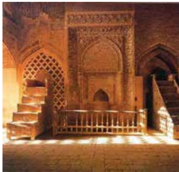
شکل ۸-۶- محراب الجایتو - جامع اصفهان

میدان عتیق (در محل فعلی میدان قیام اصفهان) نیز از میادین بزرگ عصر خود محسوب می شد که از آثار دوره سلجوقیان بود. این میدان به مرور زمان به دست فراموشی سپرده شده بود ولی به همت مسئولان شهر اصفهان در حال بازسازی است. ۳- دوره حکومت صفویه : اصفهان پایتخت دولت صفوی بود.