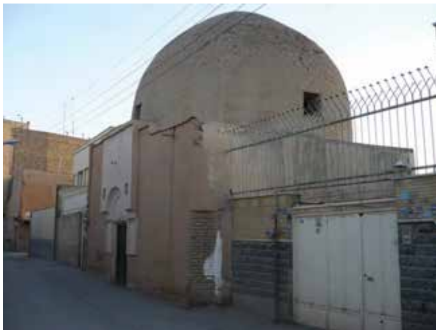
شکل ۱۳-۶- محل تدریس بوعلی سینا در اصفهان - خیابان ابن سینا

سلمان فارسی، یار صدیق پیامبر بزرگوار اسلام، از مردم این سامان بوده است و کاوه آهنگر، مبارز راه عدالت و آزادی، از مردم پرتیکان بود. در اوج درخشش تمدن اسلامی که ایرانیان از پیشگامان علوم و فنون اسلامی بودند، بسیاری از دانشمندان رشته‌های مختلف از این استان برخاسته یا زندگی علمی خود را در این سامان گذرانده‌اند. در قرن چهارم هجری قمری، شخصیت‌های برجسته‌ای چون حمزه اصفهانی، صاحب بن عباد، حافظ ابونعیم، ابن مسکویه، ابوالفرج اصفهانی، ابن سینا (گرچه در اصفهان متولد نشد ولی بیشتر آثار علمی او در این شهر شکل گرفت و شاگردان معروفی را در این شهر تربیت کرد) مدت زیادی به تألیف، پژوهش و تربیت شاگردان در این شهر پرداختند. از دوره سلجوقیان تا شروع دوره صفویه استان اصفهان علما و شعرای بسیاری را به خود دید که از آن جمله می‌توان به خواجه نظام‌الملک (مؤسس مدارس نظامیه)، راغب اصفهانی، عمادالدین کاتب، غیاث‌الدین جمشید کاشانی، جمال‌الدین عبدالرزاق و کمال‌الدین اسماعیل که هر کدام از مشاهیر عصر خود بوده‌اند، اشاره کرد.