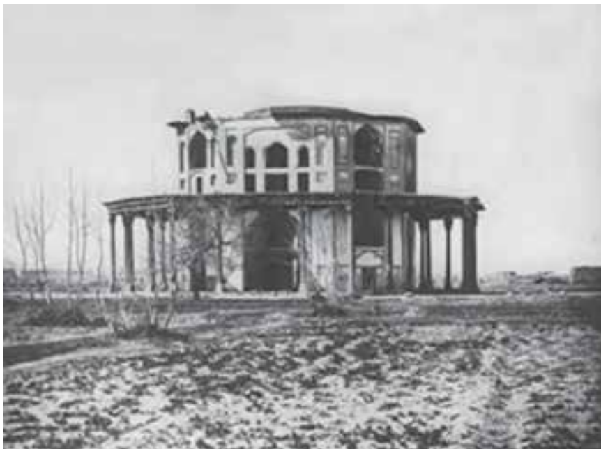
شکل ۱۱-۶- کاخ نمکدان که در زمان قاجاریه از بین رفته است.

به غیر از شهر اصفهان در سایر شهرها و حتی روستاهای استان نیز آثاری از دوره صفویه به چشم می خورد؛ مثلاً کاشان، خوانسار، نجف آباد (ایجاد شهر در زمان صفویه)، کوهپایه و نائین.