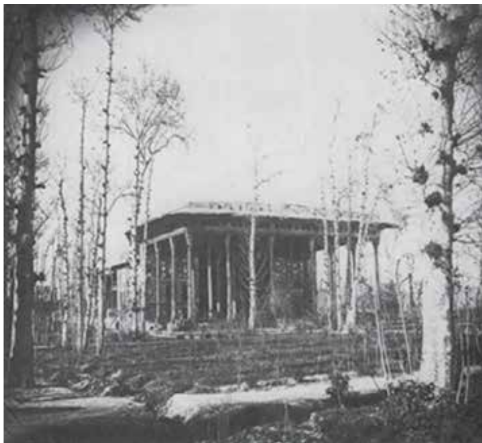
شکل ۱۲-۶- کاخ آینه‌خانه که در زمان قاجاریه از بین رفته است.