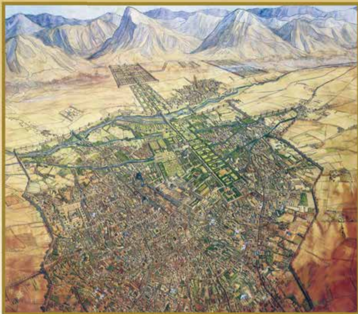
شهر اصفهان - صفویه