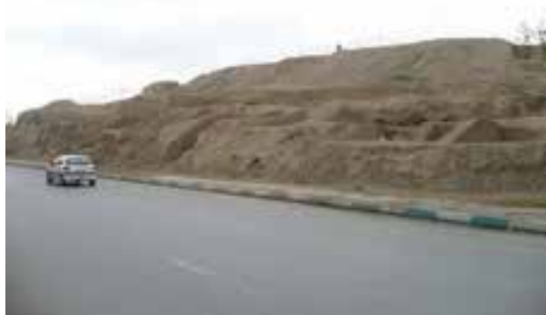
شکل ۴-۶- تپه اشرف باقی مانده بنای کهن سارویه (نزدیک پل شهرستان اصفهان)

از اصفهان پیش از اسلام؛ یعنی زمان هخامنشیان، اشکانیان و ساسانیان اطلاعات زیادی در دست نیست و آثار چندانی برجای نمانده است ولی آنچه مسلم است، از آنجا که استان اصفهان از لحاظ جغرافیایی در مرکز ایران واقع شده است، وجود دشت‌های وسیع و حاصل خیز و در برخی از مناطق، منابع آب فراوان - مانند زاینده رود - جاذبه‌هایی در آن ایجاد کرده است؛ از این رو، تمامی حاکمان در طول تاریخ نسبت به آن توجه ویژه داشته‌اند و تلاش همه‌جانبه آنها این بوده است که تسلط خود را بر این منطقه حفظ کنند. در دوران اساطیری، وجود داستان‌هایی مانند ماجرای کاوه آهنگر همان چهره آزاده که علیه ستم ضحاک قیام کرد و به کمک فریدون ملت ایران را از بند اسارت آزاد کرد و هم اکنون نیز در منطقه فریدن در روستایی به نام مشهد کاوه، آرامگاهی منسوب به این قهرمان ملی دیده می‌شود، نشان از مرکزیت قدرت سیاسی در این قسمت کشور دارد. وجود دژی بسیار بزرگ همانند اهرام مصر به نام کهندژ سارویه در حاشیه اصفهان امروزی که آثار آن تا هزار سال قبل هنوز برجای بوده و امروزه بخشی از آن در کنار پل شهرستان به نام تپه اشرف باقی مانده است و نیز بقایای آتشکده منسوب به عصر ساسانیان در ماریین اصفهان (کوه آتشگاه)، نمونه‌ای از آثار برجای مانده از پیش از اسلام است.