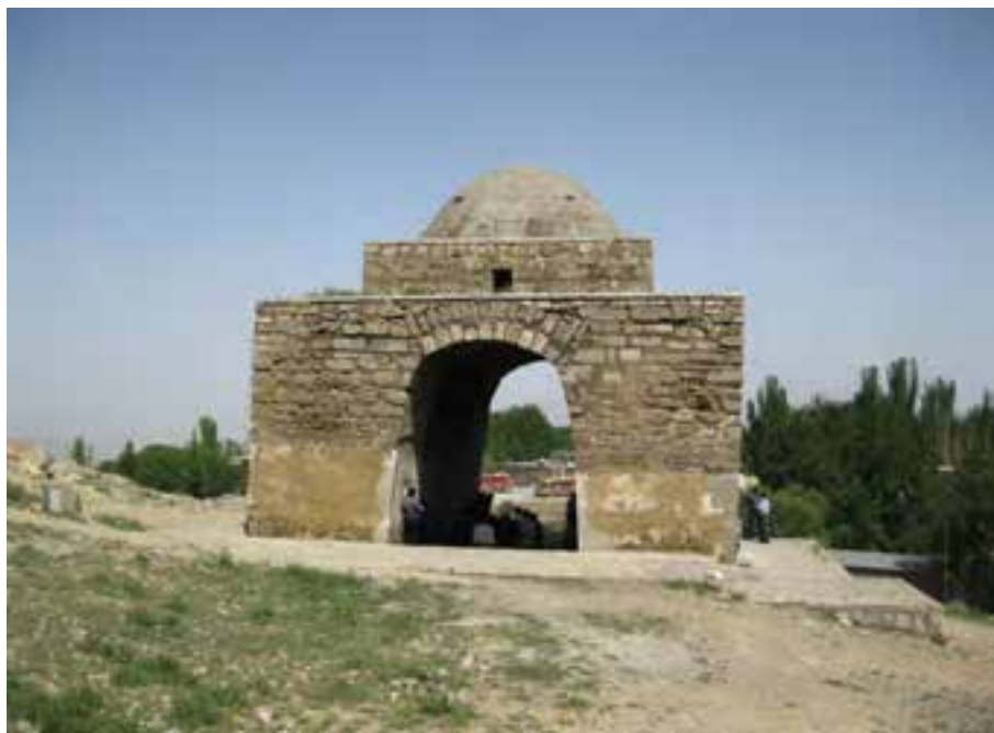
شکل ۵-۶- چهارطاقی نیاسر، مرکز انجام مراسم آیینی و اندازه‌گیری نجومی و تقویم‌نگاری در گذشته

در زمان فرمانروایی مادها، ایران دارای سه ایالت بزرگ بود که یکی از این ایالت‌ها بخش بزرگی از غرب استان اصفهان امروزی ایالتی به نام پارتاکن یا پارتیکان فریدن، فریدون‌شهر و چادگان امروزی به مرکزیت گابای (گی، جی) بود. اصفهان در زمان امپراتوری هخامنشیان به نام گابای یا گی شناخته می‌شده است. در عهد اشکانیان، حکومت ایران ملوک الطوائفی بود و بر هر یک از قسمت‌های مهم و وسیع آن، حکمرانی که لقب شاه داشت، فرمانروایی می‌کرد. در آن زمان، اصفهان یک ساتراپ (استان) به شمار می‌آمد. در دوره امپراتوری ساسانیان، آبادی‌های فراوانی در سطح استان اصفهان وجود داشته که آثاری از آنها باقی مانده است؛ مانند قلعه‌های متعدد ساسانی در آران و بیدگل (قلعه شرقی)، در سمیرم (تل نقاره و تل دهنه و گور دخمه طاقچه بت)، در فریدن (تپه خویگان)، در نائین (چهارطاقی شیرکوه، قلعه شیرکوه و چهارطاقی نخلک)، در نیاسر کاشان (چهارطاقی نیاسر)، در اصفهان (بنای آتشگاه و پل شهرستان) و بسیاری آثار دیگر. در این زمان، شهر اصفهان را سپاهان یا محلّ تجمع سپاه می‌نامیدند که واژه اصفهان از آن گرفته شده است. سپاهان محلّ سکونت و قلمرو خاندان‌های مهم حاکم و فرمانروایان و دژ مستحکمی برای ساسانیان بود.