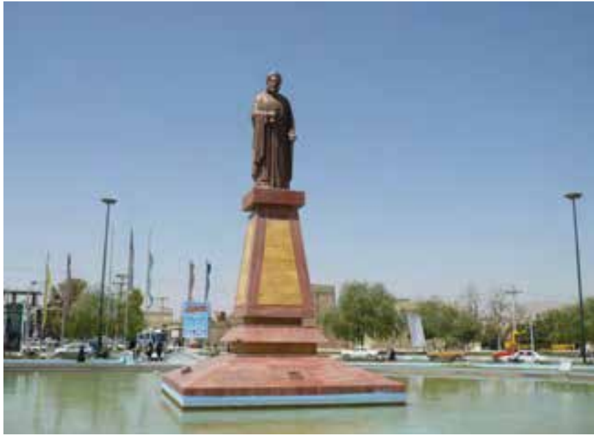
شکل ۱۰-۶- تندیس شیخ بهایی (ورودی شهر نجف آباد)

به غیر از شهر اصفهان در سایر شهرها و حتی روستاهای استان نیز آثاری از دوره صفویه به چشم می خورد؛ مثلاً کاشان، خوانسار، نجف آباد (ایجاد شهر در زمان صفویه)، کوهپایه و نائین.