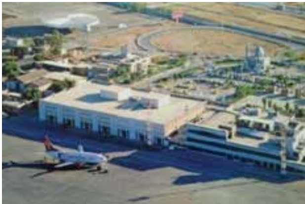
شکل ۹-۶- فرودگاه بین‌المللی اهواز