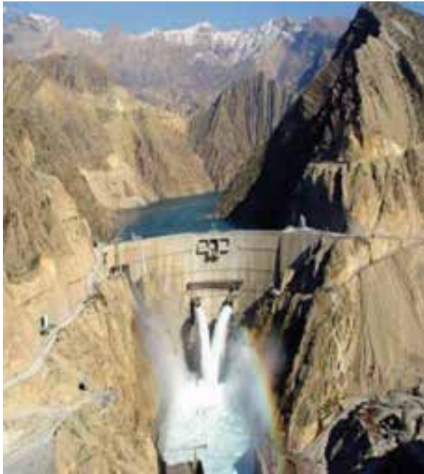
شکل ۴-۶- سد کارون ۳ بلندترین سد بتنی کشور

صنایع فلزی و غیر فلزی : صنایع فلزی استان به علت مجاورت با خلیج فارس و دارا بودن منابع سوختی فراوان از شرایط مناسبی برای توسعه برخوردار است. پس از پیروزی انقلاب اسلامی با ساخت و توسعه چهار کارخانه فولاد با تولید سالانه ۵ میلیون تن، خوزستان سهم عمده‌ای از تولید فولاد کشور را به خود اختصاص داده است. سایر طرح‌های در دست مطالعه مرتبط با بخش صنایع فلزی استان عبارت‌اند از: مجتمع ذوب و نورد خرمشهر، شرکت نورد و لوله کارون، فولاد شادگان و طرح فولاد اروند. در بخش تولید سیمان سه کارخانه با ظرفیت تولید ۸۳۰۰ تن در روز فعال‌اند. نیروگاه‌ها : در زمینه آب و برق قبل از پیروزی انقلاب اسلامی تنها دو سد مخزنی دز و شهید عباسپور با مجموع ۶/۶ میلیارد متر مکعب آب وجود داشت، ولی امروزه تعداد این سدها به شش مورد و گنجایش حجم آنها به حدود ۱۸ میلیارد متر مکعب افزایش یافت. ۶ سد مخزنی در مرحله ساخت و ۱۸ سد در دست مطالعه است. کرخه بزرگترین سد خاکی خاورمیانه، کارون ۳ مرتفع‌ترین سد بتنی و سد مسجد سلیمان (گدارلندر) مرتفع‌ترین سد خاکی کشور در استان قرار دارند. این سدها علاوه بر تولید برق کشور نقش مهمی در تأمین آب زمین‌های کشاورزی و صنایع استان را برعهده دارند.