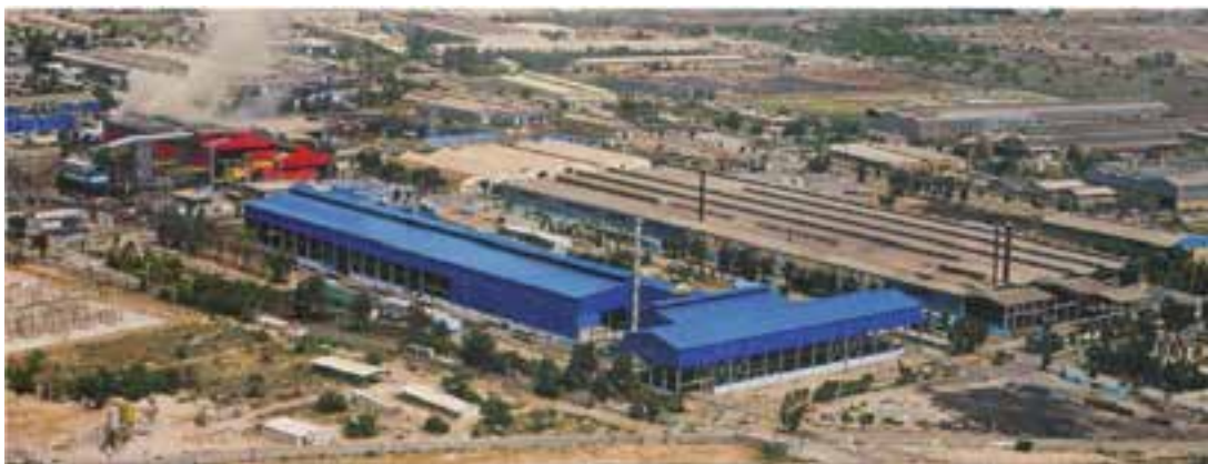
شکل ۲-۶- فولاد کویان - اهواز

چرا صادرات مشتقات پتروشیمی بر صادرات نفت خام اولویت دارد؟