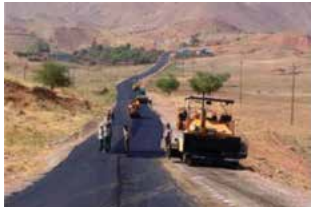
شکل ۸-۶- توسعه و احداث جاده‌های روستایی