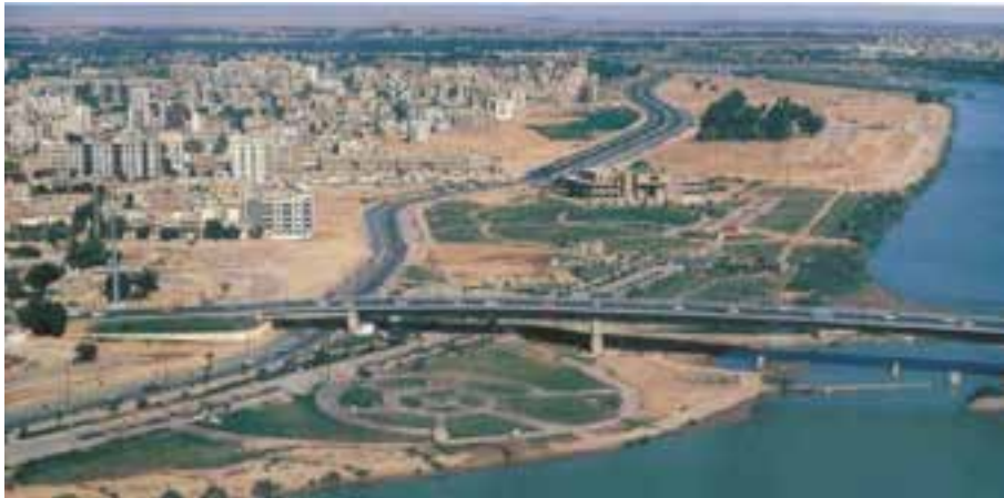
شکل ۱۰-۶- جاده ساحلی در حاشیه کارون - اهواز

توسعه عمران روستایی و محرومیت زدایی یکی از دستاوردهای انقلاب اسلامی بوده است. در بخش عمران روستایی مهم ترین اقدامات انجام شده در استان عبارتند از: - بهسازی سکونتگاه های روستایی - اجرای طرح های هادی روستایی - صدور اسناد مالکیت در روستاها