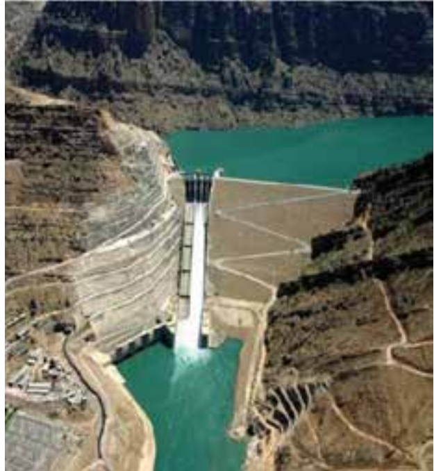
شکل ۳-۶- سد مسجد سلیمان (گدارلندر) بلندترین سد خاکی کشور

بیش از ۹۵ درصد ظرفیت نیروگاه‌های برق آبی کشور متعلق به خوزستان است و بدین ترتیب مقام اول کشور را در زمینه تولید برق به خود اختصاص می‌دهد. این استان به علت وجود سوخت‌های فسیلی، نیروگاه‌های حرارتی متعددی دارد که با توجه به صنایع متعدد، تراکم زیاد جمعیت و گرمی هوا، دومین مصرف‌کننده برق کشور محسوب می‌شود.