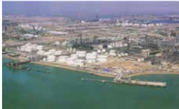
شکل ۱-۶- منطقه ویژه پتروشیمی ماهشهر