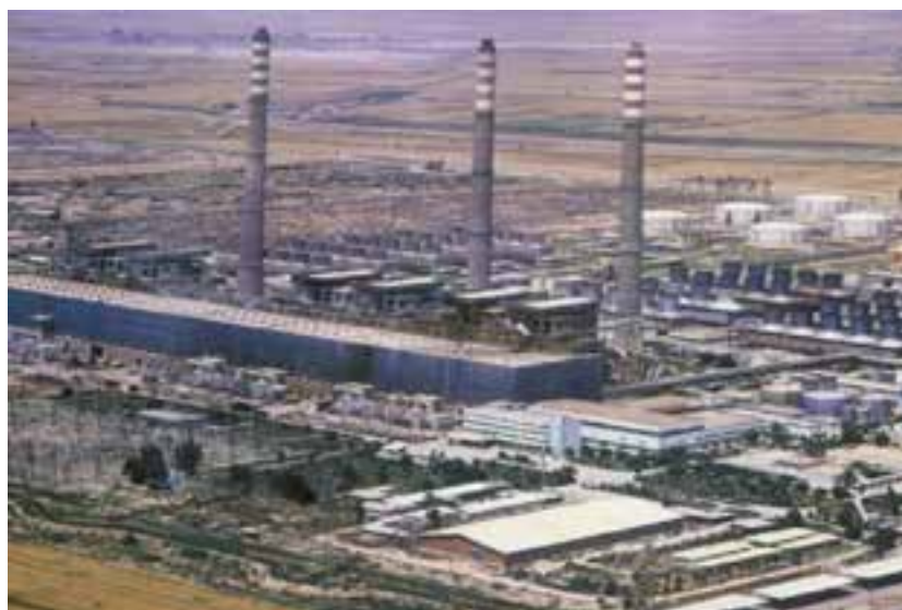
شکل ۵-۶- نمایی از توسعه نیروگاه حرارتی رامین اهواز