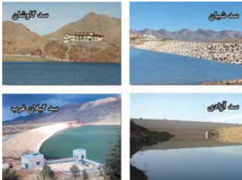
شکل ۳-۶- نمایی از برخی از سدهای استان کرمانشاه