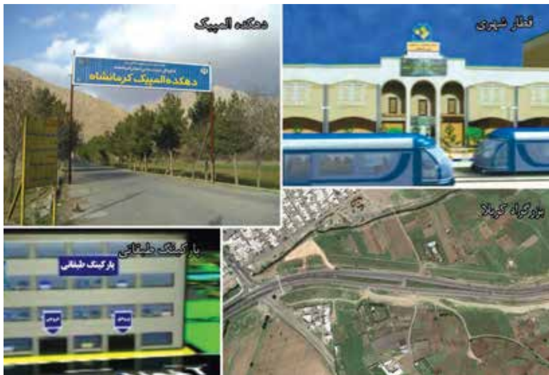
شکل ۸-۶- بخشی از چشم انداز استان کرمانشاه در بخش خدمات