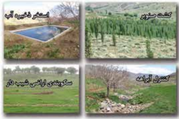
شکل ۵-۶- مهم ترین دستاوردهای بخش منابع طبیعی