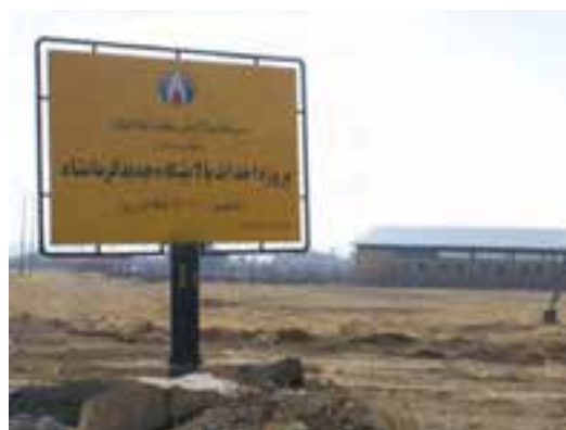
شکل ۶-۶- پالایشگاه نفت آنارک کرمانشاه