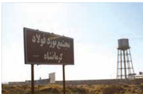
شکل ۷-۶- مجتمع نورد فولاد کرمانشاه