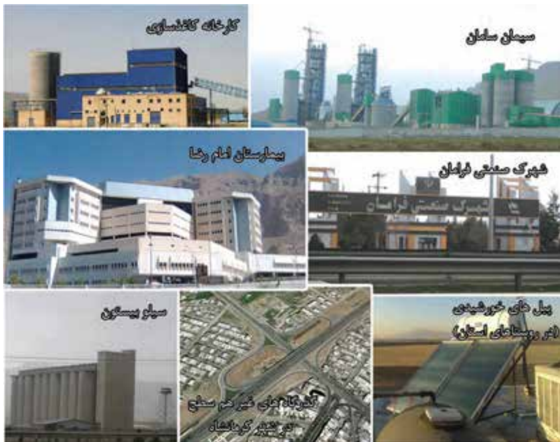
شکل ۴-۶- تصاویری از دستاوردهای استان کرمانشاه