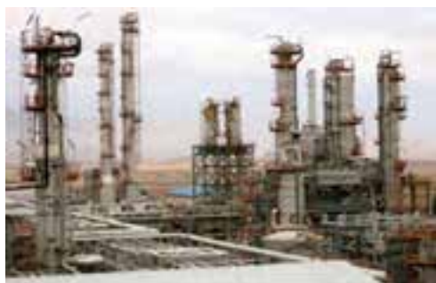
شکل ۲-۶- مجتمع پتروشیمی کرمانشاه