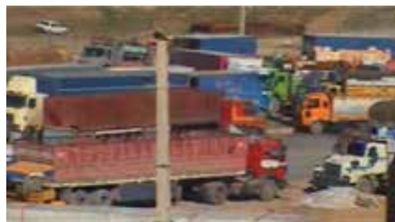
شکل ۱-۶- بازارچه مرزی پرویزخان

در دهه اول پس از انقلاب اسلامی، سرعت توسعه در بخش‌های زیربنایی و عمرانی استان کرمانشاه مانند دیگر استان‌های واقع در غرب کشورمان، به دلیل موقعیت مرزی و تأثیر مستقیم از جنگ تحمیلی، روند کندی داشت. اما در دهه‌های بعدی روند حرکت سرعت بیشتری یافته است. نمود این تحولات در استان را می‌توان در بخش‌های مختلف اقتصادی و زیربنایی مشاهده کرد. در این درس به‌طور گذرا مهم‌ترین این دستاوردها در بخش‌های مختلف بررسی می‌شود: