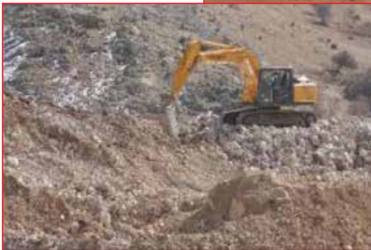
معدن سنگ آهک