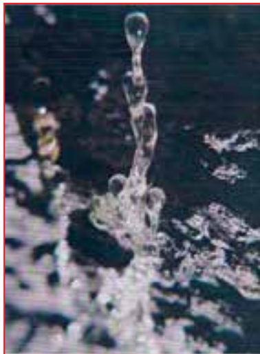
صمغ بنه، پسته و حشی