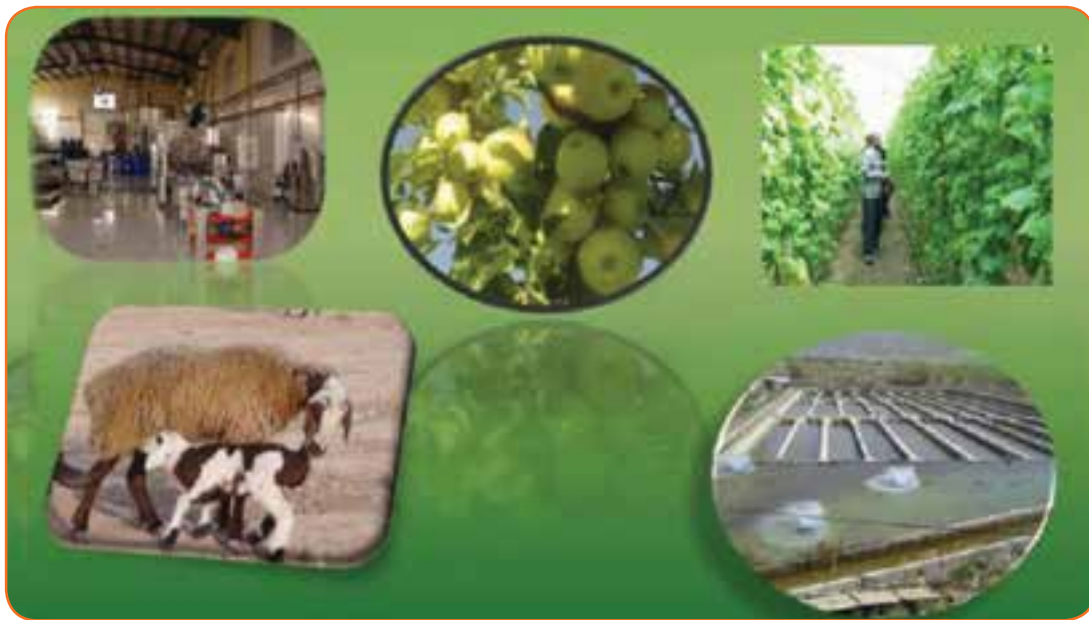
شکل ۱۵-۵. بخشی از توأمندی های اقتصادی استان

بخش کشاورزی در استان می تواند در تولید اشتغال و امنیت غذایی کشور نقش مهمی داشته باشد. استان کهگیلویه و بویراحمد در سال زراعی ۸۸-۱۳۸۷ حدود ۲۶۲۰۰۰ هکتار اراضی زراعی آبی و دیمی را به خود اختصاص داده است و سطح زیر کشت گندم آبی و دیم به ترتیب به ۲۵۱۱۰ و ۸۰۰۰ هکتار رسیده است. از نظر تولید حبوبات با ۵۹۶۲ تن دارای رتبه ۱۱ و از نظر تولید محصولات باغی این استان در زمینه تولید گردو در کشور رتبه دوم و از نظر تولید سیب درختی در رتبه نهم قرار دارد. این استان در تولید جو رتبه هشتم کشور را داراست.