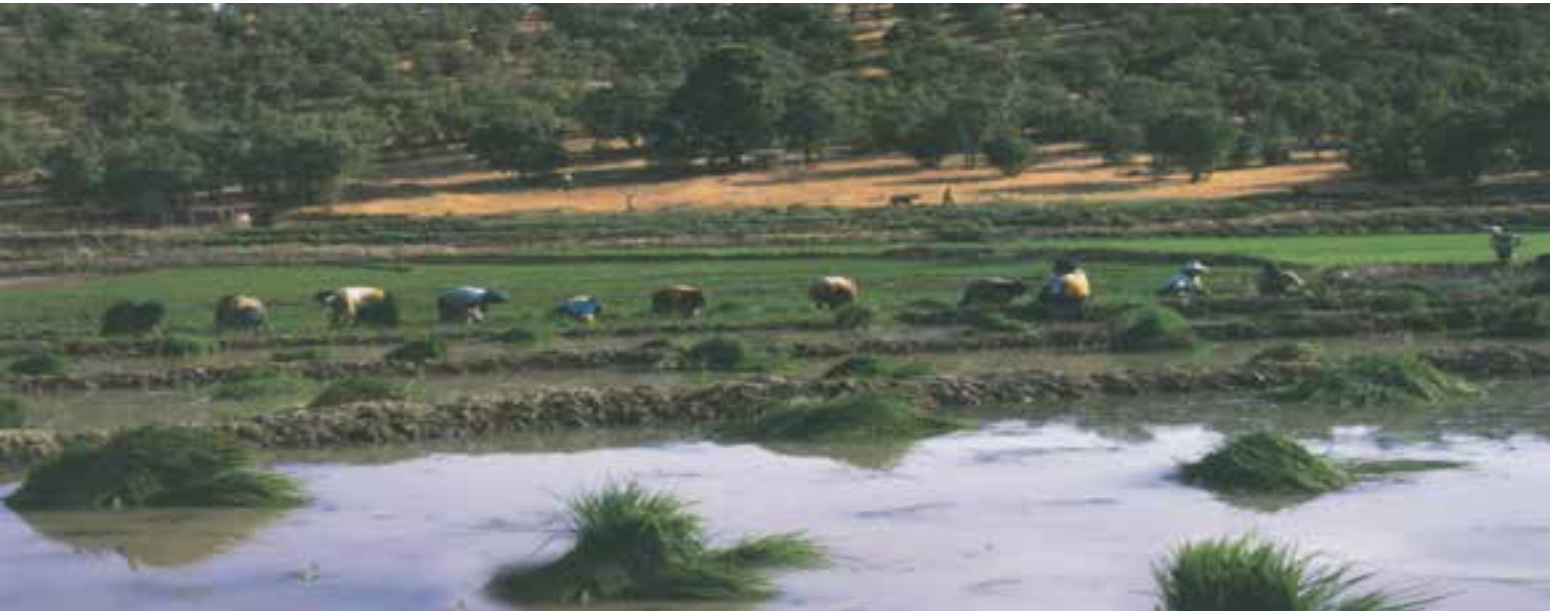
شکل ۲-۶ - شهرستان دنا، روستای کریک