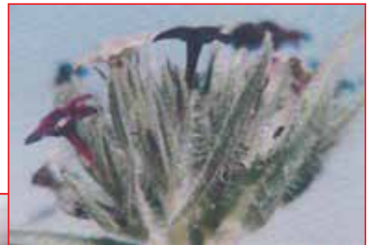
گل عسل، هوه جویه (گل)