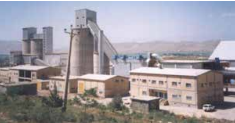
شکل ۲۲- ۵