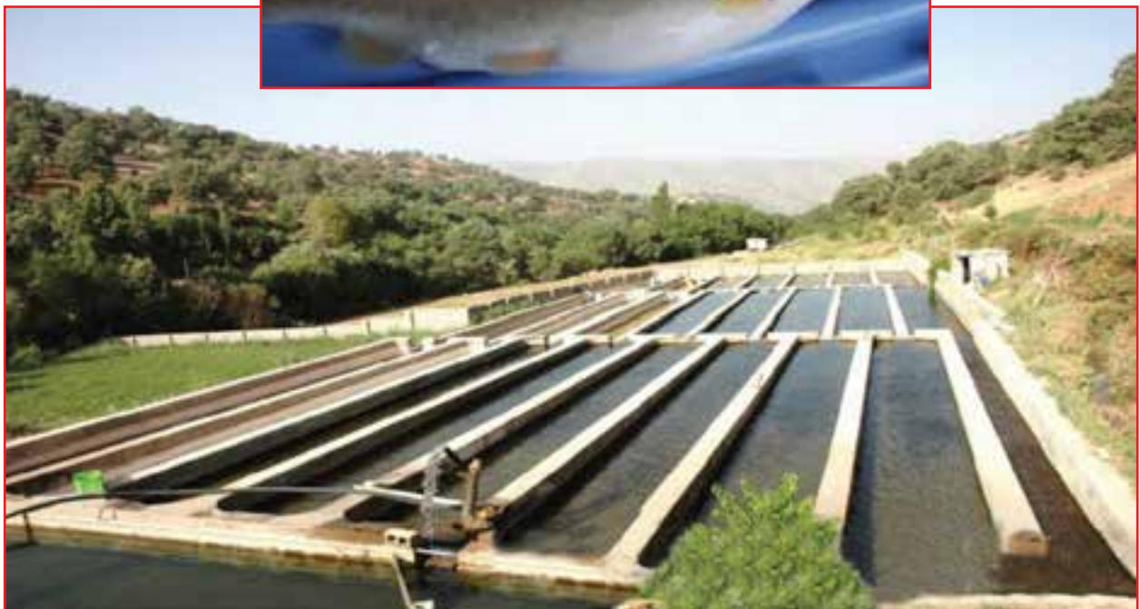
شکل ۱۹-۵ - مزرعه پرورش ماهی قزل‌آلا