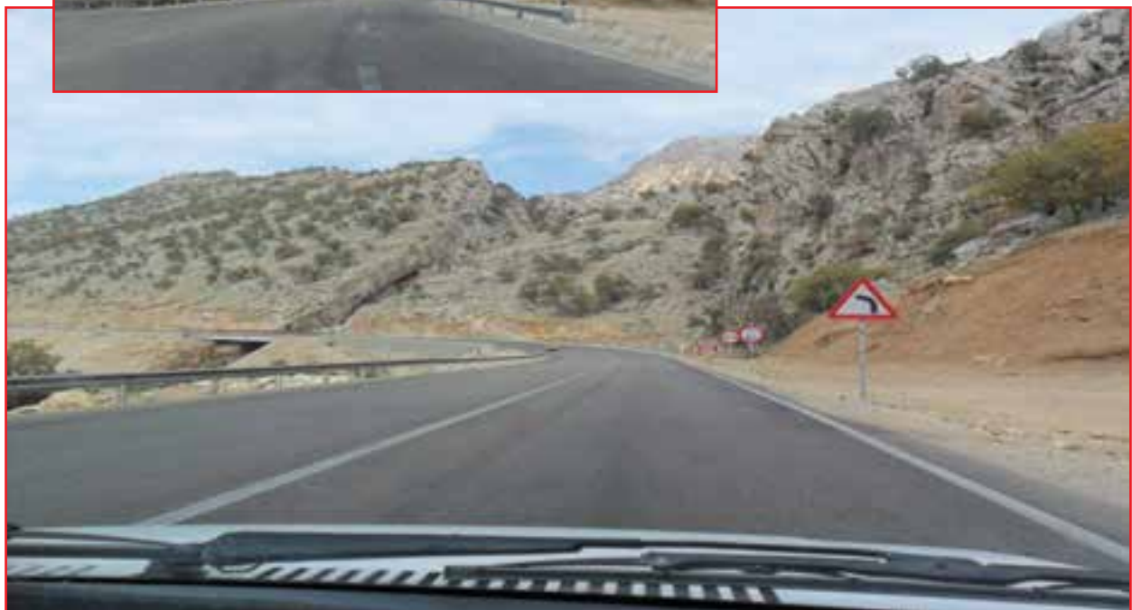
شکل ۲۰-۵- راه‌های ارتباطی استان