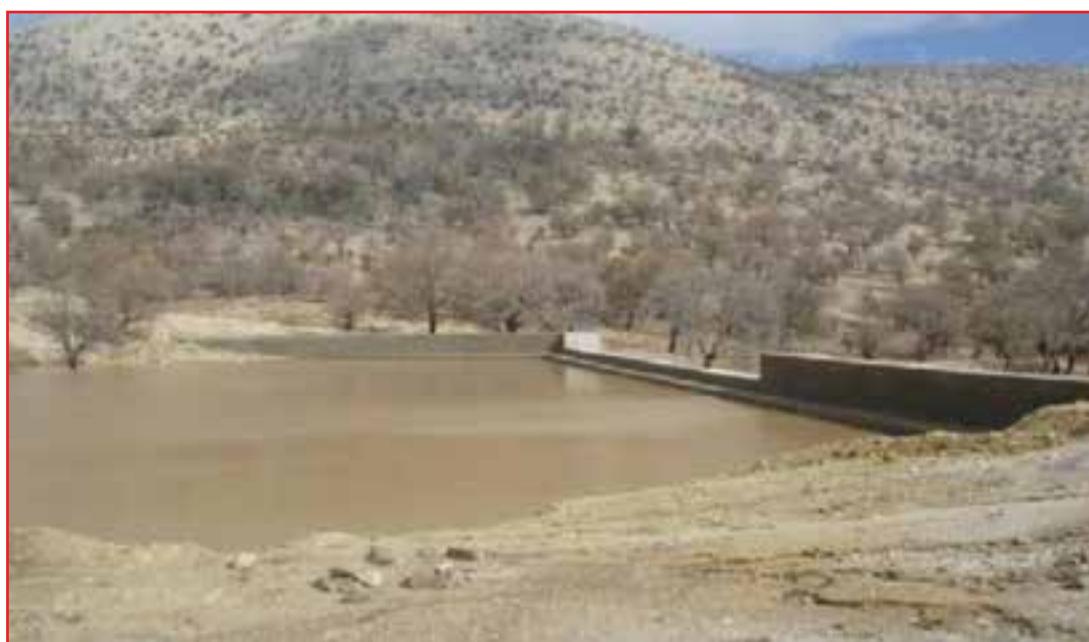
شکل ۱۶-۵- توانمندی‌های حوزه آبخیزداری استان در مهار آب