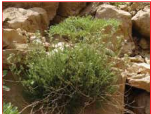
درمنه (آویشن مه)

شکل ۱۸-۵- چند نمونه از گیاهان دارویی و صنعتی استان