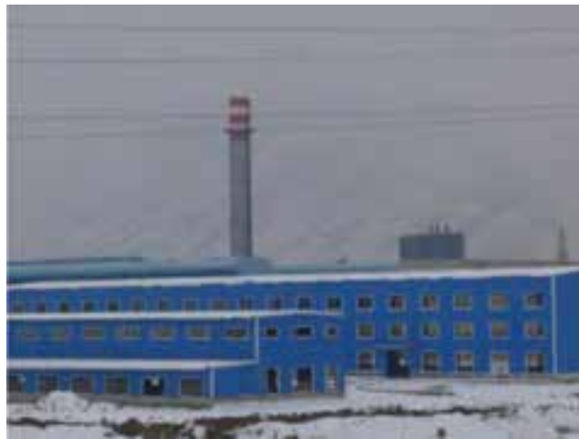
شکل ۳۶-۵- آلومینیوم سازی اراک