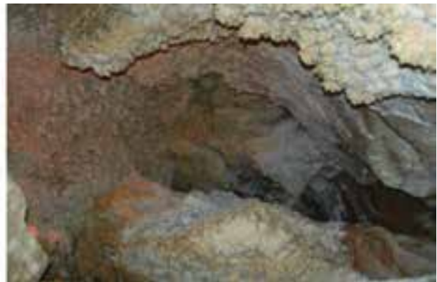
شکل ۱۱-۵- غار نخجیر دلیجان

۸- منطقه حفاظت شده هفتاد قله : این منطقه با مساحت حدود ۹۷۴۳۷ هکتار بین شهرستان‌های اراک، خمین و محلات قرار دارد. این منطقه از نظر تنوع زندگی گیاهی، جانوری، رسوبات و سنگ‌های آتشفشانی از مهم‌ترین مناطق طبیعی به شمار می‌رود. حدود ۲۰۵ گونه گیاهی در منطقه می‌روید که عمده‌ترین آنها گندمیان، گاوزبان، درمنه، گون، شیرین بیان، ورک، خاکشیر، بومادران و ریواس می‌باشند. از مهم‌ترین خزندگان منطقه می‌توان به لاک پشت، انواع سوسمار، مارمولک، مار و افعی اشاره کرد. در منطقه هفتاد قله حدود ۷۱ گونه پرنده شناسایی شده که برخی از آنها عبارت‌اند از: دلجه، عقاب طلایی، چکاوک، چلچله، کبک، تیهو و بلدرچین. در این زیستگاه گوستخواران و علفخوارانی مانند پلنگ، کاراکل، گورکن، کل، بز، قوچ، میش و آهو در جهت ایجاد تعادل اکوسیستم آن زندگی می‌کنند. در این منطقه کتیبه‌های سنگی در دره چکاب و سبیک وجود دارد که در سال ۱۳۹۰ ثبت میراث فرهنگی شده‌اند. منطقه تحت نظارت اداره کل حفاظت محیط زیست استان مرکزی است و ورود به آن نیاز به کسب مجوز دارد. یکی از راه‌های دسترسی به آن از جاده اراک - قم و روستاهای ابراهیم‌آباد یا شاهسواران است.