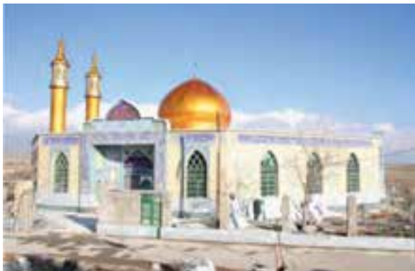
شکل ۱۴-۵- امامزاده معصومه سیاشان در آشتیان

۱– جاذبه‌های مذهبی: استان ما از مهم‌ترین سرزمین‌های اسلامی است که در طول تاریخ به عنوان خاستگاه و مکانی ویژه جهت ترویج دین اسلام مورد توجه مسلمانان بوده است. وجود بقاع متبرکه، مساجد، تکیه‌ها، حسینیه‌ها، مراسم عزاداری و احترام ویژه به نوادگان و خاندان پیامبر اسلام و امامان معصوم این استان را به یکی از قطب‌های گردشگری مذهبی تبدیل کرده است.