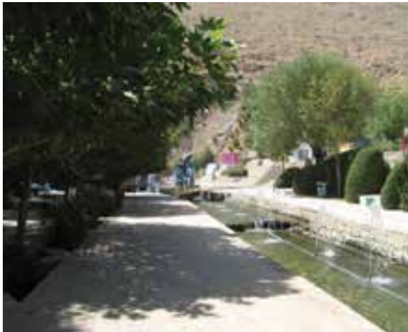
شکل ۷-۵- چشمه عباس‌آباد شازند

در ضلع شرقی شهر شازند واقع شده و به سوی روستای عباس‌آباد و اکبرآباد جریان می‌یابد. حجم خروجی آب چشمه بین ۲۵۰ تا ۳۰۰ لیتر در ثانیه است و جزء آب‌های بسیار مناسب شرب به شمار می‌آید. این چشمه آهکی است و از آب آن برای کشاورزی و شرب استفاده می‌شود. در دهانه چشمه به سوی روستای عباس‌آباد که مسیر جریان آب است، درختان زیبای صنوبر و بید کاشته شده و با ساخت سرویس‌های بهداشتی، نمازخانه، آلاچیق، برق‌کشی و فضاسازی، مکان مناسبی برای گردشگران فراهم آمده است.