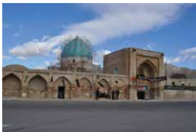
شکل ۱۵-۵- مجموعه زیارتی شهر آستانه

۳- مجموعه زیارتی هفتاد و دو تن شهر ساروق: در این شهر مجموعه‌ای از آثار، ابنیه، تپه‌های باستانی و بقاع متبرکه قرار گرفته‌اند. طبق اسناد و مدارک موجود، در این مجموعه زیارتی امامزاده طاهر(ع)، شاهزاده علی(ع) و همچنین چهارتن از فرزندان و نوادگان امام سجاد(ع) و ۶۶ نفر از نوادگان امامان معصوم (علیهم السلام) و مریدان و شهدای اسلام دفن شده‌اند. این بنا متعلق به قرن ۶ هجری است. در جنب امامزاده یک آب انبار قدیمی و بقعه‌ای دیگر معروف به چهل دختران وجود دارد. در حیاط و صحن امامزادگان (علیهم السلام) امکانات مناسب برای استراحت و اقامت کوتاه مدت زائران فراهم شده است. راه دسترسی به آن از شهر اراک به فرمهین، از دو راهی آهنگران و ساروق می‌باشد.