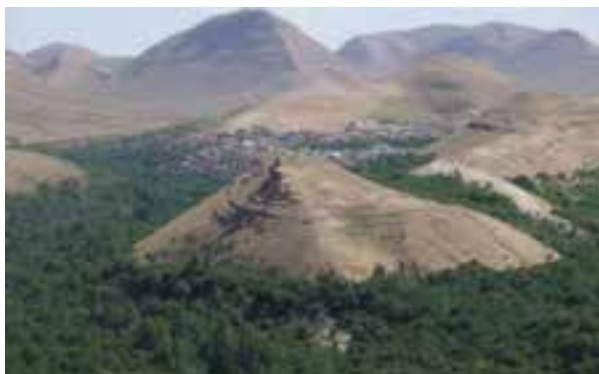
شکل ۲۵-۵- روستای وفس

۹- روستای تاریخی وفس: این روستا در شهرستان کمیجان قرار دارد. چشم‌اندازهای طبیعی و کوهستانی آن توجه گردشگران را به خود جلب می‌کند. مردم آن به گویش تاتی سخن می‌گویند. این روستا مستعد سرمایه‌گذاری جهت گردشگری است.