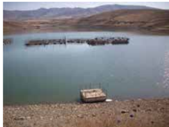
شکل ۱-۵- سد خاکی هندودر