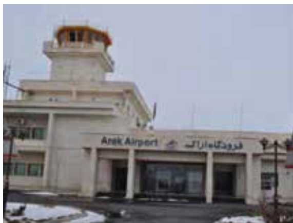
شکل ۳۹-۵ فرودگاه اراک