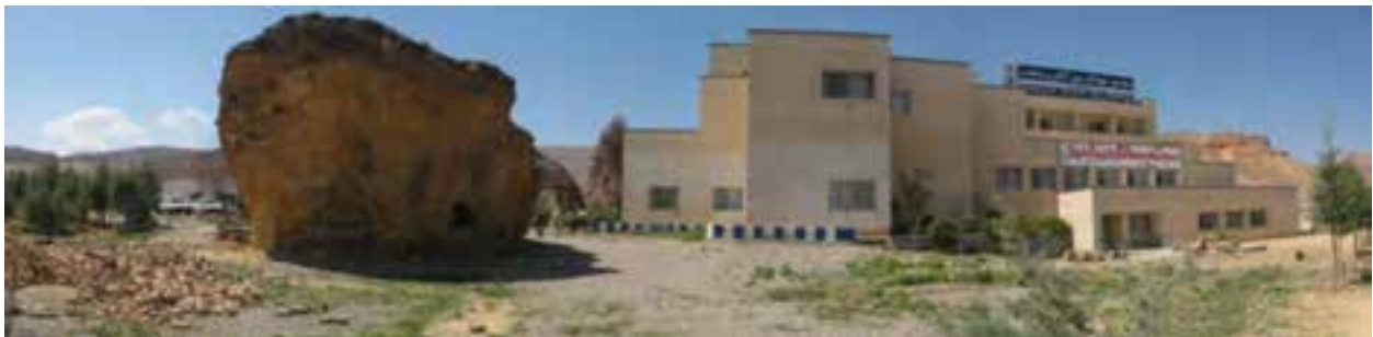
شکل ۵-۵- مجتمع آبگرم محلات

۱- چشمه آبگرم محلات : در شمال شرقی محلات و در دامنه کوه خورزن مجموعه ای از چشمه های طبیعی، آبگرم و معدنی با آبدهی بالا قرار دارند که از اعماق زمین با حرارت حداکثر ۵۰ درجه سانتی گراد به سطح زمین جاری می شوند. سرچشمه اصلی آبگرم داخل محوطه، زیر صخره ای بزرگ و سنگی قرار دارد که توسط لوله هایی متعدد به استخر و حمام های اطراف هدایت می شود.