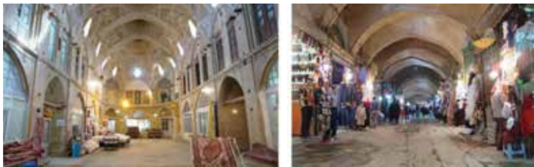
شکل ۲۰-۵- بازار اراک

۴- بازار اراک : مجموعه بازار اراک در سال ۱۲۳۱ ه.ق در بافت مرکزی شهر بنا شد. این بنای تاریخی، ترکیبی از معماری سنتی و مدرن است و در چهار جهت به دروازه‌های اصلی شهر (قبله در جنوب، راهزان در شمال، حاج علی‌نقی در مغرب و شهرجرد در مشرق) منتهی شده است. بازار دارای یک محور شمالی - جنوبی به طول ۸۵ متر و یک محور شرقی - غربی به طول ۶۰ متر است. این دو بازار در محل چهارسوق به هم متصل می‌شوند (چهارسوق در ۶۰ متری جنوبی بازار است). مصالح غالب در ساخت آن آجر با ملات گچ، آهک و خاک رس بوده و سقف آن گنبدی است که در مرکز هر گنبد نورگیری تعبیه شده و کار هواکش را هم انجام می‌دهد. حجره‌ها در راسته بازار استقرار دارند و کارگاه‌های تولیدی باراندازها، انبارها، بازارچه‌های اختصاصی در سراهای بازار (نوذری، کتابفروشی، آفایی، گلشن و نوروزی) قرار گرفته‌اند. در بازار سایر اماکن مانند مسجد، سقاخانه، حمام و مدرسه علمیه نیز ساخته شده‌اند. بازار جنوبی تا گذر اول دو طبقه است که ارتفاع آن به ۸ متر می‌رسد. به استثنای این مورد بقیه ۴ متر ارتفاع دارد. بازار اراک از نوع بازار صلیبی است. در سال ۱۳۸۸ کف بازار نوسازی شده است.