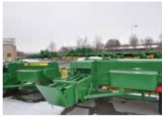
شکل ۳۷-۵- کمپاین سازی اراک