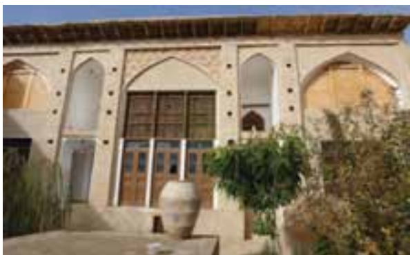
شکل ۲۶-۵- موزه مردم شناسی آشتیان

۹- روستای تاریخی وفس: این روستا در شهرستان کمیجان قرار دارد. چشم‌اندازهای طبیعی و کوهستانی آن توجه گردشگران را به خود جلب می‌کند. مردم آن به گویش تاتی سخن می‌گویند. این روستا مستعد سرمایه‌گذاری جهت گردشگری است.