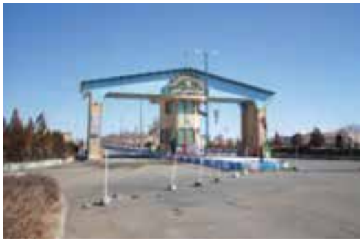
شکل ۴۲-۵- شهرک صنعتی خمین

ناحیه صنعتی شهید فروزان در مجاورت شهر ساروق، شهدای گرگان در شهرستان آشتیان، شهدای راونج در شهرستان دلیجان، ناحیه صنعتی نخجیروان در شهرستان محلات، شهید عبدالعلی سعیدی و شهدای خرم‌دشت در شهرستان خمین، ناحیه صنعتی یرندک (زرندیه) و نواحی صنعتی بابایی و نهرمیان در شهرستان شازند.