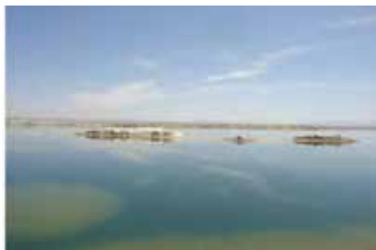
شکل ۸-۵- کویر میقان اراک

۵- دریاچه سد پانزده خرداد : این سد در ۵ کیلومتری شهر دلیجان قرار دارد. در این دریاچه امکانات مناسبی برای توسعه اسکی روی آب و ماهی گیری و... فراهم آمده است.