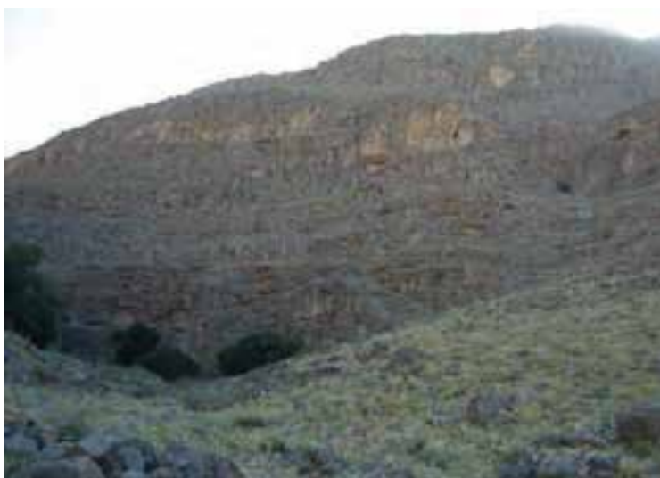
شکل ۱۲-۵- منطقه حفاظت شده هفتاد قله

۹- پیست اسکی : دریاچه‌های حاصل از سدهای الغدير، ۱۵ خرداد، کمال صالح، ارتفاعات شازند و اراک از مهم‌ترین مناطقی‌اند که برای اسکی روی آب و برف در فصول مختلف مناسب‌اند. تأسیسات اسکی روی برف در ارتفاعات گردنه پاکل شازند طراحی و ساخته شده است. این پیست در جاده آسفالتی شازند - هندودر در فاصله ۴۵ کیلومتری شهر اراک قرار دارد. در پیست اسکی امکانات مناسب مانند رستوران، خط تله کابین و اسکی جهت علاقه‌مندان فراهم شده است.