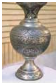
شکل ۳۱-۵- قلمزنی