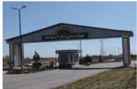
شکل ۴۱-۵- شهرک صنعتی اراک ۲ (ایبک‌آباد)