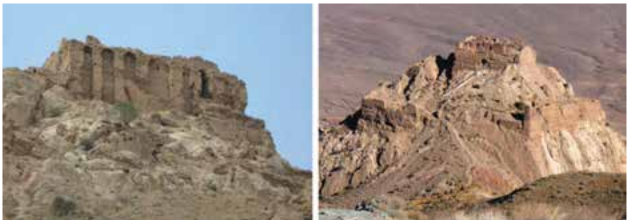
شکل ۲۳-۵- قیز قلعه ساوه

۷- قلعه دختر (قیز قلعه): یکی از مهم‌ترین آثار شگفت‌انگیز معماری کشور که در یکی از مناطق صعب‌العبور ایران در دوره باستان ساخته شده قیز قلعه ساوه است. عبادتگاه و دژ دفاعی قلعه دختر روی صخره بلندی مشرف به دشت ساوه بنا شده و از دو بخش اصلی دژ دفاعی و قصر تشکیل شده است.