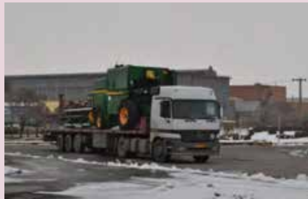
شکل ۴۸-۵ صادرات کارخانه کمباین سازی اراک