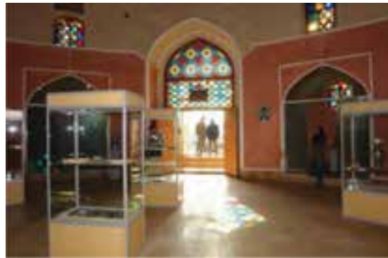
شکل ۲۷-۵- موزه چهار سوق ساوه