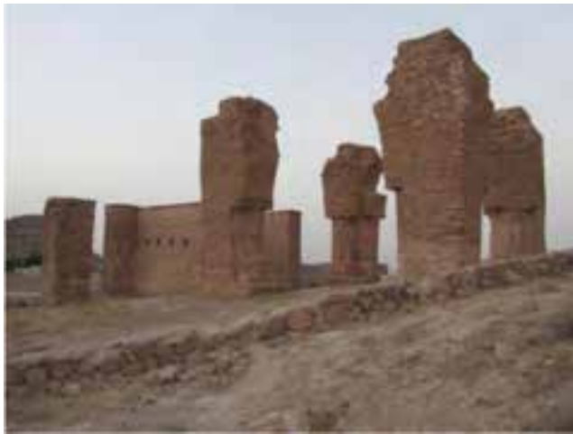
شکل ۱۸-۵- آثار باستانی شهر نیمور (دوره ساسانی)