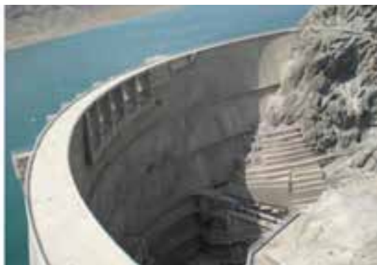
شکل ۱۰-۵- سد الغدیر ساوه