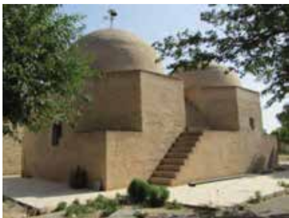
شکل ۱۶-۵- امامزاده هفتاد و دو تن شهر ساروق