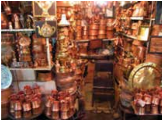
شکل ۲۸-۵- مسگری