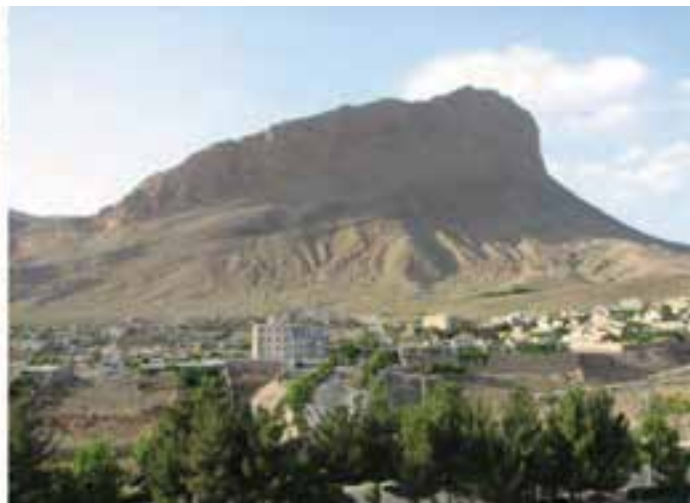
شکل ۱۹-۵- شهر تاریخی نراق و بازار آن