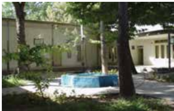
شکل ۲۴-۵- بیت حضرت امام خمینی(ره) در خمین