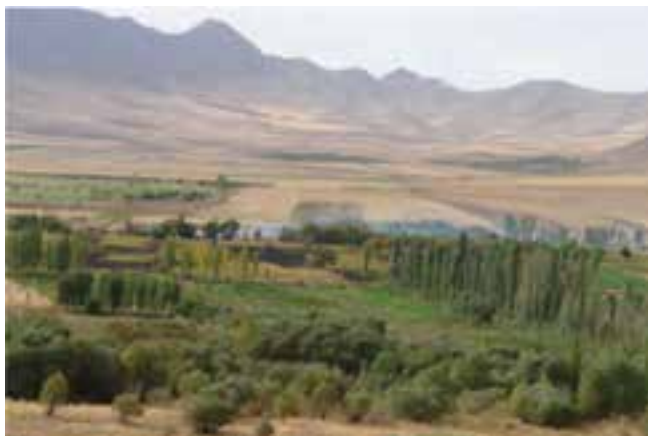
شکل ۲-۵- دشت خنداب

استان مرکزی دارای جاذبه‌های طبیعی فراوان مانند: کوه‌های مرتفع (سفیدخانی در اراک، اینچه قاره در نوبران، برف شاه در هفتاد قله، دو خواهران در تفرش، هفت سواران در خمین، شاه پسند در ساوه، غلیق در دلیجان و راسوند در شازند و بیش از ۱۴ قله با ارتفاع بیش از ۲۰۰۰ متر)، دشت‌ها، مخروط افکنه‌ها، دره‌های سرسبز، غارها (سوله خونزا در روستای شمس‌آباد اراک، آسیلی در انجدان، غار پریه در زرنديه خرقان، سوراخ گاو در خوره و یخچال در کوه راسوند شازند و یخچال سالمان دوز در آقداش در نوبران)، چشمه‌های معدنی، رودخانه‌ها، پارک‌ها، شکارگاه‌ها، گل‌های زینتی، کویر و تالاب است که برای گردشگری بسیار مناسب‌اند.