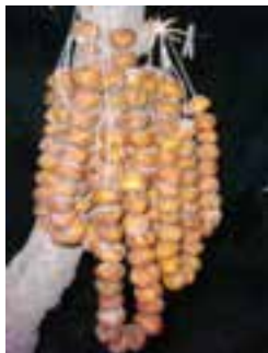
شکل ۳۲-۵- جوزقند نراق

مهم‌ترین سوغات‌های استان عبارت‌اند از: خشکبار، کشک، برگه زردآلو، فتیر، گل و گیاه زینتی، صابون، طالبی، انار، گردو، حلوا ارده، فندق، بادام، عسل و جوزقند، پسته (زرنده و ساوه).