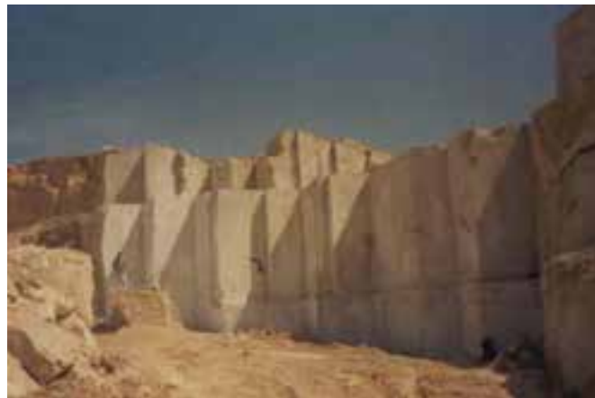
شکل ۴۷-۵- معادن سنگ محلات

در استان مرکزی ۴۱ ماده معدنی از ۱۲۷ معدن بهره‌برداری می‌شود که شامل ۴/۸ درصد از معادن فعال کشور است. این استان رتبه هفتم را در کشور از لحاظ تعداد معادن به خود اختصاص داده است که از این میان ۳۶ درصد معادن شن و ماسه، ۲۴ درصد سنگ‌های تزئینی و ۱۰ درصد آن را معادن باریت تشکیل می‌دهد. بیشترین معادن به ترتیب در ساوه، اراک، محلات، دلیجان و خمین پراکنده است. مهم‌ترین معادن استان عبارت‌اند از: سنگ آهن در شمس‌آباد اراک، سولفات سدیم در کویر میقان اراک، باریت، سرب، روی، سنگ‌های تزئینی، سنگ آهک خرقان زرنديه و گچ کائولن در نوبران ساوه، محلات، دلیجان و خمین.