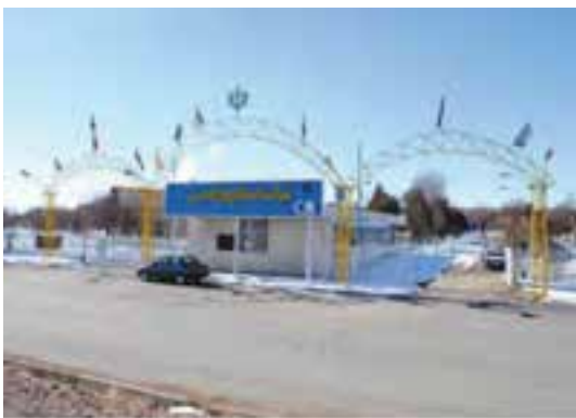
شکل ۳۸-۵- کارخانه نخ ریزی خمین