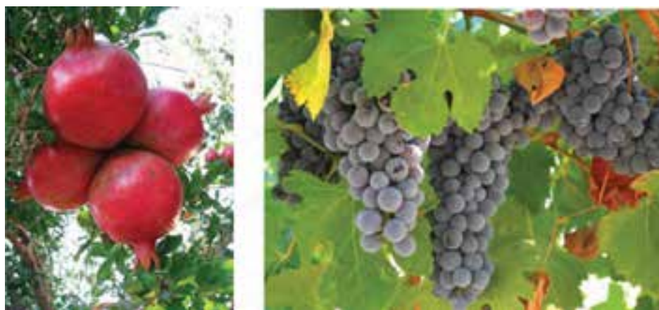
شکل ۳۳-۵- محصولات باغداری استان مرکزی

استان مرکزی به علت آب و هوای متنوع، اراضی و دشت‌های حاصل خیزی مثل دشت ساوه، فراهان، شازند، اراک، خنداب و خمین، خاک مناسب، نیروی انسانی، به کارگیری تجهیزات پیشرفته و مدرن در کشاورزی، اصلاح روش‌های کاشت، داشت، برداشت، کنترل آب‌های سطحی، حفر چاه‌های عمیق و نیمه عمیق از توانمندی بالایی در تولید محصولات کشاورزی برخوردار است. ۴۶ درصد اراضی زیر کشت استان مرکزی به صورت کشت دیمی و ۵۴ درصد کشت آبی است.