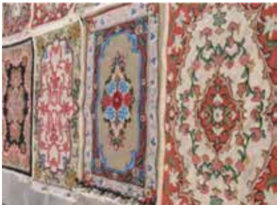
شکل ۲۹-۵- فرش استان