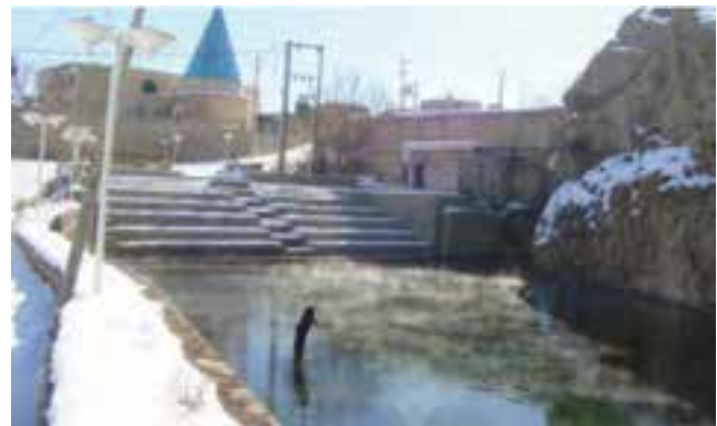
شکل ۱۳-۵- امامزاده نوح بالقلو نویران

مجموعه زیارتی مشهد اردهال، آستانه، ساروق، ریحان و بیش از یکصد آرامگاه و بقعه‌های امامزادگان (علیهم السلام) و مساجد جامع ساوه و شش ناو تفرش زمینه‌های توسعه صنعت گردشگری مذهبی استان را به وجود آورده‌اند.