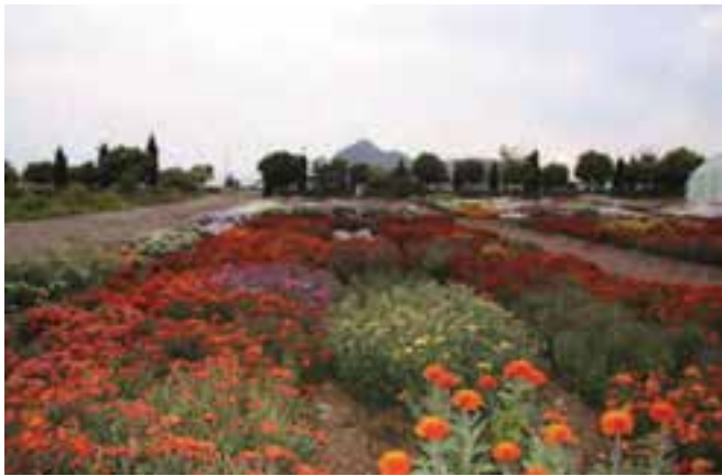
شکل ۴-۵- پرورش گل های زینتی در محلات