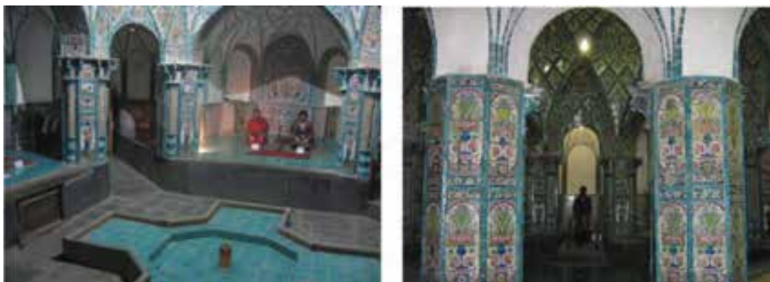
شکل ۲۱-۵- حمام چهار فصل اراک

۵- حمام چهار فصل : این بنای تاریخی توسط حاج محمد ابراهیم خوانساری در سه قسمت مجزای مردانه، زنانه و اقلیت‌های مذهبی بنا شده است. رخت کن حمام مردانه با کاشی‌های هشت رنگ زیبا تزیین شده است و هشت ستونی که گنبد اصلی روی آنها قرار گرفته، دارای پیچ‌های بسیار زیبا و کاشی‌کاری با طرح گل و بوته است. از قسمت اقلیت‌های مذهبی در دو نوبت مردانه و زنانه استفاده می‌شده است.