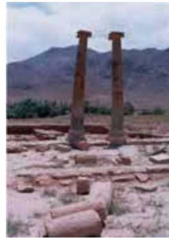
شکل ۱۷-۵- آثار باستانی خورهه محلات (دوره سلوکی - اشکانی)

۲- شهر زیرزمینی ذلف آباد : ذلف آباد در ۵ کیلومتری شمال شرق شهر فرمهین واقع شده که یکی از بزرگ ترین سکونتگاه های تاریخی فراهان و استان به شمار می آید. این محوطه تاریخی در کنار امامزاده احمد بن علی (ع) واقع است. کاوش های باستانی برای اکتشافات بیشتر ادامه دارد.