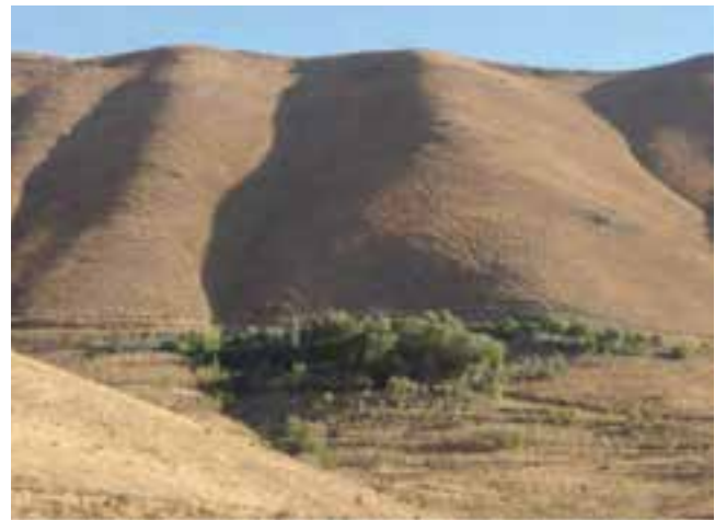
شکل ۶-۵- چشمه چقلی اراک

۴- کویر میقان (دریاچه میقان): در شمال شرقی اراک دریاچه‌ای فصلی قرار دارد که در هنگام بارندگی پر آب و در زمان کمی بارش به باتلاق و نم‌زار تبدیل می‌شود و خاک آن از مارن و رس است، در اثر تبخیر آب در این دریاچه طبقات نمکی شکل می‌گیرند. در گذشته مردم روستاهای حاشیه کویر گودال‌هایی در کنار دریاچه می‌کنند و نمک آن را استخراج و بعد از تصفیه به مصرف می‌رسانند. مساحت دریاچه بین ۱۰۰ تا ۱۱۰ کیلومتر مربع است که در زمستان زیستگاه پرندگان مهاجر به‌ویژه درنا از سرزمین‌های سرد سیبری است.