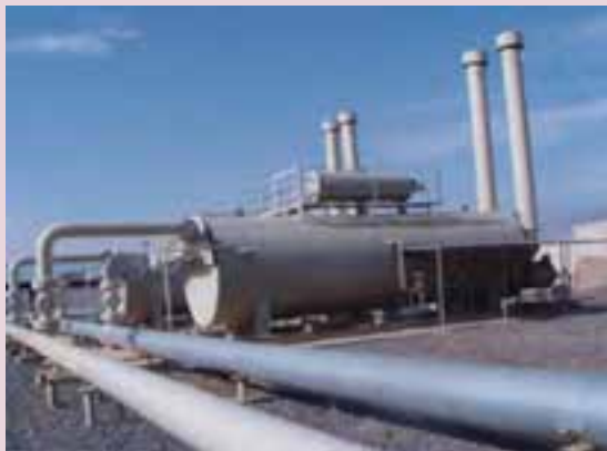
شکل ۴۹-۵ خدمات گازرسانی

بخش خدمات استان در سرشماری سال ۱۳۸۵ بیش از ۲۴ درصد از جمعیت شاغل را جذب کرده است و با پشتیبانی از تولیدات بخش کشاورزی و صنعت، صادرات استان را از سال ۱۳۸۲ تا کنون بیش از واردات آن کرده است. به طوری که محصولات کشاورزی استان (انار، لوبیا، طالبی، گل و گیاه زینتی، پسته، انگور و کشمش) به بیش از ۱۹ کشور دنیا صادر می‌شود و محصولات صنعتی شامل پتروشیمی، شمش و پروفیل آلومینیوم، سازه‌های فلزی، تجهیزات نیروگاهی و پالایشگاهی، مخازن، دیگ‌های بخار، پروفیل‌های فولادی، جرنقیل، واگن قطار، ماشین‌آلات راه‌سازی، کمباین، تجهیزات کشاورزی، مصالح ساختمانی (کاشی، سرامیک، چینی‌های بهداشتی و شیرآلات) انواع رنگ، دکل‌های انتقال نیرو، انواع لوازم خانگی، انواع شیشه، قطعات خودرو، لاستیک، سیمان، سنگ‌های تزئینی، انواع مواد غذایی، پودرهای شوینده، داروهای دامی و... به ۶۸ کشور دنیا صادر شده است. صادرات غیرنفتی استان بالغ بر ۵۸ میلیون دلار بوده است و به طور متوسط ۶ درصد از صادرات غیرنفتی کشور را به خود اختصاص داده است. متوسط سرانه غیرنفتی استان ۲۲۵ دلار است، در حالی که متوسط سرانه کشور ۷۷ دلار بوده است و این بیانگر توانمندی استان در بخش خدمات و بازرگانی است.