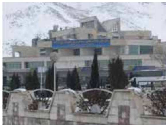
شکل ۴۰-۵ پایانه مسافری اراک

اگر مشکلات صنایع با تدابیر و راه‌های مناسب کاهش یابند، به تدریج سهم و توانمندی استان در سطح ملی و فراملی افزایش می‌یابد. برای کاهش محدودیت‌ها در بخش صنعت بهتر است که فعالیت‌های زیر انجام گیرند : ۱- توسعه و گسترش صنایع جدید و اجتناب از گسترش‌های صنایعی که نیاز زیادی به آب دارند؛ ۲- تقویت و ارتقای سطح خدمات پشتیبانی، آموزش و تشویق و جذب نیروهای متخصص؛ ۳- تأکید بر حفظ توازن و تعادل محیط زیست در استقرار واحدهای صنعتی و معدنی؛ ۴- ایجاد زمینه برای جذب سرمایه‌گذاری داخلی و خارجی، تقویت زیرساخت‌ها، حمل و نقل زمینی – هوایی، بازاریابی، گمرک، صادرات و بازار بورس.