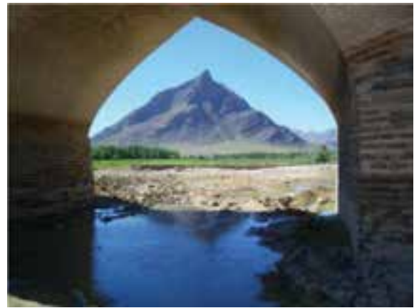
شکل ۳-۵- کوه لجور شازند