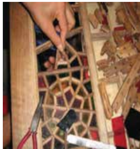
شکل ۴۵-۵- مشبک کاری