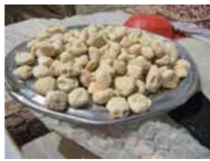
شکل ۳۰-۵- کشک روستایی