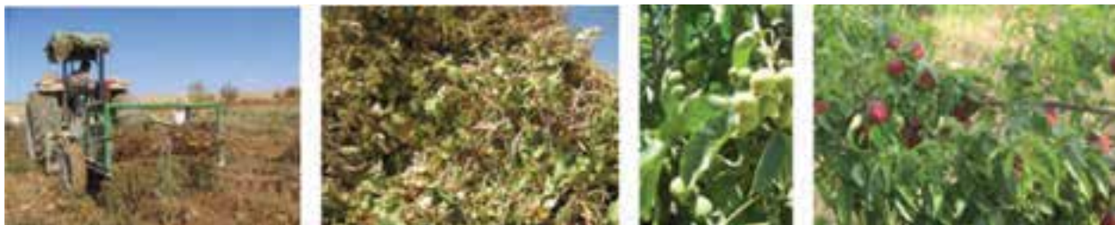
شکل ۳۴-۵- محصولات کشاورزی (گردو، لوبیا، سیب زمینی و شلیل)

استان مرکزی در سال ۱۳۸۸ در تولید گندم رتبه سیزدهم کشور، انار رتبه سوم، گل‌های زینتی رتبه دوم، لوبیا رتبه سوم، جو آبی رتبه پنجم و انگور رتبه نهم را به خود اختصاص داده است. مهم‌ترین محصولات کشاورزی استان عبارت‌اند از: گندم و جو در شهرستان‌های اراک، فراهان، خنداب، شازند، کمیجان، زرنديه و ساوه؛ انار، طالبی، خربزه و پسته در ساوه و زرنديه؛ لوبیا در خمین، گل‌های زینتی در محلات، انگور در اراک و شازند؛ هلو، گیلان، گوجه فرنگی و خیار در خنداب؛ چغندر قند در شازند و خمین و سیب زمینی در فراهان.