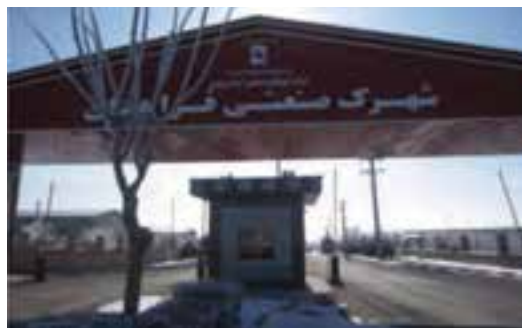
شکل ۴۳-۵- شهرک صنعتی فراهان