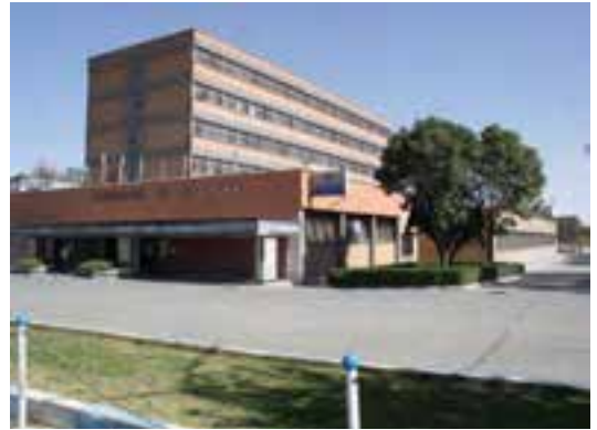
شکل ۳۵-۵- ماشین سازی اراک