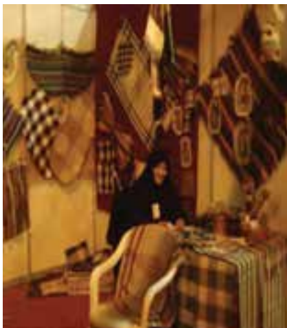
شکل ۴۶-۵- جاجیم بافی

استان مرکزی از گذشته در زمینه صنایع دستی فعال و مشهور بوده است. صنعت قالی‌بافی، به‌ویژه فرش ساروق از شهرت جهانی برخوردار است. از دیگر صنایع استان می‌توان به گلیم برجسته، مسگری، قلم‌زنی روی مس، طراحی، نقشه‌کشی فرش، رنگری، رفوگری، جاجیم بافی، هنر صنایع چوبی، منبت کاری، معرق، خراطی، نازک کاری، گیوه‌بافی، سفالگری، صنایع فلزی، تذهیب، مجسمه و گل سازی اشاره کرد.