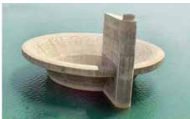
شکل ۹-۵- سد ۱۵ خرداد دلیجان

۵- دریاچه سد پانزده خرداد : این سد در ۵ کیلومتری شهر دلیجان قرار دارد. در این دریاچه امکانات مناسبی برای توسعه اسکی روی آب و ماهی گیری و... فراهم آمده است.