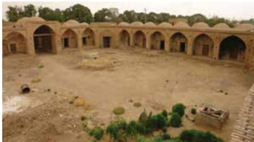
شکل ۲۲-۵- کاروانسرای دودهک

۶- کاروانسرای دودهک: این کاروانسرا در مسیر جاده دودهک به دهستان خورمه در فاصله ۲۰۰ متری سمت راست بزرگراه قم به دلیجان قرار دارد. رودخانه قمرود از جنوب غربی این کاروانسرا می‌گذرد و پل تاریخی دودهک روی این رودخانه ساخته شده است. پل و کاروانسرا از یادگارهای دوره صفویه هستند و در مسیر تاریخی جاده ابریشم احداث شده‌اند.