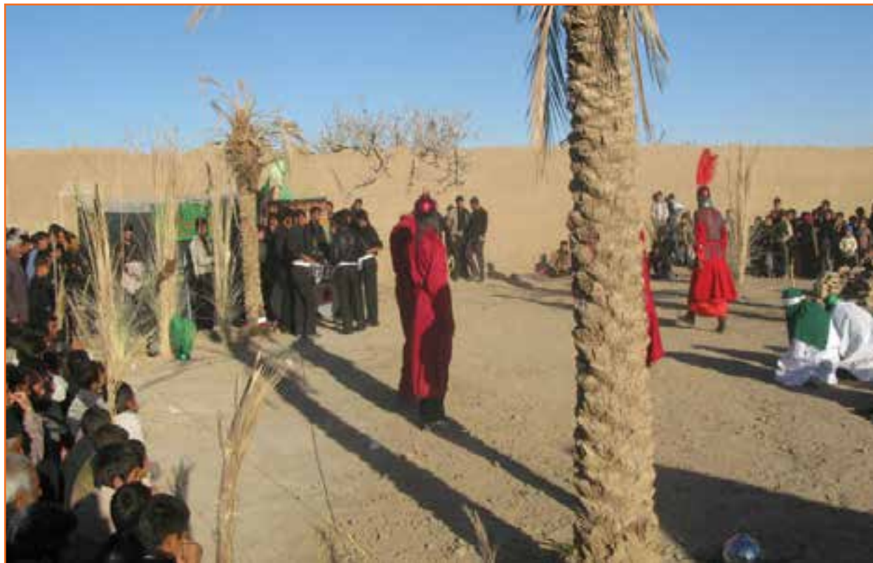
فیصل آباد مراسم تمیزه خوانی در کشتکوتیه