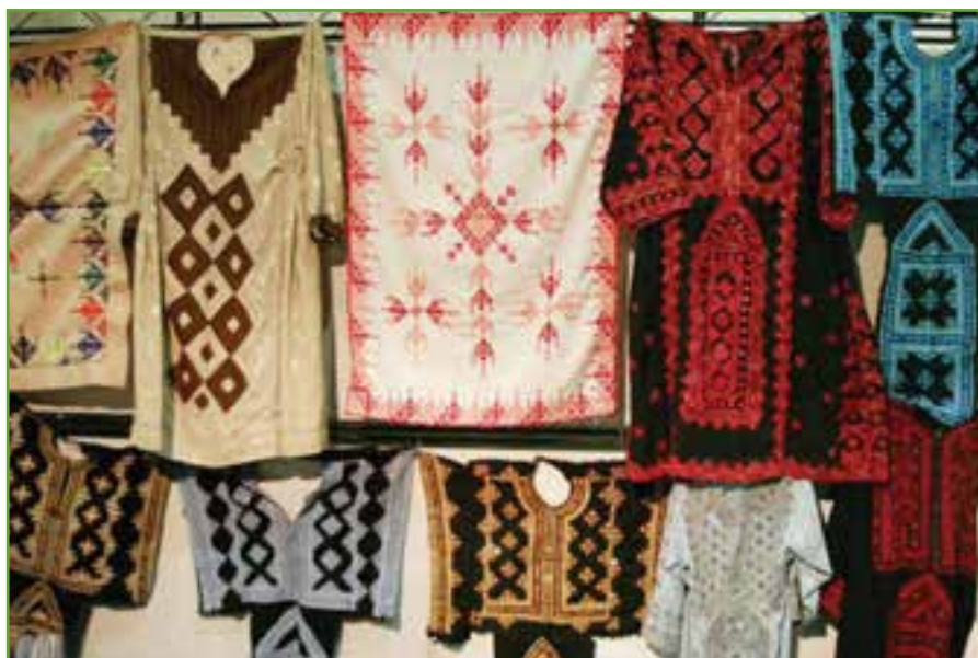
شکل ۸-۳- پوشش زنان عشایر بلوچ کرمان

در جامعه شهری کرمان، به دلیل غلبه زندگی شهری و نفوذ رسانه‌ها مردم از نظر پوشش، تقریباً یکسان می‌پوشند. اما در جامعه عشایری این تفاوت‌ها هنوز به چشم می‌آید. زنان ایل آسیاب‌بر، لباس گشاد تا سر زانو و روسری به نام «شیلک» دارند که با سکه تزئین شده است. مردان شلوار گشاد و مشکی و پیراهن سفید می‌پوشند.