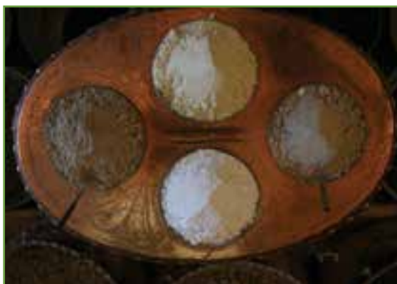
شکل ۶-۳ انواع قوتو

قوه تو: قوه تو، نوعی خوراکی خوشمزه و مقوی و به شکل پودر است که در لهجه محلی به آن قوتو می گویند. آن را از آسیاب گیاهان مفیدی درست می کنند. کرمانی ها از قوتو برای پذیرایی از مهمان، به خصوص مراسم تولد نوزاد استفاده می کنند. انواع قوتو شامل قهوه ای، نخودچی، پسته ای، نارگیلی وجود دارد که همه آنها خوشمزه و مقوی اند.