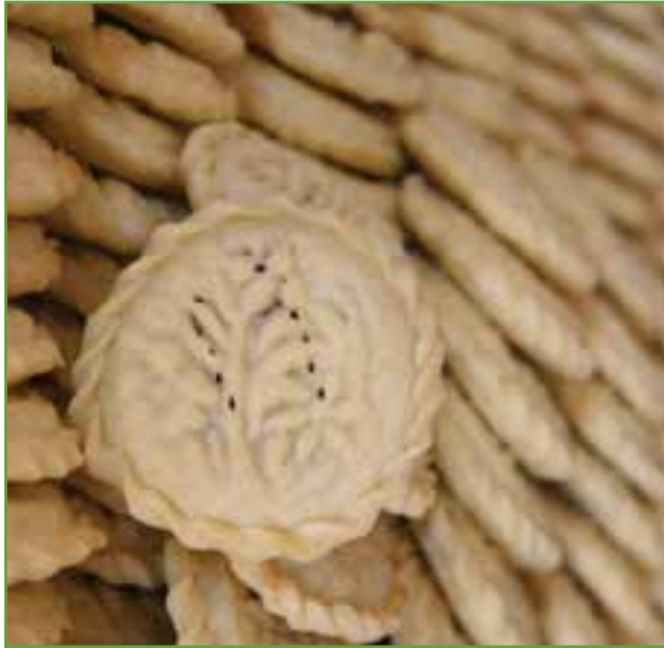
شکل ۷-۳-۳ کلمپه گرمانی

کلمپه: از جمله شیرینی‌های رایج در کرمان، کلمپه است که آن را از ترکیب خرما، آرد و روغن درست می‌کنند. در سال‌های اخیر، انواع تازه‌تری از آنکه با گردو و زعفران درست می‌شود باب شده است. در برخی موارد نیز از روغن محلی در طبخ آن استفاده می‌شود، که برخی این نوع را بیشتر می‌پسندند. مصرف کلمپه علاوه بر اینکه در کرمان رواج زیادی دارد؛ از این شیرینی به عنوان یک سوغات خوب استقبال می‌شود.