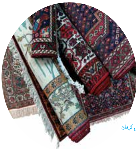
شکل ۳-۴ قالی کرمان

قالی بافی: کرمان پشم بسیار مرغوبی برای قالی بافی دارد. و قالی کرمان از قدیم به عنوان نفیس‌ترین و ظریف‌ترین قالی ایران و دنیا شهرت دارد. شهرت قالی کرمان به دلیل تلفیق جذاب طرح و رنگ است و یکی از زیباترین و خوش‌سبک‌ترین بافته‌های جهان، قالی راور است.