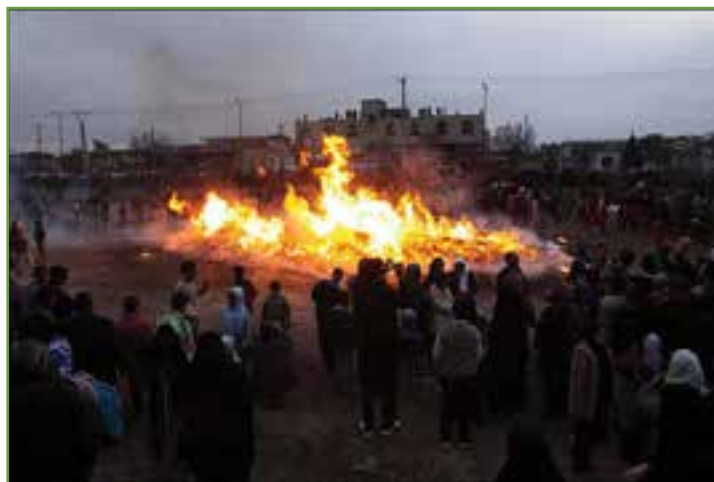
شکل ۱۰ مراسم جشن سده در کرمان

جشن سده از قدیمی‌ترین جشن‌های ایرانیان است که هنوز برگزاری آن در میان مردم کرمان به ویژه زرتشتی‌ها رایج و طرفداران زیادی دارد.