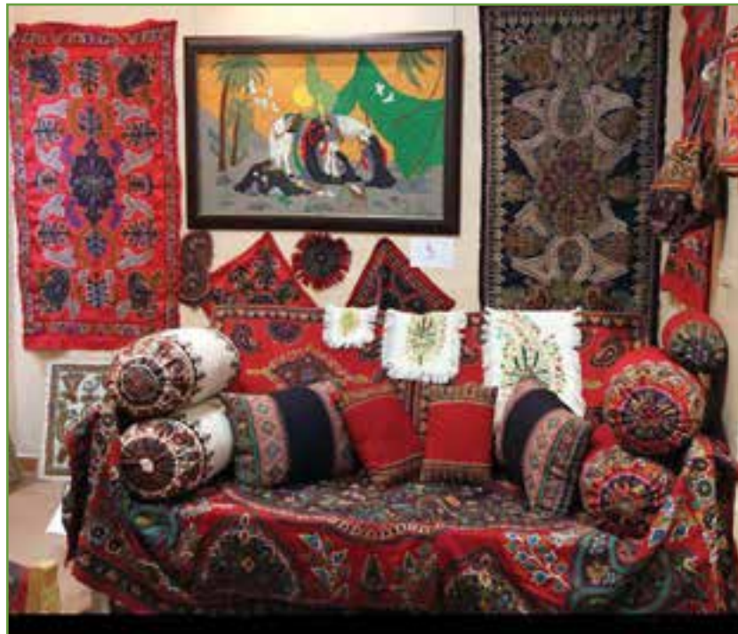
شکل ۳-۳ پته دوزی هنر دستی زنان کرمان

پته، گلیم، مشبک، مُعَرَّق و مُنَبَّت چوب، طراحی سنتی، طراحی گلیم، طراحی قالی، تذهیب، مینیاتور، مس تزئینی، مجسمه‌سازی، عروسک‌ها و لباس‌های محلی، آیینه‌دوزی، سکه‌دوزی و چاقو‌سازی از جمله صنایع دستی استان کرمان است. پته دوزی: پته از جمله صنایع دستی زنانه دوزی است که با نخ‌های رنگی، روی پارچه مخصوصی که به آن عریض می‌گویند، دوخته می‌شود. پته در رنگ‌های سفید، سبز و قرمز و ... عرضه می‌شود و هر چه دوخت پته ریزتر و ظریف‌تر باشد، مرغوب‌تر است. پته کرمان که از نظر زیبایی و چشم‌نوازی شهرت دارد برای رومیزی، سجاده، پرده و ... مورد استفاده قرار می‌گیرد.