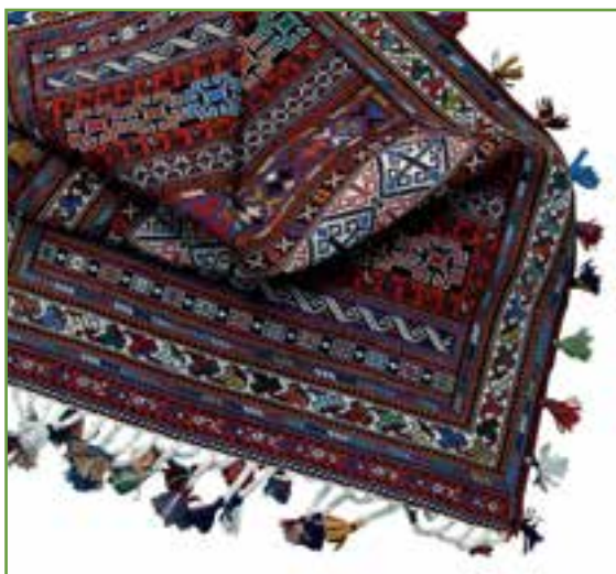
شکل ۵-۳ گلیم شریکی پیچ

در این نوع بافته، در پرز گلیم مخفی می شود. گره متن یا آبدوزی نیز به مدد بافت می رود و نقش و نگاری از هنر می آفریند. عشایر این منطقه موقع بافت این نوع گلیم، گل هایی چون کشمیری، گلدانی، موسی خانی، سماوری، درختی و حشمتی خلق می کنند که نمونه آن را تنها در گلزار هنر کرمان زمین باید جست و جو کرد.