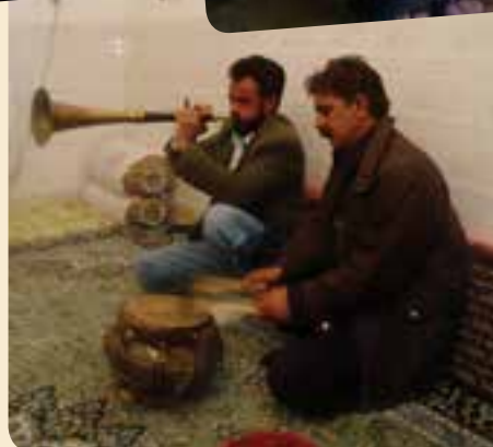
شکل ۲-۳ نمونه‌ای از سازهای کوبه‌ای و بادی محلی کرمان