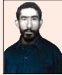
شهید نوراله یزدانپناه (لوداب)