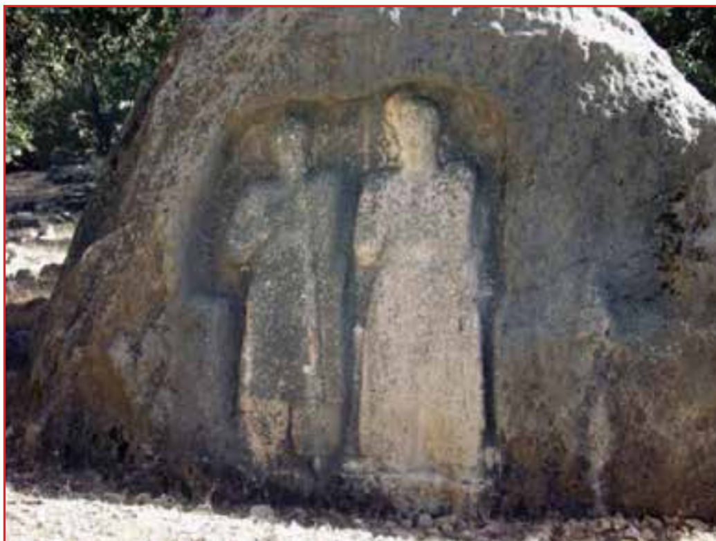
شکل ۴-۴- نقوش برجسته سروک