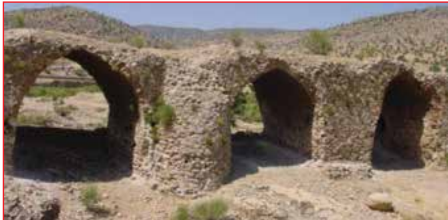
شکل ۲-۴- پل قدیمی پاتاوه از دورهٔ هخامنشیان

با آمدن پارس‌ها به این نواحی و قدرت گرفتن شاهان اولیهٔ هخامنشی، این منطقه خاستگاه تمدن هخامنشی نیز به حساب می‌آید. امپراتوری هخامنشی دارای ۲۳ استان (ساتراپ) بود که ساتراپ پارس یکی از آنها به شمار می‌رفته است. کهگیلویه و بویراحمد بخشی از ساتراپ پارس بوده است. پایه‌های پل هخامنشی در کنار شهر پاتاوه و پایهٔ پل هخامنشی تخت شاه نشین و حماسهٔ ملی آریو برزن این موضوع را تأیید می‌کند.