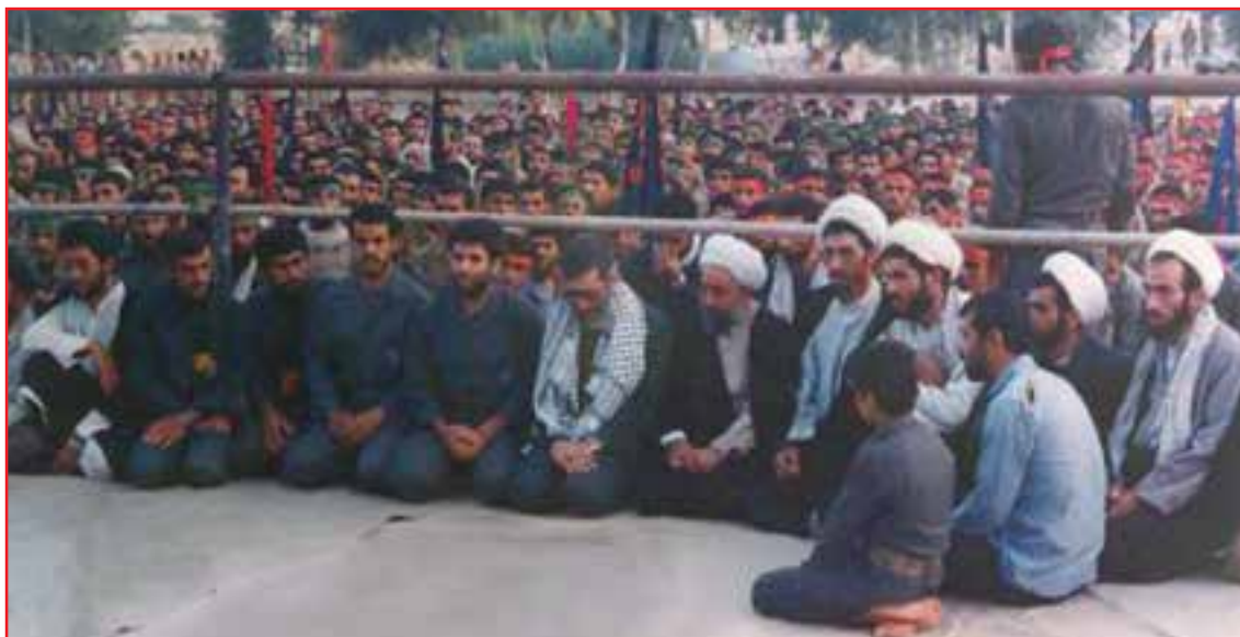
شکل ۸-۴- حضور رهبر معظم انقلاب در بین رزمندگان استان

تعداد شهدای استان: از افتخارات این استان در دفاع مقدس کسب مقام اول در اعزام نیرو از نظر جمعیت به جبهه‌های جنگ و اهداء ۱۸۰۰ شهید، ۳۳۰۰۰ رزمنده، ۱۳۰۰۰ جانباز، ۳۱۰ نفر آزاده، که ۲۷۰ نفر از شهدا پاسدار، ۳۰۰ نفر سرباز و بقیه بسیجی بوده‌اند.