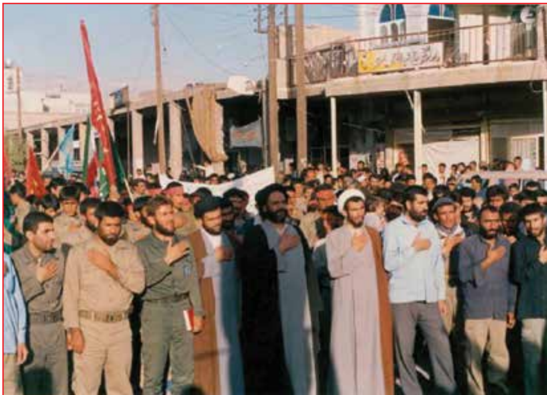
شکل ۶-۴- اعزام نیرو به جبهه‌های نبرد حق علیه باطل

استان ما به دلیل موقعیت جغرافیایی خود در طول تاریخ به سبب راه ارتباطی شمال و جنوب و موقعیت سوق الجیشی آن همچنین استعداد توان رزمی و نظامی (روحیه سلحشوری) مردم آن در حراست از میهن و مقابله با متجاوزان مورد توجه بوده است، اما پررنگ‌ترین جلوه پاسداری مربوط به دوران هشت سال دفاع مقدس است.