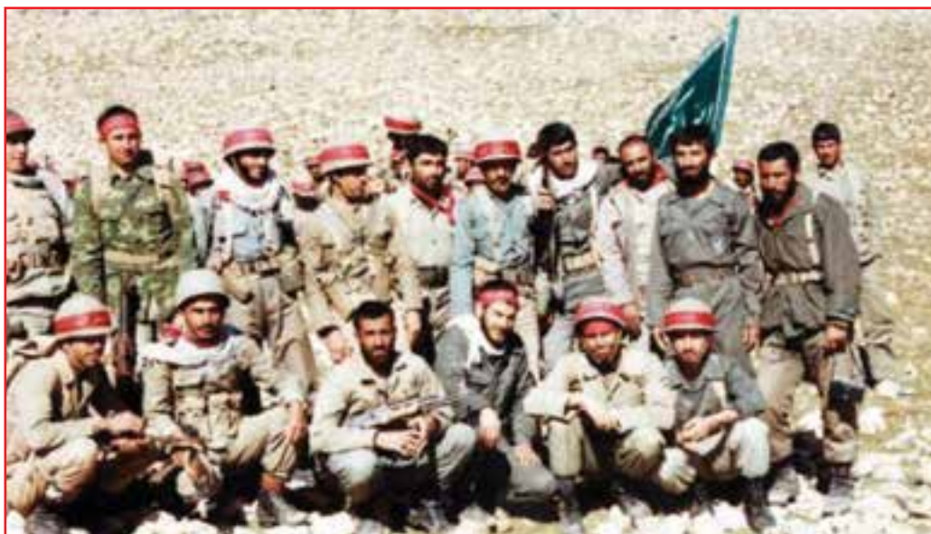
شکل ۷-۴- جمعی از رزمندگان استان

شرحی مختصر درباره حماسه و نقش استان در حماسه پد خندق: غیور مردان استان ما به طور مداوم همراه و همدوش سایر استان‌ها در مناطق جنگی در عملیات‌های متعددی شرکت نمودند، اما اوج حماسه این دلاور مردان گمنام در واپسین روزهای جنگ در پد خندق اتفاق افتاد. این حادثه تاریخی را جوانانی خلق کردند که در عملیات‌های مختلف افتخارات بی‌شماری نصیب اسلام و ایران نموده و در فاو تحسین جهانیان را برانگیختند و در کربلای ۴ و ۵ جزء نیروهای فاتح و نیز بیشترین موقعیت‌ها را در کردستان ایجاد کردند.