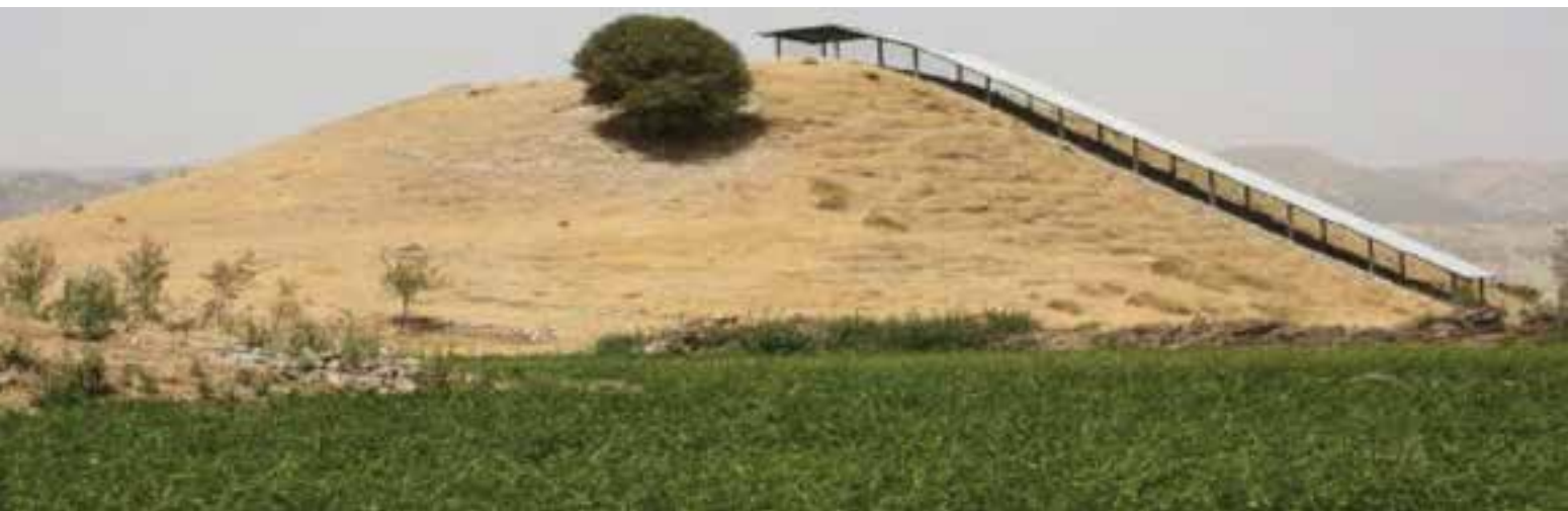
شکل ۱-۴- تل خسرو یاسوج

اهمیت استان کهگیلویه و بویراحمد محدود به آثار به جای مانده از دوران تاریخی نیست. بلکه با مطالعات باستان‌شناسی انجام گرفته در این استان، قدمت آن به دوران پارینه سنگی می‌رسد. دسترسی شکارگر در دوره‌های پارینه سنگی به منابع کوهستان و دشت از دلایل انتخاب این منطقه برای استقرار در این سرزمین بوده است. شرایط مساعد زیست محیطی در دشت‌های استان همچون دشت‌های دهدشت، کلاچو، سمغون و حاشیه رود مارون در شکل‌گیری استقرارهای آغازین دوره نوسنگی در این استان نقش اساسی داشته است. مهم‌ترین محوطه‌های شناسایی شده در استان از دوره نوسنگی عبارت‌اند از تل بردی، تپه بی‌بی زلیخایی، تل گل گندم کش، تل کوچک، گپ، تل شوولی. از دوره پیش از تاریخ آثار و شواهد بسیاری وجود دارد که بیشتر به شکل تپه و محوطه که از جمله می‌توان به تل خسرو، تپه ده و ده، محوطه موردراز، تل گهی، تل مهره‌ای، محوطه باغ بند، پناهگاه صخره‌ای دالو، محوطه تل مسجدی، محوطه و قلعه سرپری، تل تویی، اشکفت شلی، تلی صراص، محوطه دلی باسیر، اشکفت بندی و محوطه کف برکه‌ای اشاره کرد. تپه‌های باستانی استان کهگیلویه و بویراحمد با توجه به سفال‌های به‌دست آمده از آنها یک جمله (تپه ده و ده) در شهرستان گچساران قدمتی برابر با هزاره سوم پیش از میلاد مسیح را نشان می‌دهد.