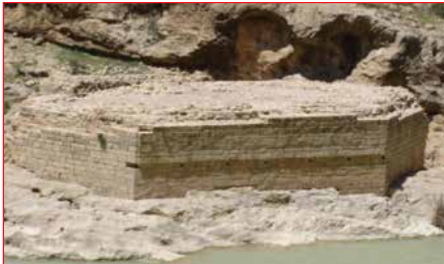
شکل ۳-۴- پایهٔ پل تخت شاه نشین