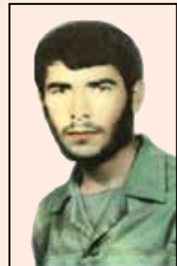
شهید عنایت الله بازگیر (دهدشت)