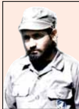
شهید فریبرز بناهی (دهدشت)