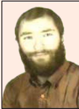
شهید محمدحسین غیب پرور (دهدشت)