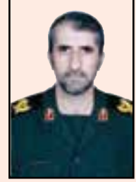
شهید گودرز نجفی (دنا)