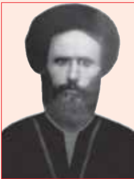
شکل ۱۷-۴- مرحوم آقا میرعلی صفدر تقوی

الف) مرحوم آقا میرعلی صفدر تقوی : در سال ۱۲۹۴-۱۲۹۳ در کهگیلویه متولد شد. پس از فوت پدرش (میرمحمد جعفر) مدتی در حوزه های علمی کازرون و شیراز به تحصیل علم پرداخت. سپس عازم نجف شد. ایشان در مدت تحصیل در حوزه علمی نجف با فقهای مشهوری همچون مرحوم آیت الله العظمی سید محمدکاظم یزدی صاحب عروة الوثقی و مرحوم آیت الله العظمی سید ابوالحسن اصفهانی صاحب وسیله النجات مراد و مکاتبات داشته است که از مقام علمی ایشان حکایت می کند. بعد از بازگشت به کهگیلویه، مقام ممتاز علمی و تقوای وی باعث شد اعتماد عمومی مردم را به دست آورد. از وی سروده هایی با مضامین دینی و سیاسی به جا مانده است. وی سرانجام در ۱۵ صفر ۱۳۵۷ ه. ق مطابق با ۲۷ فروردین ۱۳۱۷ در سن ۶۳ سالگی در شهر سوق به رحمت خدا پیوست.