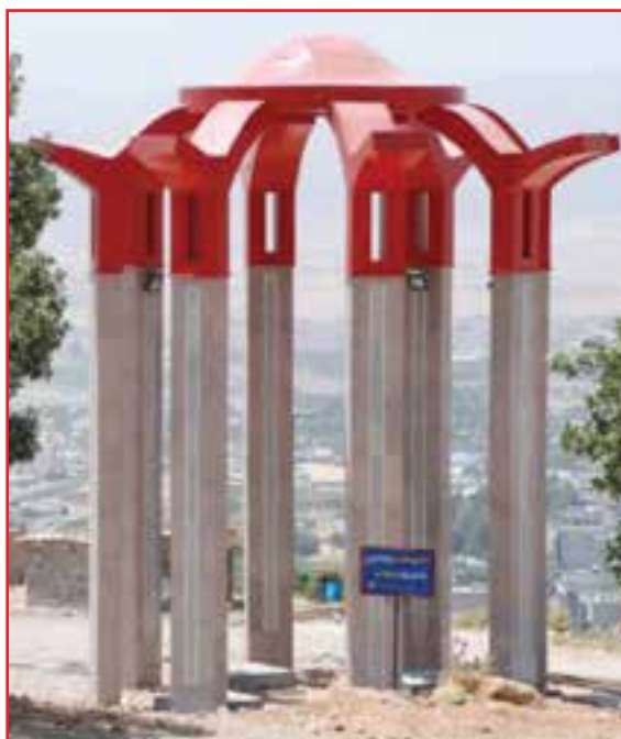
شکل ۹-۴- یادمان شهدای گمنام

تعداد شهدای استان: از افتخارات این استان در دفاع مقدس کسب مقام اول در اعزام نیرو از نظر جمعیت به جبهه‌های جنگ و اهداء ۱۸۰۰ شهید، ۳۳۰۰۰ رزمنده، ۱۳۰۰۰ جانباز، ۳۱۰ نفر آزاده، که ۲۷۰ نفر از شهدا پاسدار، ۳۰۰ نفر سرباز و بقیه بسیجی بوده‌اند.