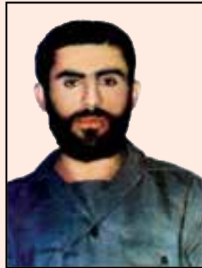
شهید جهان نصیری (گچساران)