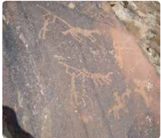
شکل ۱-۴- نقش سنگ نگاره‌های کوه ارنان

قبرهای خورشیدی در ارتفاعات کوه‌های بوهروک و نواحی جنوب غربی یزد که مربوط به دوران خورشید پرستی است و مربوط به سه تا شش هزار سال پیش است، نمونه‌های دیگری است. زراعت و مدنیت یزد، از مناطق مهریز و فهرج، یزد، رستاق، مید، اردکان و ابرکوه شروع شد اما کشاورزی در مهریز، فهرج و یزد در ابتدا وابسته به آب‌های سطحی ولی بعداً به دلیل کمبود ریزش‌های جوی و در کنار آن گرم شدن هوا مانند دیگر مناطق وابسته به آب‌های زیرزمینی، قنات (کاریز) شد.