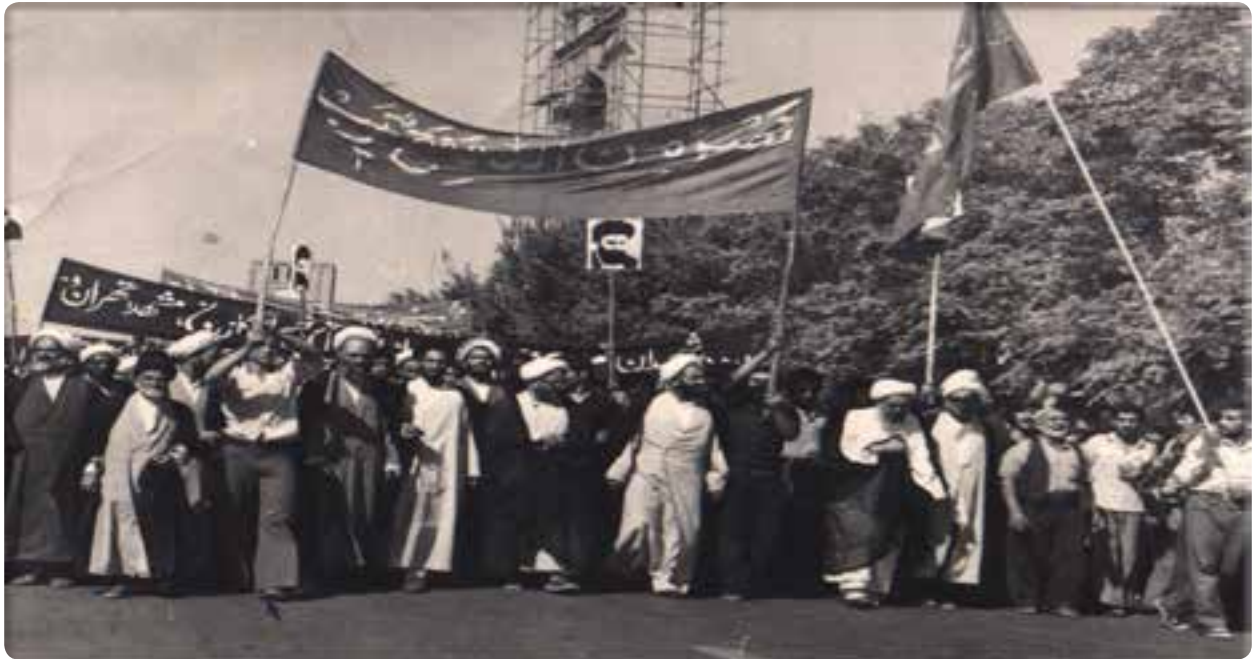
شکل ۳-۴- راهپیمایی مردم یزد علیه حکومت پهلوی به رهبری آیت الله شهید صدوقی