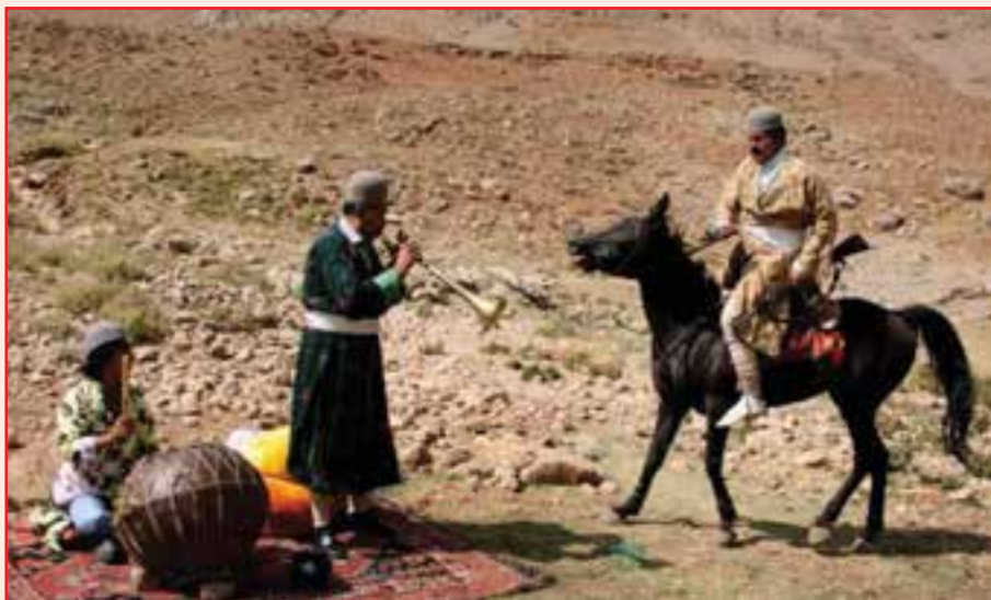
شکل ۳-۴- لباس محلی مردان بویراحمد

کلاه: کلاه مردان این دیار به شکل کاسه و سفت و محکم و از جنس پشم گوسفند بوده است.