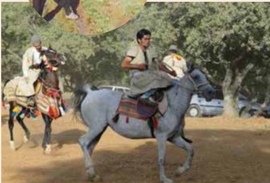
شکل ۳-۳- نمونه‌هایی از بازی‌های محلی

بازی به عنوان یک عامل فرهنگی برای مبارزه با خصلت‌های ناپسند انسانی است و در برابر مفاسد اجتماعی و عادات مضرّ برای نوجوانان نقش بازدارنده دارد. دین اسلام افسردگی، تبلی، خمودگی و کم کاری را از عادات زشت برشمرده است.