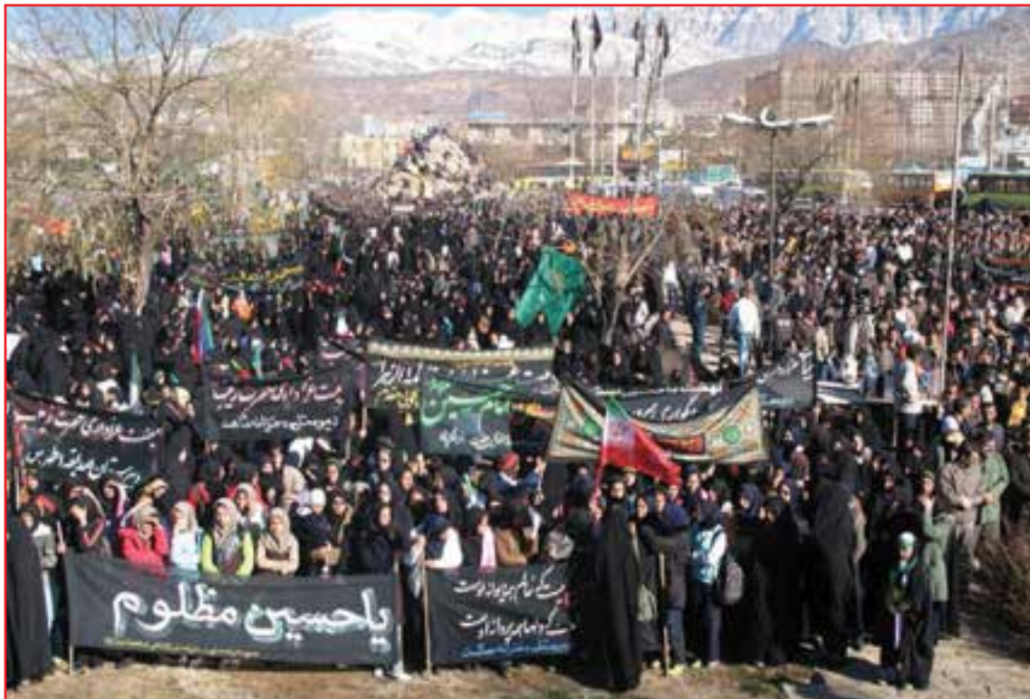
شکل ۵-۳- مراسم عاشورای حسینی

به هر حال رفتار دینی مردم استان در گرامی داشت اعیاد اسلامی، عزاداری سالار شهیدان(ع) تکیه اساسی بر حرمت ویژه روزهای وفات ائمه، نامگذاری فرزندان خود به نام بزرگان دین و ائمه اطهار (ع) همه نشانگر عمق تعصب و ارادت خاص این مردم به اسلام و شعائر و آئین‌ها و دستورات آن است.