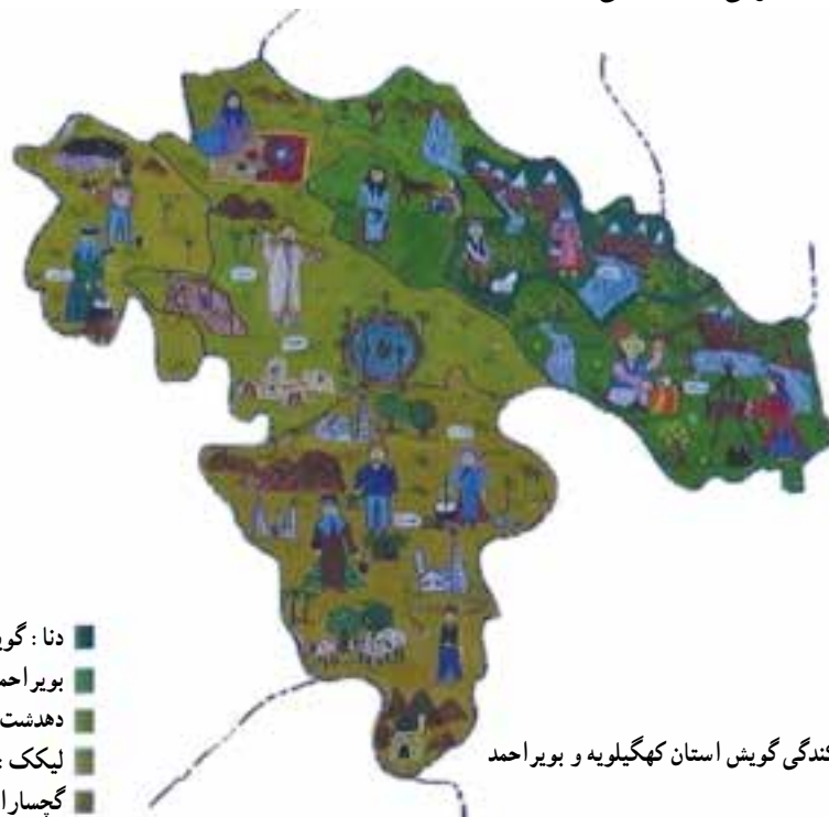
شکل ۱-۳- نقشه پراکندگی گویش استان کهگیلویه و بویراحمد

اولین گروه ساکن در منطقه کهگیلویه و بویراحمد عیلامیانی بودند که زبانشان انزانی بود. اما با تسلط اقوام آریایی پارسی در این منطقه، پارسی قدیم زبان رسمی آن شد. در دوره ساسانی زبان پهلوی رایج شد و با گذشت چندین هزار سال، هنوز مردم این استان به زبان قدیم پارسی پهلوی وفادار مانده و به گویش لری تکلم می‌کنند. البته درصد اندکی از مردم استان که عموماً هم در شهرستان گچساران ساکن‌اند به زبان ترکی صحبت می‌کنند.