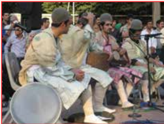
شکل ۶-۳- موسیقی محلی