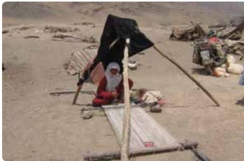
شکل ۶-۲- عشایر منطقه دستگردان طبس

ب) زندگی روستایی : در سال ۱۳۸۵ کمتر از ۲۰/۱ درصد از جمعیت استان در روستاها زندگی می‌کردند که اغلب به فعالیت‌های زراعی، باغداری، دامداری یا صنایع دستی مشغول بودند. از نظر پراکندگی جغرافیایی اکثر این سکونتگاه‌ها در نواحی مرکزی، غرب و جنوب غربی استان به دلیل وجود نواحی پایکوهی، مخروط افکنه‌ها و دشت‌های حاصلخیز استقرار یافته‌اند. نقش شیرکوه و دره‌های آن از نظر آب و هوا و ملایمت شرایط جوی حائز اهمیت است. عوامل انسانی نظیر راه‌های ارتباطی، حمل و نقل مناسب نیز در پراکندگی جمعیت مؤثر است. ج) زندگی کوچ نشینی : در استان یزد زندگی کوچ نشینی محدودی در مناطقی از جنوب استان مانند شهرستان خاتم و دیده می‌شود. کوچ نشین‌های شهرستان خاتم از استان فارس در بعضی از فصول سال، به این منطقه کوچ می‌کنند.