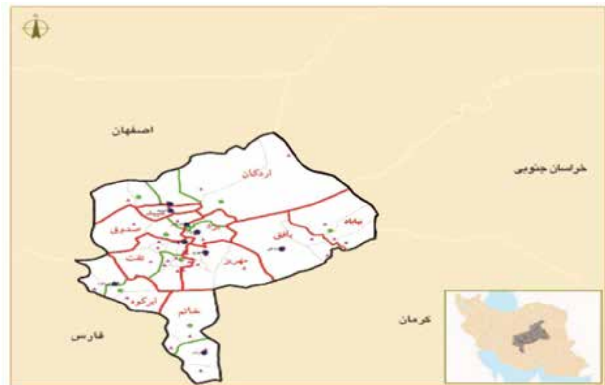
شکل ۱-۲- نقشه تقسیمات سیاسی استان

در اولین دوره قانون گذاری در سال ۱۲۸۵ هجری شمسی پس از نهضت مشروطیت قانون تشکیل ایالات و ولایات به تصویب رسید. در این دوره ایران به چهار ایالت و ۱۲ ولایت تقسیم شد که یزد یکی از ولایات بوده است. در تقسیمات کشوری سال ۱۳۱۶ هجری شمسی ایران به ۱۰ استان تقسیم شد که اصفهان و یزد شامل استان دهم بودند. در سال ۱۳۴۸ یزد به فرمانداری کل و در سال ۱۳۵۲ به استان تبدیل شد. با توجه به شکل ۱-۲ استان یزد در حال حاضر دارای ۱۰ شهرستان، ۲۰ شهر، ۱۸ بخش و ۴۵ دهستان می باشد.