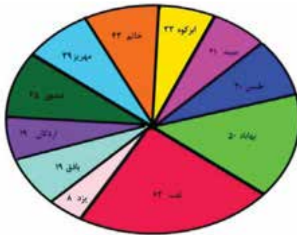
نمودار ۱-۲- جمعیت روستایی شهرستان‌های استان به درصد، سال ۱۳۸۵