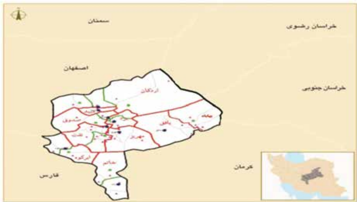
شکل ۴-۲- نقشه پراکندگی شهرها و روستاهای استان

هنری دارای شهرت جهانی بوده و هنوز هم به طور نسبی از کیفیت خوبی برخوردار است. شهر یزد دارای صنایع مدرن و پیشرفته، بیمارستان‌های مجهز و متعدد و نیروی انسانی متعهد و متخصص، دارای سرمایه‌های مادی و معنوی است که ضمن حفظ سنت گذشته این شهر را آباد و توانمند در مسیر توسعه، حفظ می‌کند.