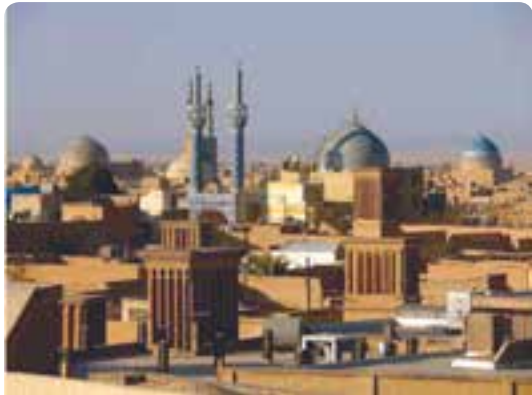
شکل ۲-۳- زندگی شهری

شیوه زندگی مردم هر منطقه تا حدودی تابع شرایط آب و هوایی است و اثر آن را در شهرسازی و معماری می‌توان یافت. قدمت تمدن و آبادی نشینی در این سرزمین از هزاره سوم پیش از میلاد فراتر می‌رود. در کشور ما ایران مردم به سه شیوه شهری - روستایی و کوچ‌نشینی زندگی می‌کنند. در این درس با شیوه‌های زندگی در استان یزد آشنا می‌شوید. الف) زندگی شهری: استقرار جمعیت در استان یزد با توجه به موقعیت ویژه جغرافیایی آن، مبارزه مستمر با بیابان، دشواری‌های طبیعی و همچنین تلاش بی‌امان برای دست‌یابی به آب بوده است و به همین دلیل این استان ضریب شهرنشینی بالاتری نسبت به کل کشور دارد. جمعیت استان یزد بر اساس سرشماری عمومی نفوس و مسکن در سال‌های ۱۳۷۵ و ۱۳۸۵ در جدول ۲-۲ آمده است.