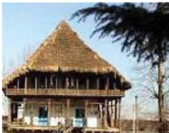
شکل ۴-۲- مسکن روستایی مربوط به زمان گذشته

مسکن روستایی مازندران: مسکن روستایی در مازندران با وجود تشابهات ظاهری، از تنوع زیادی برخوردار است. دلایل این تنوع عبارتند از: شرایط آب و هوایی، وضعیت توپوگرافی، نوع مصالح در دسترس، نوع معیشت و کارکرد اقتصادی خانوار. معمولاً سقف مسکن روستایی با توجه به محیط اطراف آن تعیین می‌شود که با توجه به آب و هوای استان مازندران که مرطوب و بارانی است از نوع شیروانی است.