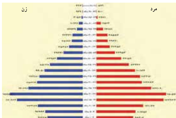
شکل ۲-۹- هرم سنی جمعیت ۱۳۸۵