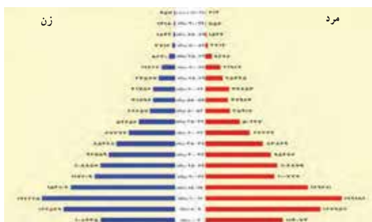
شکل ۲-۸- هرم سنی جمعیت ۱۳۷۵