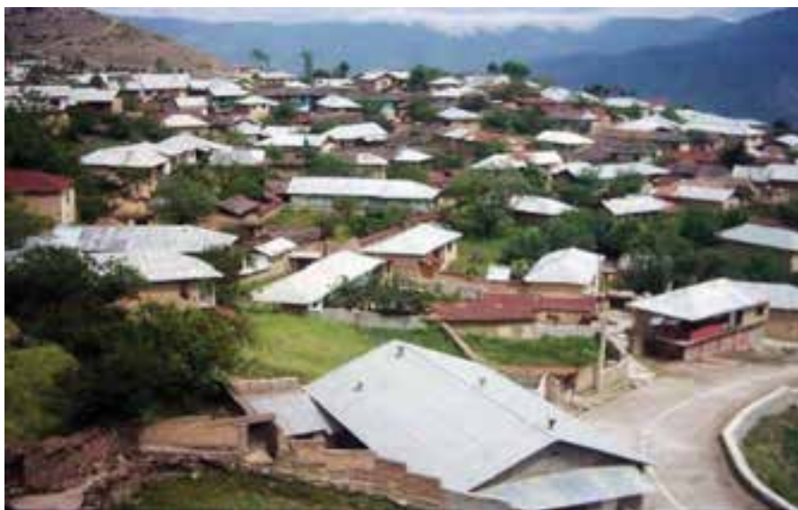
شکل ۲-۳- روستای متمرکز

هر چه از جلگه به سمت دامنه کوه‌ها پیش رویم به دلیل تغییر شیب زمین، تراکم مسکن روستایی افزایش یافته و شکل روستاها نیز از پراکنده به متمرکز تغییر می‌یابد.