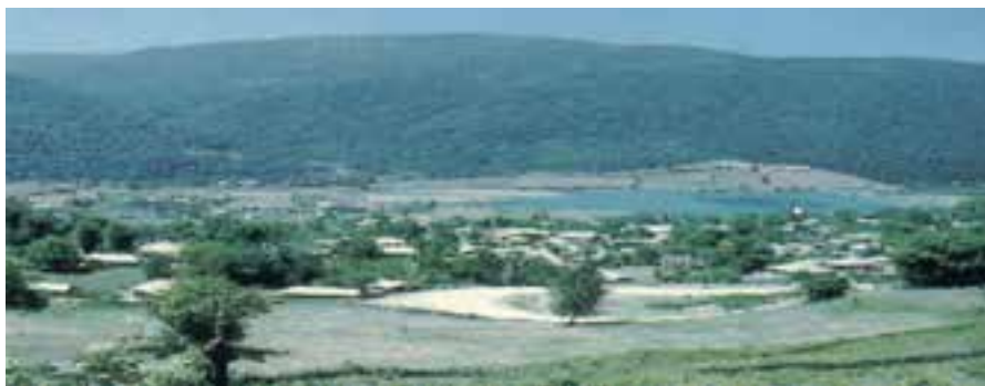
شکل ۲-۲- روستای پراکنده

هر چه از جلگه به سمت دامنه کوه‌ها پیش رویم به دلیل تغییر شیب زمین، تراکم مسکن روستایی افزایش یافته و شکل روستاها نیز از پراکنده به متمرکز تغییر می‌یابد.