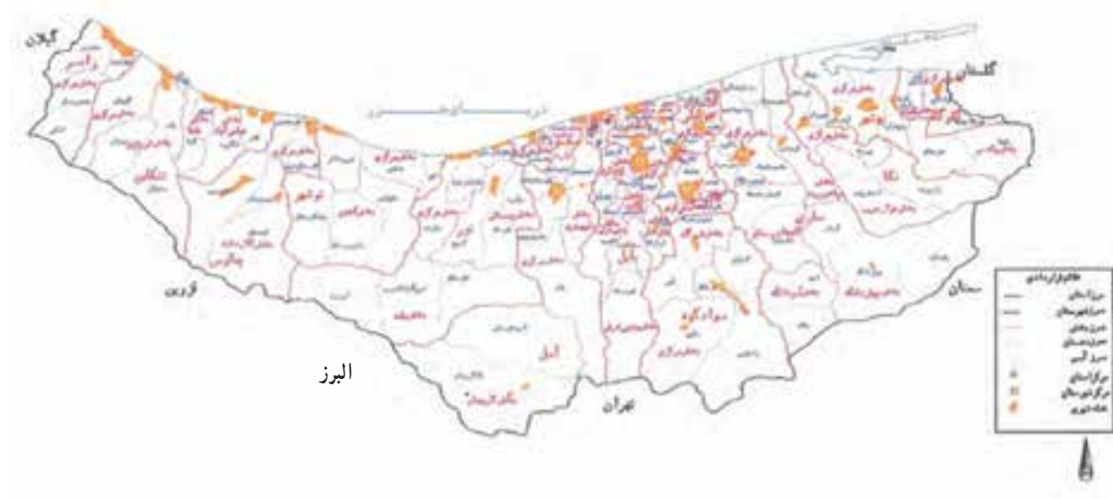
شکل ۲-۱- نقشه تقسیمات سیاسی استان مازندران سال ۱۳۸۷

استان مازندران بر اساس آخرین تقسیمات کشوری دارای ۱۹ شهرستان به نام‌های آمل، بابل، بابلسر، بهشهر، تنکابن، عباس‌آباد، جویبار، چالوس، رامسر، ساری، سوادکوه، قائم‌شهر، گلوگاه، محمودآباد، نکا، نور، نوشهر، فریدونکنار و میاندورود، ۵۲ شهر، ۴۶ بخش و ۱۱۷ دهستان می‌باشد.