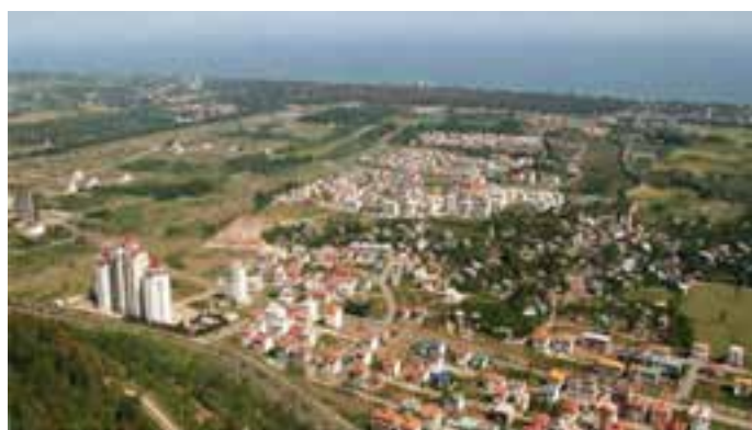
شکل ۶-۲- مسکن شهری

۲- سقف خانه‌های روستایی در استان چگونه است. چرا؟