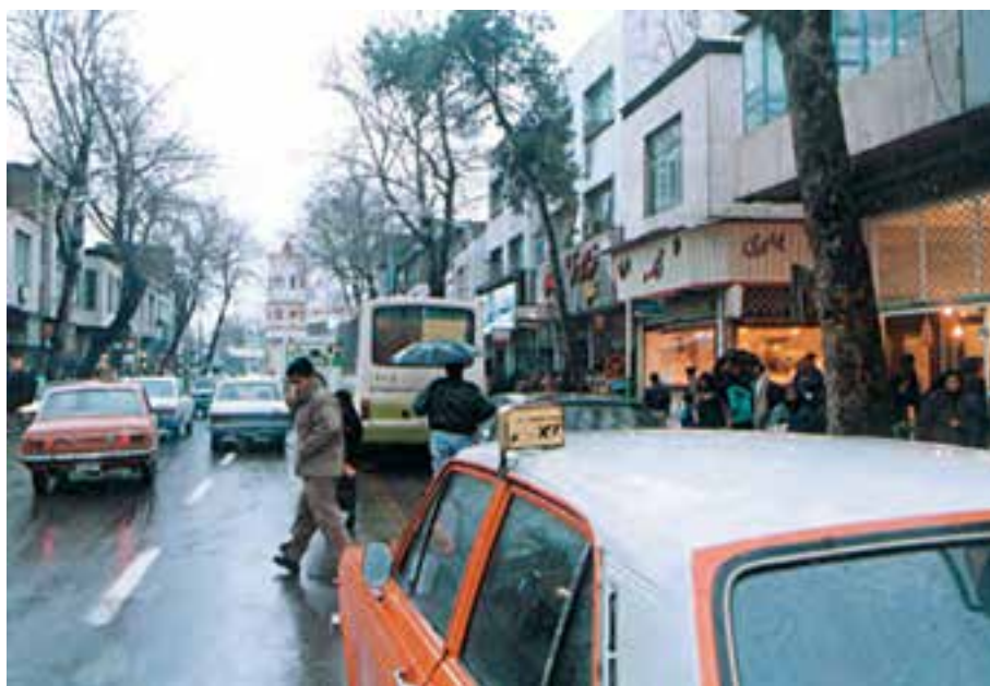
شکل ۱۰-۲- خیابان جمهوری اسلامی شهر ساری

به نظر شما اثرات مثبت و منفی مهاجرت به استان مازندران چیست؟