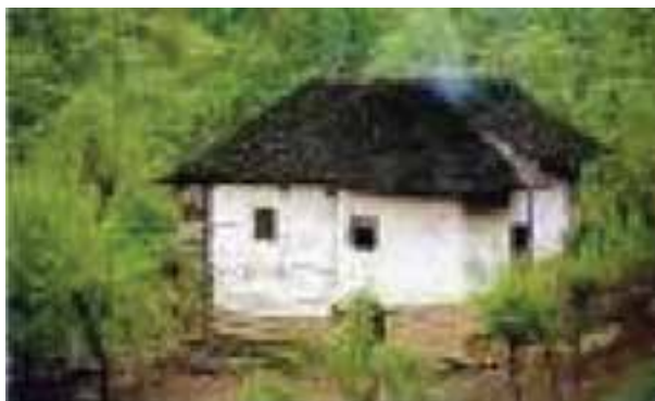
شکل ۵-۲- مسکن روستایی

شکل و نوع ساخت مسکن در روستاهای مازندران در طی دهه‌های اخیر تغییرات زیادی کرده است. مواد و مصالح ساختمانی این خانه‌ها تا حد زیادی به محیط اطراف آن بستگی دارد. به عنوان مثال، اغلب در مناطق کوهستانی و سرد از سنگ و در مناطق جنگلی، از چوب استفاده می‌شود.